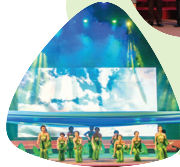
Vươn mắt (Múa - Vietcombank Quảng Trị)