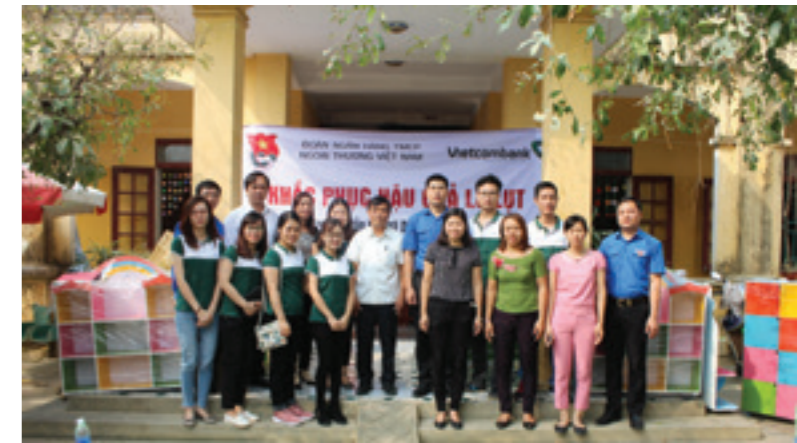
ĐTN Vietcombank chụp ảnh lưu niệm cùng các cô giáo Trường Mầm non Lạc Vân cùng Phó Bí thư Tỉnh Đoàn Ninh Bình và Bí thư Huyện Đoàn Nho Quan