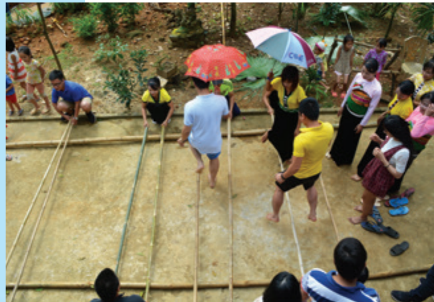
Múa xòe và nhảy sạp với các cô gái dân tộc Thôn Hịch

NĂM 2017, THỰC HIỆN CHẾ ĐỘ NGHỈ DƯỠNG CHO NGƯỜI LAO ĐỘNG TRONG CHI NHÁNH, CÔNG ĐOÀN CƠ SỞ VIETCOMBANK THỦ ĐỨC ĐÃ TỔ CHỨC NHIỀU ĐỢT NGHỈ DƯỠNG CHO NGƯỜI LAO ĐỘNG KẾT HỢP MỞ RỘNG KIẾN THỨC XÃ HỘI, TÌM HIỂU THÊM VỀ ĐẤT NƯỚC, CON NGƯỜI VIỆT NAM.