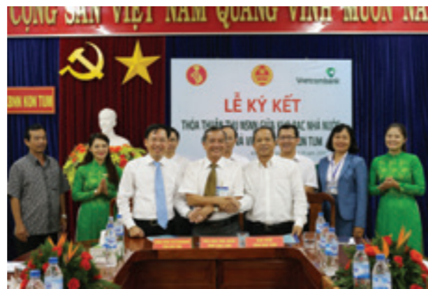
Đại diện các bên tại Lễ ký kết thỏa thuận phối hợp thu NSNN