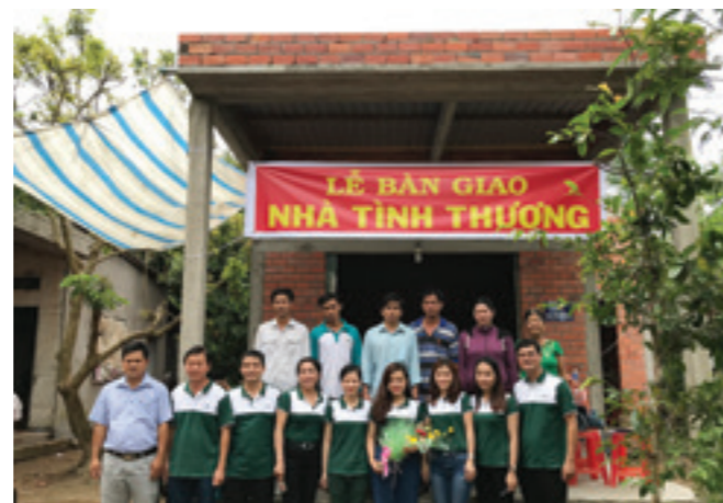
Các thành viên Vietcombank CN TP.HCM chụp hình cùng 06 hộ gia đình nhận Nhà tình thương