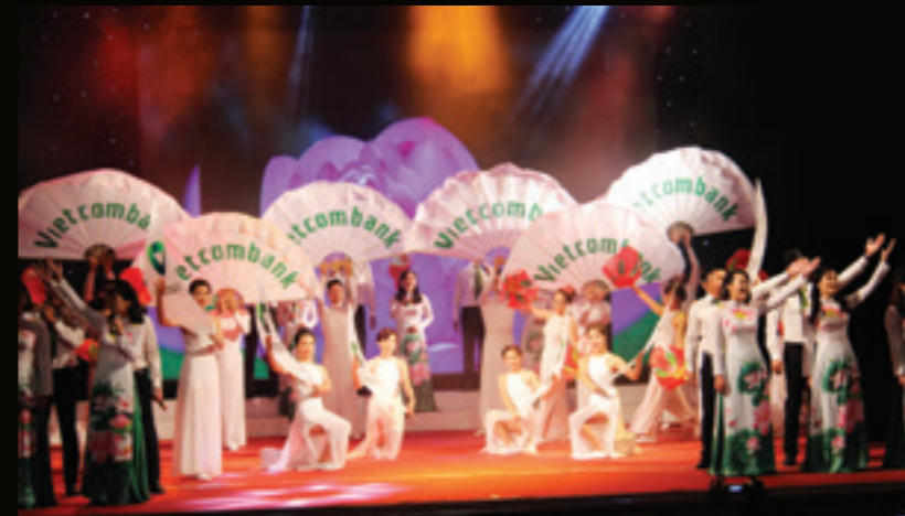
Tiết mục hát múa của CN: Thái Bình, Nam Định, Hà Nam, mở màn cho Hội diễn