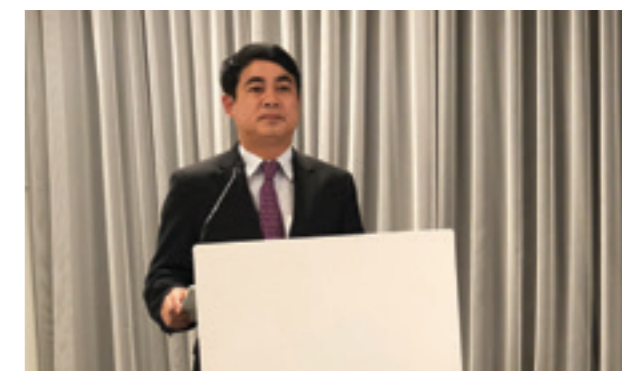
Chủ tịch HĐQT Vietcombank phát biểu tại "Đối thoại Doanh nghiệp Việt Nam - Australia"

Với chuỗi hoạt động ý nghĩa, hiệu quả cùng Đoàn doanh nghiệp tháp tùng Chủ tịch Quốc hội và những cuộc làm việc song phương riêng của Vietcombank với các khách hàng và đối tác, chương trình công tác của đoàn Vietcombank đã thành công tốt đẹp.