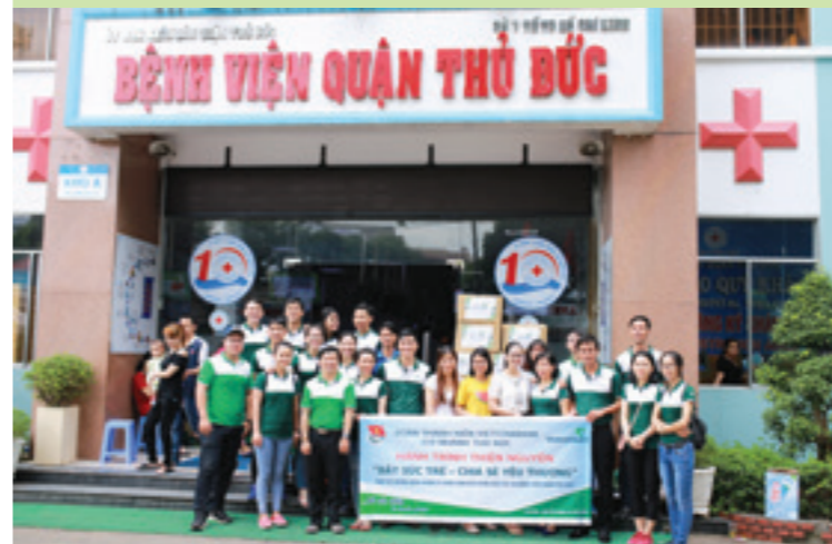
Đại diện Chi đoàn VCB Thủ Đức trao quà cho đại diện bếp ăn từ thiện của bệnh viện.

Hành trình về nguồn của Chi bộ Vietcombank Nam Hà Nội đã đem lại cho các Đảng viên, quần chúng ưu tú thêm hiểu và khâm phục sự hy sinh cống hiến của chiến sĩ và nhân dân vùng “đất thép”, hiểu thêm về lịch sử tìm đường cứu nước của Chủ tịch Hồ Chí Minh để đất nước trọn niềm vui thống nhất. Đó là những bài học vô cùng đáng quý, giáo dục về lòng yêu nước, về tư tưởng chính trị và tính gương mẫu, tiên phong của người đảng viên nhằm củng cố và xây dựng một tập thể đoàn kết, phát triển.