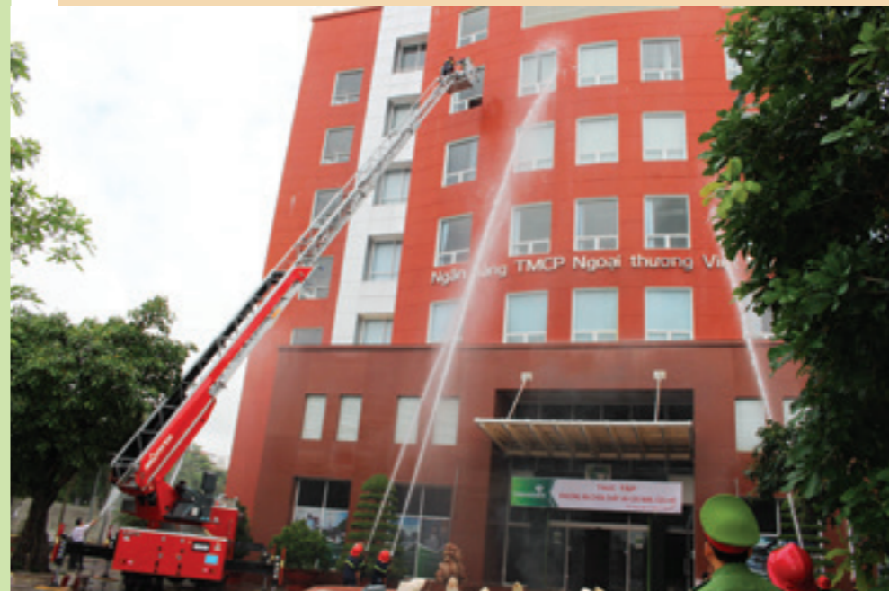
Lực lượng Cảnh sát PCCC và CNCH 114 tham gia chữa cháy và cứu người bị kẹt trên các tầng của tòa nhà trong buổi thực tập.

Có thể nói, với sự đầu tư nghiêm túc và chuẩn bị kỹ lưỡng, các thí sinh đã mang đến Hội thi những phần trình bày đầy ấn tượng với ý tưởng kinh doanh độc đáo, được Ban Giám khảo đánh giá khả thi và có tính thiết thực cao. Hội thi là cầu nối giữa nhà trường với các doanh nghiệp cùng đồng hành trong sự nghiệp trồng người, là cơ hội quảng bá thương hiệu Vietcombank một cách hiệu quả đối với cộng đồng và thế hệ doanh nhân tương lai của đất nước.