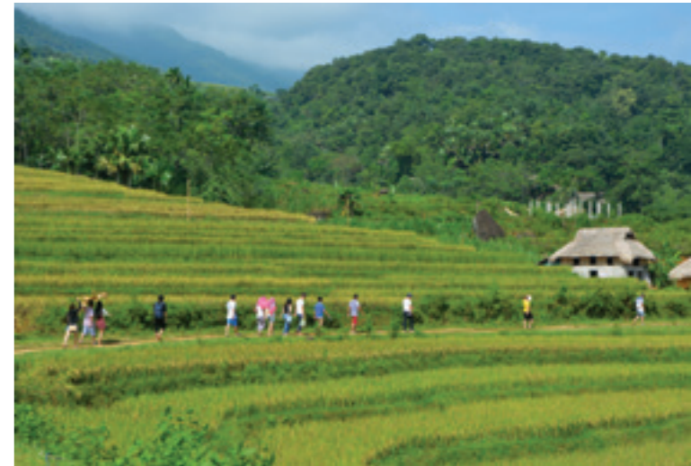
Ruộng bậc thang ở Pù Luông