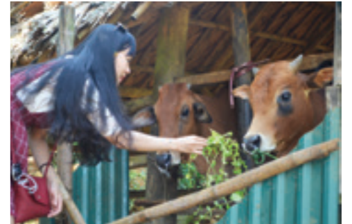
Giúp cho bò ăn