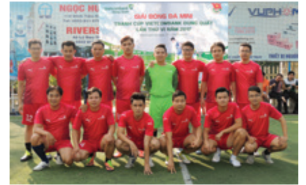
Đội tuyển bóng đá của Vietcombank Dung Quất