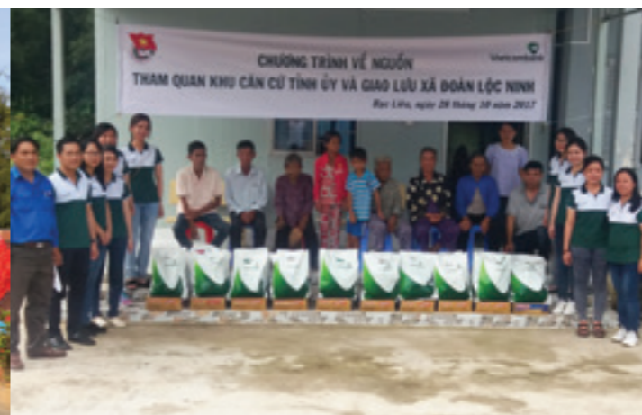
Đảng viên Vietcombank Bắc Giang tham dự hành trình hướng về cội nguồn cách mạng Cao Bằng