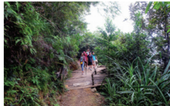
Sạn đạo vào chùa Địa Ngục

Chúng tôi dạo bước cung đường Đất Phong Lan, chạy quanh co bên suối. Ánh đèn pin loang loáng phản chiếu vào những lá dứa ướt thẫm sương đêm, chằng chịt lối đi là những rễ cây cổ thụ, vắn vện, lằn tinh lập lờ ma mị. Chốc chốc lại bắt gặp những phướn bùa được treo trên các thân cây lớn rải rác bên đường. Bùa được làm bằng vải vàng in chữ phạn màu đỏ, vừa để trừ tà ma, cầu bình an, vừa là dấu hiệu giúp lữ khách không lạc đường trong rừng Ma ao Dứa.