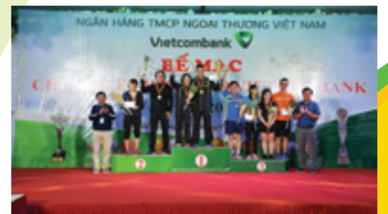
Trao giải Bộ môn Bóng bàn đôi nam nữ