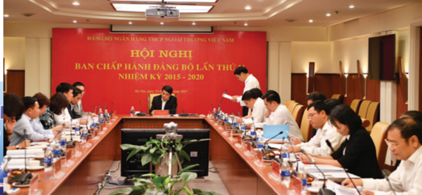
Toàn cảnh Hội nghị Ban Chấp hành Đảng bộ Vietcombank kỳ họp thứ 11 nhiệm kỳ 2015 - 2020