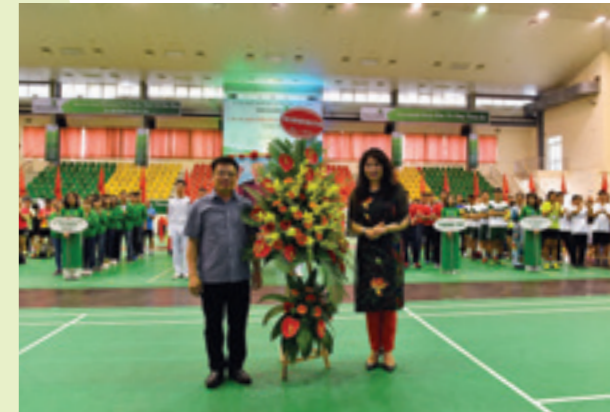
Đại diện Công đoàn Ngân hàng Việt Nam tặng lễ hoa chúc mừng Hội thao

Hội thao toàn hệ thống Vietcombank là sân chơi bổ ích, góp phần nâng cao đời sống tinh thần, thể chất của cán bộ, đoàn viên lao động, qua đó tác động tích cực đến năng suất, chất lượng, hiệu quả trong hoạt động kinh doanh, góp phần hoàn thành xuất sắc nhiệm vụ chính trị, chuyên môn của các đơn vị.