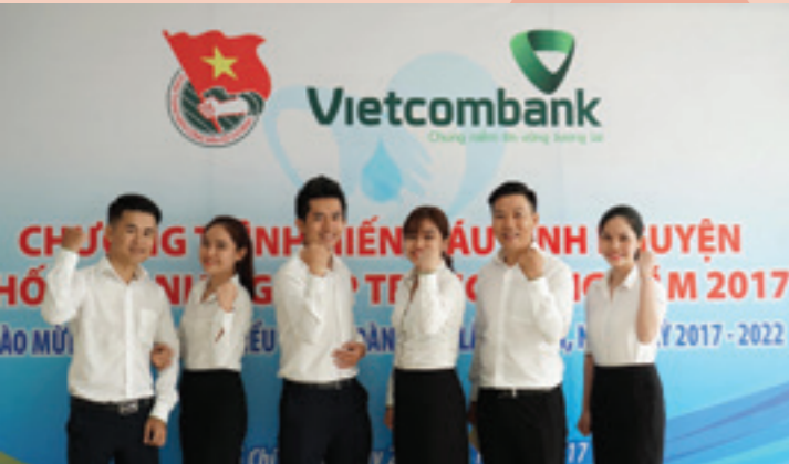
Đoàn viên tại các cơ sở Đoàn trên địa bàn TP. Hồ Chí Minh đăng ký hiến máu tại điểm hiến máu Trụ sở chi nhánh Vietcombank TP. Hồ Chí Minh