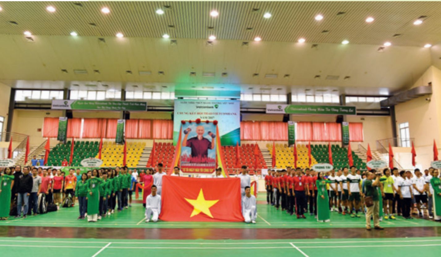
Lễ khai mạc Chung kết Hội thao Vietcombank 2017

HỘI THAO NĂM 2017 LÀ MỘT TRONG CHUỖI SỰ KIỆN LỚN, HƯỚNG TỚI KỶ NIỆM 55 NĂM NGÀY TRUYỀN THỐNG VIETCOMBANK, ĐỒNG THỜI TĂNG CƯỜNG VÀ ĐẨY MẠNH PHONG TRÀO THỂ DỤC THỂ THAO RÈN LUYỆN SỨC KHỎE TRONG ĐOÀN VIÊN VÀ NGƯỜI LAO ĐỘNG TOÀN HỆ THỐNG.