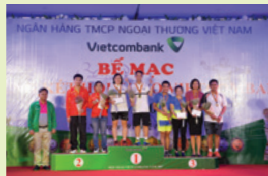
Trao giải Bộ môn Cầu lông đôi nam nữ

Hội thao năm 2017 là một trong chuỗi sự kiện lớn, hướng tới kỷ niệm 55 năm ngày truyền thống Vietcombank, đồng thời tăng cường và đẩy mạnh phong trào thể dục thể thao rèn luyện sức khỏe trong đoàn viên và người lao động Vietcombank. Chủ tịch Công đoàn Vietcombank cũng bày tỏ hy vọng dư âm của Hội thao Vietcombank năm 2017 sẽ còn đọng mãi và tạo đà, khích lệ cho toàn thể cán bộ, viên chức, người lao động trong toàn hệ thống quyết tâm phấn đấu hoàn thành xuất sắc nhiệm vụ chính trị và kế hoạch kinh doanh năm 2017 và các năm tiếp theo.