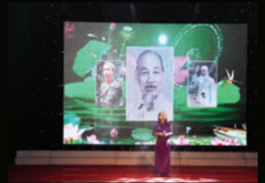
Tiết mục biểu diễn đơn ca của Vietcombank Ninh Bình