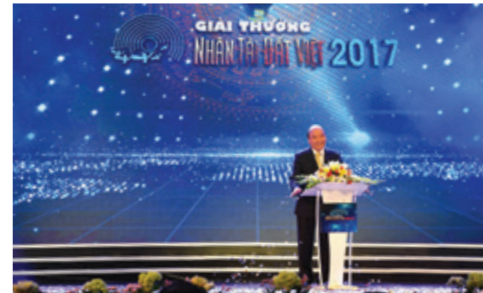
Thủ tướng Chính phủ Nguyễn Xuân Phúc phát biểu tại Lễ trao giải Nhân tài Đất Việt 2017

Trong thư của Chủ tịch nước Trần Đại Quang có đoạn: “Chúc Giải thưởng NTĐV 2017 thành công tốt đẹp và tiếp tục phát hiện, tôn vinh trí tuệ Việt Nam, đóng góp xứng đáng vào vườn ươm tài năng đất Việt, góp phần xây dựng đất nước ta ngày càng giàu mạnh, phát triển bền vững, sánh vai cùng các quốc gia tiên tiến trên thế giới như Bác Hồ kính yêu hằng mong muốn”.