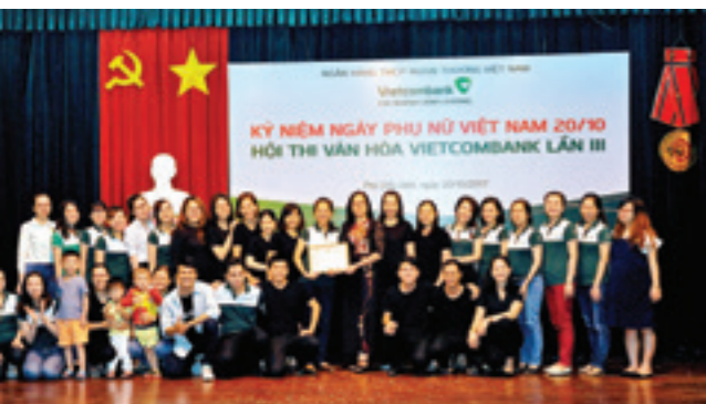
Đội đạt giải Nhất của Hội thi (phòng Dịch vụ khách hàng - tiết mục “VCB chung niềm tin, vững tương lai”)

Đây cũng là một trong những hoạt động thiết thực nhằm nâng cao đời sống tinh thần cho đội ngũ cán bộ, đoàn viên và người lao động Vietcombank Bình Dương.