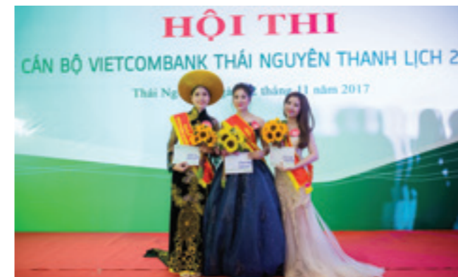
Top 3 thí sinh nhận giải thưởng cao nhất của cuộc thi

N gày 12/11/2017, Công đoàn cơ sở Vietcombank Thái Nguyên đã tổ chức thành công Vòng chung kết cuộc thi “Cán bộ Vietcombank thanh lịch năm 2017” cho các đoàn viên công đoàn.