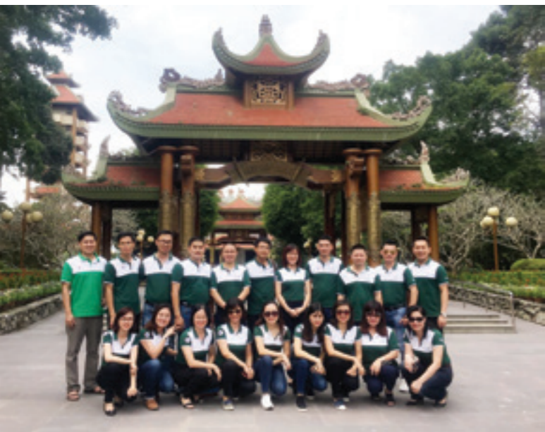
Chi bộ cơ sở Vietcombank Nam Hà Nội thăm và dâng hương tại đền Bến Dược.