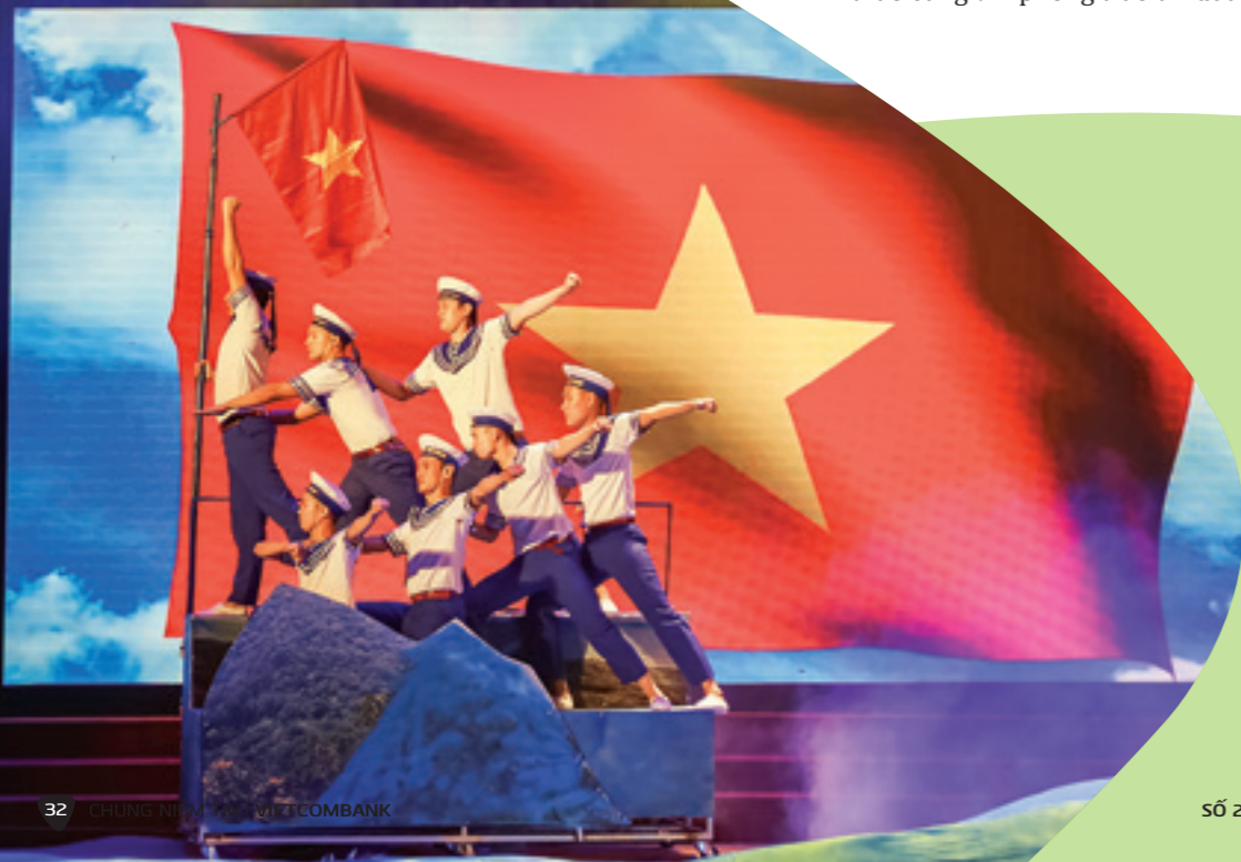
Tổ quốc trong tim (Múa - Vietcombank Thanh Hóa)