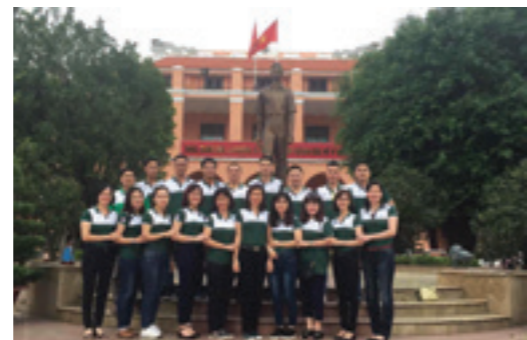
Chi bộ cơ sở Vietcombank Nam Hà Nội thăm quan bến cảng Nhà Rồng

Rời mảnh đất Củ Chi, Đoàn di chuyển đến tham quan Bến cảng Nhà Rồng - nơi mà vào ngày 05/6/1911, người thanh niên yêu nước Nguyễn Tất Thành đã lên con tàu Amiral Latouche Tréville (Pháp), bắt đầu cuộc hành trình tìm đường cứu nước. Hơn một thế kỷ đã trôi qua, có quá nhiều sự đổi thay nhưng Bến Nhà Rồng vẫn còn đó như một minh chứng lịch sử cho cuộc trường chinh cứu nước của vị lãnh tụ kính yêu của dân tộc ta - Chủ tịch Hồ Chí Minh.