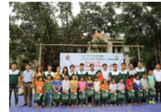
Đoàn thanh niên Vietcombank Hoàng Mai trao quà cho các em trường tiểu học Thạch Lâm 1

100 suất quà gồm: 5 chiếc xe đạp cho các học sinh đặc biệt khó khăn tại Trường Tiểu học Thạch Lâm 1, 15 suất quà (500.000/suất và 5 triệu đồng tiền mặt cho quỹ khuyến học của trường); và 82 suất cho các hộ gia đình bị thiệt hại nặng nề do lũ tại xã Thạch Lâm trong tháng 10 vừa qua (gồm 10 hộ gia đình có hoàn cảnh khó khăn mỗi hộ 1 triệu đồng, 72 hộ còn lại mỗi hộ 400.000đ).