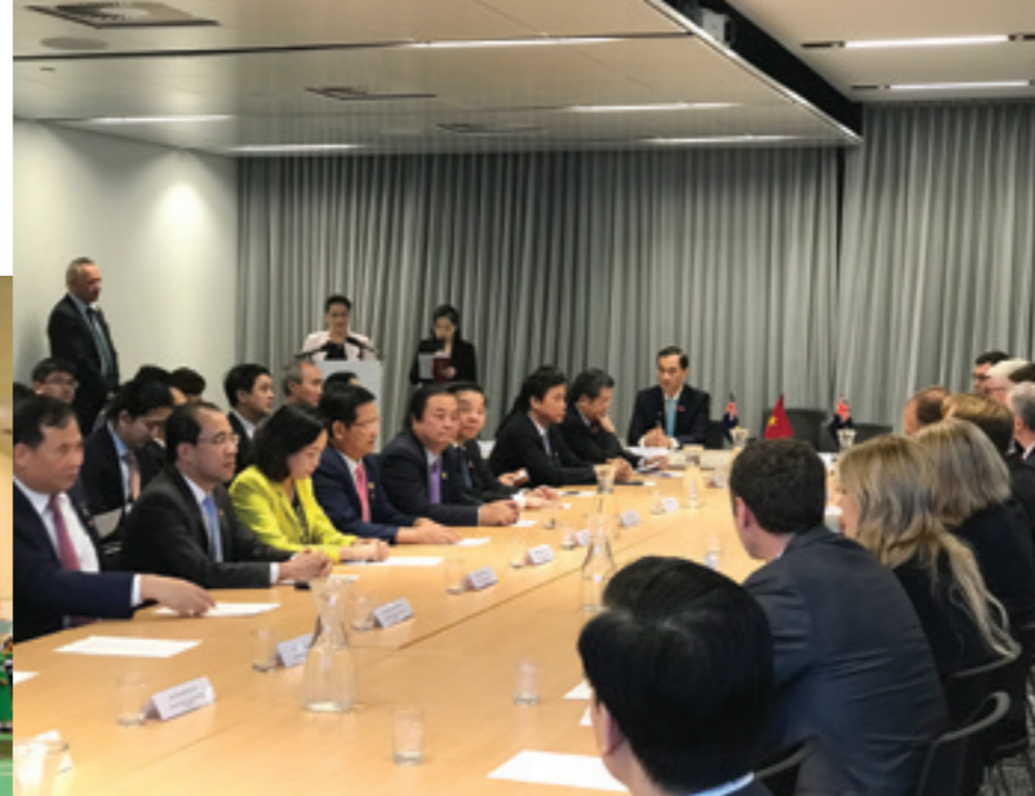
Chủ tịch Quốc hội Nguyễn Thị Kim Ngân phát biểu tại "Đối thoại Doanh nghiệp Việt Nam - Australia"