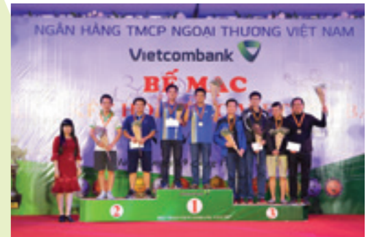
Trao giải Bộ môn Bóng bàn đôi nam

Danh sách chi tiết các VĐV đoạt giải, vui lòng truy cập website: www.vietcombank.com.vn