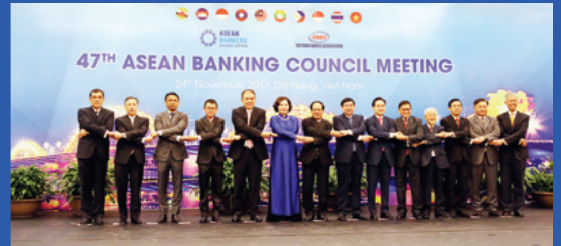
Các vị khách quý và lãnh đạo các đoàn tham dự ABA 47

Theo đó, hội nhập tài chính được hướng dẫn bởi Khuôn khổ Hội nhập Ngân hàng ASEAN (ABIF) và đối với tài chính bao trùm là Khuôn khổ Tài chính Bao trùm ASEAN. Tài chính toàn diện số được coi là tiền đề quan trọng cho sự phát triển này. Nhận thấy được cả lợi ích và