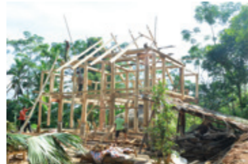
Dựng nhà sàn ở Thôn Dền