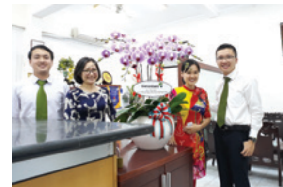
Vietcombank Thủ Đức tặng hoa trường ĐH Ngân Hàng TP. HCM nhân ngày Nhà giáo Việt Nam 20/11