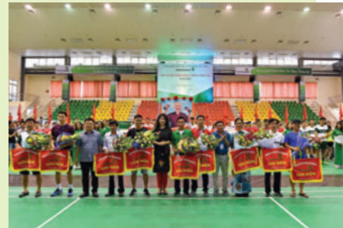
Lãnh đạo Vietcombank và Lãnh đạo Công đoàn NHNN Việt Nam tặng cờ lưu niệm cho Ban tổ chức Hội thao