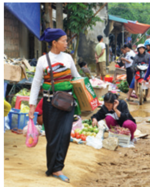
Tìm hiểu chợ phiên Phố Đoàn

T háng 10 vừa qua, nhiều CBNV thuộc các phòng trong CN đã được tổ chức đi nghỉ dưỡng vào các ngày cuối tuần tại Pù Luông, huyện Bá Thước, tỉnh Thanh Hóa. Thành viên trong các đoàn đã được tìm hiểu về nếp sống, sinh hoạt của người dân thuộc dân tộc Thái đen, Thái trắng, Mường ở vùng mạn ngược. Xin giới thiệu với bạn đọc những hình ảnh về thiên nhiên, con người và cuộc sống nơi đây.