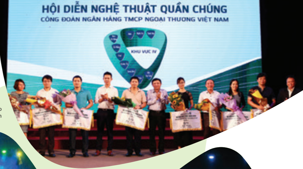
Ban tổ chức Hội diễn trao cờ lưu niệm cho các đoàn

Trong những năm qua, bên cạnh việc không ngừng đẩy mạnh hoạt động kinh doanh, nâng cao chất lượng quản trị, chuẩn hoá các hoạt động ngân hàng theo tiêu chuẩn quốc tế, Ban lãnh đạo, BCH Công đoàn Vietcombank nói chung và các CN khu vực 4 nói riêng luôn quan tâm đến việc nâng cao đời sống tinh thần cho CBNV, coi đây là yếu tố hết sức quan trọng. Đẩy mạnh phong trào văn hoá văn nghệ thể thao cùng với phong trào thi đua lao động