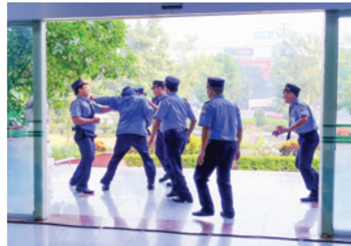
Lực lượng bảo vệ tiến hành vây bắt và vô hiệu hóa đối tượng tình nghi

Đ/c Đỗ Tiến Sỹ - Ủy viên BCH, Bí thư Tỉnh ủy đã ghi nhận và đánh giá cao những đóng góp của Vietcombank trong công tác ASXH, góp phần đào tạo và nâng cao chất lượng nguồn nhân lực tỉnh nhà. Được biết, Vietcombank Hưng Yên là đơn vị duy nhất trên địa bàn tài trợ cho “Ngày hội Đại đoàn kết toàn dân” của thôn Chế Chì.