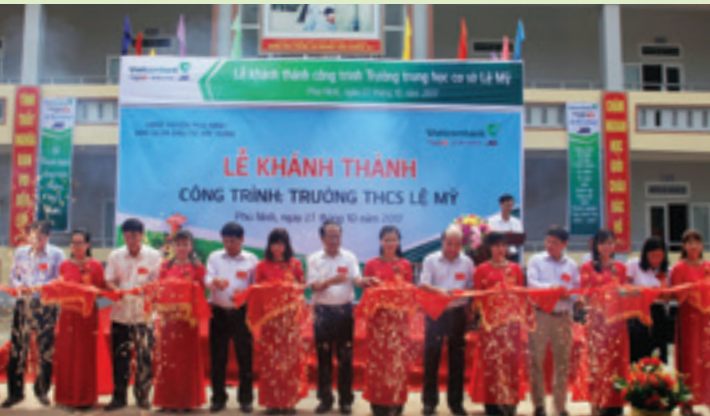
Nghi thức cắt băng khánh thành trường THCS Lê Mỹ.