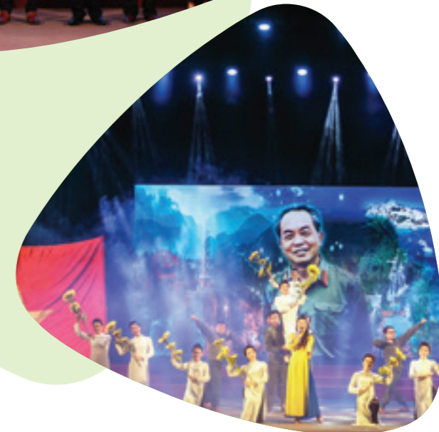
Hát về quê hương Đại tướng (Hát múa - Vietcombank Quảng Bình)