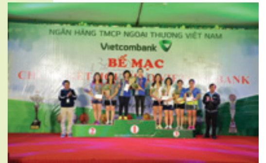
Trao giải Bộ môn Bóng bàn đôi nữ