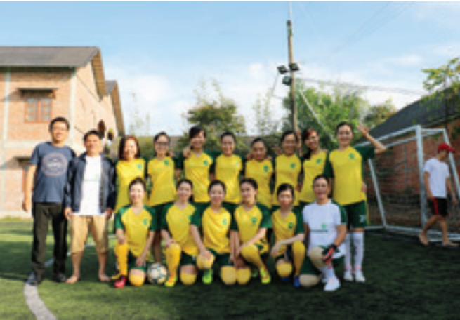
Giải bóng đá nữ chào mừng ngày Phụ nữ Việt Nam khởi thi đua 15 của Vietcombank chi nhánh Phú Quốc