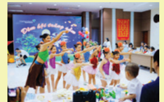
Các cháu múa tập thể, tham gia hát “Bố là tất cả”