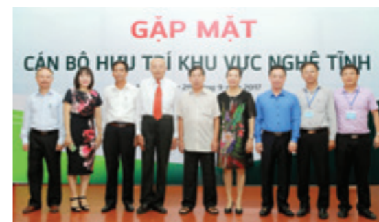
Đại diện Ban Giám đốc CN Nghệ An, CN Hà Tĩnh, CN Bắc Hà Tĩnh và CN Vinh chụp ảnh lưu niệm cùng Ban liên lạc hội hưu trí khu vực Nghệ An và Hà Tĩnh

Nhân Ngày Quốc tế Người cao tuổi, ngày 01/10/2017, tại TP. Vinh, Vietcombank Nghệ An vui mừng và vinh dự được đón tiếp 18 cán bộ hưu trí hiện đang sinh sống tại Nghệ An và Hà Tĩnh.