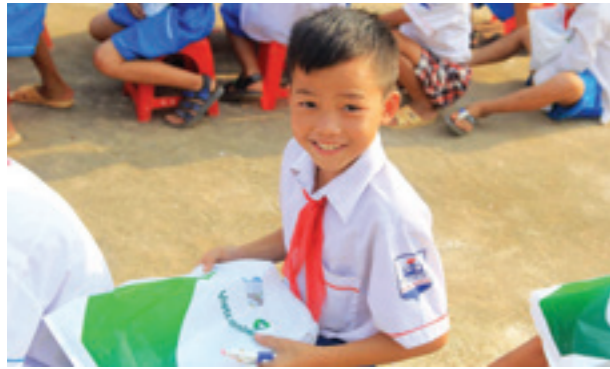
Niềm vui của các em học sinh khi đón nhận các phần quà hỗ trợ của Vietcombank