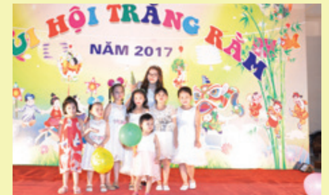
Các cháu thiếu nhi vui phá cỗ cùng Chị Hằng.

Tối ngày 01/10/2017, Đoàn cơ sở Vietcombank Thái Nguyên kết hợp với Đoàn Thanh niên Viễn thông Thái Nguyên tổ chức chương trình “Đêm hội Trăng Rằm năm 2017” cho hơn 100 cháu thiếu nhi là con của CBNV hai đơn vị.