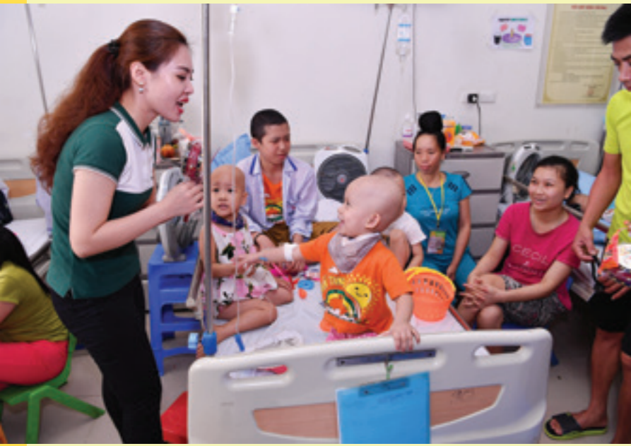
Đoàn viên TN Vietcombank TSC trao tặng quà Trung Thu cho các bệnh nhân nhi