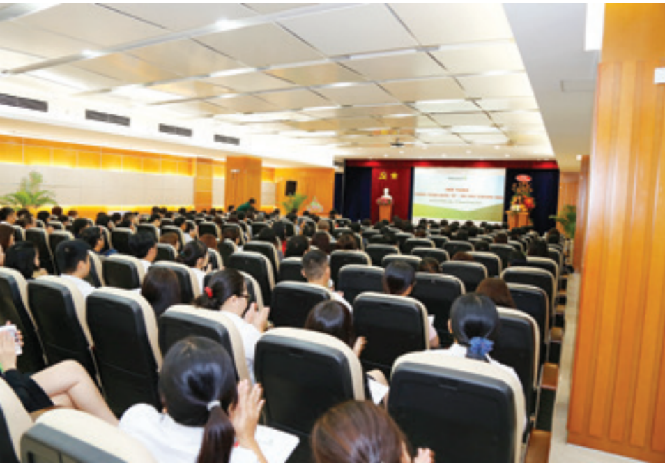
Toàn cảnh Hội thảo