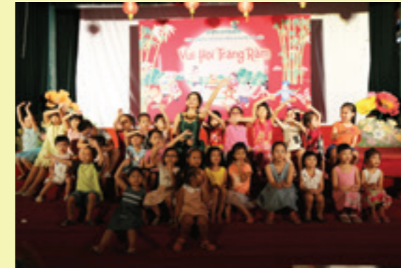
Cảm xúc đạt dào với “nhật ký của mẹ” là món quà các em tặng đến ba mẹ

S áng ngày 01/10/2017, CBCS Vietcombank Hoàng Mai kết hợp cùng Vietcombank Nam Hà Nội tổ chức chương trình Vui Tết Trung Thu - Vui hội Trăng Rằm cho hơn 100 em thiếu nhi là con của CBNV công tác tại các CN với chương trình biểu diễn của Đoàn xiếc TƯ tại Rạp hát Thanh Niên.