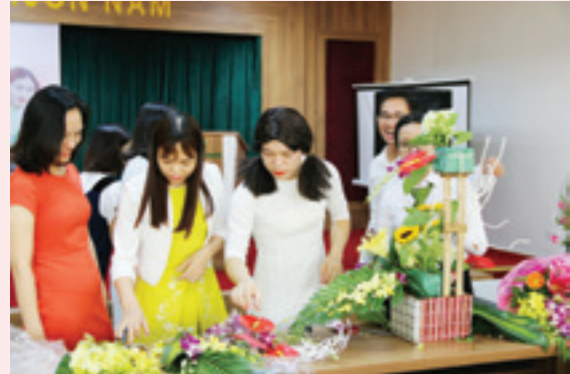
Cán bộ tại chi nhánh chụp ảnh với các tác phẩm cắm hoa

N gày 14/10/2017, Công đoàn Vietcombank Phố Hiến hân hoan tổ chức chương trình “Hội thi, hội diễn chào mừng Ngày Phụ nữ Việt Nam 20/10”.