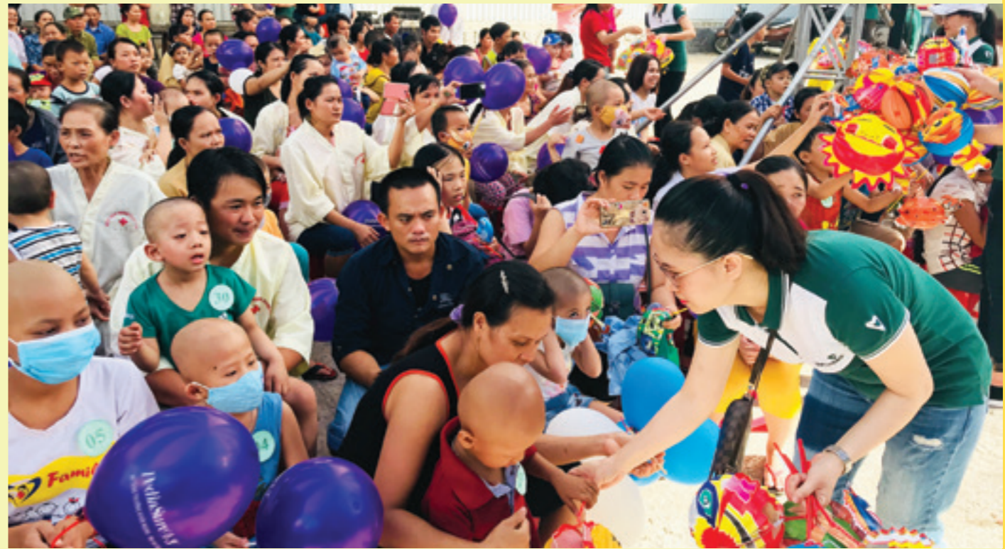
Cán bộ Vietcombank Huế tặng quà Trung thu cho các bệnh nhi tham dự chương trình

Mỗi suất ăn đều được Khoa Dinh dưỡng của Viện lên thực đơn và chế biến với quy trình vệ sinh đảm bảo nghiêm ngặt, hỗ trợ rất tốt cho các bệnh nhân trong việc điều trị bệnh và phục hồi sức khỏe. Suất cơm tuy có giá trị nhỏ về mặt vật chất, nhưng có giá trị rất lớn về mặt tinh thần đối với bệnh nhân đang điều trị tại Viện, để các gia đình bớt đi được gánh nặng về kinh tế, bớt nỗi lo trang trải các chi phí trong thời gian điều trị bệnh kéo dài.