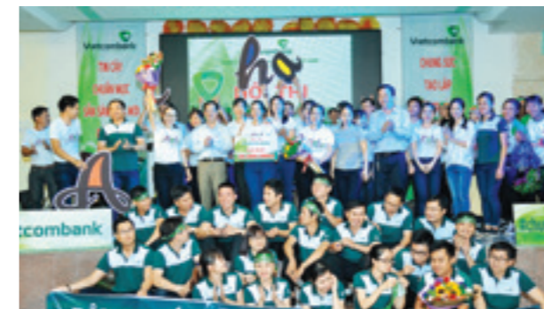
Ban Tổ chức, Ban Giám khảo chụp ảnh lưu niệm cùng các đội dự thi