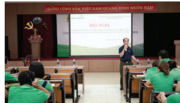
Chuyên gia chia sẻ tại Hội nghị