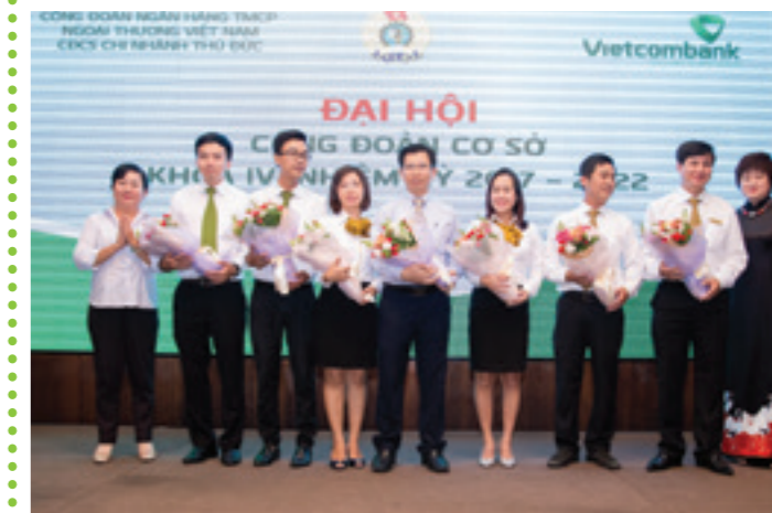
BCH CĐCS Vietcombank Thủ Đức nhiệm kỳ 2017 - 2022 ra mắt ĐH

ĐH đã bầu ra BCH CĐCS nhiệm kỳ 2017 - 2022 gồm 7 đ/c, 1 đại biểu chính thức dự ĐH Công đoàn Vietcombank.