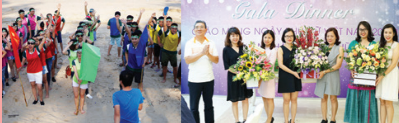
Các đội chơi đã sẵn sàng