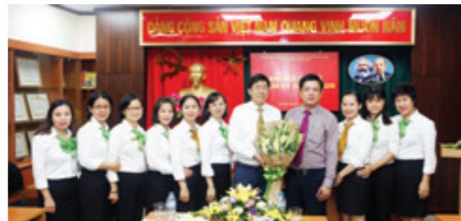
Bí thư Đảng ủy – Giám đốc Vietcombank Chi nhánh Sở giao dịch và Chi bộ 5