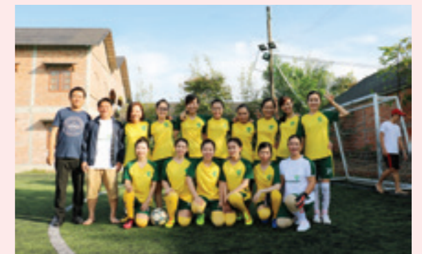
Giải bóng đá nữ chào mừng ngày Phụ nữ Việt Nam khởi thi đua 15 của Vietcombank CN Phú Quốc