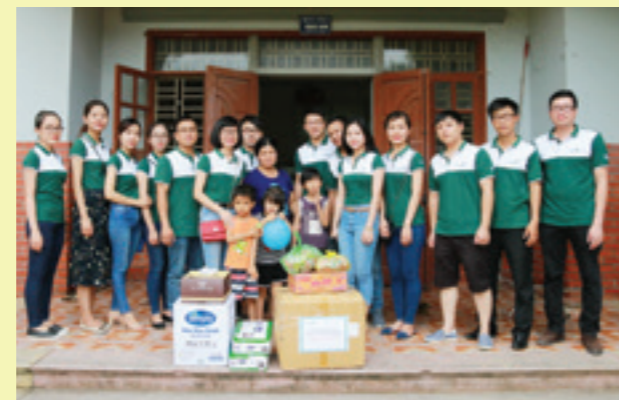
Đoàn thanh niên Vietcombank Hải Phòng tặng quà cho Làng trẻ mồ côi Hoa Phượng