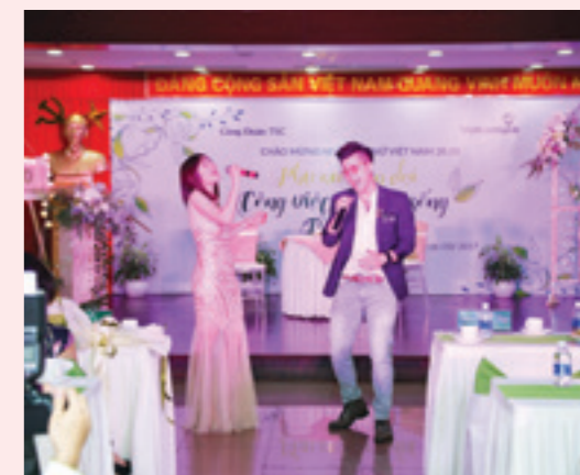
Những tiết mục văn nghệ đặc sắc