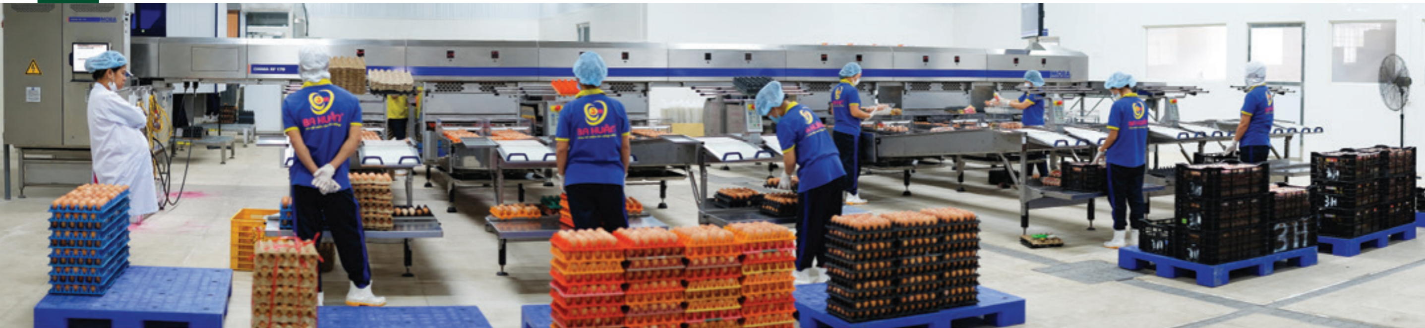
Dây chuyền xử lý và chế biến trứng gia cầm công nghệ cao tại nhà máy của Công ty TNHH Ba Huân Hà Nội – dự án do Vietcombank cấp tín dụng hơn 60 tỷ đồng