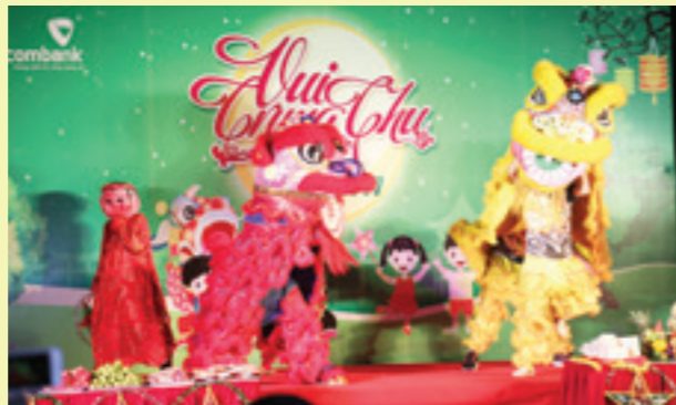
Tiết mục múa lân trong đêm hội