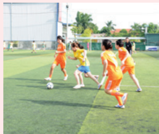
Một pha tranh bóng