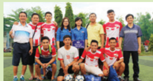
Đội bóng đá mini Vietcombank Ninh Thuận

Nhân Ngày Doanh nhân Việt Nam (13/10), từ ngày 16/09 - 13/10/2017, Vietcombank Ninh Thuận đã tham gia giải bóng đá Mini do Đảng ủy khối Doanh nghiệp, Liên đoàn lao động và Hiệp hội Doanh nghiệp tỉnh Ninh Thuận tổ chức.