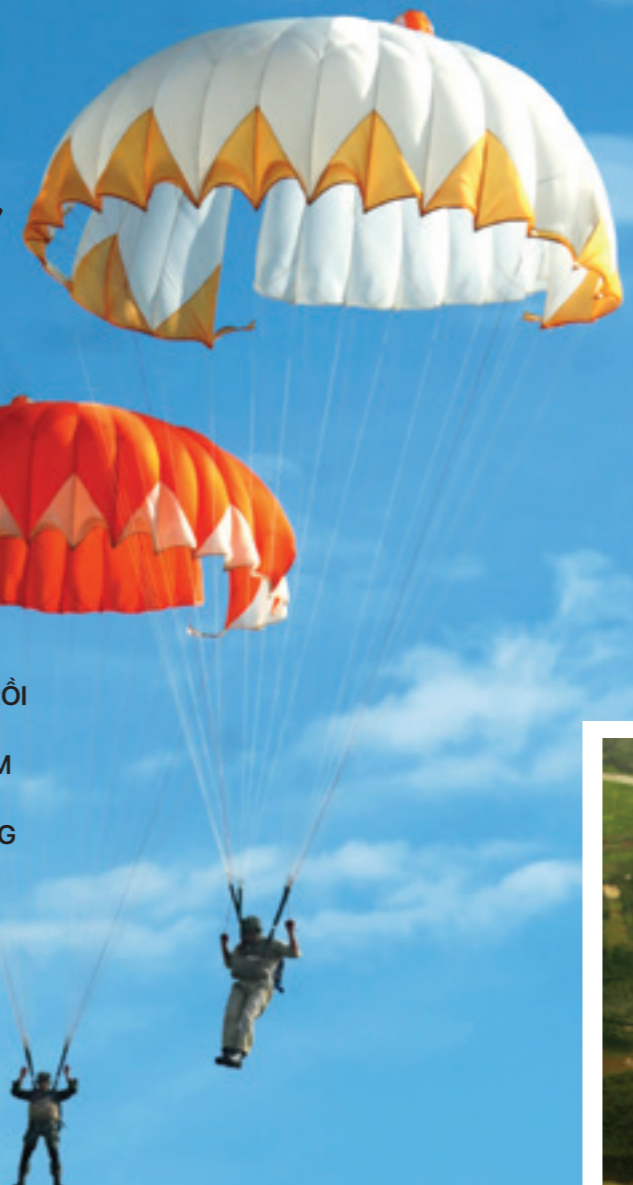
Bay giữa bầu trời Hà Nội

Sau những tháng ngày tập luyện mệt mỏi thì ngày nhảy dù cũng đã đến. Cửa ải cuối cùng là đo huyết áp phải ổn định mới được phép đeo dù và lên máy bay. Đeo dù chính lên lưng, dù dự bị phía trước bụng, đội mũ bảo hiểm, kiểm tra các móc dây và bước lên máy bay. Cánh quạt của chiếc máy bay AH2 của Liên Xô (cũ) mà ngày thường chỉ nhìn thấy trên TV trong các bộ phim của Liên Xô từ hồi Chiến tranh Thế giới thứ Hai quay tít.