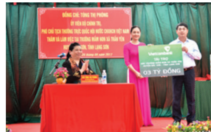
Ông Nghiêm Xuân Thành - Chủ tịch HĐQT Vietcombank trao tượng trưng số tiền 3 tỷ đồng của Vietcombank tài trợ kinh phí xây dựng Trường Tiểu học xã Trấn Yên

Với khoản tài trợ 3 tỷ đồng từ Vietcombank, huyện Bắc Sơn sẽ khởi công xây dựng công