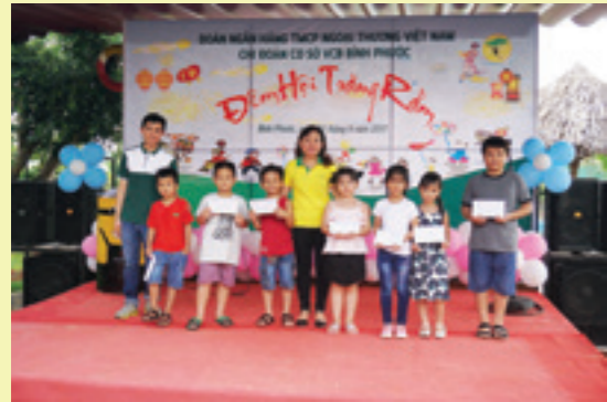
Tết Trung Thu tại Vietcombank CN Phú Quốc

Tối 03/10/2017, BCH CĐCS Vietcombank Phú Quốc đã tổ chức vui Tết Trung Thu cho hơn 20 cháu thiếu nhi là con của CBNV tại CN.