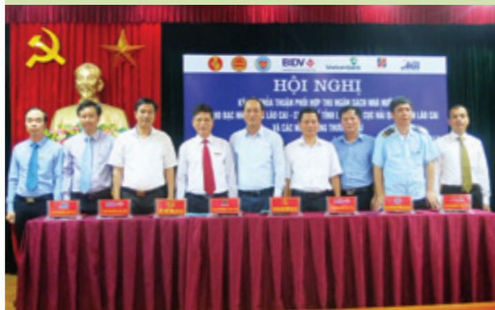
Lãnh đạo các đơn vị tham gia ký thỏa thuận hợp tác thu NSNN trên địa bàn Lào Cai

NGÀY 22/9/2017, TẠI TRỤ SỞ KHO BẠC NHÀ NƯỚC (KBNN) TỈNH, VIETCOMBANK LÀO CAI CÙNG CÁC NHTM KHÁC TRÊN ĐỊA BÀN ĐÃ KÝ KẾT THỎA THUẬN PHỐI HỢP THU NGÂN SÁCH NHÀ NƯỚC (NSNN) VỚI KBNN, CỤC THUẾ, CỤC HẢI QUAN TỈNH LÀO CAI.