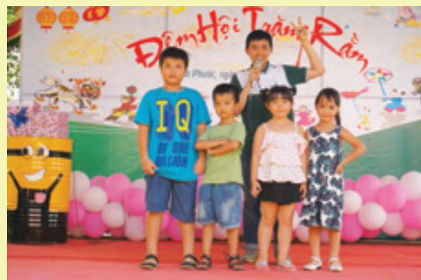
Các em thiếu nhi được tham gia các trò chơi trên sân khấu

Ngày 29/09/2017, Chi đoàn cơ sở Vietcombank Bình Phước đã tổ chức thành công chương trình “Đêm hội Trăng Rằm” cho con em CBNV đang công tác tại CN nhân dịp Tết Trung Thu.