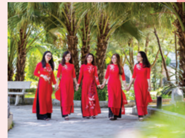
Cán bộ nữ Vietcombank Thái Nguyên dịu dàng trong nắng Thu vàng