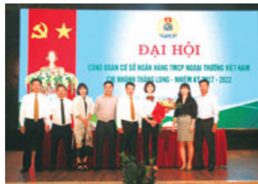
Đại hội CĐCS Vietcombank Thăng Long

Với nhiệm vụ 3 tháng cuối năm còn nhiều khó khăn thách thức, tập thể CBNV CN đã thảo luận và đưa ra nhiều giải pháp tập trung vào các mảng nghiệp vụ để phát triển hoạt động kinh doanh. Tại hội nghị, tập thể CBNV đã cùng Ban Lãnh đạo quyết tâm hoàn thành xuất sắc nhiệm vụ 3 tháng cuối năm, góp phần vào kết quả chung năm 2017 của hệ thống Vietcombank.