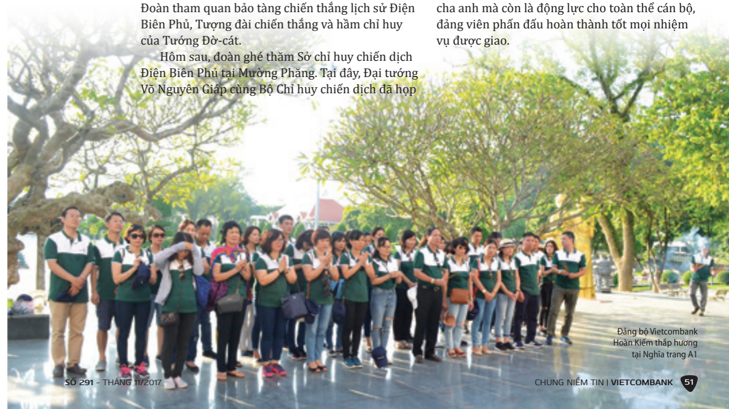
Đảng bộ Vietcombank Hoàn Kiếm thấp hương tại Nghĩa trang A1

Chuyến đi về nguồn đã đem lại cho toàn thể đảng viên Đảng bộ Vietcombank Hoàn Kiếm những bài học vô cùng sâu sắc. Đó là: Có bèn bỉ mới thành công; Biết đối thủ, biết ta để ra quyết sách phù hợp cho từng thời điểm; Phải luôn nghĩ về các giải pháp thay vì khó khăn trước mắt và cuối cùng là Tinh thần đoàn kết, tương hỗ sẽ tạo ra sức mạnh vô địch. Những chuyến đi về nguồn không chỉ bày tỏ tấm lòng tri ân của Đảng bộ Vietcombank Hoàn Kiếm đối với thế hệ cha anh mà còn là động lực cho toàn thể cán bộ, đảng viên phấn đấu hoàn thành tốt mọi nhiệm vụ được giao.