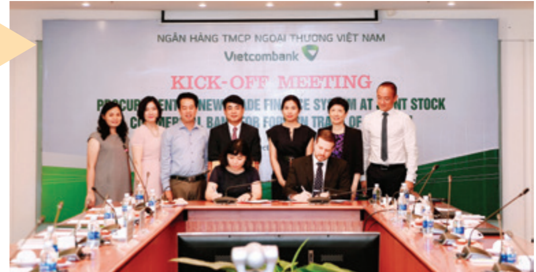
Đại diện Vietcombank và công ty Finastra tham dự tại buổi lễ

SMF (Singapore Manufacturing Federation) là liên đoàn bao gồm các doanh nghiệp chế tạo và các doanh nghiệp liên quan tới hoạt động chế tạo, được thành lập vào năm 1932. Đến nay, với hơn 3.000 thành viên, SMF đã trở thành một trong hai Liên đoàn doanh nghiệp hoạt động mạnh mẽ, tích cực và có tầm ảnh hưởng lớn nhất tới các doanh nghiệp tại Singapore.