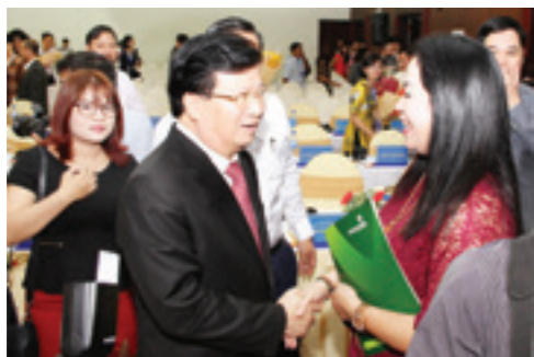
Giám đốc Vietcombank Quảng Ngãi chào Phó Thủ tướng Trịnh Đình Dũng

NGÀY 20/10/2017, TẠI TP. QUẢNG NGÃI, UBND TỈNH QUẢNG NGÃI ĐÃ TỔ CHỨC HỘI NGHỊ XÚC TIẾN ĐẦU TƯ “QUẢNG NGÃI - HỢP TÁC ĐẦU TƯ VÀ PHÁT TRIỂN” NĂM 2017. Đ/C TRỊNH ĐÌNH DŨNG - ỦY VIÊN TW ĐẢNG, PHÓ THỦ TƯỚNG CHÍNH PHỦ ĐÃ THAM DỰ VÀ CHỈ ĐẠO HỘI NGHỊ.