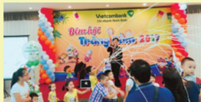
Các tiết mục, trò chơi trong Đêm hội