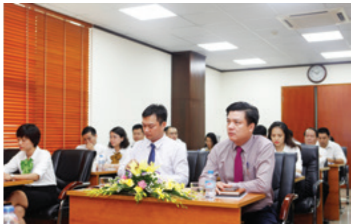
Đại hội của Chi bộ thuộc Đảng bộ Vietcombank chi nhánh Sở giao dịch