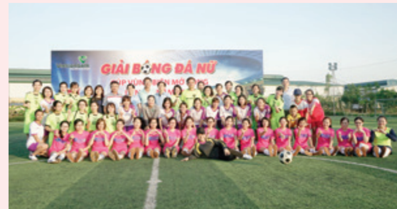
Các đội chụp ảnh lưu niệm