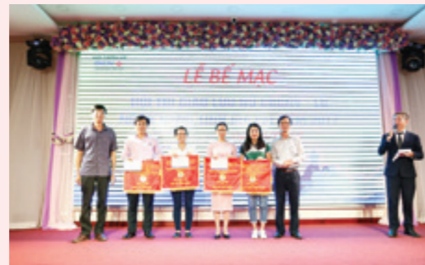
Nữ công CĐCS Vietcombank Gia Lai giành giải Nhất