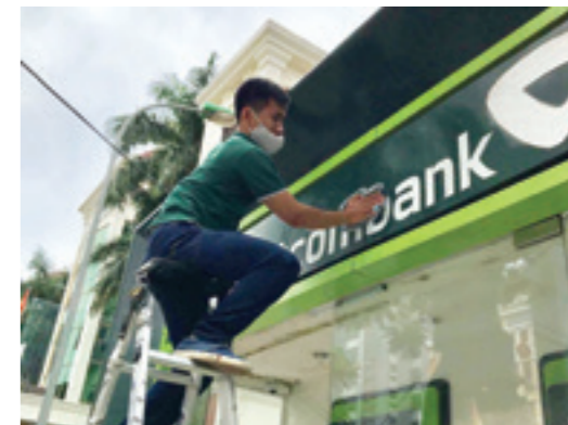
Làm sạch biển máy ATM

Sự tham gia tích cực của đông đảo đoàn viên thanh niên Vietcombank Thái Nguyên trong chương trình đã thể hiện tinh thần nỗ lực, ý thức của CBNV trong việc xây dựng và quảng bá hình ảnh thương hiệu Vietcombank chuyên nghiệp, thân thiện tới khách hàng.