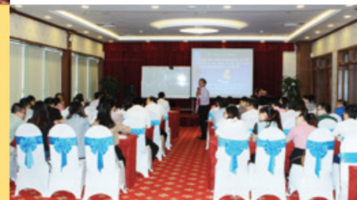
Quang cảnh buổi đào tạo kỹ năng bán hàng giao tiếp và chăm sóc KH

VỪA QUA, VIETCOMBANK NGHỆ AN TỔ CHỨC THÀNH CÔNG KHÓA ĐÀO TẠO KỸ NĂNG BÁN HÀNG, GIAO TIẾP VÀ CHĂM SÓC KHÁCH HÀNG (KH) CHO CÁN BỘ LÀM CÔNG TÁC KH CỦA CN.