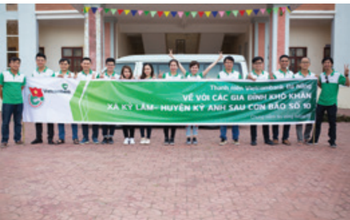
Các thành viên trong chuyến đi