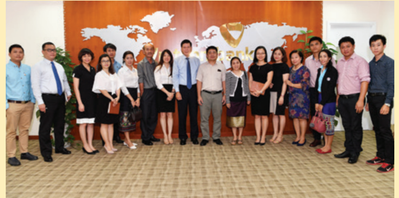
Đoàn báo chí Lào và đại diện Vietcombank chụp ảnh lưu niệm

Cũng trong đợt công tác này, Đoàn Vietcombank đã có các buổi làm việc với một số doanh nghiệp Việt Nam đang hoạt động tại Lào như Viettel Global, Petrolimex; làm việc với đơn vị cho thuê cơ sở làm Trụ sở Ngân hàng Vietcombank tại Lào để thống nhất phương án sửa chữa, cải tạo tòa nhà và ký kết Hợp đồng thuê làm Trụ sở Ngân hàng Vietcombank tại Lào trong chiều ngày 2/11/2017 và ngày 3/11/2017.