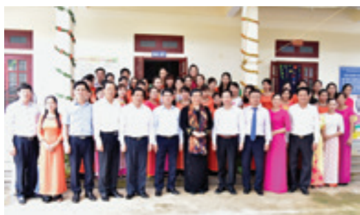
Ủy viên Bộ Chính trị, Phó Chủ tịch thường trực Quốc hội Tông Thị Phóng cùng các đại biểu và thầy cô giáo trường mầm non xã Trấn Yên chụp ảnh lưu niệm

Ủy viên Bộ Chính trị, Phó Chủ tịch thường trực Quốc hội Tông Thị Phóng cùng các đại biểu và thầy trò Trường Phổ thông Dân tộc nội trú THCS huyện Bắc Sơn chụp ảnh lưu niệm