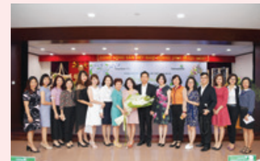
Đại diện Ban Lãnh đạo Vietcombank và các chị em CBNV TSC cùng diễn giả chụp ảnh lưu niệm tại chương trình giao lưu