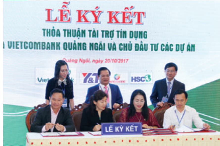
Vietcombank Quảng Ngãi ký kết thỏa thuận tài trợ tín dụng với các nhà đầu tư