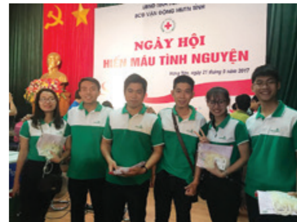
Cán bộ nhân viên VCB tham gia hiến máu tình nguyện.

“Ngày hội hiến máu tình nguyện tỉnh Hưng Yên 2017” mang trong đó thông điệp của lòng nhân ái, sự sẻ chia, làm xúc động hàng triệu trái tim của cộng đồng và đem lại ấn tượng sâu sắc cho những người “bạn đồng hành” với lễ hội. Những đóng góp, chia sẻ của CBNV Vietcombank Hưng Yên sẽ góp phần nâng cao giá trị của những hoạt động nhân đạo, những nghĩa cử nhân ái tới cộng đồng.