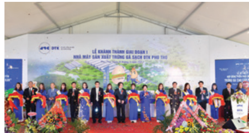
Lễ khánh thành giai đoạn 1 Nhà máy sản xuất trứng gà sạch ĐTK Phú Thọ - dự án do Vietcombank cho vay trên 600 tỷ đồng

Trên 2.500 tỷ đồng đã được Vietcombank giải ngân cho vay lĩnh vực nông nghiệp ứng dụng công nghệ cao, nông nghiệp sạch.