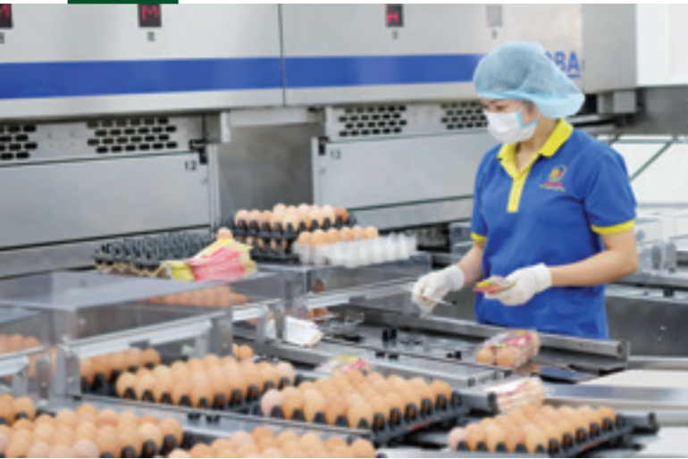
Dây chuyền xử lý và chế biến trứng gia cầm công nghệ cao tại nhà máy của Công ty TNHH Ba Huân Hà Nội - dự án do Vietcombank cấp tín dụng hơn 60 tỷ đồng