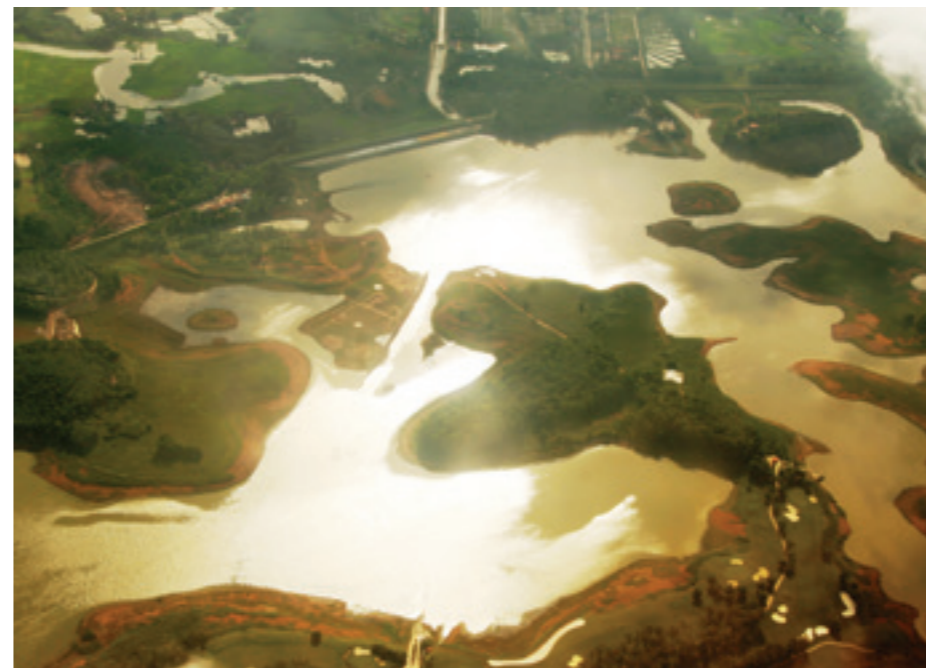
Hồ Đống Mò nhìn từ trên cao

Cơ thể như đang ngồi xích đu giữa bầu trời. Bay giữa không trung, ở trên cao nhìn xuống thấy Hà Nội phủ một màu xanh của cây cối và sông hồ