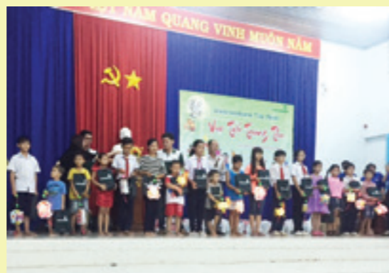
Tặng quà Trung Thu cho thiếu nhi