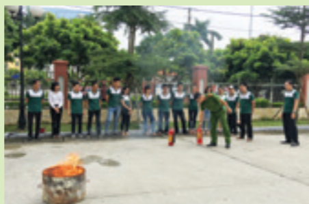
Giảng viên đang hướng dẫn học viên cách sử dụng bình chữa cháy

Các học viên cũng được diễn tập một vụ trộm cướp tại ngân hàng, cách quan sát, nhận biết và xử lý tình huống khi có trộm đột nhập. Tiếp đến, từng học viên được thực hành sử dụng các phương tiện chữa cháy như bình bột, bình CO2 hay nước để dập tắt đám cháy một cách nhanh chóng. Kết thúc lớp tập huấn, các học viên được cấp giấy chứng nhận huấn luyện nghiệp vụ PCCC.