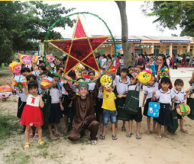
Một gian trò chơi dành cho các em thiếu nhi

N gày 30/09/2017, Đoàn cơ sở Vietcombank TP.HCM đã thực hiện thành công chương trình “Trung Thu yêu thương” tại ấp Tà Dơ, xã Tân Thành, huyện Tân Châu, tỉnh Tây Ninh.