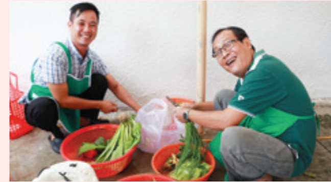
Đàn ông vào bếp

Ngày 15/10/2017, CĐCS Vietcombank Tây Ninh đã tổ chức Cuộc thi nấu ăn cho toàn thể đoàn viên công đoàn. Cuộc thi có 8 tổ công đoàn (TCD) tham gia, mỗi TCD là 1 đội, gồm 2 nam và 1 nữ, nấu bữa cơm cho 10 người ăn, chi phí nguyên liệu 600.000VND với yêu cầu bữa cơm ngon và đầy đủ dinh dưỡng.