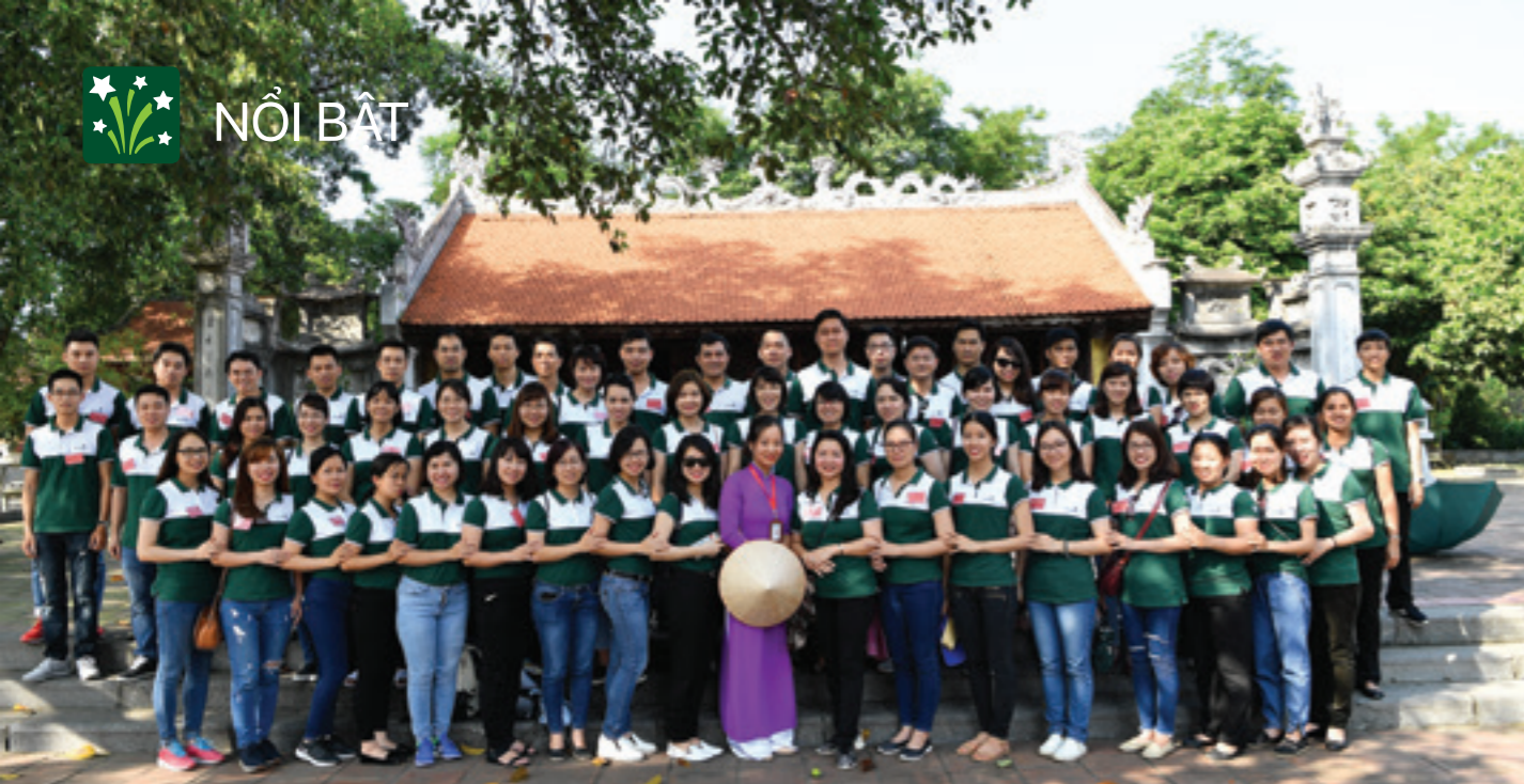
Lớp Đảng viên mới đi thực tế tại Đền thờ Hai Bà Trưng