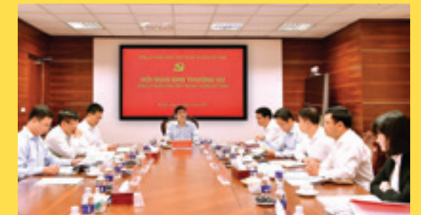
Toàn cảnh Hội nghị Ban Thường vụ phiên họp tháng 05/2017