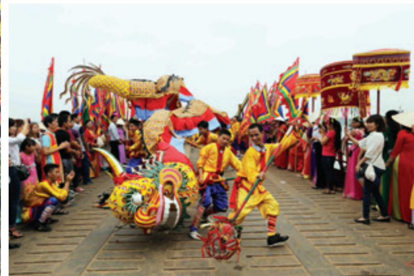
Những màn múa rồng độc đáo tại lễ hội