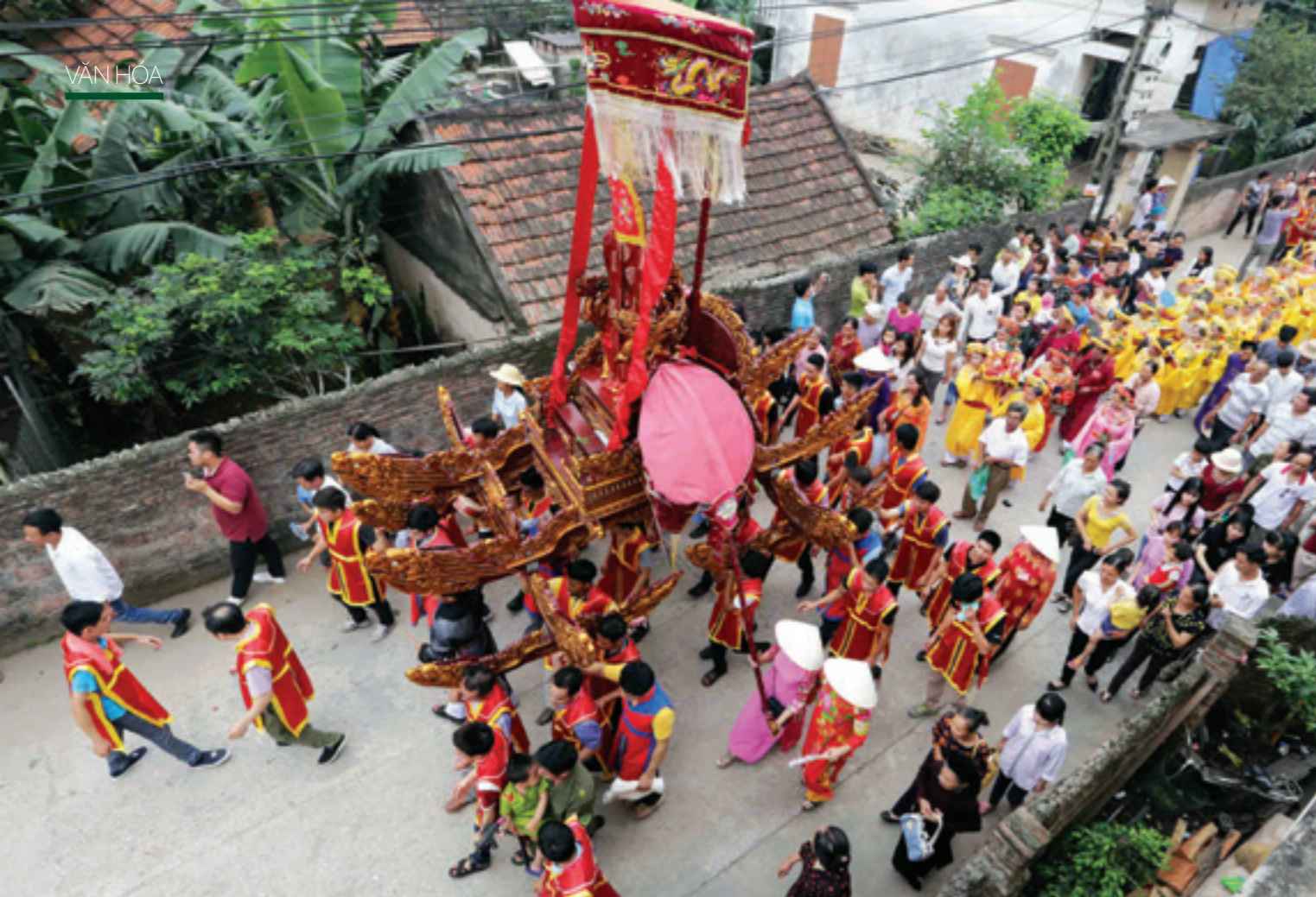
Đám rước nước của làng Tự nhiên gồm 7 long kiệu: thôn Thượng và thôn hạ mỗi thôn 3 cỗ long kiệu (cho ba vị linh thần Chử Đổng Tử và hai vị phu nhân), thôn Thủy Tộc thờ ba vị nhưng rước trên một long kiệu với bài vị chung