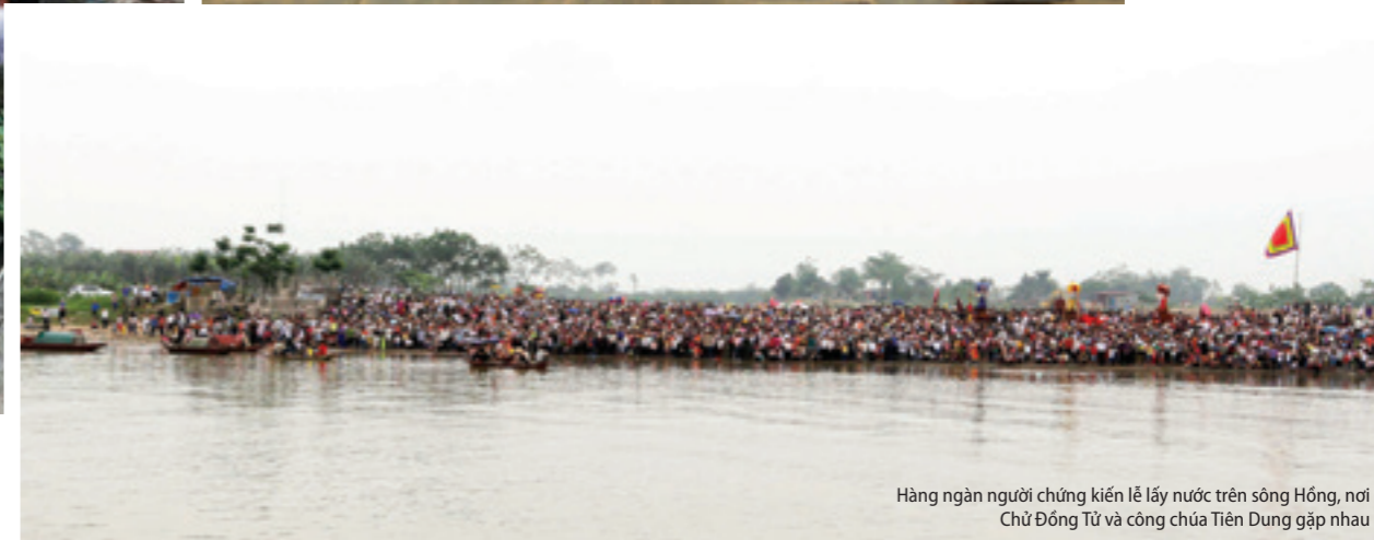
Hàng ngàn người chứng kiến lễ lấy nước trên sông Hồng, nơi Chử Đổng Tử và công chúa Tiên Dung gặp nhau