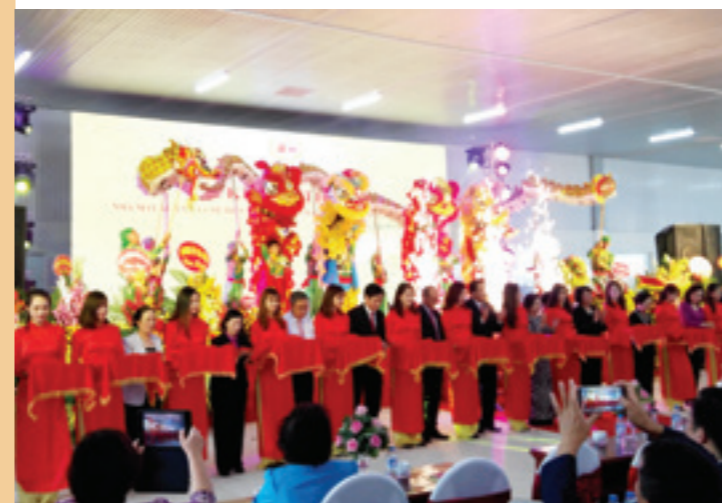
Lễ cắt băng khánh thành Nhà máy xử lý và chế biến trứng gia cầm công nghệ cao Ba Huân Hà Nội

Vừa qua, tại Phúc Thọ, Hà Nội, Công ty TNHH Ba Huân Hà Nội đã tổ chức lễ khánh thành nhà máy xử lý và chế biến trứng gia cầm công nghệ cao. Dự án do Vietcombank Hà Tây cấp tín dụng với tổng mức đầu tư dự án giai đoạn I là 105 tỷ đồng.