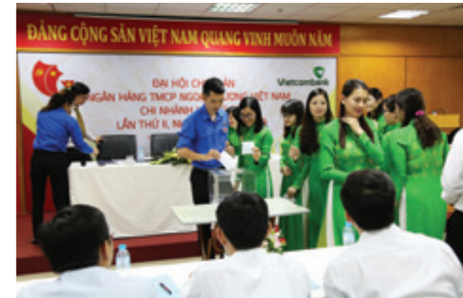
Đại hội bỏ phiếu bầu cử BCH Chi đoàn khóa II với tinh thần đoàn kết