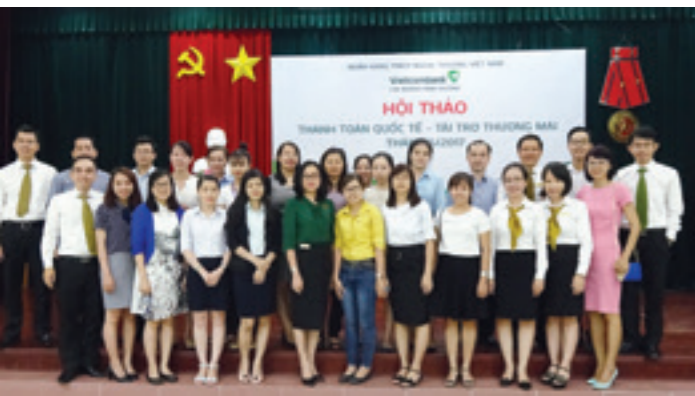
Đại diện Ban Giám đốc Vietcombank Bình Dương chụp ảnh lưu niệm với những khách hàng tiềm năng của Chi nhánh.