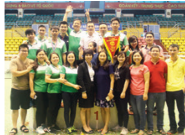
Đoàn VĐV Vietcombank Bắc Ninh nhận giải tại Hội thao ngành Ngân hàng tỉnh Bắc Ninh năm 2017

Hội thao kết thúc thành công và phấn khởi, thực sự là một sân chơi bổ ích cho cán bộ nhân viên trong ngành ngân hàng. Ngoài ra, đây cũng là cơ hội khẳng định vị thế, hình ảnh, thương hiệu, văn hóa của Vietcombank đến khách hàng và các ngân hàng bạn trên địa bàn.