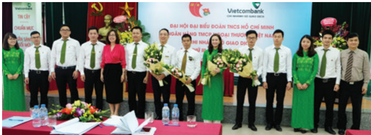
Ban chấp hành nhiệm kỳ 2017-2019 ra mắt