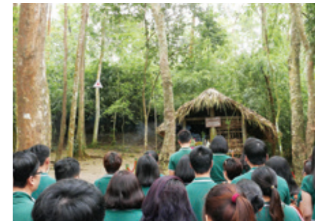
Các học viên tập trung nghe giới thiệu về điểm di tích Lán Nà Lừa (Tuyên Quang) – nơi Chủ tịch Hồ Chí Minh đã ở và làm việc từ cuối tháng 5 đến ngày 22/08/1945 để chuẩn bị và lãnh đạo cuộc Tổng khởi nghĩa Tháng Tám năm 1945.

Ngày 27/4, các học viên tham dự chuyến đi thực tế tại hai địa điểm: khu di tích lịch sử Định Hóa – Thái Nguyên và Tân Trào – Tuyên Quang.