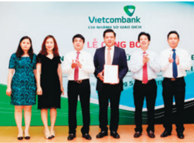
Ban lãnh đạo Vietcombank chụp hình lưu niệm cùng tân Giám đốc Vietcombank Sở giao dịch