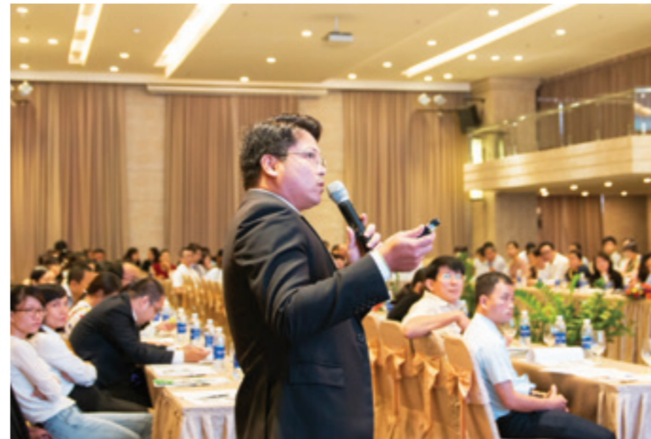
Đại diện Vietcombank Đà Nẵng thuyết trình giới thiệu sản phẩm tín dụng dành cho khách hàng SME

Việc được lựa chọn là ngân hàng triển khai thu NSNN trên địa bàn tỉnh tiếp tục khẳng định uy tín, thương hiệu Vietcombank trên địa bàn. Đây cũng là cơ hội thuận lợi để Vietcombank Thái Nguyên giới thiệu, quảng bá các sản phẩm dịch vụ tới đông đảo người dân.