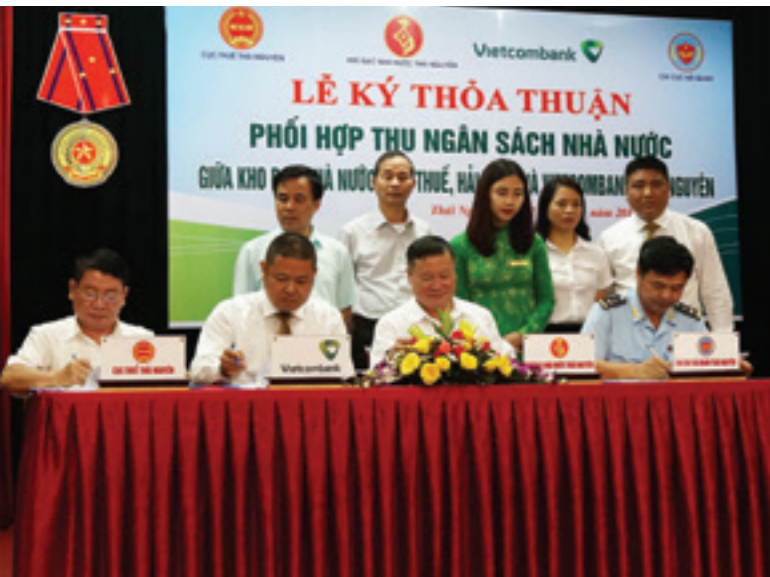
Đại diện 04 đơn vị thực hiện ký kết thỏa thuận liên tịch phối hợp thu NSNN (Lần lượt từ trái sang phải: Cục thuế Thái Nguyên, Vietcombank Thái Nguyên, Kho bạc Nhà nước tỉnh Thái Nguyên, Chi cục Hải Quan Thái Nguyên)

NGÀY 21/4/2017, TẠI TRỤ SỞ KHO BẠC NHÀ NƯỚC TỈNH THÁI NGUYÊN ĐÃ DIỄN RA LỄ KÝ KẾT THỎA THUẬN LIÊN TỊCH PHỐI HỢP THU NGÂN SÁCH NHÀ NƯỚC (NSNN) GIỮA KHO BẠC NHÀ NƯỚC THÁI NGUYÊN, CỤC THUẾ THÁI NGUYÊN, CHI CỤC HẢI QUAN THÁI NGUYÊN VÀ VIETCOMBANK THÁI NGUYÊN.