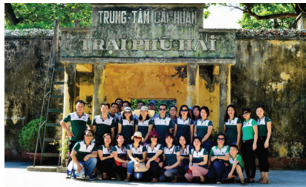
Đoàn chụp lưu niệm trước cổng vào trại giam Phú Hải

Đoàn chụp lưu niệm tại Nghĩa trang Hàng Dương