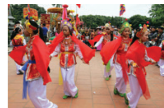
Các cháu thiếu nhi với màn múa xinh xắn tại lễ hội