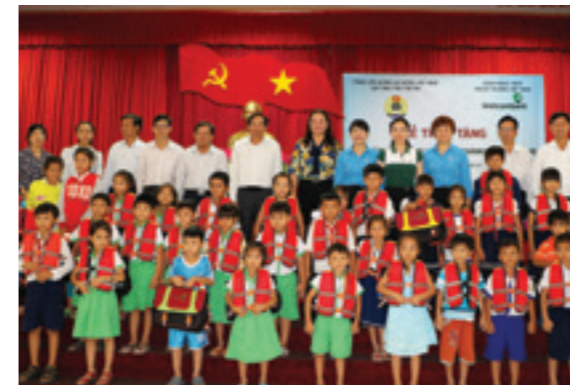
Quang cảnh lễ trao tặng

Sự kiện trong khuôn khổ chương trình Hoạt động An sinh xã hội hướng đến cộng đồng hàng năm của Vietcombank tài trợ thông qua Quỹ Bảo trợ trẻ em Công đoàn Việt Nam. Đây là hoạt động rất thiết thực và ý nghĩa đối với sự an toàn của trẻ em vùng sông nước, đặc biệt là các em đi học bằng phương tiện đường thủy. Hoạt động cũng góp phần giáo dục cho các em có tính tự giác mặc áo phao khi đi lại trên các phương tiện đường thủy để tránh những tai nạn đáng tiếc có thể xảy ra, nhất là mùa mưa bão đang gần kề.