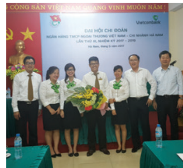
Ban Chấp hành nhiệm kỳ 2017 - 2019 ra mắt