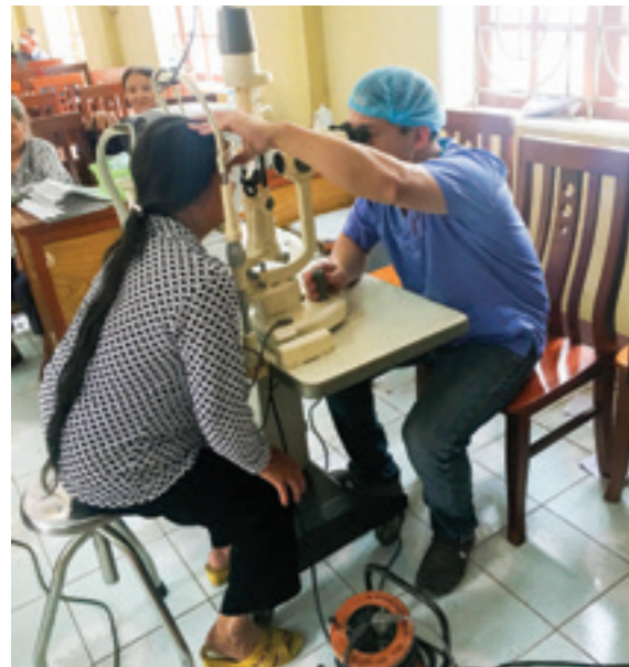
Chương trình phẫu thuật đục thủy tinh thể cho bệnh nhân nghèo tại huyện Cẩm Giàng, tỉnh Hải Dương do Vietcombank phối hợp với BVMTW thực hiện

Trong chuỗi hoạt động an sinh xã hội nhằm mang lại ánh sáng cho bệnh nhân nghèo, Vietcombank cũng đồng hành cùng BVMTW và hỗ trợ 500 triệu đồng để phẫu thuật mắt cho bệnh nhân nghèo tại huyện Quế Sơn, tỉnh Quảng Nam; ủng hộ 1 tỷ đồng cho chương trình "Mắt sáng người cao tuổi" của Hội người cao tuổi Việt Nam.