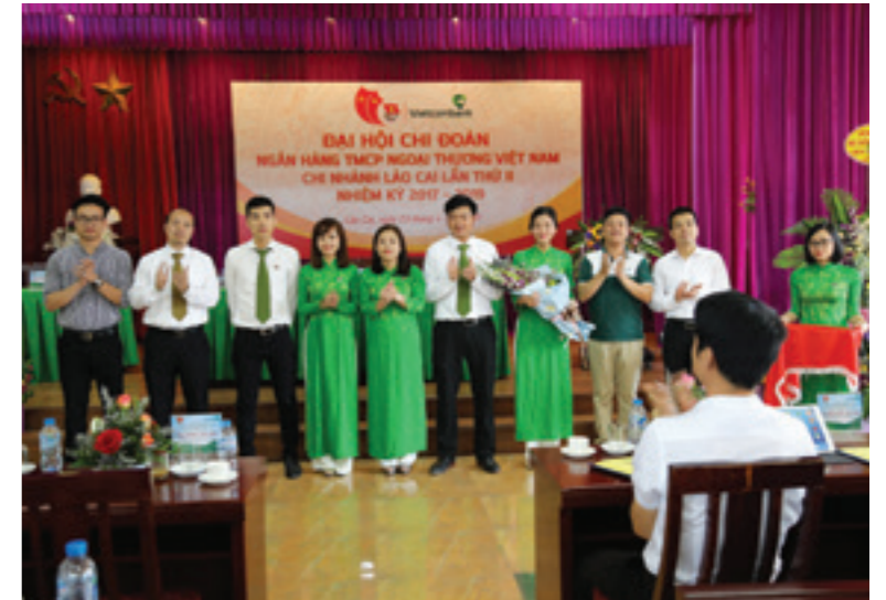
Các đại biểu chụp hình cùng Ban chấp hành khóa mới

Tại đại hội, các đồng chí trong BCH Đoàn Vietcombank và ban lãnh đạo chi nhánh đã đưa ra nhiều ý kiến chỉ đạo sát sao, để CĐCS Vietcombank Lào Cai khóa II hoàn thiện phương hướng và mục tiêu, nhằm xây dựng CĐCS vững mạnh về các hoạt động phong trào cũng như đóng góp vào mục tiêu kinh doanh của chi nhánh. Đại hội đã bầu ra đoàn đại biểu đi dự Đại hội Đại biểu Đoàn thanh niên Vietcombank khóa III nhiệm kỳ 2017 - 2022.