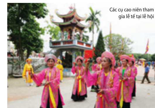
Các cụ cao niên tham gia lễ tế tại lễ hội

Đền thờ chính và nổi tiếng nhất là đền Đa Hoà thuộc xã Bình Minh, huyện Khoái Châu, Hưng Yên. Nơi đây cũng diễn ra Lễ Hội Chử Đổng Tử - Tiên Dung vào ngày 20/2 Âm lịch.