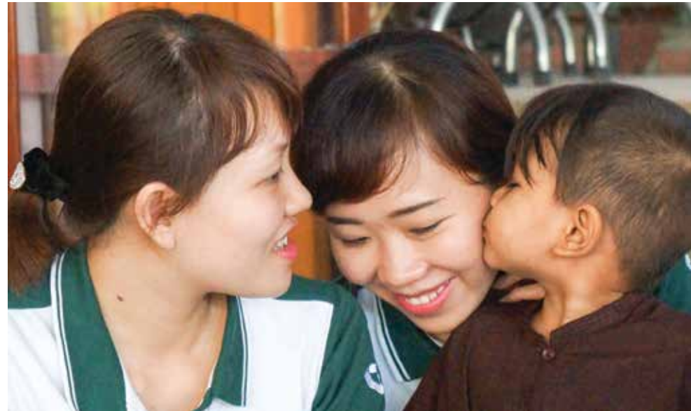
Đoàn TN Vietcombank Gò Vấp cùng trẻ em mồ côi