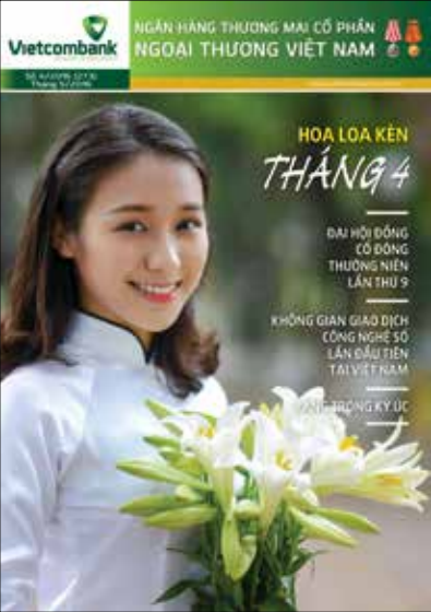
BẢN TIN CỦA NGÂN HÀNG TMCP NGOẠI THƯƠNG VIỆT NAM SỐ 4/2016 (273), Tháng 5/2016