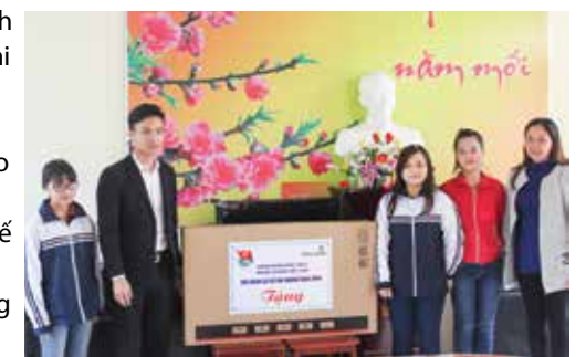
Đại diện Đoàn TN Vietcombank Ninh Bình (thứ 2 từ trái sang) trao quà từ thiện cho Trung tâm bảo trợ xã hội tỉnh

Phát biểu tại buổi Lễ, đại diện Trung tâm bảo trợ bày tỏ sự xúc động đối với món quà rất có ý nghĩa trong sinh hoạt cộng đồng. Trung tâm bảo trợ có khoảng 40 cháu thiếu nhi có hoàn cảnh cơ nhỡ hiện đang được chăm sóc và nuôi dưỡng, nhận được món quà của Chi Đoàn cơ sở Vietcombank Ninh Bình là nguồn động viên lớn lao về tinh thần cũng như thể hiện được nét đẹp nhân văn của thương hiệu Vietcombank. Trung tâm bảo trợ sẽ thực hiện tốt việc bảo quản, quản lý để phát huy tốt nhất hiệu quả từ phần quà nhận được. □