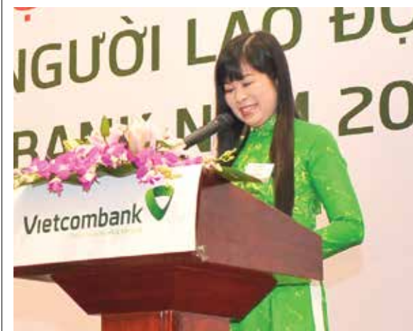
Đại diện Người lao động Vietcombank Nam Sài Gòn trình bày tham luận tại Hội nghị