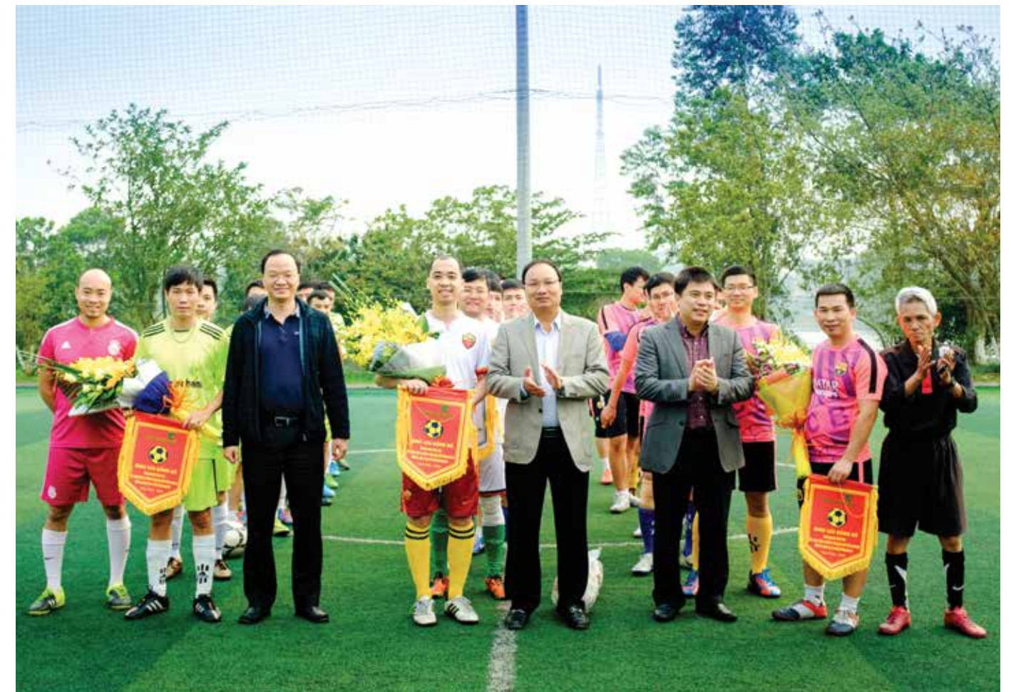
Ban giám đốc Vietcombank Vĩnh Phúc – Vietcombank Dịch vụ khách hàng đặc biệt – Phòng Phê duyệt tín dụng Trụ sở chính chụp ảnh lưu niệm cùng các đội bóng

Chương trình giao lưu thể thao văn nghệ diễn ra thành công tốt đẹp đã tăng cường thêm mối quan hệ giữa các chi nhánh trong hệ thống Vietcombank đồng thời cũng giúp nâng cao sức khỏe, sự hiểu biết lẫn nhau giữa các cán bộ trong hệ thống Vietcombank. □