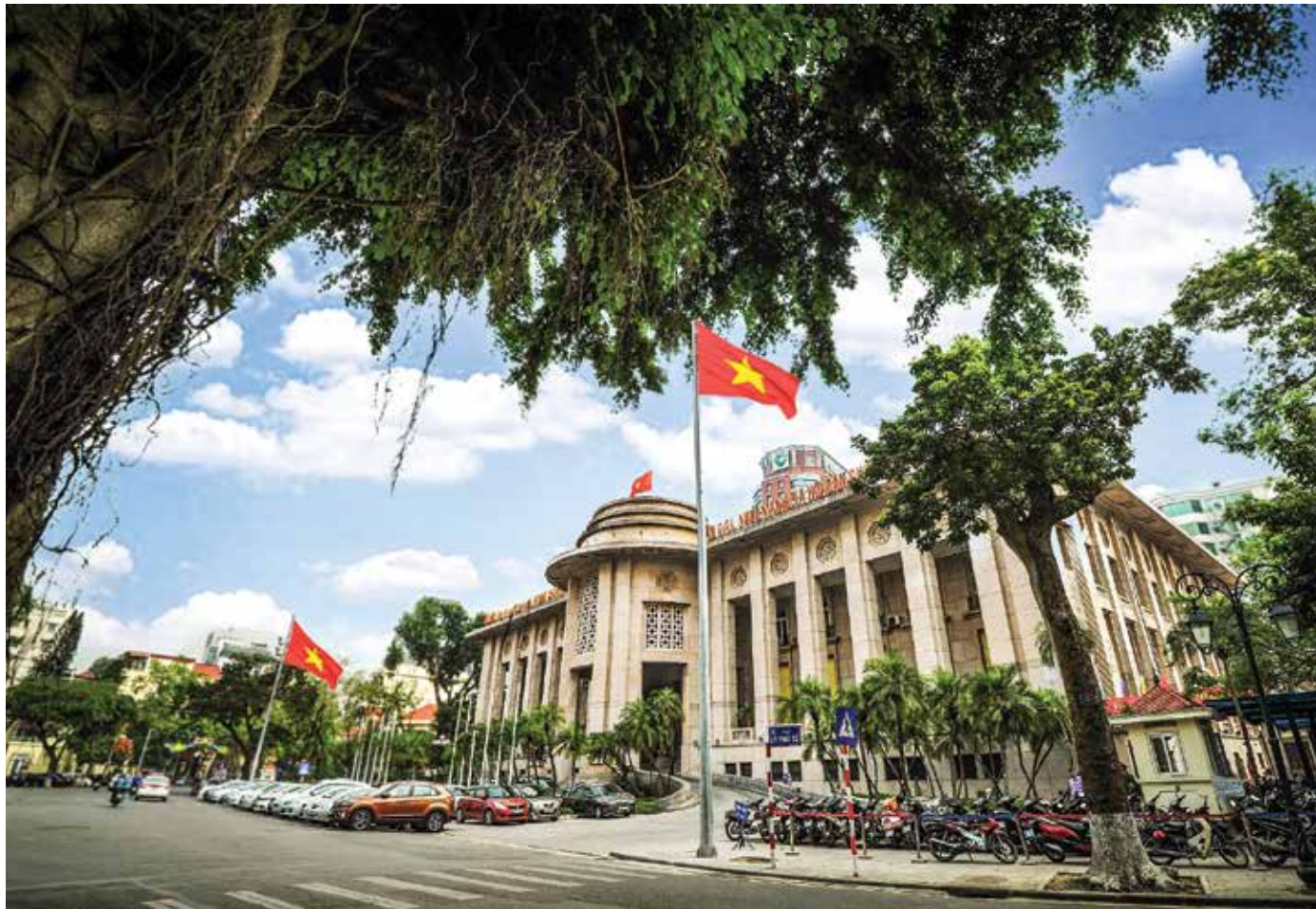
Trụ sở Ngân hàng Nhà nước Việt Nam, phía sau là Trụ sở chính Vietcombank