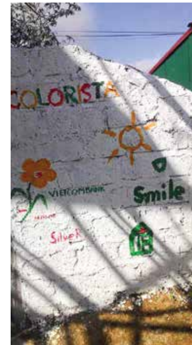
Một góc nhỏ lưu niệm tinh thần của những thanh niên Vietcombank trong Trung tâm

sự hạnh phúc khi được ở đây để giúp đỡ những em nhỏ dân tộc. Cùng với anh là những thầy cô giáo – những tình nguyện viên của Việt Nam và nhiều quốc gia khác cùng chung tay xây dựng Trung tâm và dạy học cho các em. Đến với Trung tâm, chúng tôi được thấy sự tâm huyết, sự nhiệt tình của các thầy cô giáo nơi đây với các em học sinh, dù còn nhiều khó khăn thiếu thốn, nhưng các thầy cô cũng đã xây dựng nên một trung tâm với đầy đủ vườn rau, ao cá, các thầy cô cũng chăn nuôi rất “mát tay” để cải thiện bữa ăn cho các em và lấy nguồn kinh phí phát triển Trung tâm, chúng tôi cũng thấy cuộc sống của các em