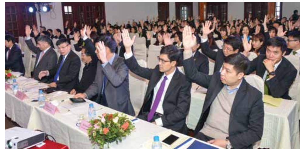
Biểu quyết tại Hội nghị

độ: Tiến sỹ, Phó tiến sỹ: 10 người, Thạc sỹ: 430 người, Đại học: 1.001 người, Cao đẳng trở xuống: 53 người. Toàn thể người lao động tại TSC đều được ký hợp đồng lao động phù hợp, đúng luật. Báo cáo đã nêu rõ các chế độ chính sách với NLD từ việc đảm bảo việc làm ổn định, tiền lương và phụ cấp; chế độ tuyển dụng và chấm dứt hợp đồng lao động; sử dụng, bồi dưỡng, đào tạo đối với NLD; chế độ bảo hiểm y tế, bảo hiểm xã hội.