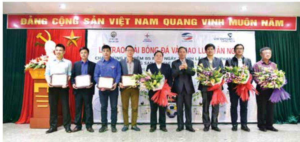
Giám đốc cùng đội trưởng 4 đội bóng nhận hoa và kỷ niệm chương