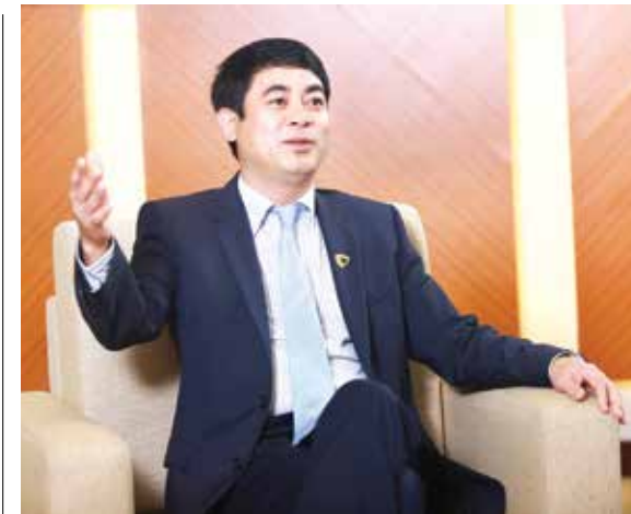
TS. Nghiêm Xuân Thành - Bí thư Đảng ủy, Chủ tịch HĐQT Vietcombank

Thời kỳ đầu từ 1963 - 1977, Vietcombank với vai trò độc quyền về hoạt động ngân hàng đối ngoại đã hoàn thành xuất sắc nhiệm vụ mà Chính phủ, ngành Ngân hàng giao phó, vừa đáp ứng nhu cầu ngoại tệ cho nền kinh tế của hậu phương miền Bắc, vừa làm trọn