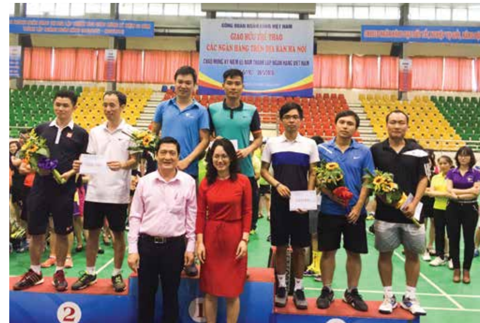
Lễ trao giải Nhất, Nhì, Ba bộ môn Tennis