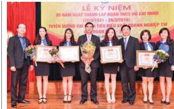
Thường trực Đảng ủy Vietcombank và Thường trực Đoàn Thanh niên Vietcombank cùng đại diện các Chi đoàn tiêu biểu được tuyên dương

Trong khuôn khổ các nội dung của buổi Lễ, Đoàn Khối đã tổ chức