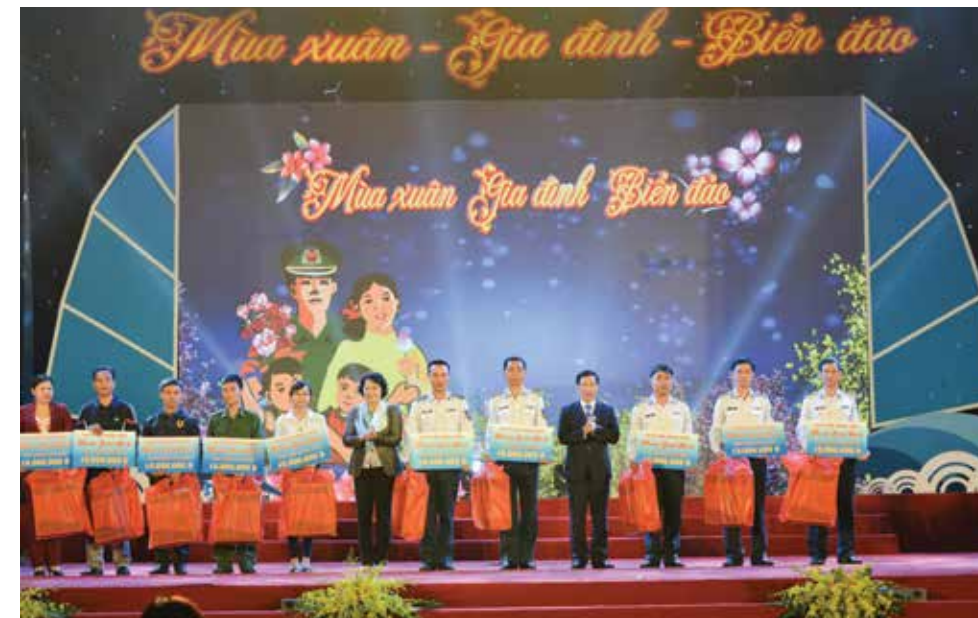
Bà Nguyễn Thị Kim Ngân, Ủy viên Bộ Chính trị, Chủ tịch Quốc hội nước CHXHCNVN (thứ 6 từ trái sang) và ông Nguyễn Ngọc Thiện, Bộ trưởng Bộ Văn hóa, Thể thao và Du lịch (thứ 4 từ phải sang) trao quà và sổ tiết kiệm cho các chiến sĩ và gia đình chiến sĩ.