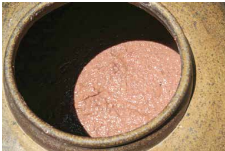
Hũ mắm tép đặc trưng của người dân quê

Ở Quảng Bình quê tôi, tép nhiều vô kể, từ kênh, mương, ao, hồ, sông, suối, kể cả ruộng lúa, cứ ở đâu có nước ngọt là ở đó có tép. Nhưng tép béo nhất, ăn ngon nhất vẫn là tép tháng 2, tháng 3 âm lịch khi khí tiết mùa xuân mát mẻ, trời đầy sương mù.