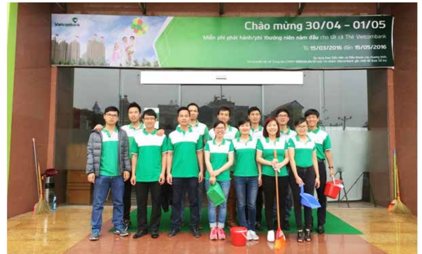
Ra quân "Ngày chủ nhật xanh"