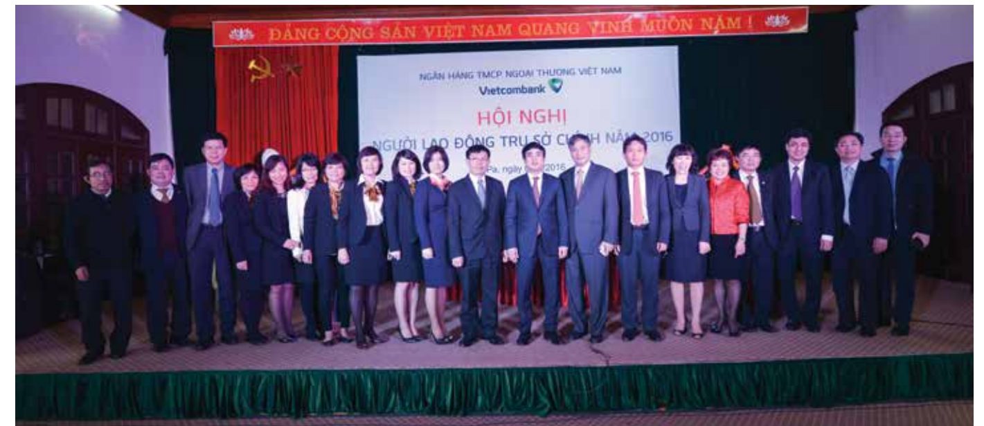
Các đại biểu chụp ảnh kỷ niệm

Hội nghị đại biểu NLD TSC Vietcombank đã thông qua Nghị quyết và kết thúc tốt đẹp sau hơn 4 tiếng làm việc liên tục. □