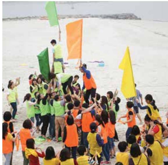
Núi cao còn có núi cao hơn

Hạ Long đón chúng tôi với chút vị mặn của biển và tiết trời se lạnh của những ngày cuối đông. Trên bãi biển đảo Rều, chúng tôi trong những trang phục sắc sảo đại diện cho 5 đội chơi với thành viên là các cán bộ và Ban giám đốc Vietcombank Hoàn Kiếm. Chưa bao giờ tôi thấy khoảng cách giữa chúng tôi lại gần đến vậy. Cán bộ và Ban giám đốc đều là thành viên của các đội chơi, cùng nhau thi