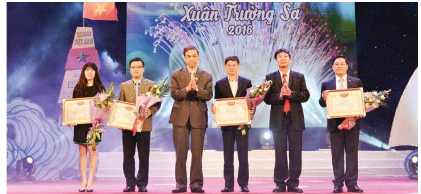
Đại diện Vietcombank (ngoài cùng bên trái) đón nhận sự tri ân của Ban Tổ chức đối với những đóng góp để làm nên thành công của chương trình “Xuân Trường Sa” 2016