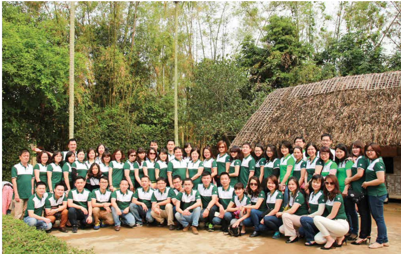
Trước ngôi nhà gắn liền với tuổi thơ của Bác