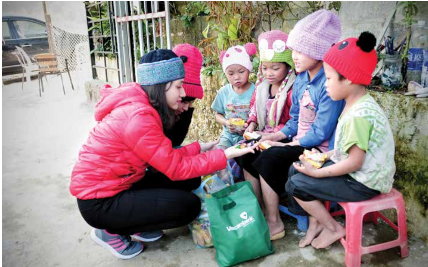
Các bạn thanh niên tặng cho các em những món quà nhỏ

» TƯỜNG NGÂN SON – Vietcombank Sở giao dịch