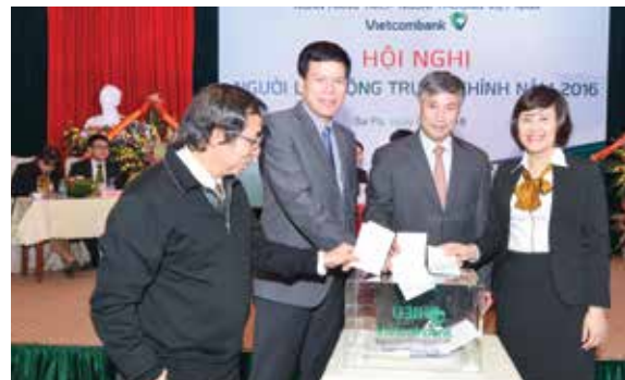
Các đại biểu tham dự Hội nghị bỏ phiếu bầu