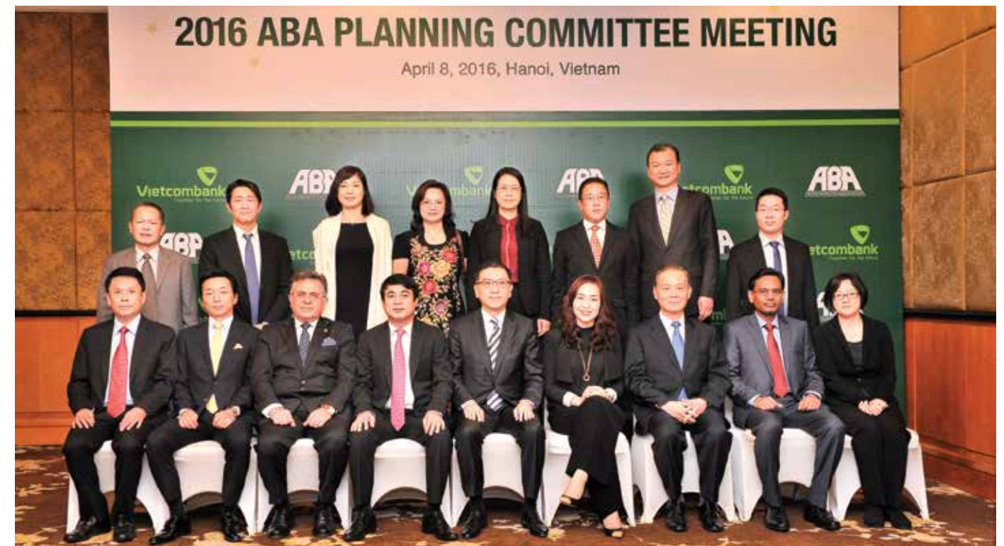
Các đại biểu chụp hình lưu niệm trước phiên họp