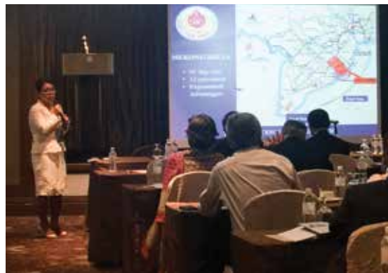
Đại diện tỉnh Trà Vinh giới thiệu về tiềm năng của tỉnh

Ngày 24/3/2016, Trưởng Văn phòng đại diện (VPĐD) Vietcombank tại Singapore đã tham dự Hội nghị Xúc tiến đầu tư do Đại sứ quán Việt Nam tại Singapore phối hợp với UBND tỉnh Trà Vinh tổ chức. Hội nghị quy tụ gần 100 nhà đầu tư Singapore