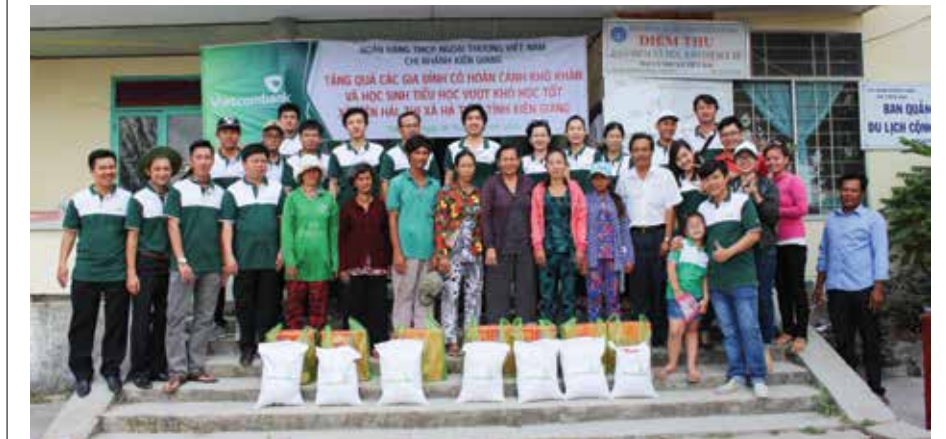
Vietcombank Kiên Giang thăm và tặng quà cho những gia đình có hoàn cảnh khó khăn và có con vươn lên trong học tập

Ngày 26/3/2016, Đoàn cơ sở Vietcombank Kiên Giang tổ chức phối hợp với Đảng ủy, chính quyền địa phương xã Tiên Hải - một trong những xã còn gặp nhiều khó khăn về đời sống thuộc thị xã Hà Tiên đến thăm và tặng 50 phần quà cho 25 hộ có hoàn cảnh khó khăn và 25 cháu học sinh nghèo vươn lên vượt khó trong học tập và đạt thành tích tốt của địa phương này. Mỗi phần quà trị giá 300 đồng tuy không phải là lớn về vật chất nhưng với tấm lòng chia sẻ của đoàn viên thanh niên Vietcombank đã thể hiện phần nào trách nhiệm của các bạn đoàn viên đối với đồng bào nơi biên giới. □