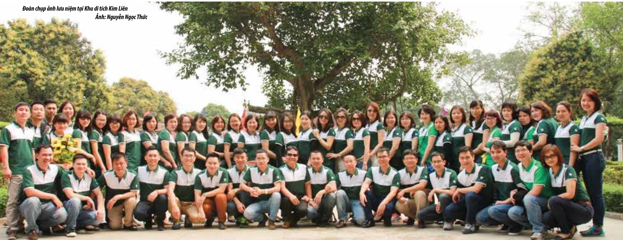
Đoàn chụp ảnh lưu niệm tại Khu di tích Kim Liên

“ Dẫu đã qua cả thế kỷ, vạn vật đổi thay nhưng những hình ảnh xưa cũ của làng Sen gắn liền thời thơ ấu của Bác vẫn được cất giữ đến bây giờ như một miền ký ức đẹp và là tấm gương cho mọi thế hệ. ”