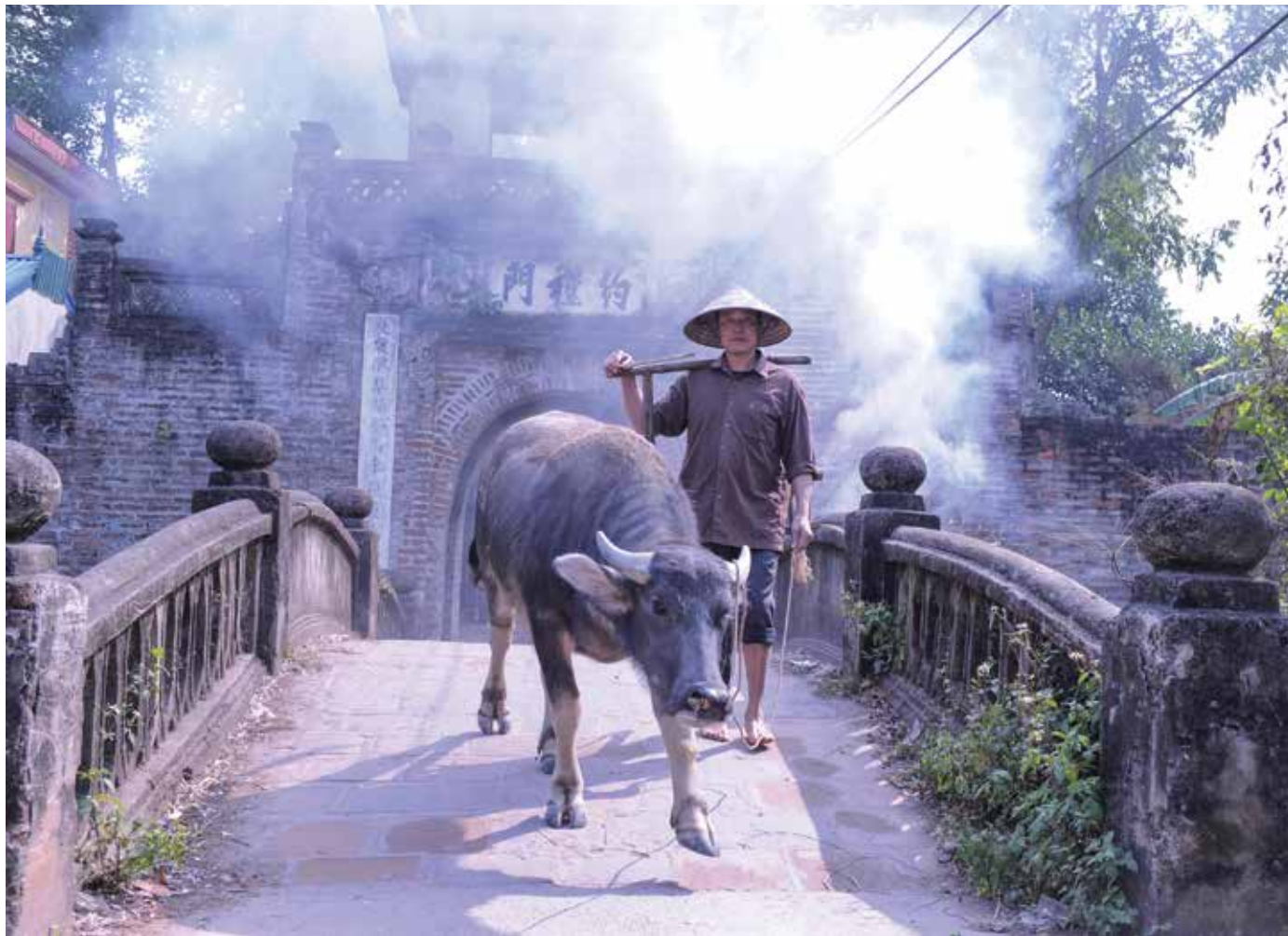
Cổng làng cổ còn sót lại đến nay