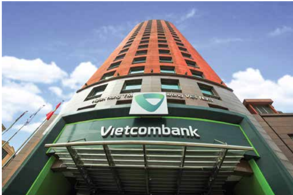
Trụ sở chính Vietcombank