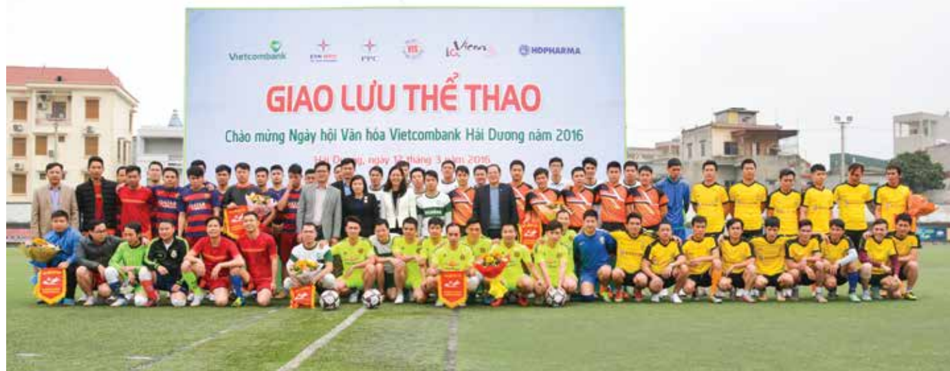
Các đại biểu chụp ảnh cùng 6 đội bóng trong ngày Hội văn hóa Vietcombank Hải Dương

Ấn tượng đặc sắc trong Ngày hội văn hoá năm nay là tôi được Ban tổ chức phân công phục vụ cuộc thi vẽ tranh, viết chữ đẹp của các cháu thiếu nhi là con của cán bộ chi nhánh, con của khách hàng. Hội thi đã thu hút hơn 300 cháu tham gia ở các bộ môn: tô màu, viết chữ đẹp và vẽ tranh. Để tổ chức hội thi,