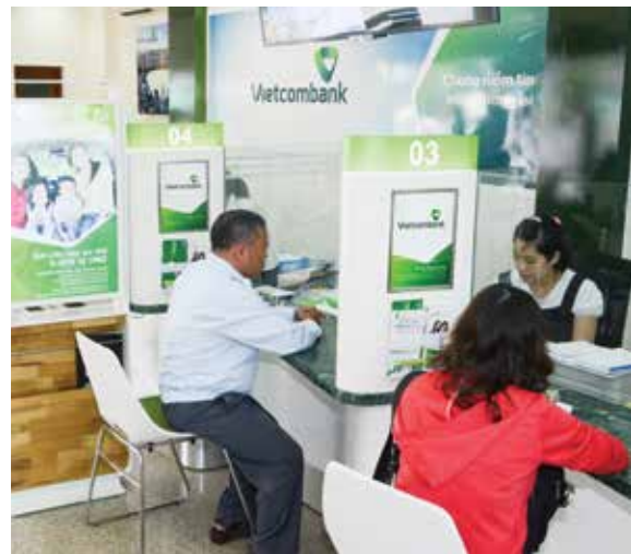
Khách hàng giao dịch tại Vietcombank

Không chỉ đảm bảo an toàn, hiệu quả cho hoạt động của mình, trong những thời điểm khó khăn của ngành ngân hàng Việt Nam, thực hiện chỉ đạo của Chính phủ và NHNN, Vietcombank còn tham gia vào việc chấn chỉnh, củng cố,