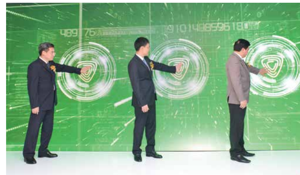
Lãnh đạo Vietcombank, Đảng ủy khối DNTW và Ngân hàng Nhà nước bấm nút khai trương Vietcombank Digital Lab

Với Vietcombank Digital Lab, thay vì phải xếp hàng chờ đợi tại quầy, khách hàng dễ dàng khởi