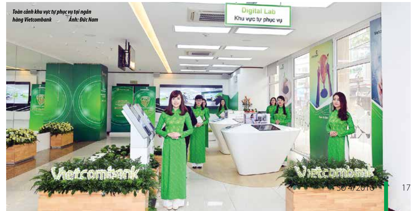
Toàn cảnh khu vực tự phục vụ tại ngân hàng Vietcombank

Từ những năm 1990, Vietcombank đã triển khai cung ứng các dịch vụ ngân hàng hiện đại và trở thành ngân hàng luôn tiên phong ứng dụng các sản phẩm dịch vụ trên nền tảng công nghệ tiên tiến với chất lượng tốt nhất cho khách hàng. Vietcombank hiện chiếm đến 25% tổng số khách hàng sử dụng ngân hàng trực tuyến Internet Banking, 62% thị phần doanh số thanh toán thương mại điện tử, 55% doanh số thanh toán hóa đơn hàng hóa dịch vụ trên các kênh điện tử, 37% doanh số thanh toán thẻ nội địa và 45% doanh số thanh toán thẻ quốc tế. Với việc ra mắt Digital Lab, Vietcombank kỳ vọng đạt được con số 40% lượng giao dịch thực hiện trên các kênh ngân hàng điện tử và thu hút khoảng 50% lượng khách hàng sử dụng các dịch vụ ngân hàng điện tử như internet banking, mobile banking. □