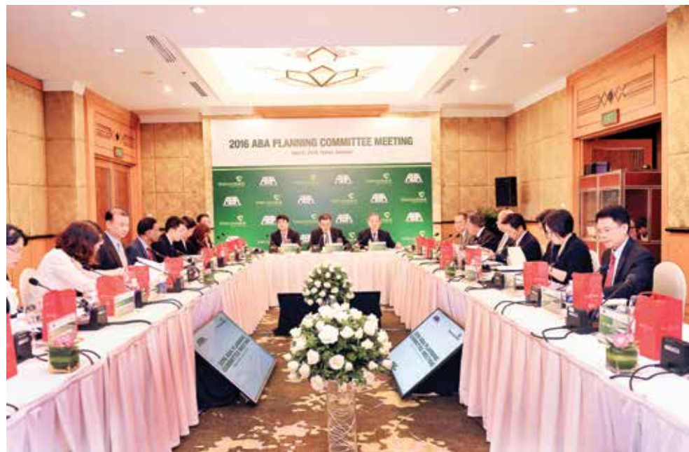
Toàn cảnh phiên họp Ủy ban Kế hoạch ABA tại Thủ đô Hà Nội, Việt Nam