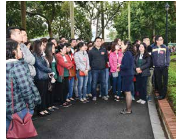
Các quần chúng ưu tú thuộc Đảng ủy Vietcombank nghe giới thiệu về cuộc đời và sự nghiệp của Bác Hồ tại Phủ Chủ tịch

Sau 2 buổi học lý thuyết trên lớp với các nội dung cơ bản (Khái quát lịch sử Đảng Cộng sản Việt Nam; Cương lĩnh xây dựng đất nước trong thời kỳ quá độ lên Chủ nghĩa xã hội; Học tập và làm theo tư tưởng tấm gương đạo đức HCM; Nội dung cơ bản điều lệ Đảng cộng sản Việt Nam và bài Phấn đấu