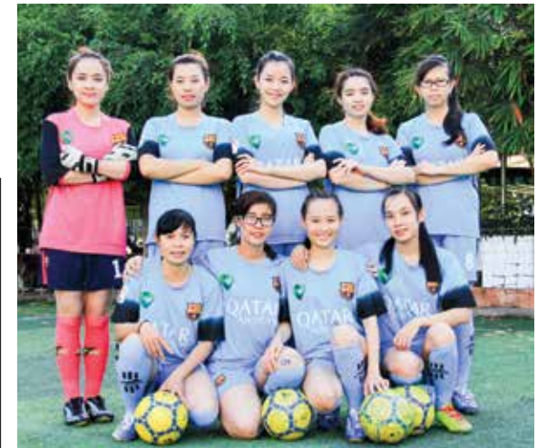
Đội bóng đá nữ Chi đoàn Vietcombank Sóc Trăng

Sau nhiều ngày thi đấu vất vả, Chi đoàn Vietcombank Sóc Trăng đã để lại dấu ấn thật đẹp trong lòng tất cả mọi người. Kết quả đội bóng đạt được giải Nhì môn bóng đá nữ, đã hoàn thành vượt chỉ tiêu đề ra của Ban huấn luyện và BCH Chi đoàn. Các bạn trong đội tuyển bóng đá nữ đã thi đấu với quyết tâm cao, máu lửa nhất để mang đến chiến thắng và những cảm xúc vui tươi phấn khởi