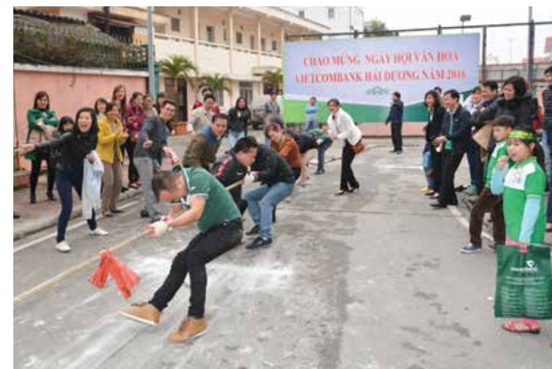
Các cán bộ và người thân tham gia trò chơi kéo co