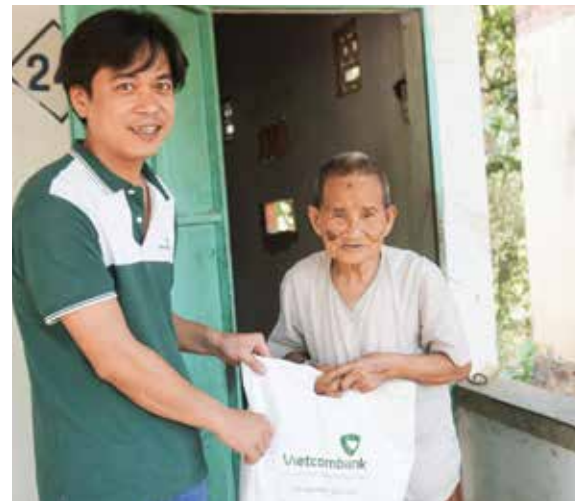
Đoàn TN Vietcombank Gò Vấp tặng quà cho các cụ già không nơi nương tựa