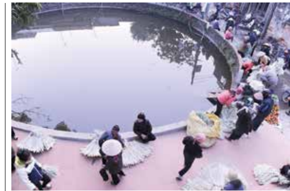
Giếng làng - nơi tụ họp của người dân

Tôi còn nhớ, làng tôi có hình dài tựa như một con rồng, với cái đầu rồng thì hướng đầu về vạt bãi bồi ven sông, còn cái đuôi của con rồng kéo dài xa tít bên nương ngô mướt xanh. Chẳng vậy mà làng có tên Thăng Long, nghĩa là thế của rồng bay! Theo như các bậc tiền bối của làng kể lại thì, cách đây mấy trăm năm, khi dân chài lưới trên sông thấy quang đất bãi bồi phẳng phiu, màu mỡ đã dừng chân lập làng sinh sống. Mới đầu chỉ có một ít hộ dân, qua thời gian, số hộ dân cứ nhiều lên để rồi làng phình to, chiếm hết khoảng diện tích bãi bồi ven sông. Bến đò nằm ở đoạn giữa của làng, nơi ấy cũng có một cái chợ gọi là chợ Bến. Chợ họp cách ba ngày một phiên, là nơi mua bán trao đổi hàng hóa nông thổ sản của các làng trong vùng, cũng như các làng ở bên kia sông mang sang. Những ngày bình thường thì bến đò chỉ thưa thớt vài chuyến đưa đón khách qua sông, còn những hôm có phiên chợ thuyền qua lại tấp nập nhộn nhịp cả một khúc sông. Tôi cũng hay được mẹ cho đi theo ra chợ với nhiệm vụ giúp mẹ trông quang gánh ngoài