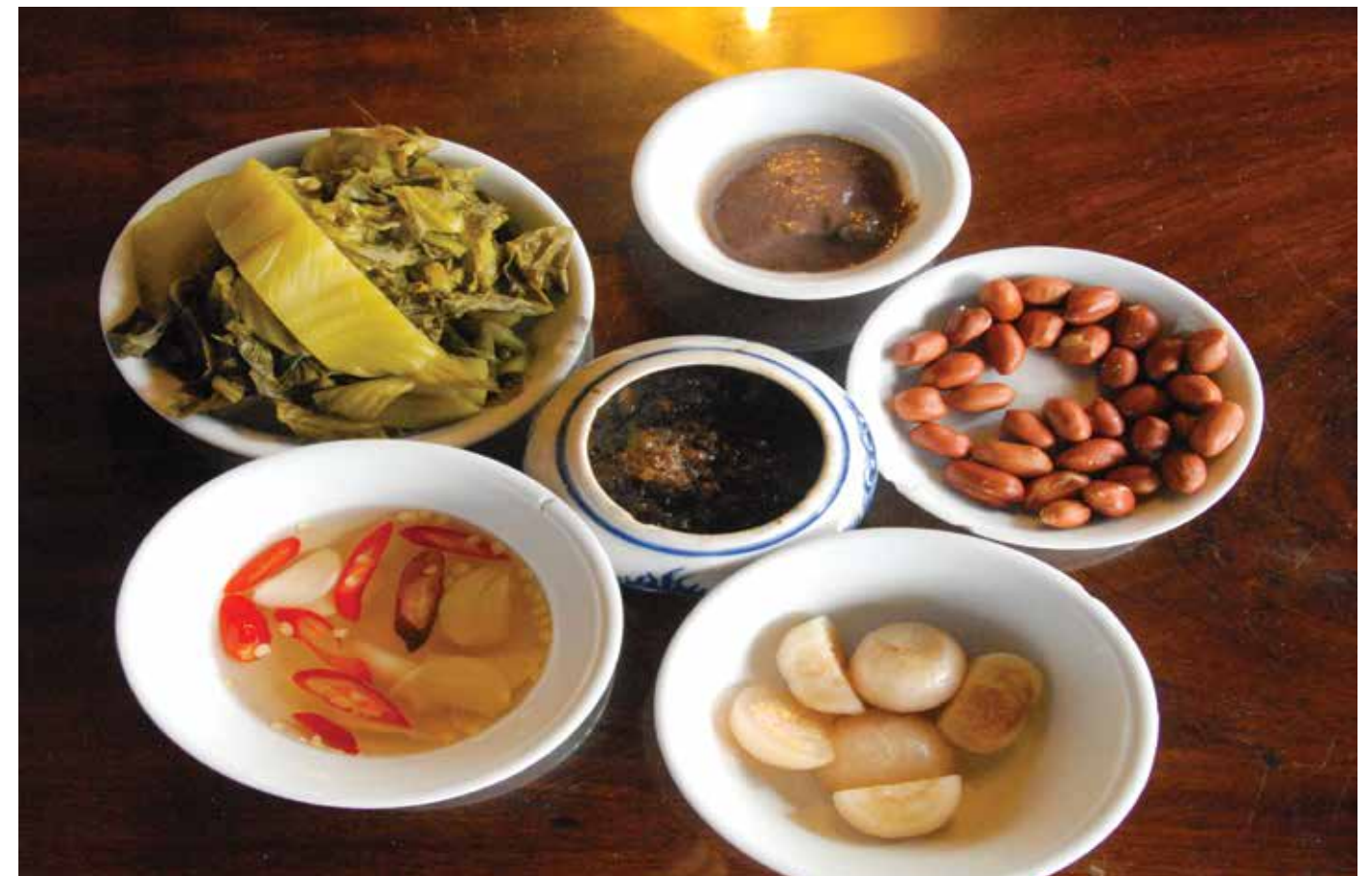
Bát mắm tép làm món gia vị quen thuộc trong mâm cơm

Cơm dùng để làm mắm tép được nấu từ loại gạo xay vừa phải, nếu là gạo lứt hoặc gạo còn vỏ lụa càng tốt. Sau khi nấu chín, cơm được xới tơi, để cho thật nguội một thời gian và lấy một vài tép tòi, một vài quả ớt, gừng tươi giã nhỏ trộn với một vài thìa rượu