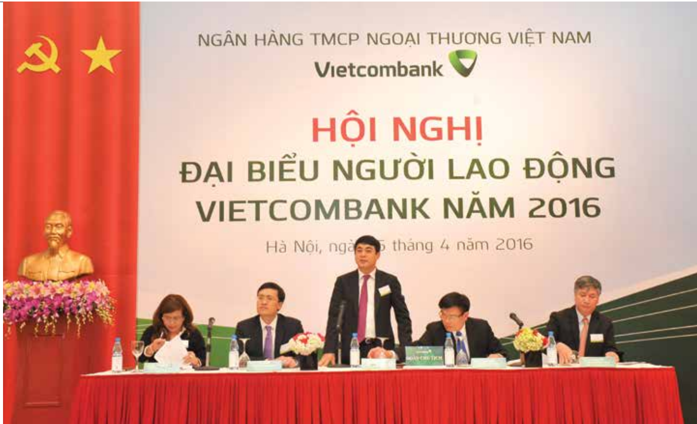
Đoàn chủ tịch điều hành Hội nghị