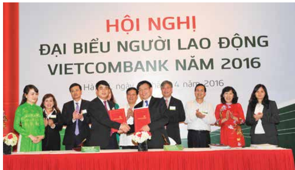
Lễ ký thỏa ước lao động tập thể Vietcombank năm 2016