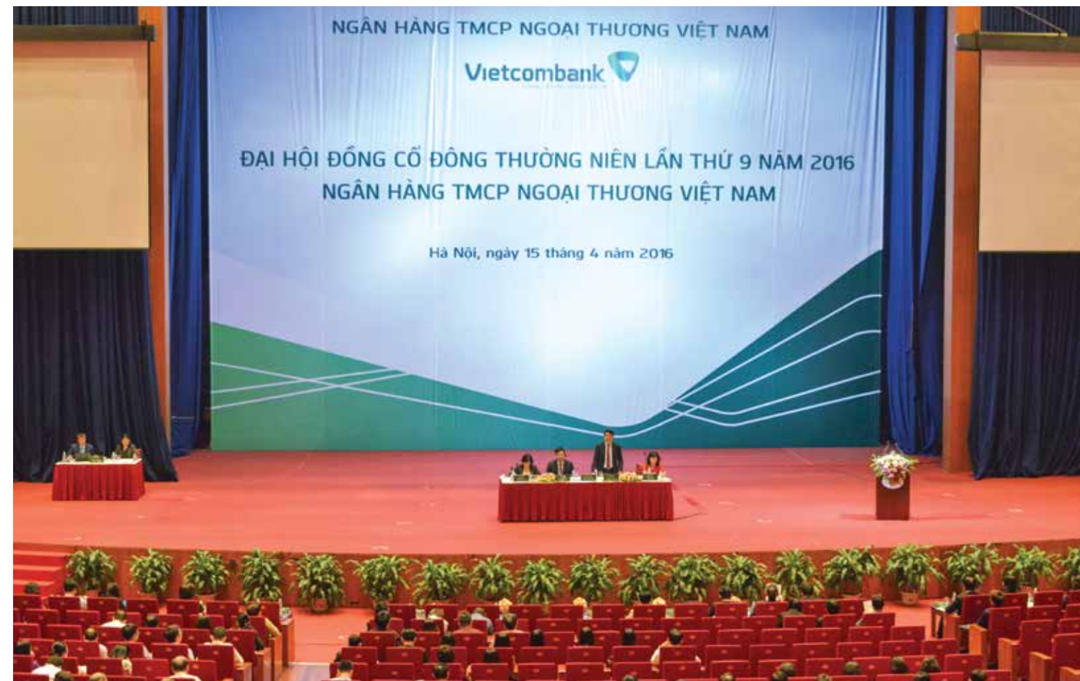
ĐHĐCĐ Vietcombank lần thứ 9 diễn ra tại Hà Nội ngày 15/4/2016.

Sau nửa ngày làm việc nghiêm túc, hiệu quả, ĐHĐCĐ Vietcombank lần thứ 9 năm 2016 đã kết thúc và thành công tốt đẹp khi các báo cáo và tờ trình đều được thông qua với tỷ lệ gần như tuyệt đối. □