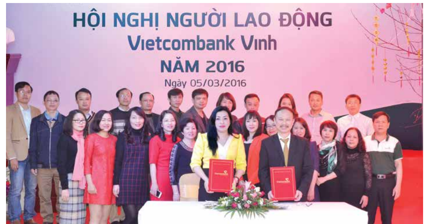
Lễ ký kết "Thỏa ước lao động tập thể 2016"