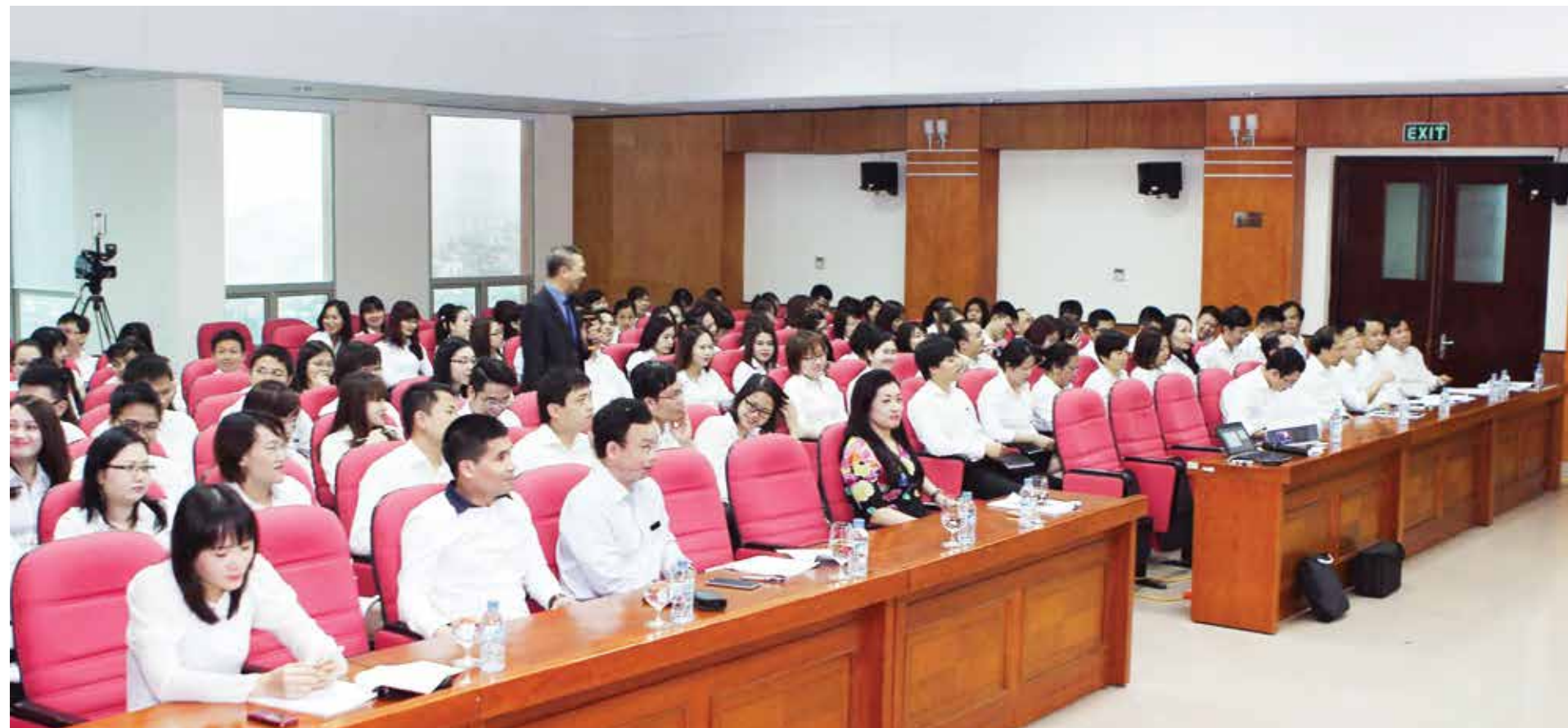
Quang cảnh học viên dự Lớp đào tạo kỹ năng bán hàng nâng cao của Vietcombank Vinh

Đầu tư phát triển nguồn nhân lực chất lượng cao là một yếu tố quan trọng tạo nên nội lực vững mạnh, là nền tảng cho sự phát triển bền vững của hoạt động ngân hàng. Sau buổi đào tạo, nguồn sinh khí mới trong công tác bán hàng của Vietcombank Vinh như được tiếp thêm năng lượng, nguồn năng lượng dồi dào và bất tận. Sự nhiệt huyết tuổi trẻ được phát huy, kinh nghiệm được chia sẻ, cùng những hy vọng, quyết tâm hoàn thành, hoàn thành vượt mức kết quả kinh doanh của Vietcombank Vinh. □