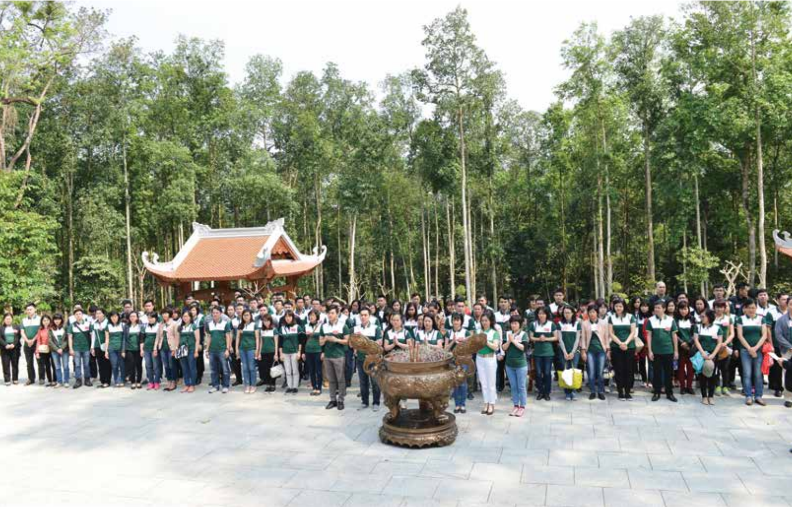
Đoàn dâng hương tại Khu di tích lịch sử K9 Đá Chông, Ba Vì, Hà Nội