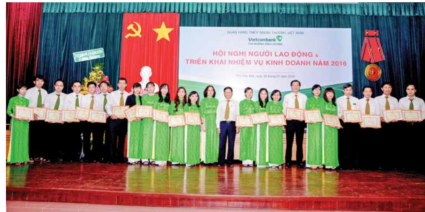
Các CBNV hoàn thành xuất sắc nhiệm vụ năm 2016 nhận Giấy khen của Vietcombank Bình Dương

Hội nghị NLĐ năm 2016 là kết quả của một năm lao động đầy nhiệt huyết, quyết tâm của tập thể Vietcombank Bình Dương; Nghị quyết được Hội Nghị thông qua sẽ là mục tiêu để tập thể Ban giám đốc và toàn thể CBNV Vietcombank Bình Dương đoàn kết, phấn đấu hoàn thành những nhiệm vụ mới được giao, hứa hẹn sẽ đạt những thắng lợi về vang hơn, góp phần vào sự phát triển của hệ thống; nâng tầm thương hiệu Vietcombank. □