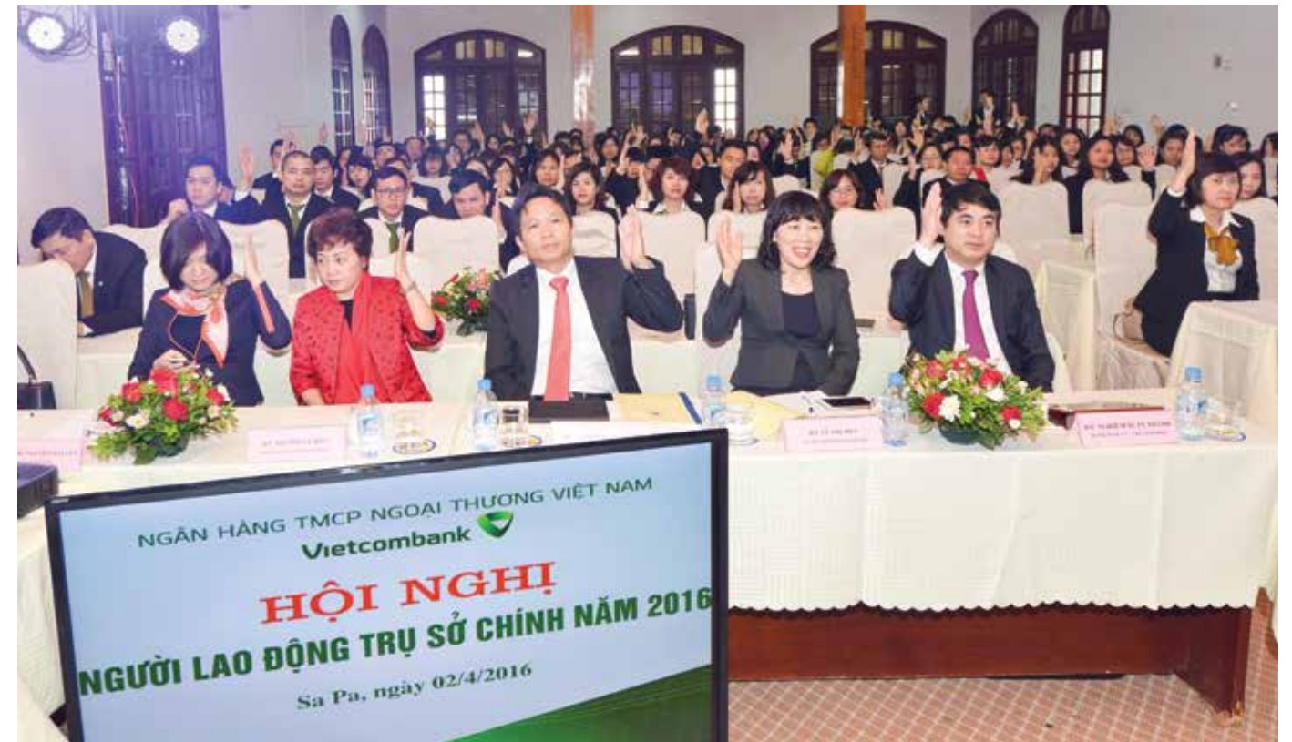
Các đại biểu nhất trí bầu Đoàn Chủ tịch