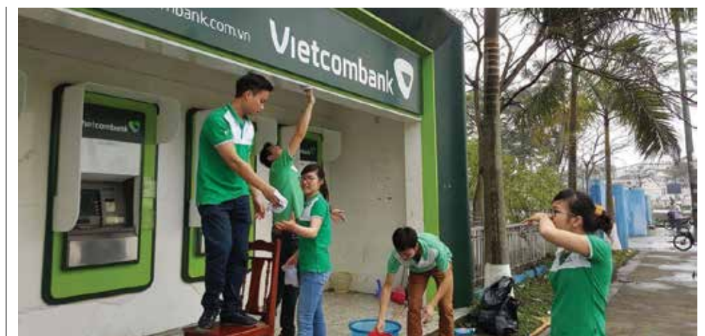
Vệ sinh ATM tại KCN Phố Mới A

Nhằm tăng cường tổ chức các hoạt động tuyên truyền về mục đích, ý nghĩa của việc xây dựng nếp sống văn minh đô thị cho cán bộ, Đoàn viên Thanh niên (ĐVTN); Tích cực tuyên truyền, phổ biến kiến thức, nâng cao nhận thức, hướng tới thay đổi hành vi cho ĐVTN về vệ sinh cộng đồng, bảo vệ môi trường, ứng phó biến đổi khí hậu, bảo vệ nguồn nước; Duy trì các đội Thanh niên tình nguyện, Thanh niên xung kích trong bảo vệ môi trường, văn minh đô thị; đồng thời hướng tới các hoạt động kỷ niệm 85 năm ngày thành lập Đoàn thanh niên cộng sản Hồ Chí Minh (26/3/1931 - 26/3/2016), ngày 20/3/2016, Đoàn