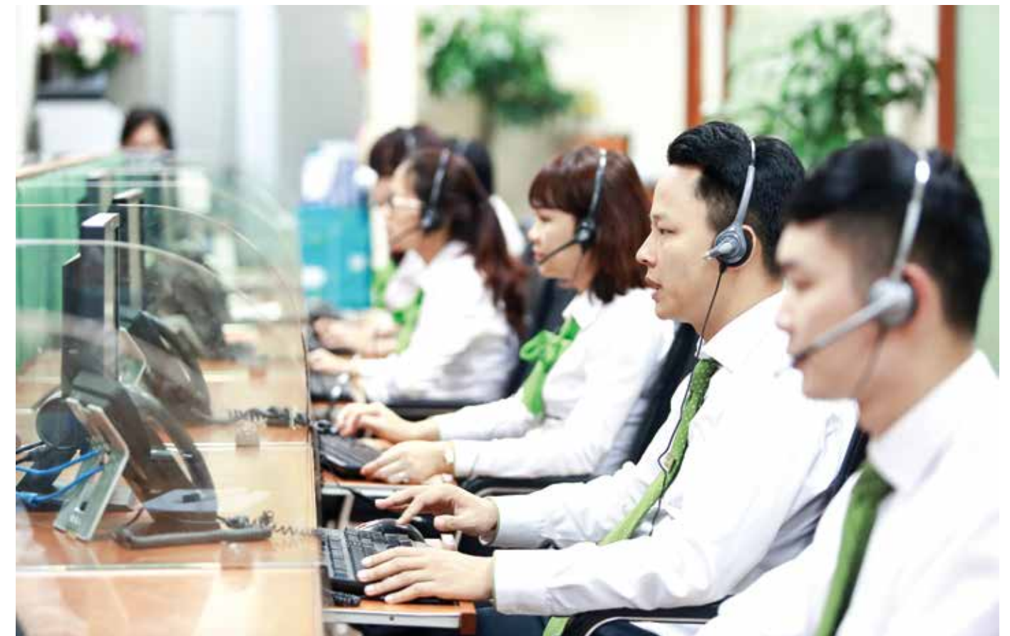
Trung tâm Dịch vụ khách hàng của Vietcombank

Hơn 50 năm dựng xây, phát triển và cống hiến không chỉ tạo nên một thương hiệu lớn mang tên Vietcombank mà còn tạo dựng nên một văn hoá Vietcombank, một cốt cách Vietcombank rất đáng tự hào với những đặc trưng riêng có: Tin cậy, Chuẩn mực, Sẵn sàng đổi mới, Bền vững và Nhân văn. Thương hiệu và Văn hóa chính là những nhân tố đã tạo nên sức mạnh, giúp Vietcombank vượt qua những bước thăng trầm cùng lịch sử, luôn vươn đến những đỉnh cao mới, với những thành công tiếp nối thành công. □