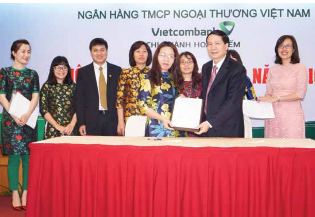
Lễ ký kết thỏa ước lao động tập thể