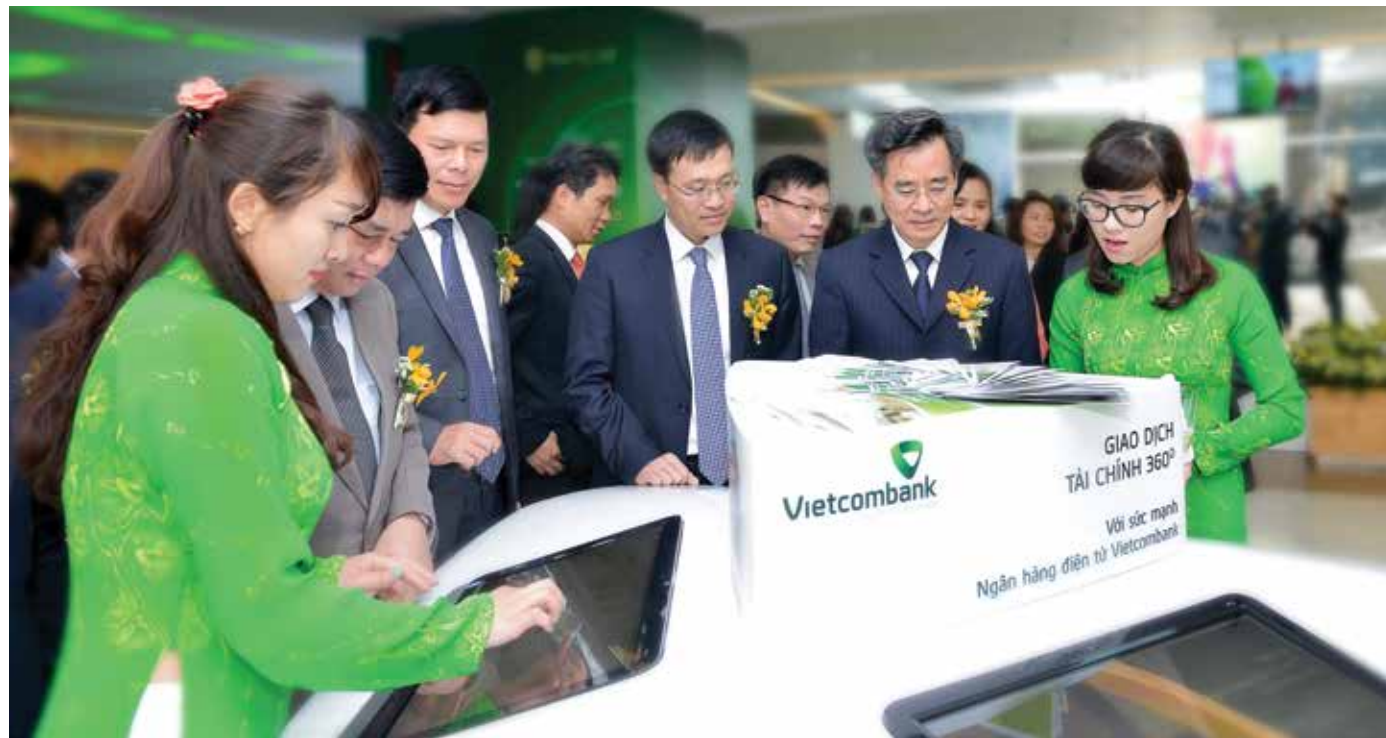
Các đại biểu tham quan và trải nghiệm dịch vụ Vietcombank Digital Lab