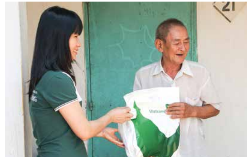
Đoàn TN Vietcombank Gò Vấp tặng quà cho các cụ già không nơi nương tựa

Cuộc sống sẽ đẹp hơn, sẽ hạnh phúc hơn rất nhiều khi được sẻ chia! □