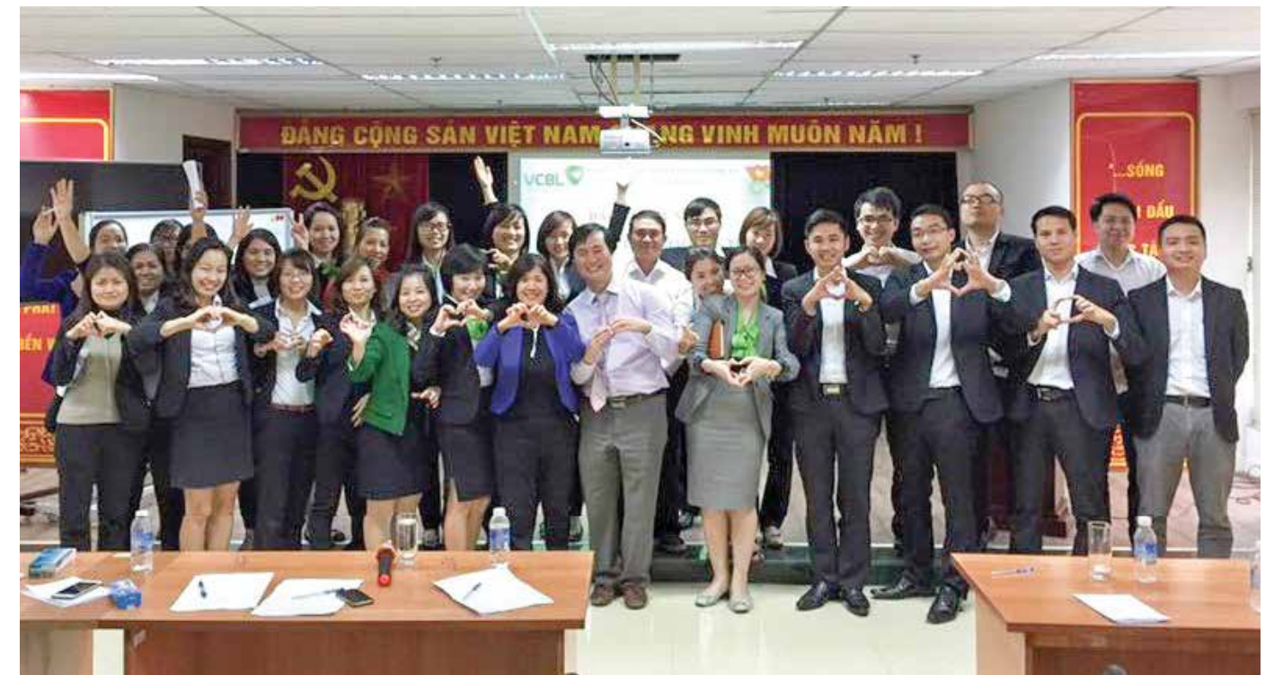
Tập huấn “Chiến lược lãnh đạo bản thân” của Đoàn TN Vietcombank Leasing

sẻ, nói lời cảm ơn đến những người bạn, người đồng nghiệp của mình, có những tiếng cười và cả những giọt nước mắt vì hạnh phúc, vì chúng ta được ở bên nhau. Buổi nói chuyện của anh Hiếu đã giúp cho mọi người khám phá thế giới bên trong để hiểu mình hơn, để nhận thức đúng đắn, tư duy tích cực hơn từ đó xây dựng các kế hoạch hành động nhằm đạt được những mục tiêu và ước mơ trong cuộc sống. Một bức tranh đẹp là một bức tranh sinh động với nhiều màu sắc, hãy cùng VCBL “tô màu cho bức tranh cuộc sống sinh động”.