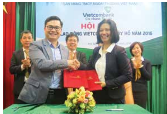
Thỏa ước lao động tập thể sửa đổi được thông qua và ký kết