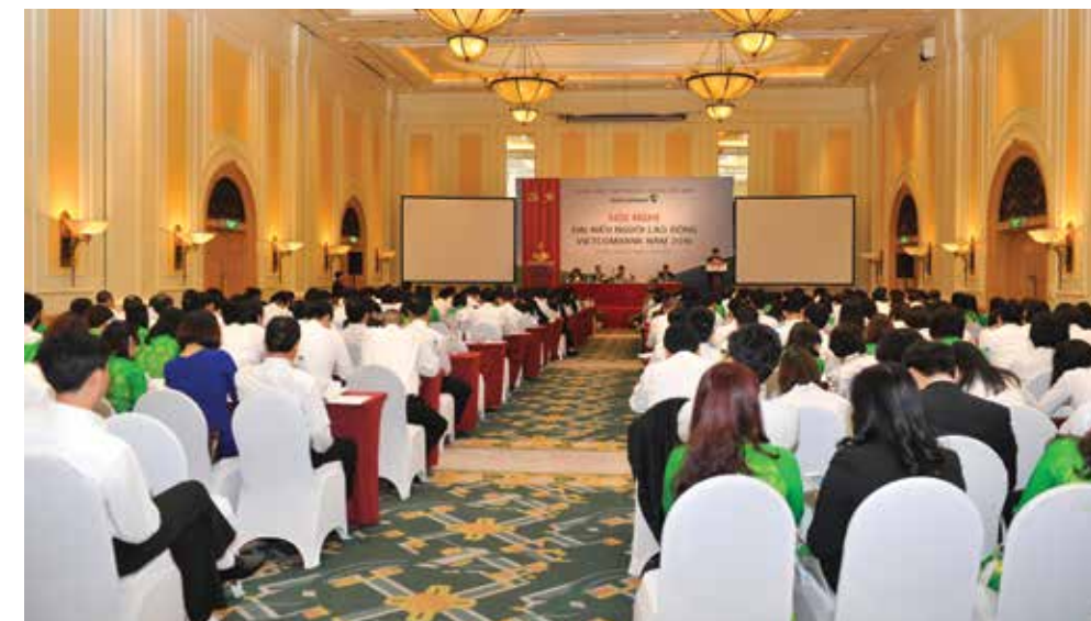
Toàn cảnh Hội nghị

Phát biểu kết luận Hội nghị đồng chí Bí thư Đảng ủy - Chủ tịch HĐQT cho rằng: Với những mục tiêu đã đặt ra cùng nhiều nhiệm vụ khó khăn phía trước của toàn hệ thống Vietcombank, do vậy trong thời gian tới hệ thống Vietcombank thực hiện theo đúng phương châm hoạt động "Tăng tốc - Hiệu quả - Bền vững" và quan điểm chỉ đạo điều hành "Quyết liệt - Kết nối - Trách nhiệm" để đạt được các mục tiêu mà Đại hội đồng cổ đông thường niên Vietcombank lần thứ 9 vừa đề ra. Mỗi cán bộ Vietcombank cần phát huy tinh thần trách nhiệm trong việc nghiêm túc thực hiện nội quy lao động, xung kích trên cương vị công tác của mình để hoàn thành xuất sắc nhiệm vụ, chỉ tiêu của Ban lãnh đạo giao và sớm đạt được là ngân hàng số 1 Việt Nam. □