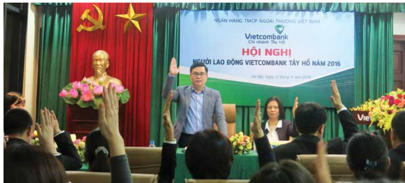
Biểu quyết tại Hội nghị

Nghị quyết Hội nghị Người lao động năm 2016 đã được thông qua với sự đồng thuận và nhất trí cao của toàn thể Hội nghị. □