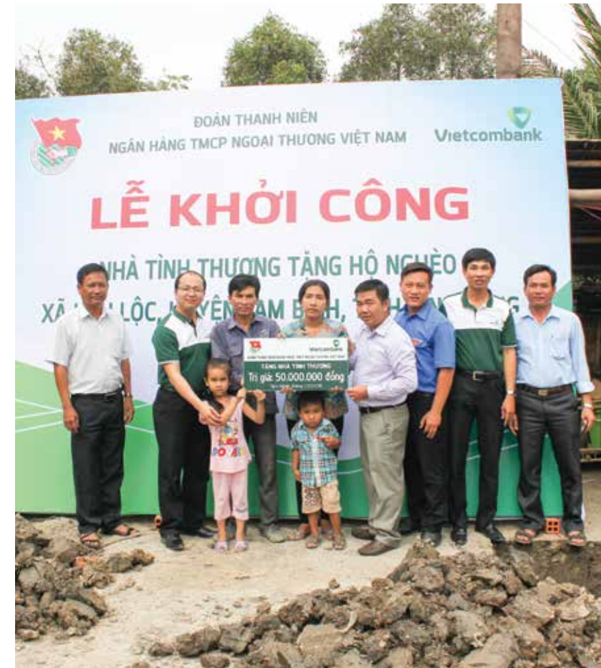
Đoàn Vietcombank trao tặng nhà tình nghĩa trị giá 50 triệu đồng