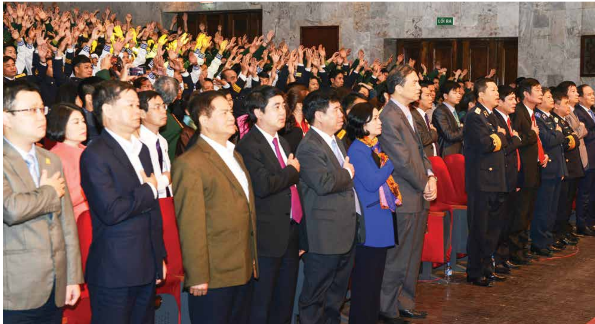
Các đại biểu bày tỏ sự xúc động đối với phần trình diễn “Tổ quốc gọi tên mình” trong chương trình nghệ thuật “Xuân Trường Sa” 2016