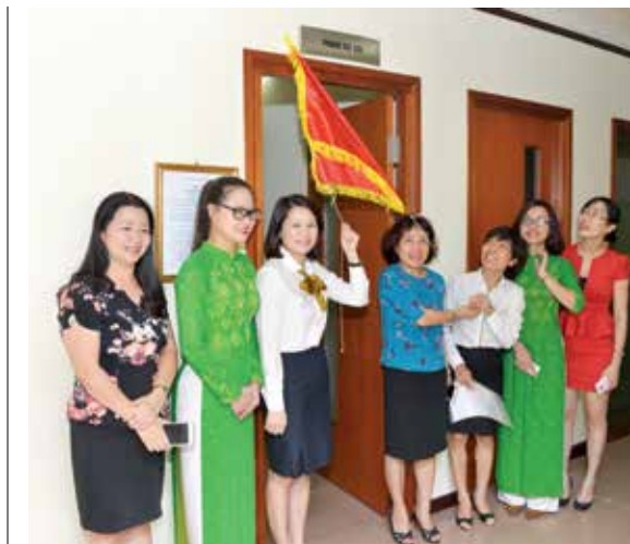
Vietcombank khai trương Phòng vật sửa dành cho Lao động nữ đang nuôi con nhỏ

Cũng trong năm 2015 vừa qua, Vietcombank tổ chức Hội nghị Đại biểu Người lao động là sự kiện chính trị quan trọng đối với cán bộ, nhân viên (CBNV) và người lao động (NLĐ) toàn hệ thống nhằm mục đích phát huy dân chủ trực tiếp của NLĐ, tạo điều kiện để NLĐ được biết, được bàn, được tham gia ý kiến, được quyết định và giám sát những vấn đề có liên quan đến quyền lợi, nghĩa vụ và trách nhiệm của mình. Tại Hội nghị này đã thông qua nội quy lao động, quy chế đối thoại, quy chế tổ chức Hội nghị NLĐ của Vietcombank và đặc biệt thông qua bản thoả ước lao động tập thể. Bản thoả ước lao động tập thể đã được ký kết giữa Chủ tịch Công đoàn (đại diện người lao động) với Chủ tịch HĐQT Vietcombank (người sử dụng lao động). Theo đánh giá