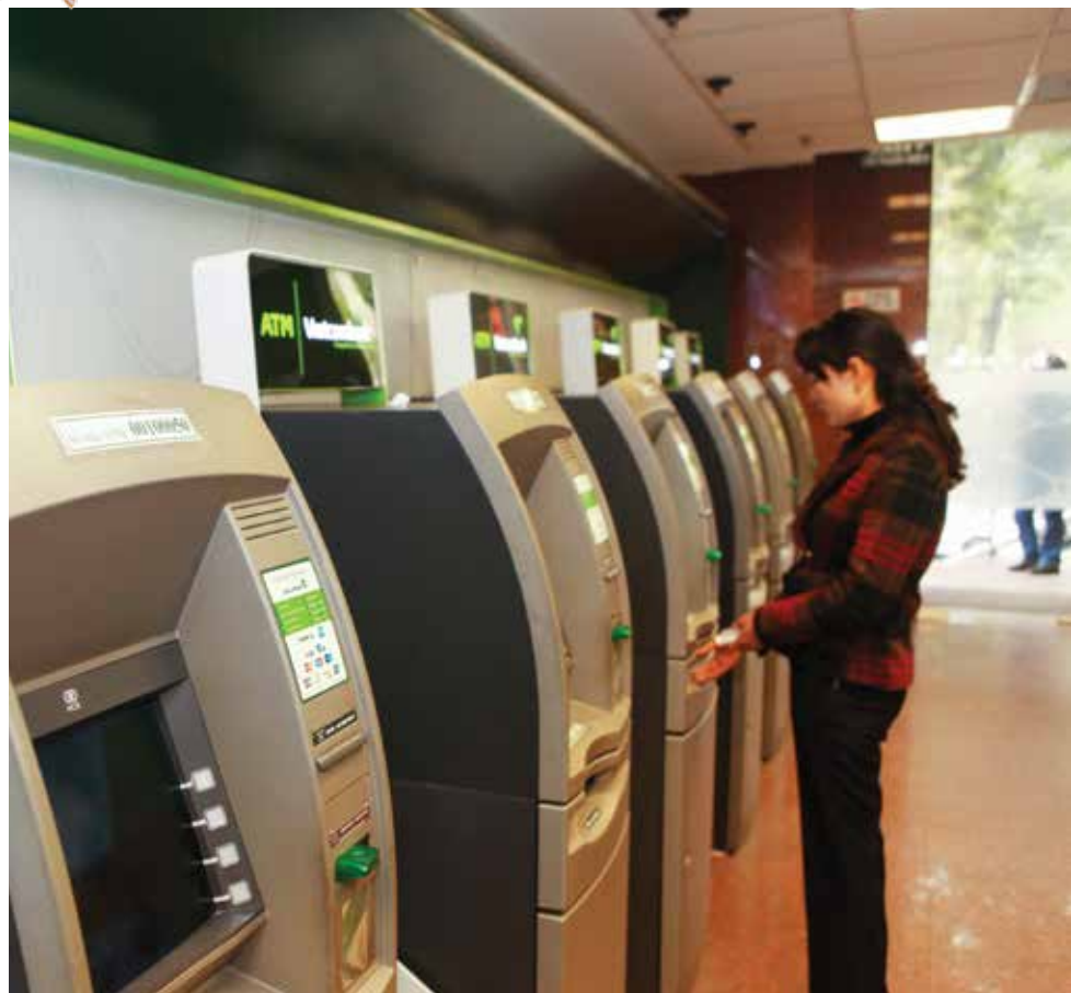
Máy rút tiền ATM của Vietcombank