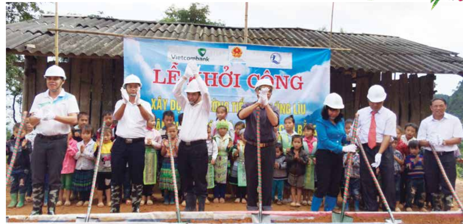
Động thổ xây dựng trường Tiểu học Lũng Liu do Vietcombank tài trợ 4,6 tỷ đồng