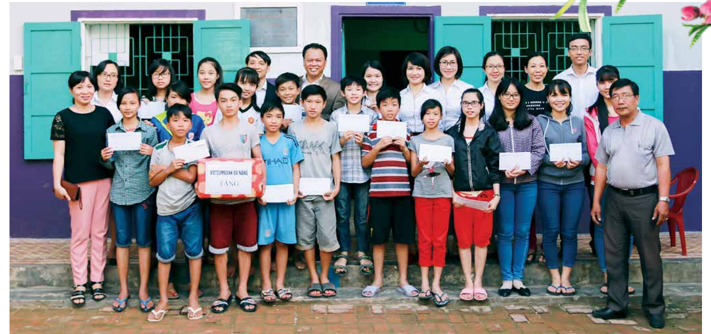
Thăm và tặng quà Trẻ em đường phố Đà Nẵng