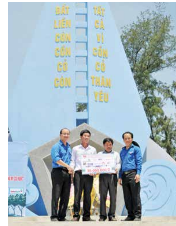
Góp sức xây dựng tương lai tại Côn Đảo

Trong năm 2015, hoạt động tình nguyện vì cuộc sống cộng đồng và an sinh xã hội đã đạt kết quả cao với nhiều hoạt động ý nghĩa, tiêu biểu như: xây dựng 2 con đường Thanh niên tại huyện Quế Phong, tỉnh Nghệ An; trao tặng 8 căn nhà tình thương cho các hộ nghèo tại 8 tỉnh trên địa bàn cả nước; trao tặng 35 bộ máy tính nối mạng Internet; tổ chức Chương trình "Bữa cơm nhân ái" tại Viện Huyết học và Truyền máu Trung ương; tổ chức các đoàn trao tặng quà cho trẻ em có hoàn cảnh khó khăn, gia đình chính sách, đồng bào nghèo vùng cao nhân dịp Tết Nguyên đán và ngày thương binh liệt sỹ 27/7; các hoạt động hưởng ứng Cuộc vận động "Nghĩa tình biên giới hải đảo" tiếp tục được triển khai với các hoạt động thiết thực hướng về thân nhân cán bộ, chiến sỹ hải quân có hoàn cảnh khó khăn và hỗ trợ ngư dân vươn khơi bám biển. Tổng kinh phí thực hiện An sinh xã