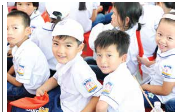
Niềm vui của trẻ em khi có ngôi trường mới

Luôn xác định an toàn, hiệu quả trong kinh doanh là mục tiêu hàng đầu, Vietcombank cũng luôn đề cao tính "Nhân văn" bởi đó là giá trị cốt lõi của văn hoá Vietcombank, quan tâm và dành một nguồn lực không nhỏ cho công tác an sinh xã hội là một trong những mục tiêu quan trọng được Vietcombank đề ra hàng năm. Bởi vậy nếu trong kinh doanh, Vietcombank luôn coi chữ "Tín" là kim chỉ nam thì với hoạt động xã hội, Vietcombank luôn lấy chữ "Tâm" làm gốc, luôn nỗ lực để đem lại những giá trị thiết thực, lâu dài trong các lĩnh vực phát triển, chăm sóc cộng đồng nhằm góp phần nâng cao chất lượng đời sống dân nghèo. Đó chính là thông điệp và cũng là cam kết "Chung niềm tin vững tương lai" mà Vietcombank muốn gửi gắm tới tất cả khách hàng cùng mọi người dân Việt. □