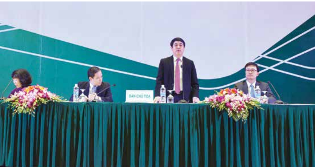
HDQT Vietcombank giải đáp câu hỏi của cổ đông - ĐHCĐ thường niên 2015