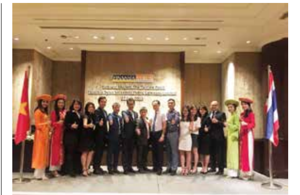
Đại diện Vietcombank tham gia Hội thảo đầu tư về Việt Nam tại Thái Lan, tháng 7/2015