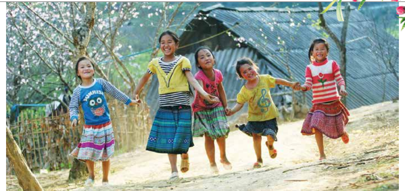
Ảnh: Như ý

Hòa chung niềm vui lớn, mùa Xuân năm 1946 cũng là mùa Xuân đầu tiên toàn dân ta thực hiện sứ mệnh cao cả của mình - Tổng tuyển cử bầu Quốc hội nước Việt Nam Dân chủ Cộng hòa, nhằm “Tò cho thế giới biết rằng dân Việt Nam ta đã kiên quyết đoàn kết chặt chẽ; kiên quyết chống bọn thực dân; kiên quyết đấu tranh quyền độc lập”. Vì, “từ xưa đến nay, toàn quốc chưa bao giờ tuyển cử vì xưa dân chưa bao giờ làm chủ mình, xưa dân phải nghe theo lời vua quan, sau phải nghe thực dân Pháp, Nhật... Ta phải hy sinh nhiều mới