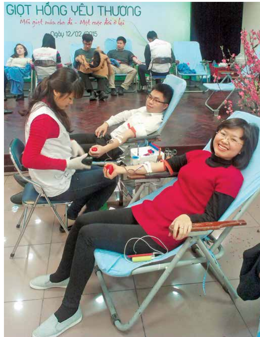
Hiến máu nhân đạo

Trong năm 2015, Đoàn Thanh niên Vietcombank đã hiến được 525 đơn vị máu, đạt 175% so với chỉ tiêu kế hoạch đề ra.