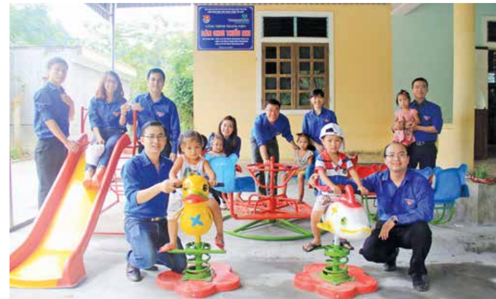
Xây dựng sân chơi thiếu nhi

Việc đảm nhận các công trình, phần việc thanh niên thực sự đã trở thành một phong trào thi đua sôi nổi giữa các đoàn viên thanh niên, giữa các Chi đoàn và giữa các Đoàn cơ sở; từ đó phát huy sức mạnh và