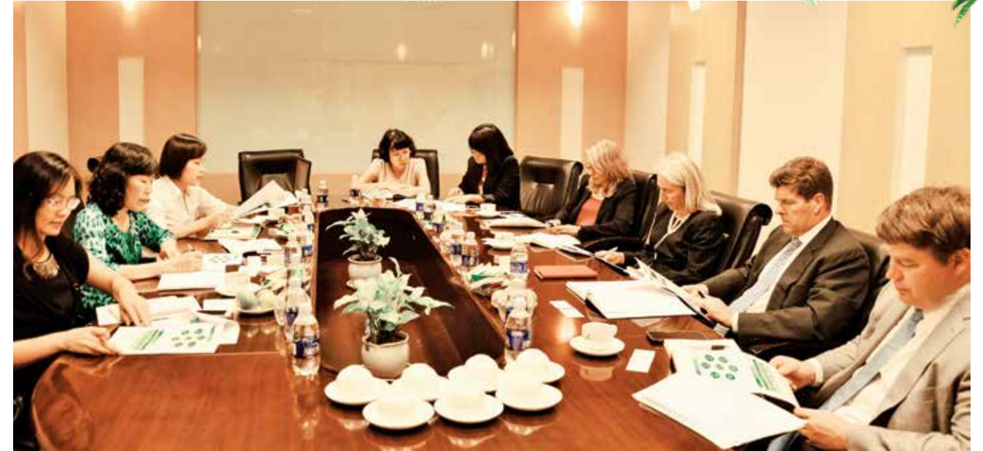
Đoàn Vietcombank làm việc với đối tác nước ngoài

Thứ nhất, tổ chức hoạt động IR đã được Ngân hàng định vị một cách chiến lược. Nghĩa là, được đầu tư nguồn nhân lực tốt nhất, được tiếp cận nhanh nhất, kịp thời và toàn diện nhất mọi cơ sở dữ liệu của Ngân hàng, được truyền tải kỹ lưỡng định hướng, chiến lược của lãnh đạo ngân hàng. Ngân hàng chiêu tập những cán bộ có kiến thức tốt nhất về tài chính, phân tích tài chính, có tư duy chiến lược cũng như những phẩm chất quan trọng của một IRO (Investor Relations