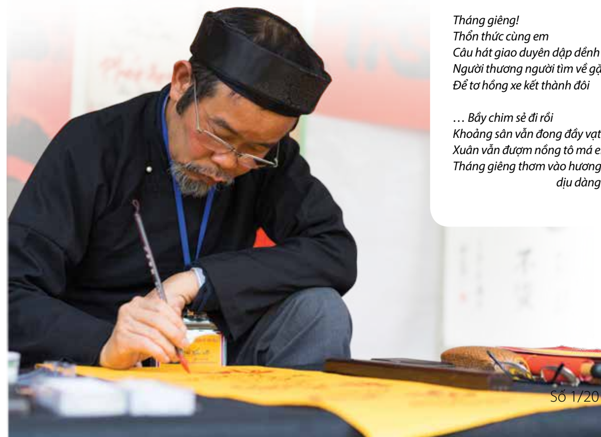
Ảnh trong trang thơ: CTV