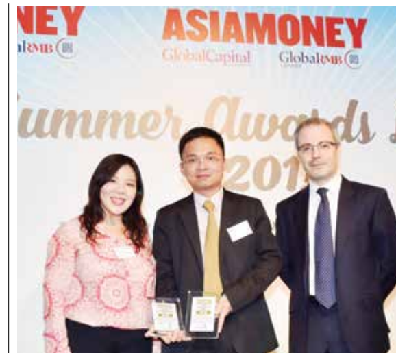
Đại diện Vietcombank nhận các giải do Asiamoney trao tặng