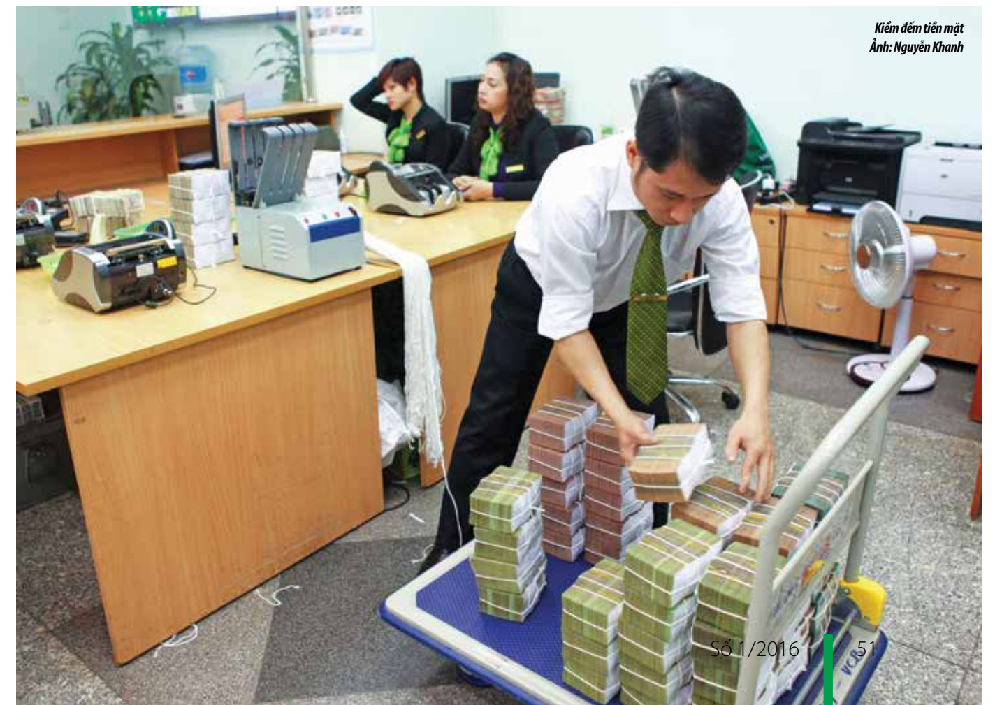
Kiểm đếm tiền mặt

“Ta thấy xuân nông thắm khắp nơi Trên đường rộn rã tiếng đua cười Động lòng nhớ bạn xuân năm ấy Cùng ngắm xuân về trên khóm mai” (“Giây phút chạnh lòng” của Thế Lữ) □