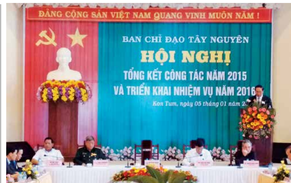
Đồng chí Trần Đại Quang - Ủy viên Bộ chính trị, Bộ trưởng Bộ công an, Trưởng Ban chỉ đạo Tây Nguyên phát biểu tại Hội nghị

trên 128 tỷ đồng. Trong đó các dự án mà Vietcombank đầu tư cho các chương trình an sinh xã hội đều tập