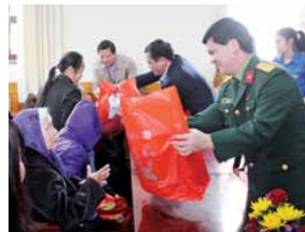
Đoàn trao tặng quà cho các Mẹ Việt Nam Anh hùng

Chương trình tình nguyện mùa Đông là một trong các hoạt động thường niên của đoàn viên thanh niên hướng đến đồng bào nghèo, các đối tượng chính sách tại các địa phương khó khăn nhằm giáo dục tinh thần tương thân tương ái, thể hiện tinh thần nhân văn trong văn hóa doanh nghiệp, đồng thời giáo dục truyền thống, nâng cao nhận thức và đạo đức của đoàn viên thanh niên, góp phần xây dựng lý tưởng sống cao đẹp, tạo dựng hành vi chuẩn mực, nhân văn.