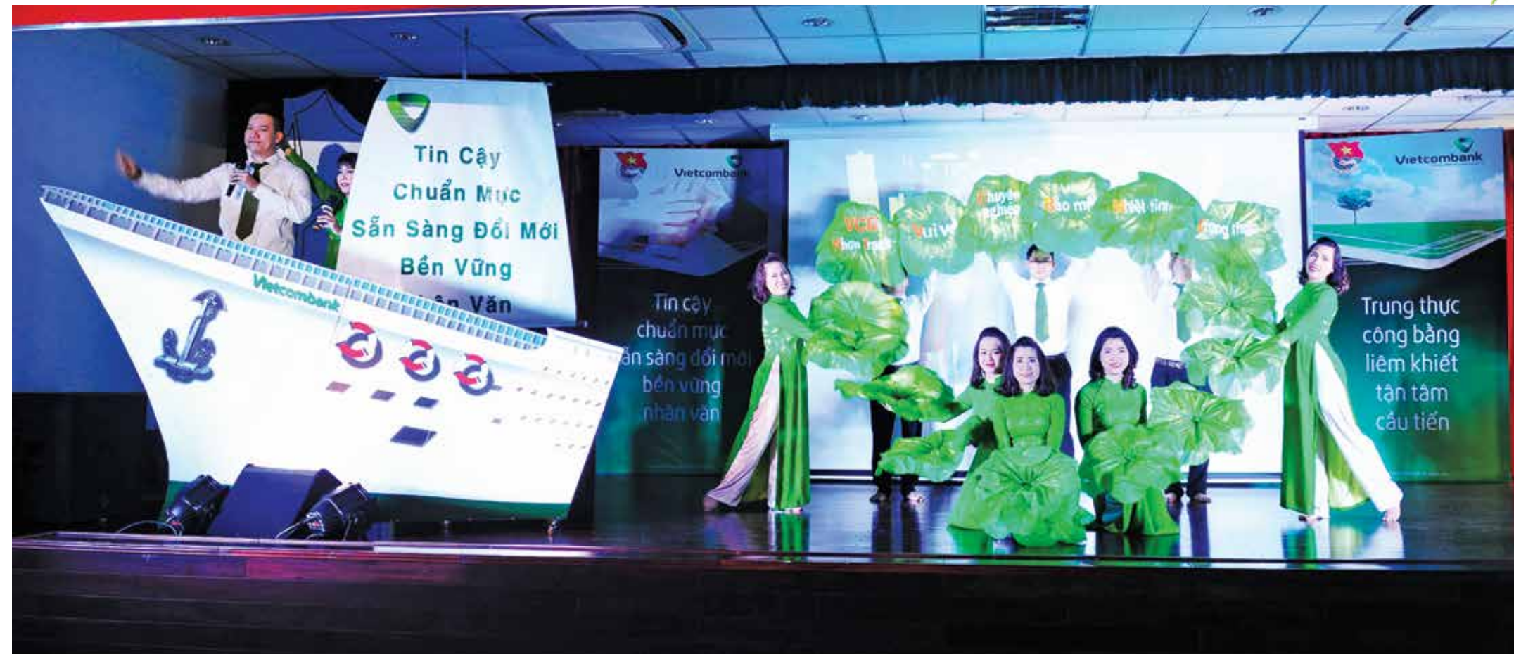
Hội thi Văn hóa Vietcombank

Với chủ đề công tác Đoàn và phong trào thanh niên năm 2015 “Tuổi trẻ tiến bước dưới cờ Đảng”, Đoàn Thanh niên Vietcombank đã đồng loạt triển khai rất nhiều hoạt động thiết thực, thi đua lập thành tích chào mừng Đại hội Đảng bộ Ngân hàng TMCP Ngoại thương Việt Nam lần thứ III, nhiệm kỳ 2015 – 2020 tiến tới Đại hội Đảng toàn quốc lần thứ XII.