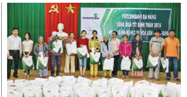
Thăm và tặng quà hộ gia đình nghèo xã Hòa Liên (Hòa Vang)

Ngoài Chương trình “Xuân yêu thương”, nhân dịp kỷ niệm 40 năm ngày thành lập Chi nhánh (30/4/1975 -30/4/2015), Vietcombank Đà Nẵng cũng đã trao tặng UBND TP Đà Nẵng 2 tỷ đồng hỗ trợ xây dựng và sửa chữa nhà cho người có công trên địa bàn. □