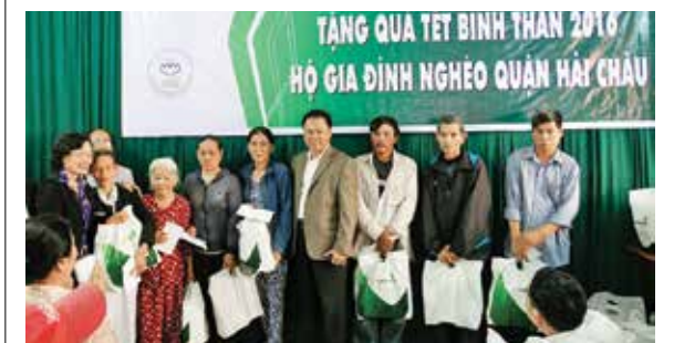
Thăm và tặng quà hộ gia đình nghèo quận Hải Châu