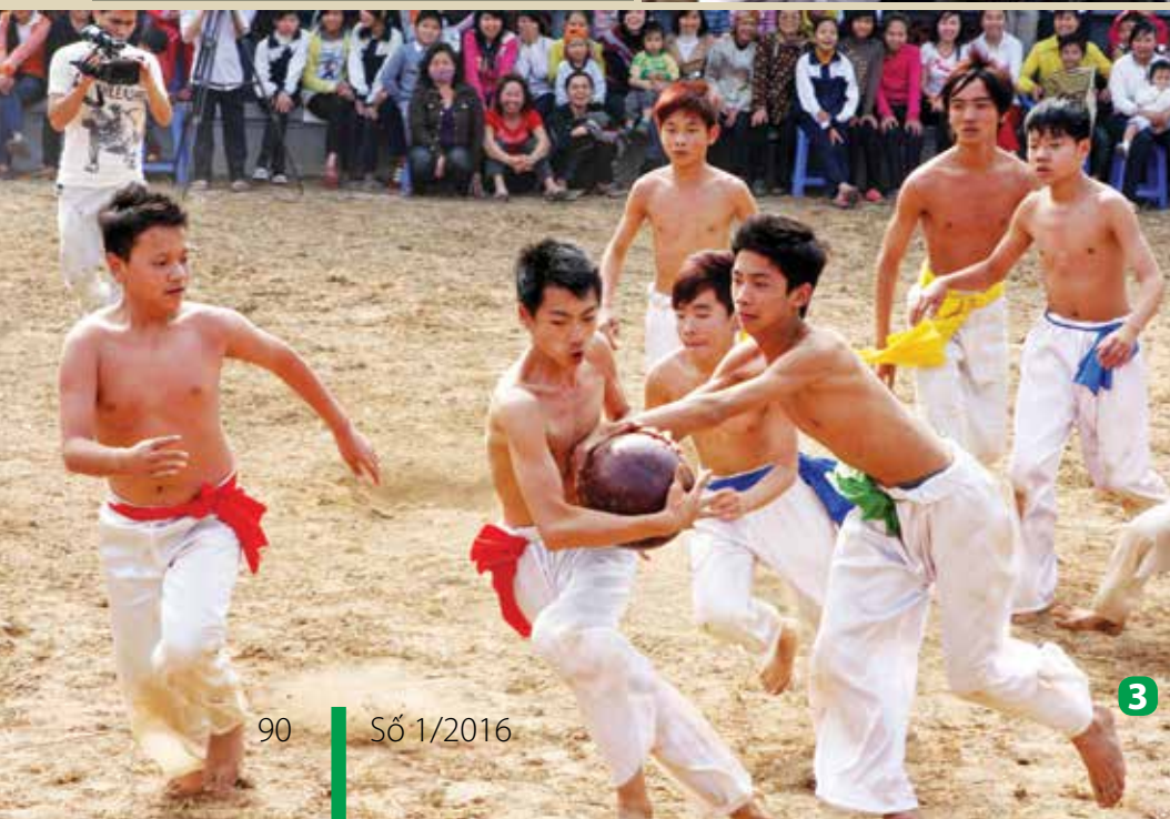
1, 3: Đồ vật các hạng cân tham gia vật cầu. 2: Các cụ cao niên tham dự hội vật. 4: Các cháu thiếu nhi trong làng biểu diễn văn nghệ tại hội vật cầu. 5: Dòng đảo du khách chứng kiến hội vật cầu