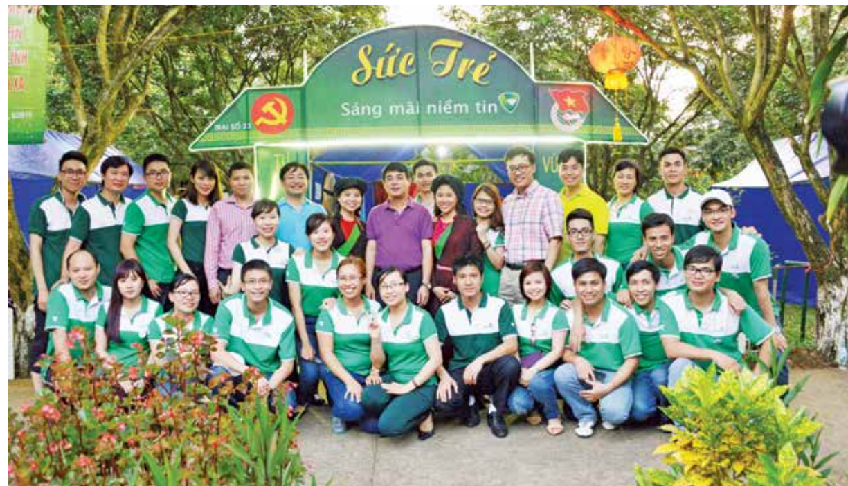
Hội trại Đoàn TN Vietcombank