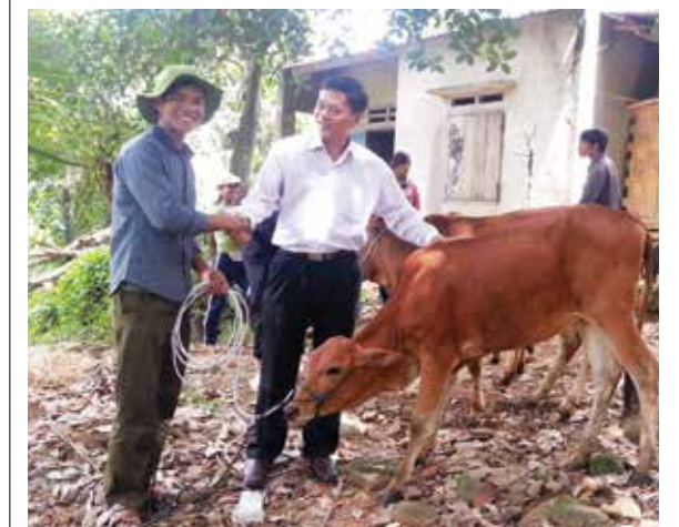
Trao tặng bò giống cho các hộ nghèo giáp Tây Nguyên