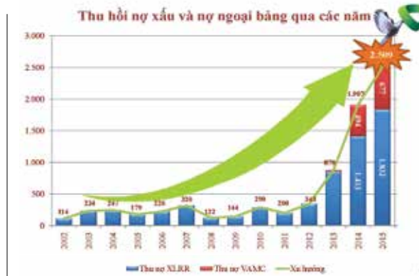
Kết quả thu hồi nợ xấu 2015

Một số khoản nợ không được thu hồi theo như kế hoạch khiến cho chúng tôi có nguy cơ không hoàn thành kế hoạch trong khi chỉ còn 1 tháng nữa để kết thúc năm 2015. Chiếc đồng hồ thu nợ đếm ngược mà các bạn thanh niên tự thiết kế như từng ngày tạo ra áp lực căng thẳng bao trùm lên chúng tôi. Thật may, theo kế hoạch của