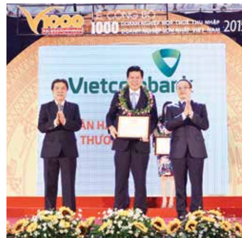
Ảnh: Nguyễn Thế Dương

Các hệ số an toàn, hiệu quả hoạt động của Vietcombank trong năm qua được cải thiện rõ rệt và dẫn sát với các thông lệ quốc tế.