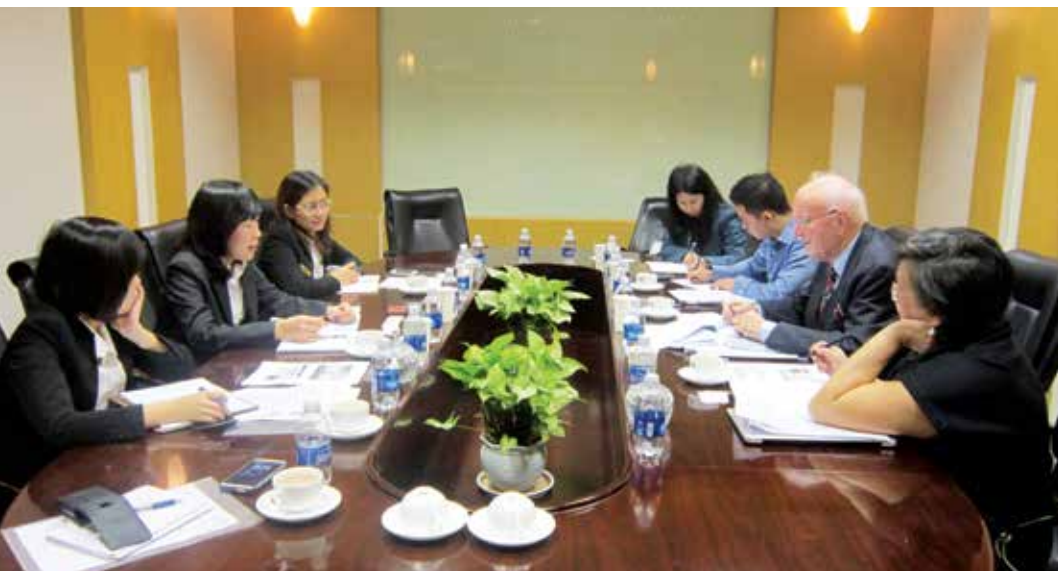
Đoàn cấp cao Quý Vietnam Holding trao đổi với Vietcombank về các nội dung của Báo cáo thường niên của Ngân hàng

nhà đầu tư bị từ chối, vì Ngân hàng hiểu rằng Nhà đầu tư đề nghị gặp Ngân hàng, có nghĩa là Ngân hàng đang nhận được sự quan tâm, từ đó những quan hệ đầu tư tiềm năng có thể đã, đang hoặc sẽ được khởi tạo, nuôi dưỡng và phát triển. Đánh giá cao thiện chí và mức độ cam kết đối mới của Ngân hàng, có những nhà đầu tư chuyên nghiệp không ngại ngần nhiều năm ngồi lại cùng Ngân hàng, đưa ra những đề xuất cụ thể, thực tiễn và tiên tiến cho công tác quản trị công ty, công khai thu nhập của cán bộ quản lý, công khai các hoạt động thể hiện trách nhiệm xã hội của Ngân hàng.