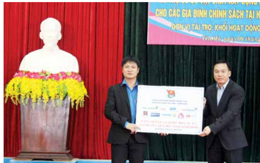
Đại diện Đoàn khối DNTW trao tượng trưng 10 bộ máy vi tính cho huyện Yên Mô, tỉnh Ninh Bình

PHẠM ĐĂNG TUẤN - Vietcombank Đông Sài Gòn