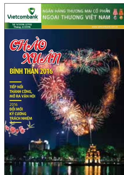
BẢN TIN CỦA NGÂN HÀNG TMCP NGOẠI THƯƠNG VIỆT NAM SỐ 1/2016 (270), Tháng 2/2016