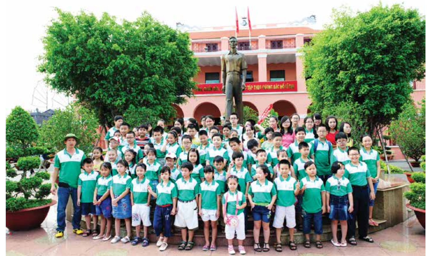
Khen thưởng học sinh giỏi cho con em CBNV Vietcombank Hồ Chí Minh nhân ngày Quốc tế thiếu nhi 1/6