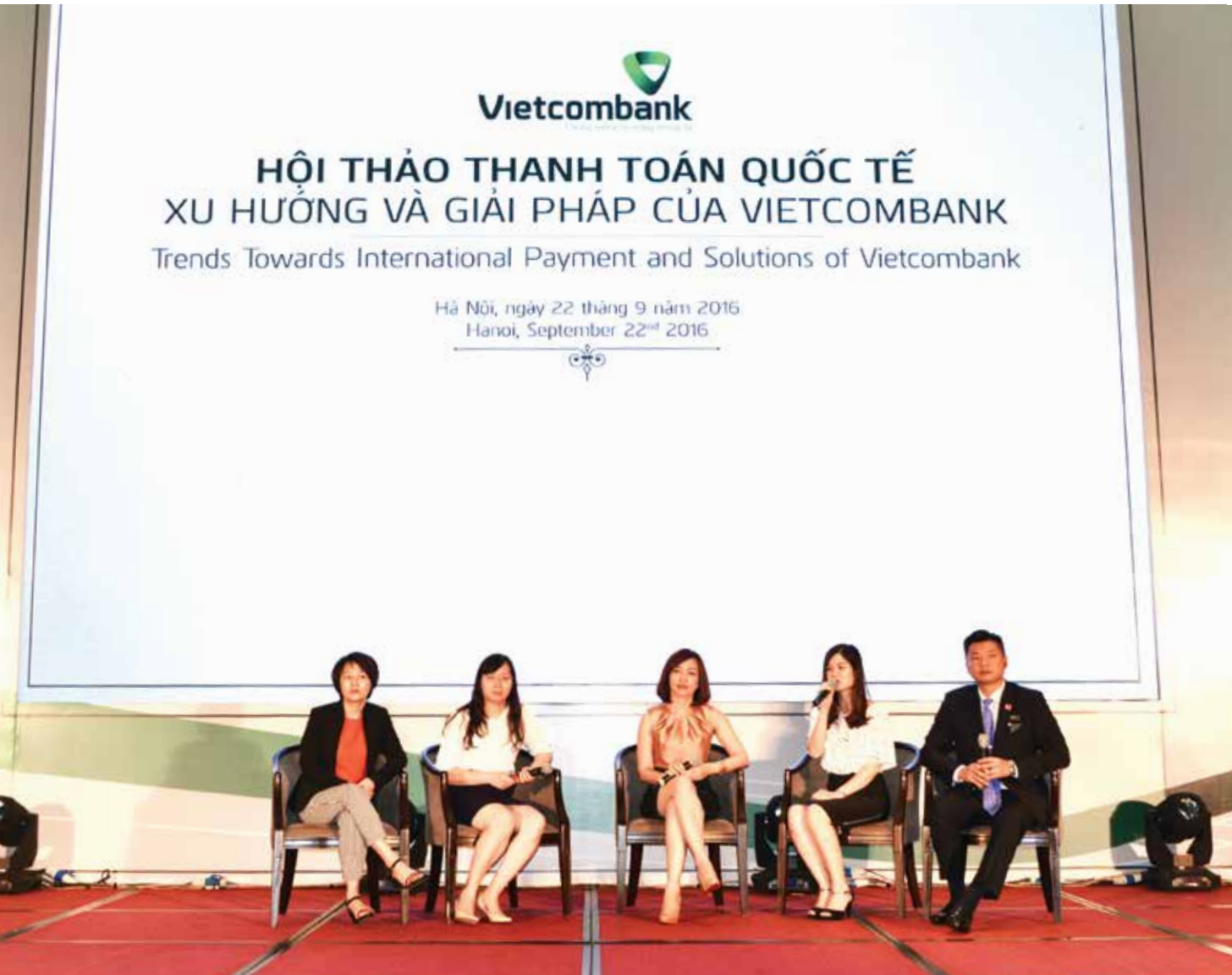
Ban chủ tọa Vietcombank và khách mời giải đáp các câu hỏi, thắc mắc của các khách hàng