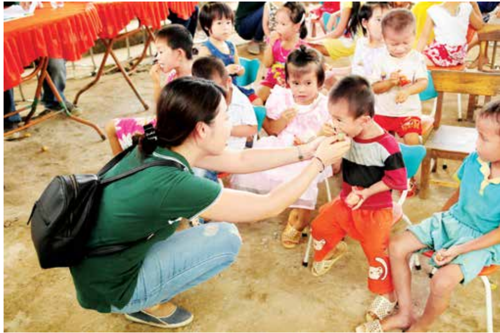
Cùng các em nhỏ ở Cẩm Sơn