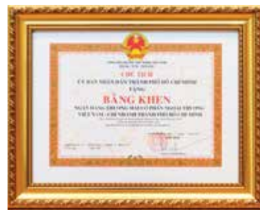
Bằng khen của Chủ tịch UBND TP Hồ Chí Minh tặng Vietcombank Hồ Chí Minh

các hoạt động sản xuất kinh doanh đã bị đình trệ. Trong bối cảnh đó, Vietcombank Hồ Chí Minh được thành lập, trở thành một nhân tố đặc lực góp phần thúc đẩy kinh tế thành phố tăng trưởng và đảm bảo an sinh xã hội. Bốn mươi năm qua, Vietcombank Hồ Chí Minh đã vượt qua bao khó khăn, thử thách, đoàn kết, chung sức chung lòng, năng động sáng tạo, luôn là đơn vị tiên phong, sẵn sàng nhận nhiệm vụ của Đảng, Nhà nước và Lãnh đạo thành phố giao phó. Thành phố cảm thấy tự hào khi Vietcombank Hồ Chí Minh đã khẳng định vị thế, uy tín trên thị trường tiền tệ - tín dụng trong và ngoài nước, luôn là đơn vị gương mẫu và đi đầu trong các chương trình do thành phố phát động như chương trình