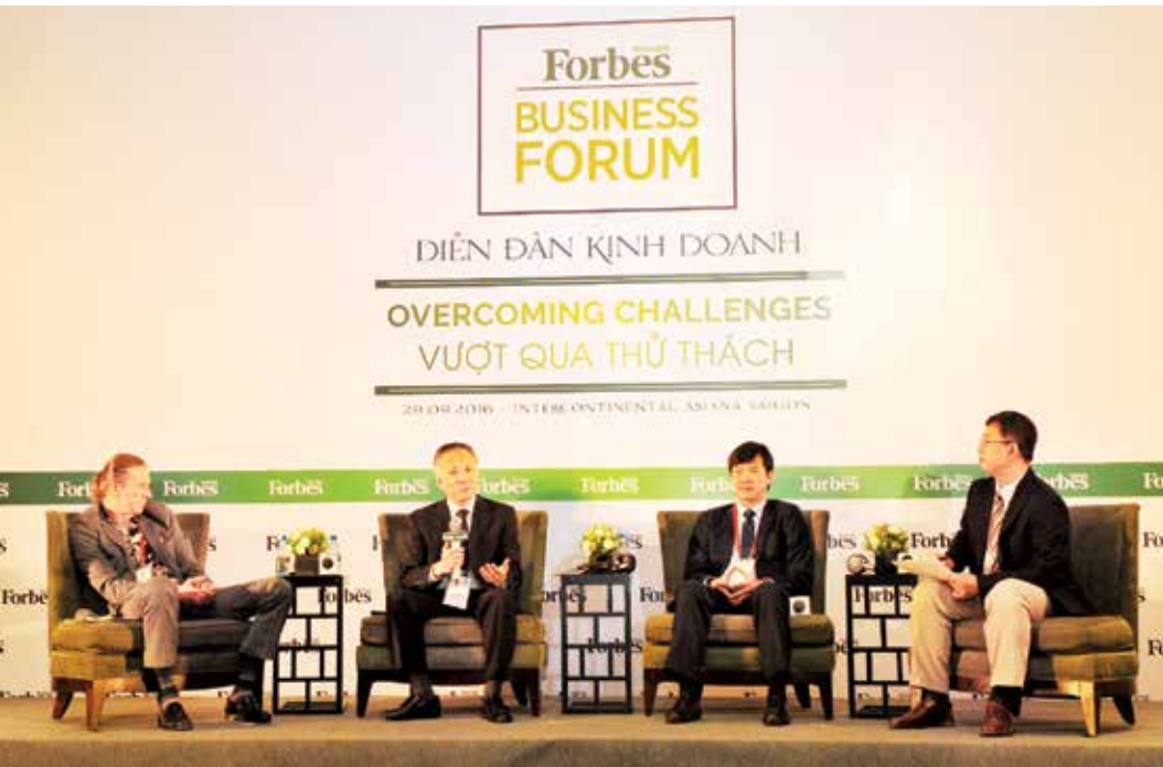
Diễn đàn kinh doanh do Forbes Việt Nam tổ chức trước thêm Lễ vinh danh "50 công ty niêm yết tốt nhất Việt Nam" lần thứ 4