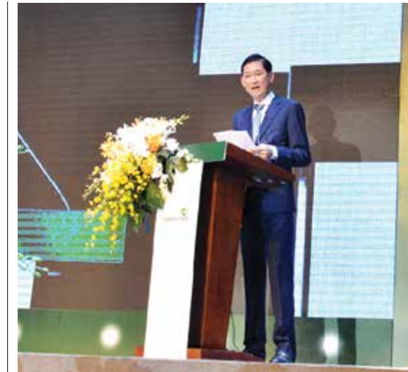
Ông Trần Vinh Tuyền - Phó Chủ tịch UBND Tp. HCM phát biểu tại buổi lễ

Thay mặt lãnh đạo địa phương, ông Trần Vinh Tuyền - Phó Chủ tịch UBND Tp. HCM đã chúc mừng đối với những thành tựu mà 08 chi nhánh Vietcombank đạt được trong 10 năm qua và nhấn mạnh: Trong 10 năm qua là giai đoạn khó khăn của thời kỳ khủng hoảng kinh tế toàn cầu, song hệ thống Vietcombank trên địa bàn Tp. HCM nói chung và 8 chi nhánh nói riêng vẫn tiếp tục duy trì và phát triển ổn định và có những đóng góp nhất định vào sự phát triển của hệ thống ngân hàng trên địa bàn, của kinh tế Tp. HCM. Quy mô hoạt động cũng như các lĩnh vực kinh doanh của 8 chi nhánh luôn duy trì tốc độ tăng trưởng, hoạt động tín dụng tăng trưởng mở rộng gắn liền với sự phát triển của kinh tế thành phố. Bên cạnh đó các chi nhánh cũng tham gia tích cực vào chương trình cộng đồng, các hoạt