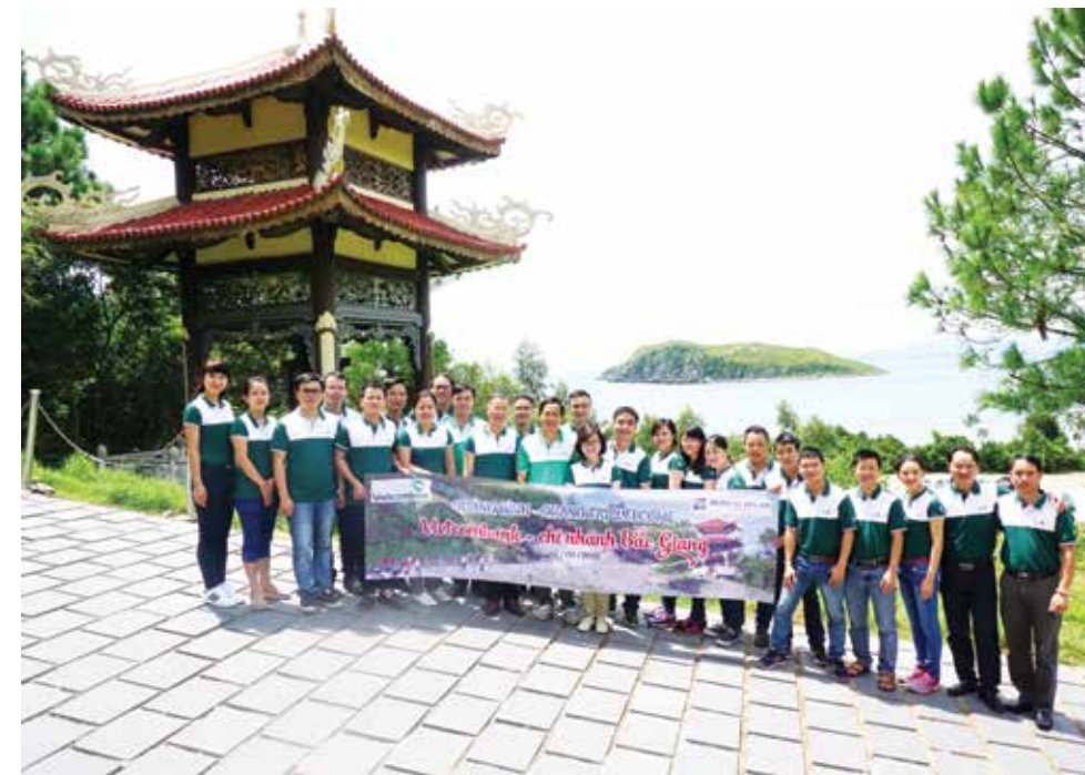
Chi bộ đến viếng mộ Đại tướng Võ Nguyên Giáp và chụp ảnh lưu niệm tại Vung Chua - Đảo Yến, xã Quảng Đông, huyện Quảng Trạch, tỉnh Quảng Bình