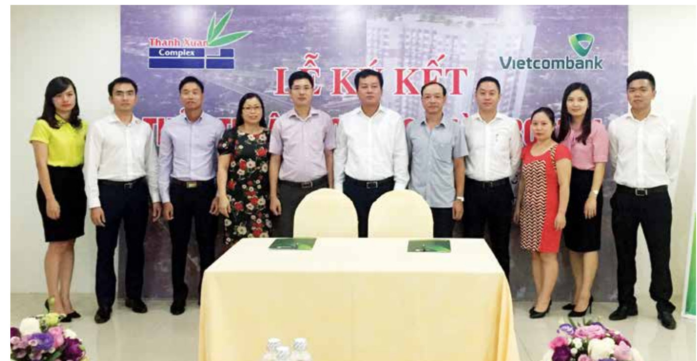
Lễ ký kết thỏa thuận hợp tác tài trợ vốn cho khách hàng cá nhân mua nhà Dự án Thanh Xuân Complex

Chung cư Thanh Xuân Complex tọa lạc tại vị trí vàng trên trục đường Lê Văn Thiêm nơi kết giao nhiều tuyến đường lớn huyết mạch của quận Thanh Xuân, có giao thông thuận tiện và rất gần các điểm đến quan trọng của thành phố. Dự án được khởi công tháng 08/2016 và dự kiến bàn giao nhà vào Quý I năm 2018. Khi hoàn thành, Dự án sẽ cung cấp ra thị trường 360 căn hộ cao cấp với tổng diện tích sàn xây dựng gần 54.000m2, tích hợp các dịch vụ tiện ích như Trung tâm thương mại, Bệnh viện, Trung tâm thể dục thể thao, chăm sóc sức khỏe... Ngay khi công bố ra mắt dự án, Thanh Xuân Complex đã nhận được sự quan tâm và phản hồi rất tích cực từ phía khách hàng và thị trường. □