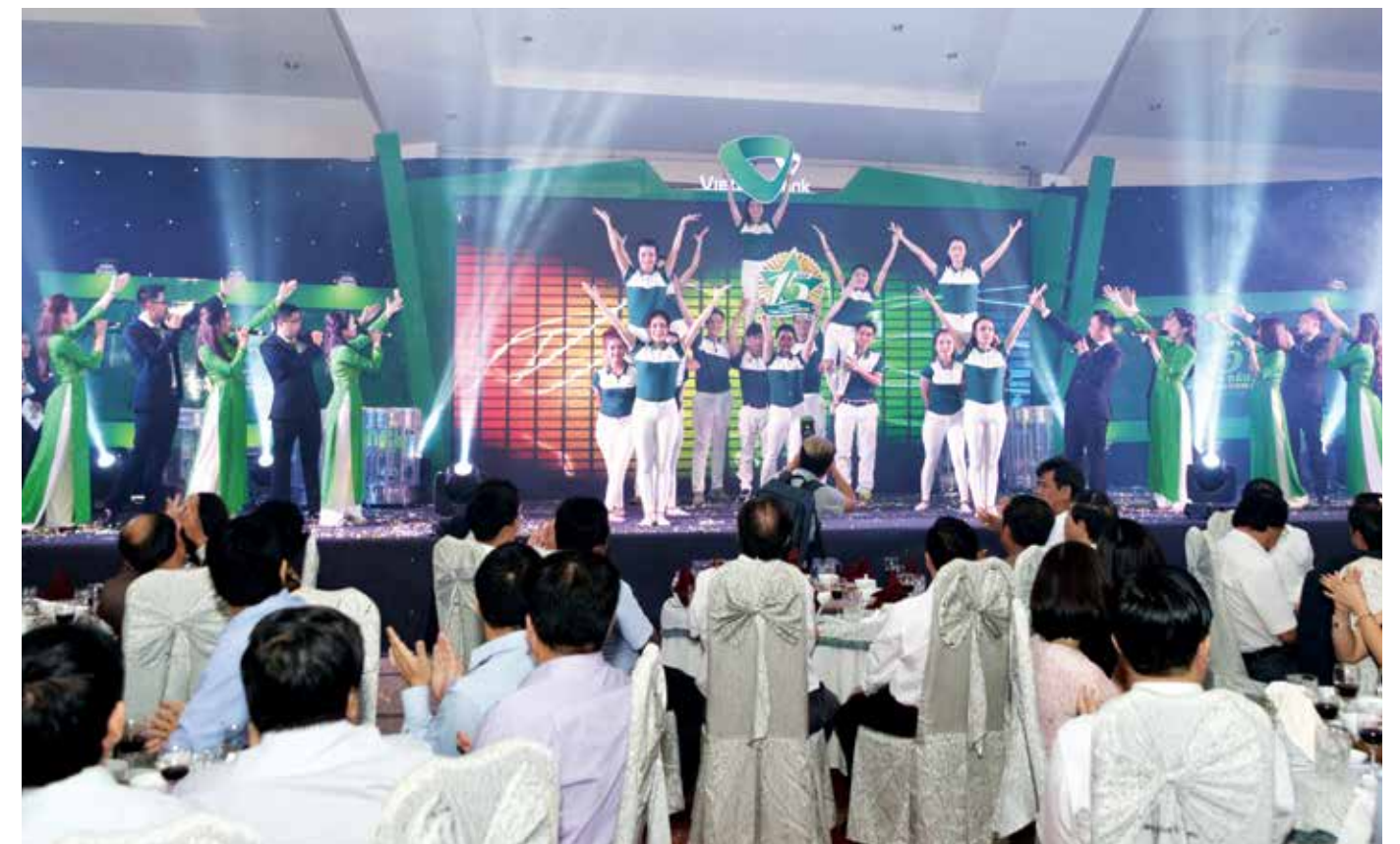
Hành khúc Vietcombank do CBNV Vietcombank Gia Lai trình diễn