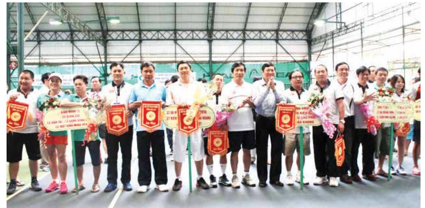
Các VĐV nhận giải

Giải Quần vợt Doanh nhân tỉnh Gia Lai lần thứ VII thực tế là giải đấu mở rộng, thu hút nhiều đối tượng tham gia. Sân chơi này là dịp để các doanh nhân gặp gỡ, giao lưu gắn kết tình đồng nghiệp trước thềm kỷ niệm Ngày Doanh nhân Việt Nam (13-10). □