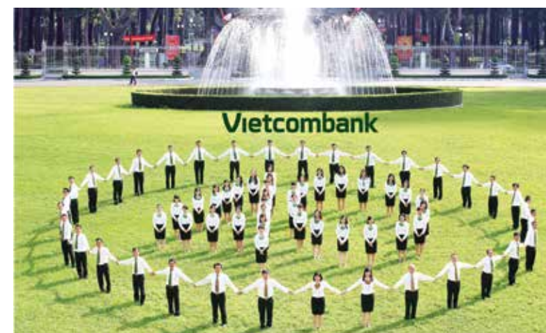
Cuộc thi ảnh nhân ngày Kỷ niệm 40 năm thành lập Vietcombank Hồ Chí Minh