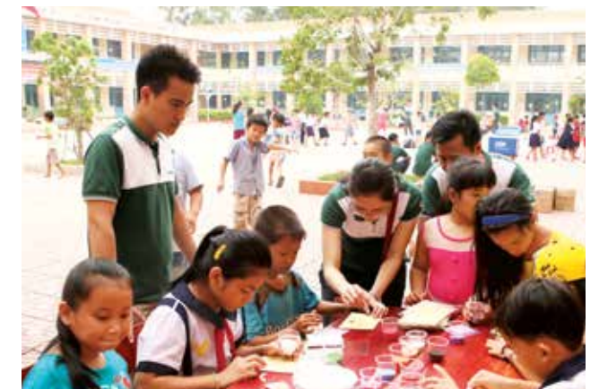
Tổ chức trò chơi cho các em thiếu nhi Trường tiểu học Trung An