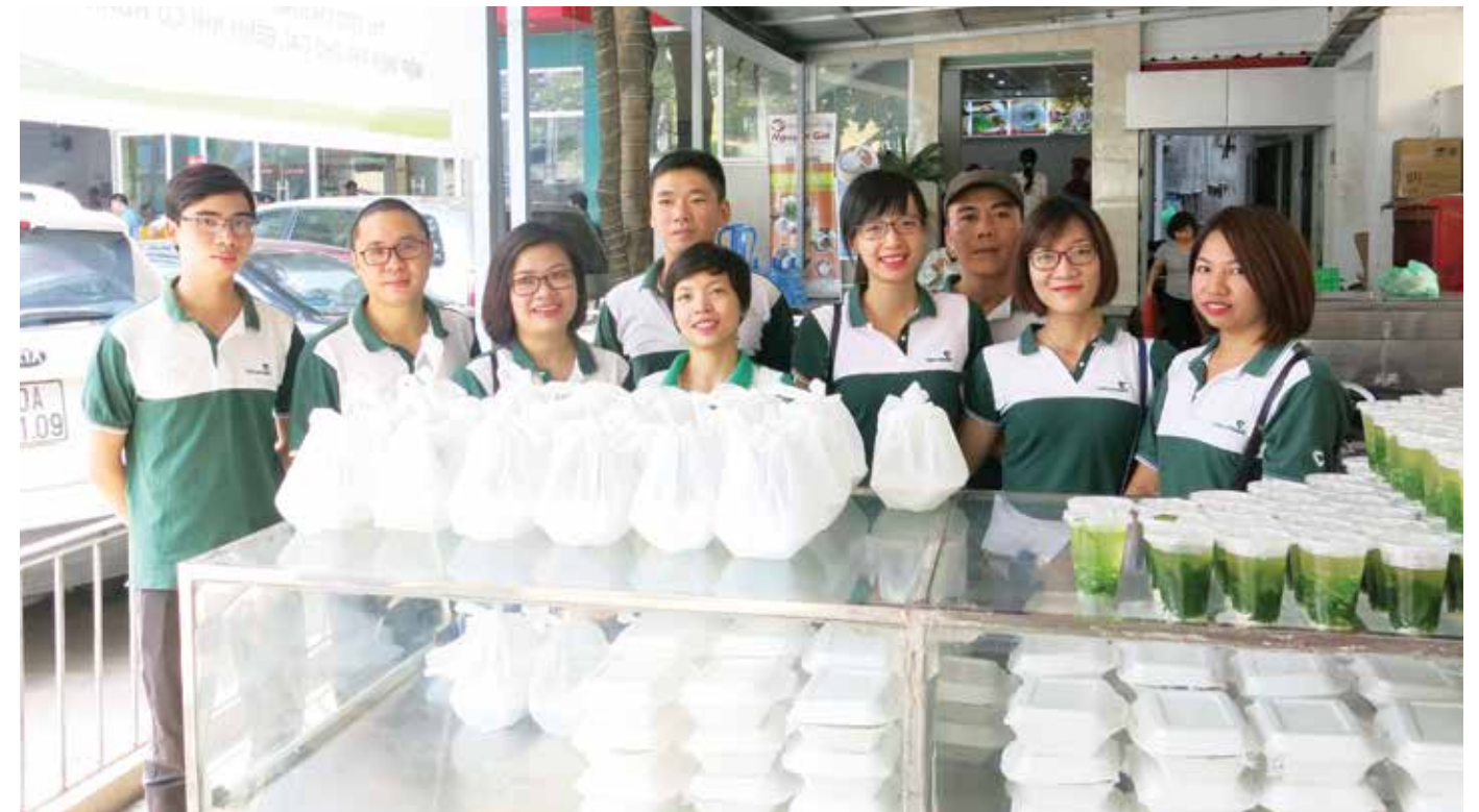
“Suất cơm nhân ái và hỗ trợ viện phí” cho bệnh nhân Bệnh viện Nhi Trung ương