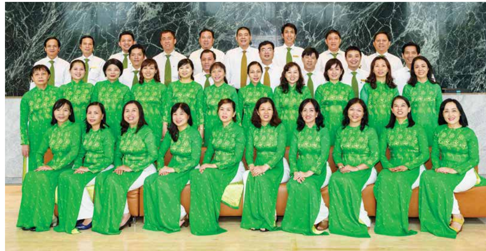
Phòng Ngân quỹ

Đây chính là điều mà tôi muốn chia sẻ qua câu chuyện của mình. Ngọn lửa trong tôi sẽ không bao giờ tắt khi tôi không ngừng cố gắng. Và “tương lai sẽ thuộc về những người có thái độ đúng và tầm nhìn hôm nay” (Robert Schuller). □