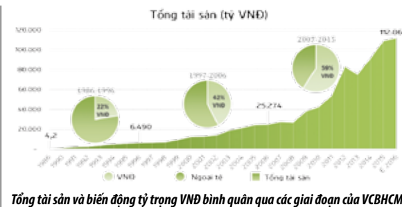
Tổng tài sản và biến động tỷ trọng VND bình quân qua các giai đoạn của VCBHCM

Có thể nói, một trong những nhân tố quan trọng tạo nên những thành công của Vietcombank Hồ Chí Minh chính là nhờ Chi nhánh biết trân trọng, bồi đắp và phát huy các giá trị cốt lõi của Văn hóa Vietcombank, tích cực xây dựng thương hiệu Vietcombank. Các thế hệ cán bộ lãnh đạo và nhân viên Vietcombank Hồ Chí Minh qua các thời kỳ đã đoàn kết