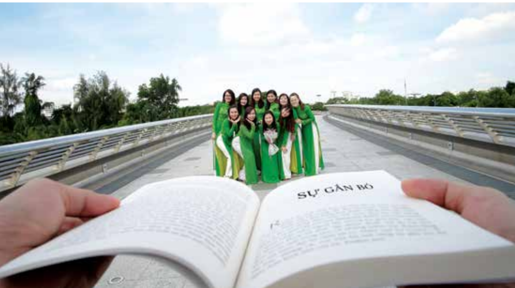
Sự gắn bó Vietcombank Hồ Chí Minh

Vietcombank Hồ Chí Minh được biết đến không chỉ vì những hoạt động xuất sắc trong kinh doanh, đóng góp cho sự phát triển kinh tế xã hội mà còn vì những dấu ấn thiện nguyện trải dài trên khắp đất nước. Vietcombank Hồ Chí Minh luôn đồng hành chặt chẽ với các chương trình An sinh xã hội của Chính phủ nhằm giảm thiểu số hộ nghèo, giúp đỡ các em nhỏ vùng sâu vùng xa đến trường, giúp nối liền các tuyến giao thông huyết mạch ở ven sông.