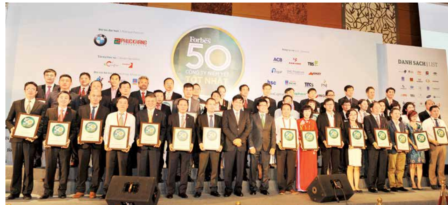
Đại diện 50 công ty niêm yết và Tạp chí Forbes Việt Nam chụp ảnh lưu niệm tại buổi lễ vinh danh

Tạp chí Forbes (Mỹ) ra mắt phiên bản tiếng Việt từ tháng 6/2013 (là ấn phẩm thứ 29 xuất bản trên toàn thế giới), được đánh giá là nguồn tham khảo mới cho các doanh nhân khởi nghiệp tại Việt Nam cũng như đưa ra những bài học, kinh nghiệm để doanh nghiệp Việt có thể vươn tầm lớn mạnh ra thế giới. □