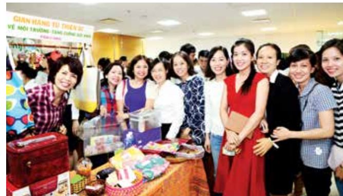
Hoạt động từ thiện nhân ngày 8/3