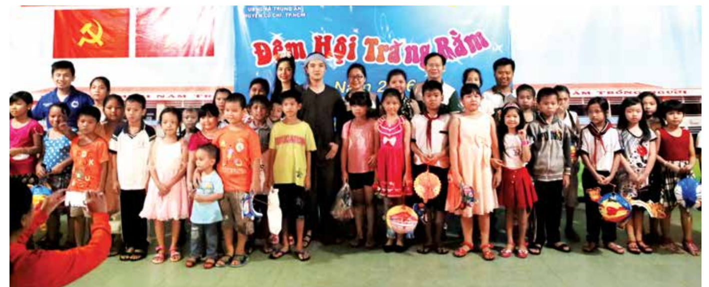
Tổ chức trò chơi cho các em thiếu nhi Trường tiểu học Trung An