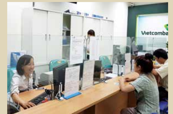
Giao dịch tại Pgd Samsung