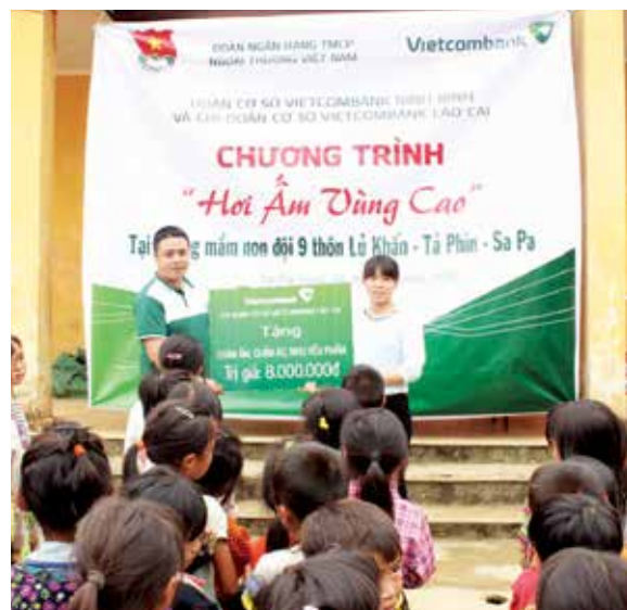
Chi đoàn CS Vietcombank Lào Cai trao tặng 8 triệu đồng

Thấu hiểu những điều đó, thực hiện chương trình công tác Đoàn và phong trào thanh niên năm