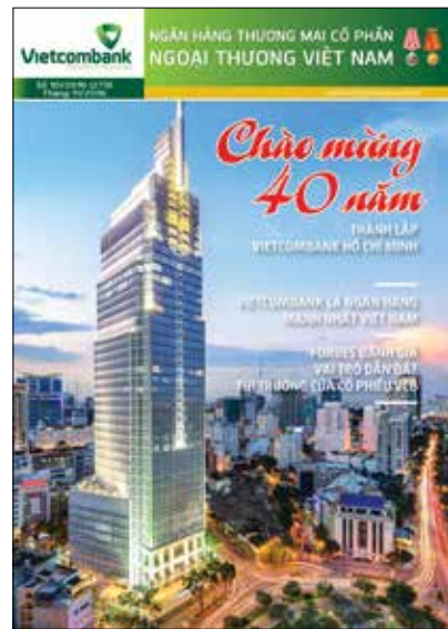
BẢN TIN CỦA NGÂN HÀNG TMCP NGOẠI THƯƠNG VIỆT NAM SỐ 10/2016 (279), Tháng 11/2016