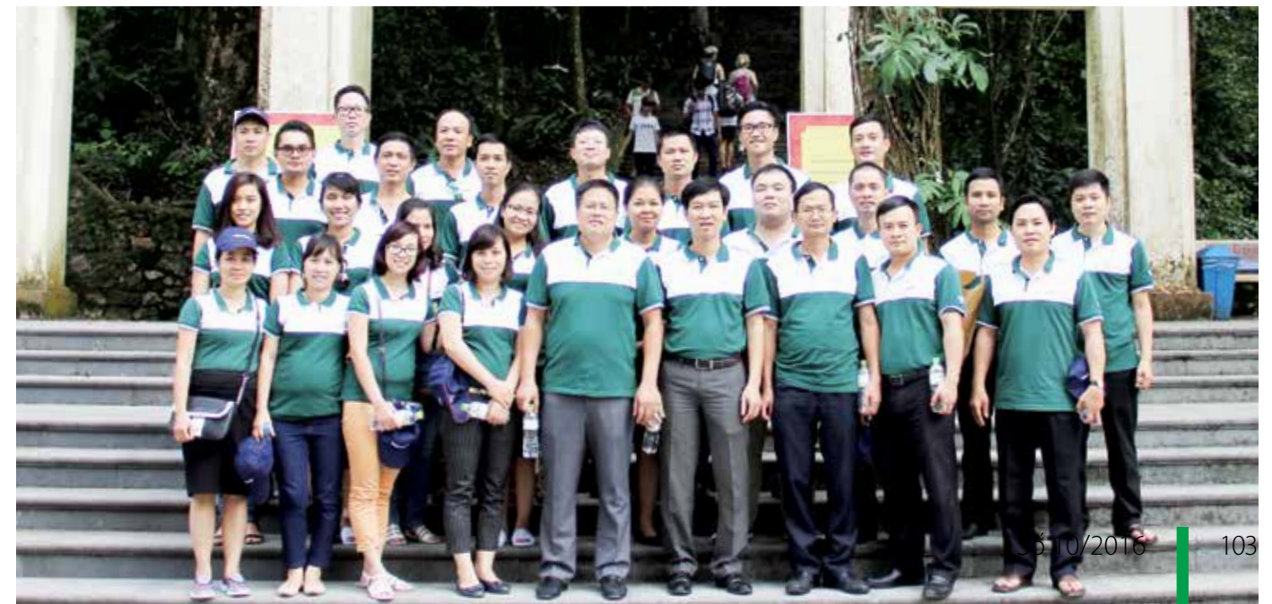
Chi bộ cơ sở VCBS chụp ảnh lưu niệm tại Đền thờ Bác Hồ

Buổi chiều cùng ngày, Đoàn đã tổ chức đi tham quan Vườn Quốc gia Ba Vì và dâng hương tại đền thờ Bác Hồ nằm ở độ cao 1.296 m và kết thúc chuyến đi về nguồn và sinh hoạt chính trị đầy ý nghĩa. □