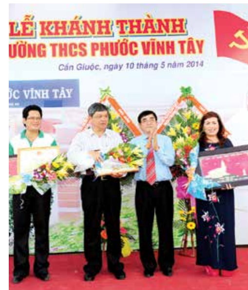
Lễ khánh thành trường THCS Phước Vinh Tây - Cần Giuộc