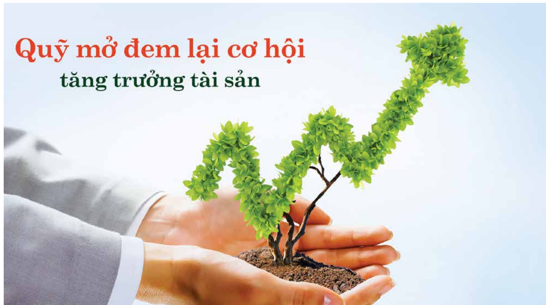
Đầu tư vào Quỹ mở

VCBF là công ty liên doanh giữa Ngân hàng Vietcombank và Franklin Templeton Investments - Tập đoàn quản lý quỹ của Mỹ hoạt động toàn cầu. VCBF đã hoạt động trên 10 năm tại Việt Nam và đang quản lý hai quỹ mở là Quỹ Đầu tư Cân bằng Chiến lược VCBF và Quỹ Đầu tư Cổ phiếu Hàng đầu VCBF. Các quỹ này được giám sát chặt chẽ bởi Ủy ban Chứng Khoán Nhà nước (UBCKNN). UBCKNN luôn tập trung vào việc đảm bảo an toàn cho các nhà đầu tư. Tài sản của các quỹ mở của VCBF được giám sát bởi ngân hàng Standard Chartered (Việt Nam). Mức tối thiểu của lần đầu tư đầu tiên vào quỹ mở của VCBF chỉ là 5 triệu đồng và nếu bạn muốn đầu tư thêm thì các lần tiếp theo là 1 triệu đồng. Số tiền này được quy thành chứng chỉ quỹ theo giá của chứng chỉ quỹ tại thời điểm nộp tiền. Khi cần sử dụng vốn, bạn vẫn có thể rút ngay một phần hoặc toàn bộ số tiền đã đầu tư bất kỳ lúc nào. □