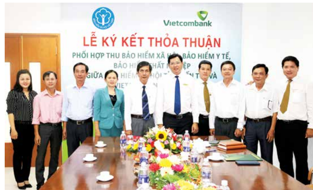
Lãnh đạo BHXH tỉnh Bến Tre và Vietcombank Bến Tre chụp ảnh lưu niệm

Tại buổi lễ, hai bên cùng bày tỏ sự tin tưởng và nhấn mạnh sẽ tiếp tục có sự hợp tác trên nhiều phương diện trong thời gian tới. Lễ ký kết đã đánh dấu những thành công bước đầu của Vietcombank Bến Tre trong việc tiếp cận khách hàng thuộc khối cơ quan hành chính trong mục tiêu đa dạng hóa các sản phẩm, dịch vụ, hướng đến phát triển bền vững thương hiệu Vietcombank trên địa bàn. □