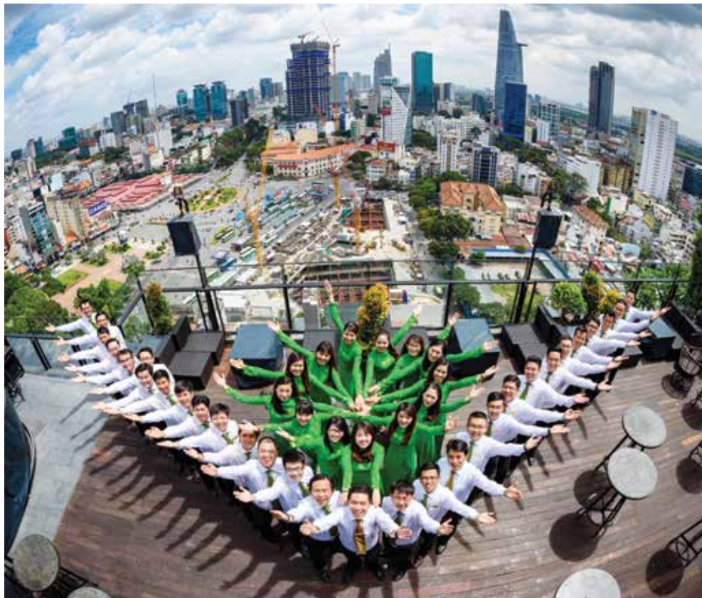
Phòng Khách hàng thể nhân