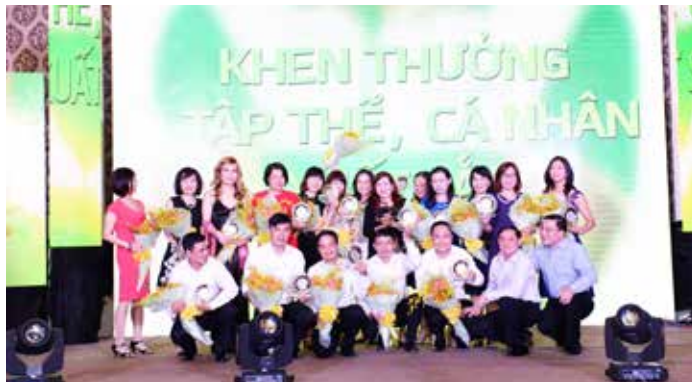
Hội nghị tổng kết hoạt động kinh doanh