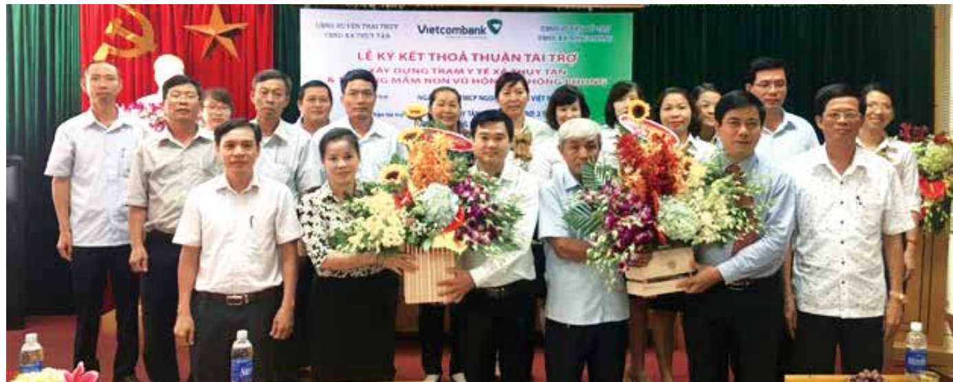
Toàn cảnh buổi lễ ký kết tài trợ An sinh xã hội