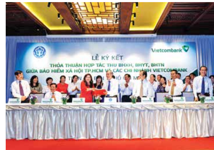
Lễ ký kết thỏa thuận hợp tác với BHXH