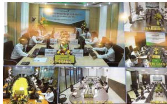
Hình ảnh tại các điểm cầu

Với mục đích là thúc đẩy cán bộ nâng cao ý thức, trách nhiệm trong việc chủ động trau dồi kiến thức, kỹ năng nhằm nâng cao chất lượng, hiệu quả công tác chuyên môn; nên chương trình thi là dịp để cán bộ có điều kiện ôn tập, hệ thống hóa, cập