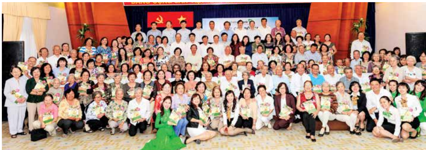
Họp mặt cán bộ hưu trí nhân ngày Quốc tế Người cao tuổi