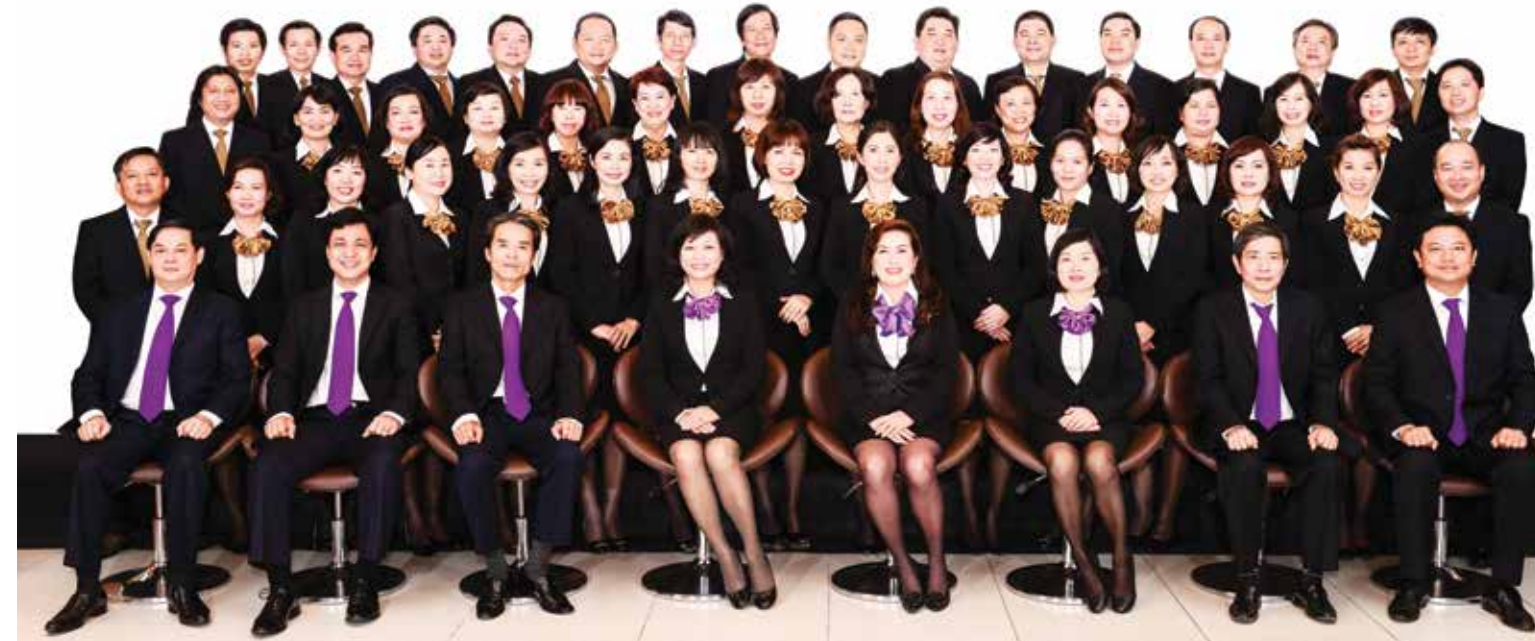
Vietcombank Hồ Chí Minh 2014 - Ban giám đốc và các trưởng phòng

động để tăng cường lành mạnh hóa và duy trì con đường phát triển bền vững; mở rộng mạng lưới hoạt động tại những địa bàn tiềm năng; nâng cấp hệ thống công nghệ thông tin cũng là giải pháp quan trọng trong năm 2016 và những năm kế tiếp.