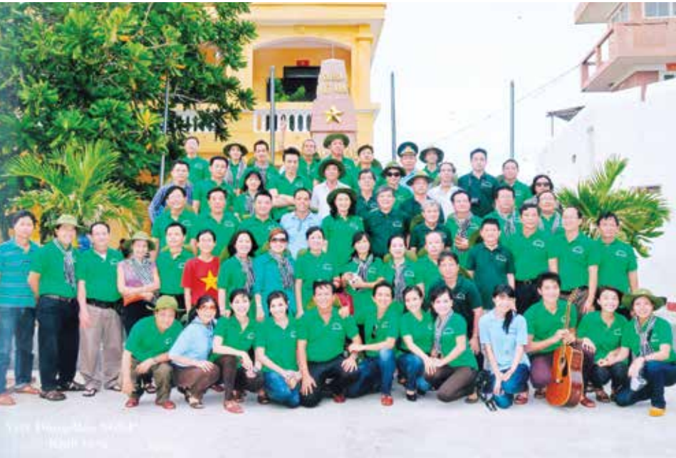
Chuyến đi thăm các chiến sĩ đang công tác tại Trường Sa của Giám đốc Vietcombank Hồ Chí Minh