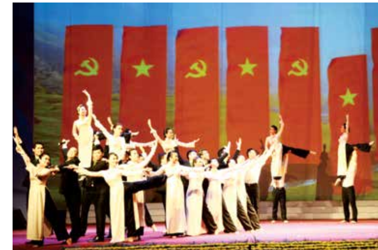
Hội diễn văn nghệ Tổng liên đoàn lao động năm 2013