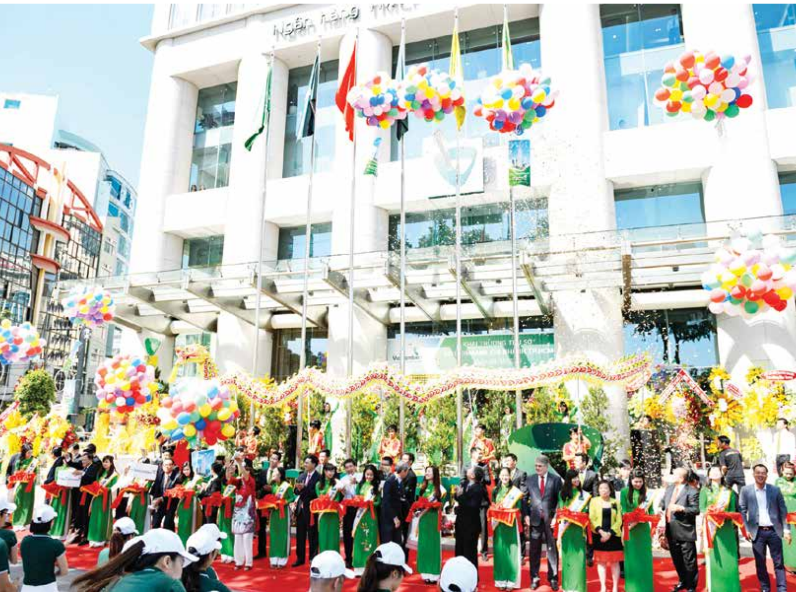
Khai trương trụ sở mới của Vietcombank Hồ Chí Minh