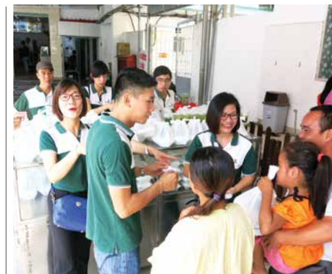
Trao tặng các suất cơm nhân ái cho bệnh nhân

Thực hiện các công tác an sinh xã hội luôn là một nét đẹp của Vietcombank nói chung và Vietcombank Nam Hà Nội nói riêng, thể hiện sự cảm thông, động viên kịp thời, tiếp thêm sức mạnh và nghị lực cho gia đình bệnh nhân nhi có hoàn cảnh khó khăn đang điều trị tại Bệnh viện nhi Trung ương. □