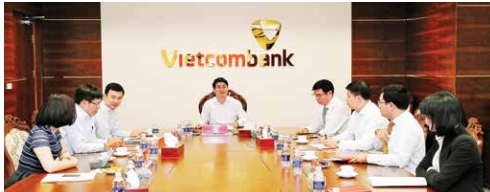
Toàn cảnh phiên họp Ban Thường vụ Đảng ủy Vietcombank tháng 9/2016

Phiên họp Ban Thường vụ Đảng ủy Vietcombank tháng 9/2016 đã triển khai các nội dung: i) báo cáo các công việc đã thực hiện giữa