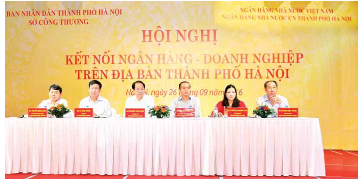
Lãnh đạo UBND TP Hà Nội và NHNN VN điều hành Hội nghị kết nối ngân hàng - doanh nghiệp trên địa bàn thành phố Hà Nội