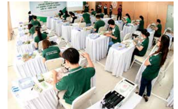
Hội thi Cán bộ Ngân quỹ giỏi tại Vietcombank Hồ Chí Minh