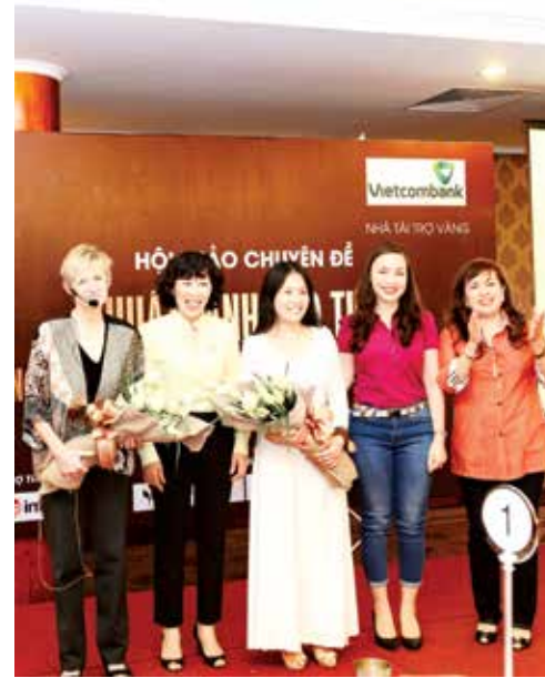
Hội thảo chuyên đề sức khỏe dành cho CBNV Vietcombank HCM