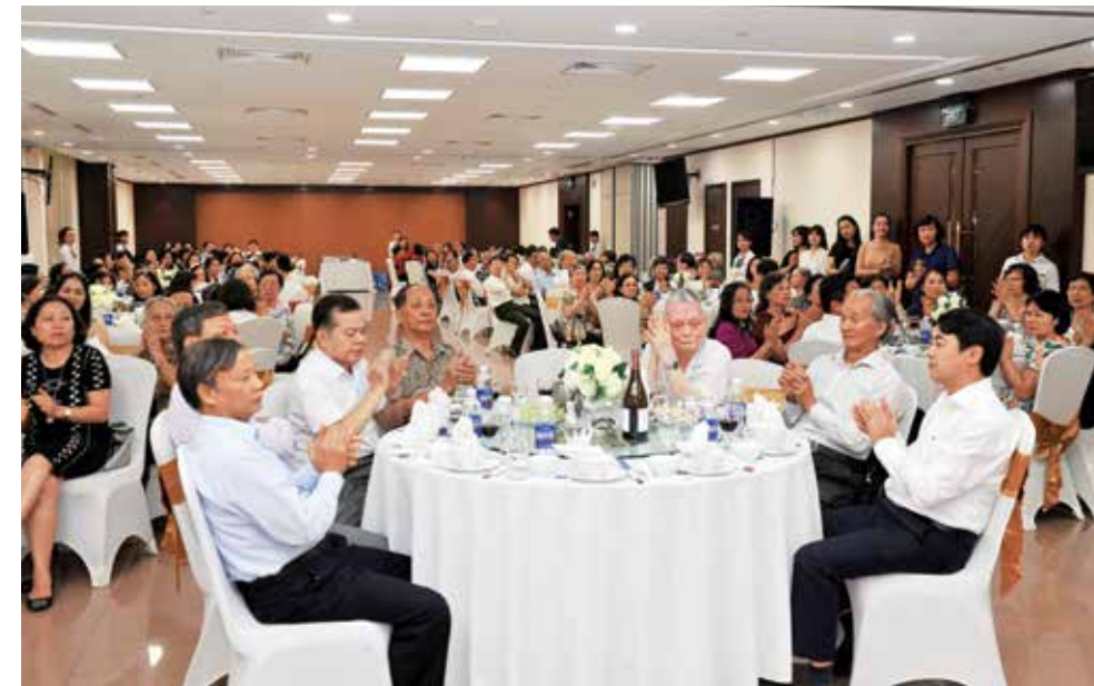
Quang cảnh buổi gặp mặt