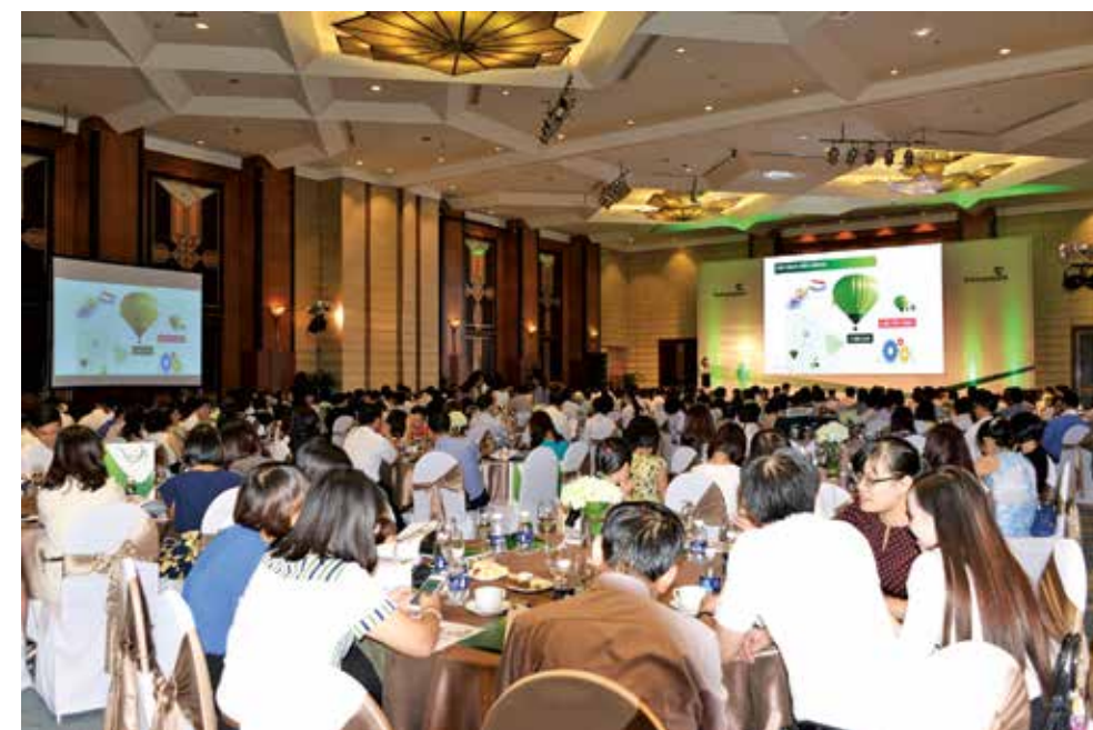
Một góc quang cảnh Hội thảo

Lần đầu tiên tổ chức Hội thảo về chuyên đề vốn làm nên thương hiệu Vietcombank, đồng bào khách mời tham dự đã bày tỏ sự ấn tượng và đánh giá cao về chất lượng nội dung và tính chuyên nghiệp của Hội thảo. Hội thảo kết thúc tốt đẹp và để lại ấn tượng sâu sắc về dấu ấn thương hiệu Vietcombank trong hoạt động TTQT & TTTM nói riêng cũng như vị thế một ngân hàng hàng đầu của Việt Nam trong quá trình hội nhập và phát triển. □