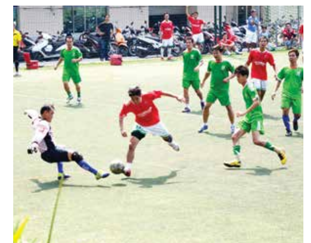
Giải bóng đá nội bộ Vietcombank Hồ Chí Minh