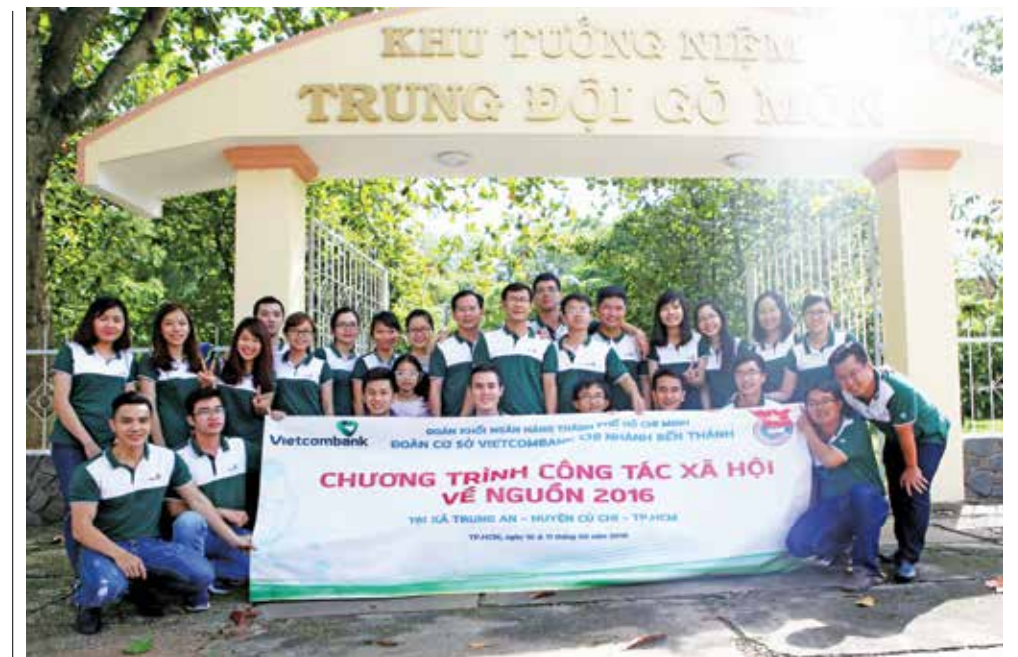
Viếng Khu tưởng niệm Trung Đội Gò Môn

"Vietcombank bến thành là một mái nhà chung" □