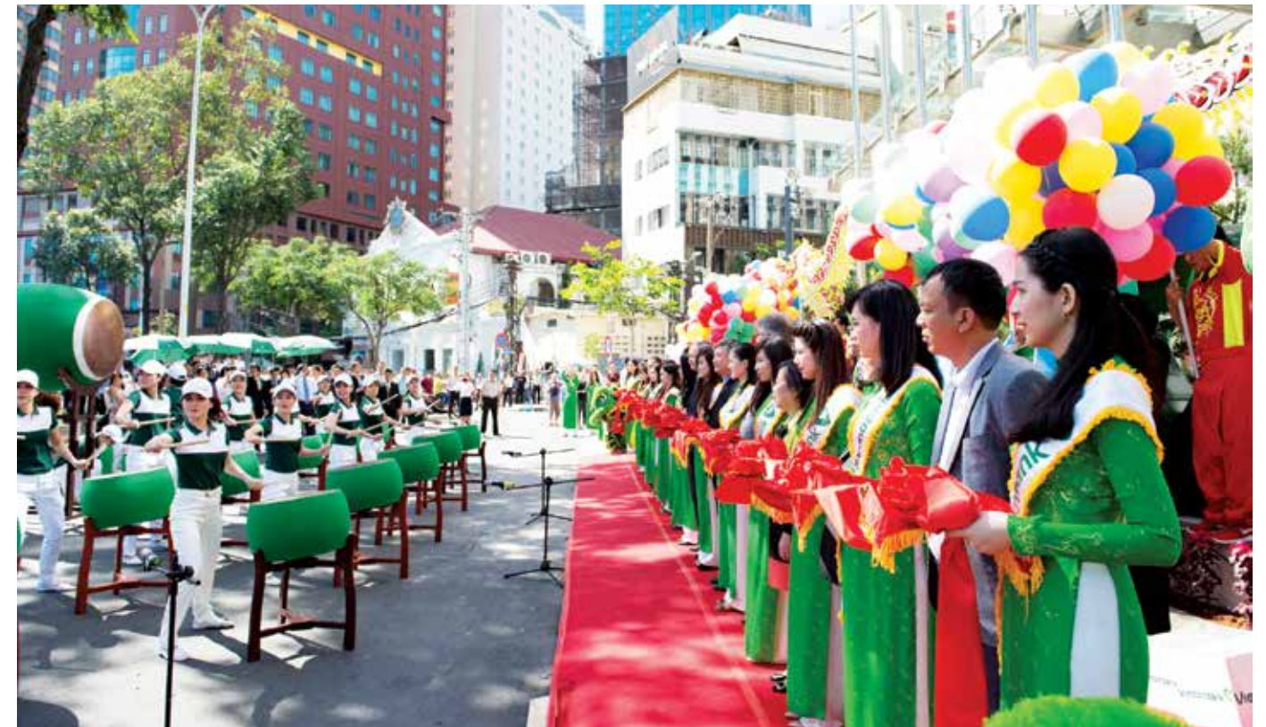
Trống hội ngày khai trương tòa nhà Vietcombank Hồ Chí Minh

cùng chi nhánh trong giai đoạn chuyển đổi cam go nhất của Vietcombank. Tôi thấy những nhà lãnh đạo của Vietcombank Hồ Chí Minh qua các thời kỳ kế tiếp các thế hệ trong suốt chặng đường 40 năm qua, đặc biệt là những thời kỳ khó khăn nhất trước đây, luôn luôn đặt nhiệm vụ chính trị phục vụ đất nước, phục vụ nhân dân, phục vụ mọi tầng lớp cộng đồng sản xuất kinh doanh để phát triển như ngày nay, làm tiêu chí hoạt động đầu tiên. Họ đã và đang làm việc suốt ngày đêm, đi sâu đi sát mọi cơ sở của thành phố này, mang tính dẫn thân, cống hiến và phục vụ. Trong điều kiện đất nước nói chung và thành phố Hồ Chí Minh nói riêng, còn bị hạn chế bởi nền pháp trị từ khâu lập pháp, tư pháp rồi đến hành pháp luôn có những "độ vênh nhau"; lại còn thêm các chính sách, cơ chế sản xuất kinh doanh chưa phù hợp hoàn toàn với nền kinh tế thị trường mở cửa và hội nhập, nên hoạt động ngân hàng có nhiều bất cập rủi ro không tránh khỏi. Chính đây là điều khó khăn thử thách to lớn đối với Vietcombank Hồ Chí Minh, một đơn vị ngân hàng cơ sở luôn có trách nhiệm trong thời kỳ kế hoạch tập trung bao cấp và luôn đi đầu trong hoạt động đổi mới ngân hàng, với tâm thế: "chiến trường im tiếng súng, thương trường đạn vẫn bay"... Theo tiên liệu của tôi, cùng với sự trường tồn của đất nước Việt Nam yêu dấu; của thành phố Hồ