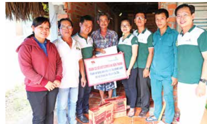
Trao quà, động viên các hộ đặc biệt khó khăn tại xã Trung An