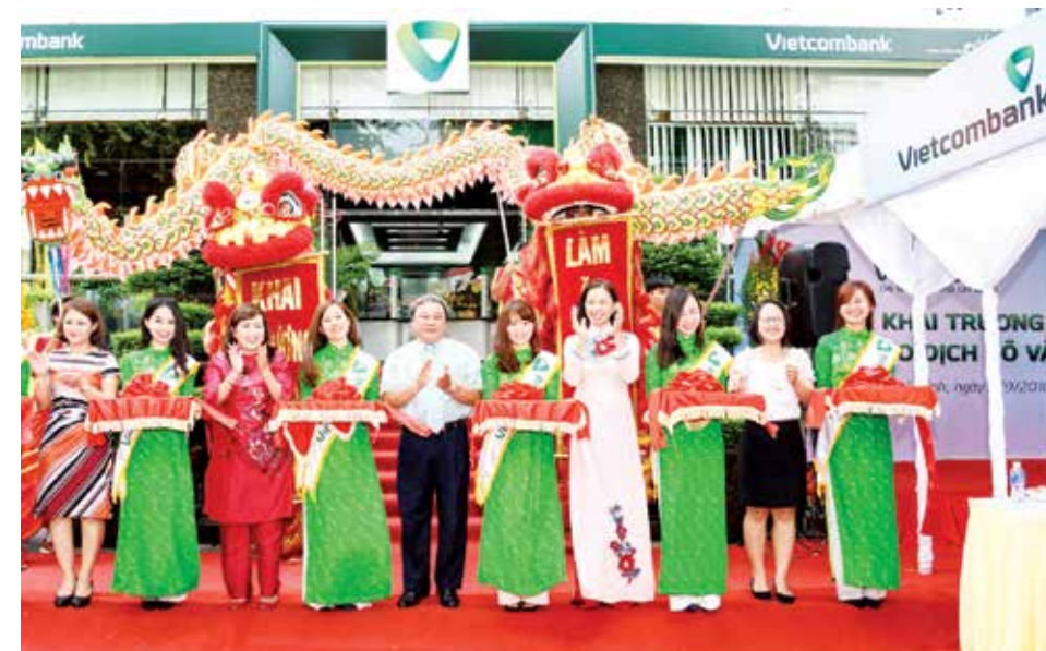
Khai trường PGD Võ Văn Tấn