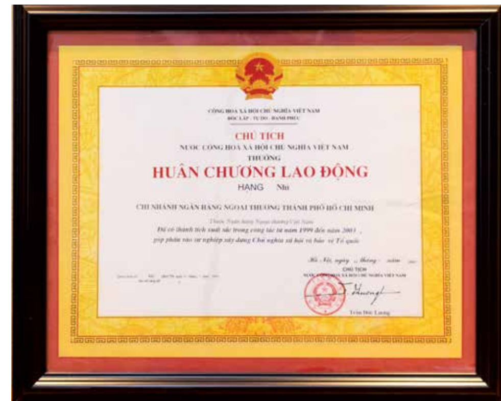
Huân chương Lao động hạng Nhì của Chủ tịch nước tặng cho Vietcombank Hồ Chí Minh

Được ra đời trong hoàn cảnh đặc biệt - tiếp quản hoạt động Ngân hàng Việt Nam Thương tín (ngân hàng có quy mô hoạt động ngoại thương lớn thuộc chính quyền Sài Gòn) sau ngày đất nước thống