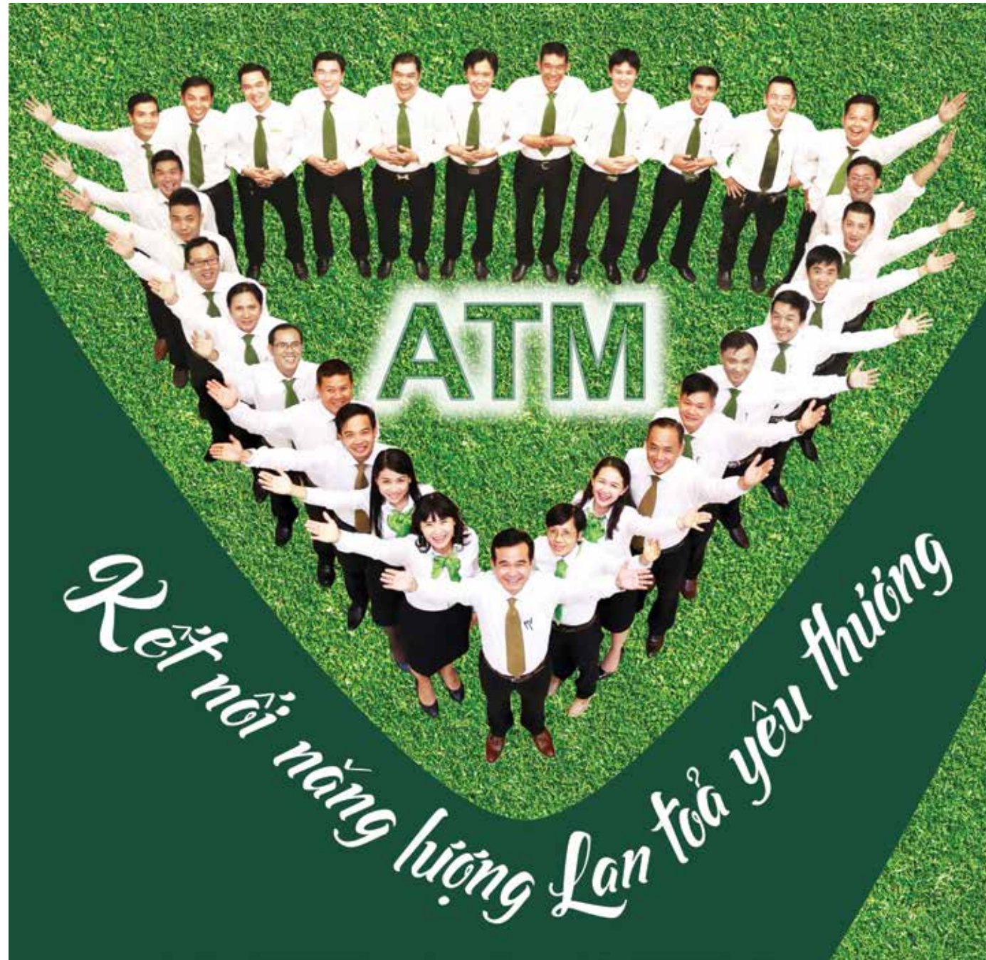
Cán bộ phòng Quản lý dịch vụ ATM Vietcombank Hồ Chí Minh

Ngay từ những ngày đầu thành lập, Vietcombank Hồ Chí Minh đã sớm định hướng rõ lối đi riêng và những trở ngại phải đối mặt. Vietcombank Hồ Chí Minh hiểu rằng sự chuẩn bị cho các bước ngoặt quan trọng không bao giờ là thừa để đưa một Ngân hàng vững bước vượt qua những khó khăn, thách thức và phát triển vững mạnh theo thời gian.