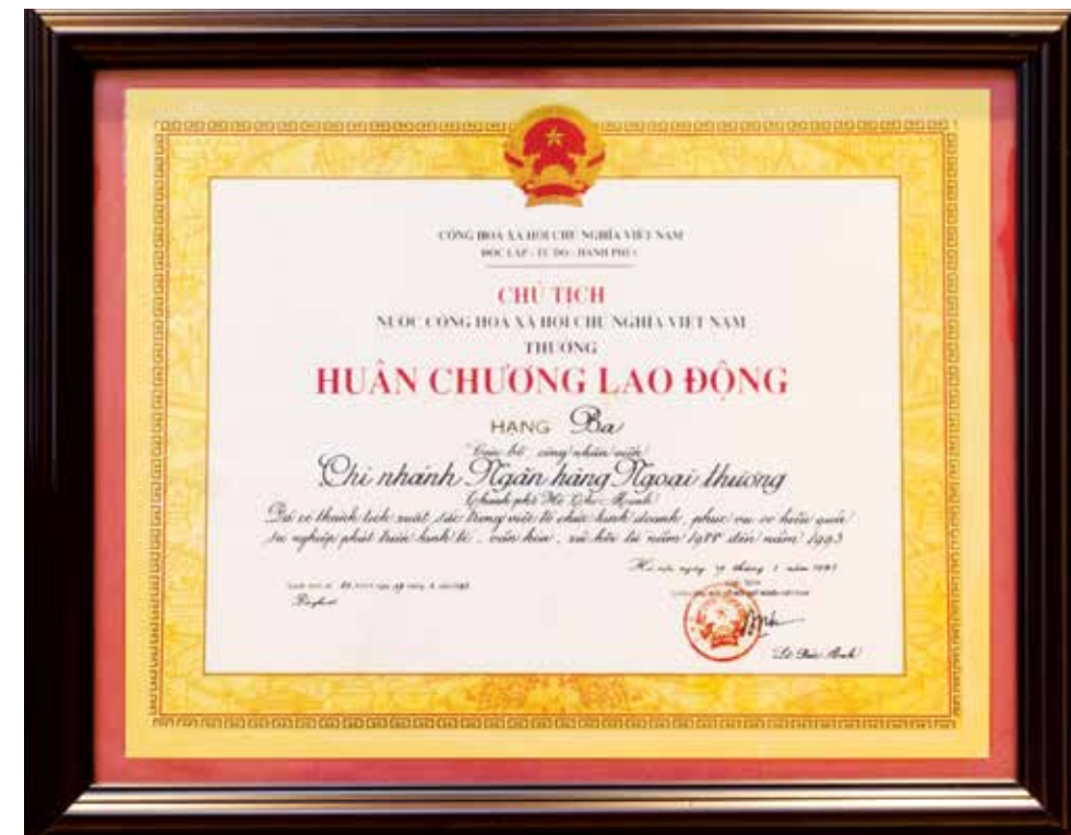
Huân chương Lao động hạng Ba của Chủ tịch nước tặng cho Vietcombank Hồ Chí Minh

Vietcombank Hồ Chí Minh tham gia tài trợ cho hàng trăm các Dự án nâng phát triển nhằm thay đổi diện mạo của thành phố với quy mô tài trợ hàng chục nghìn tỷ đồng: Dự án kích cầu, cải tạo phát triển hệ thống giao thông, cải tạo môi trường, xử lý ô nhiễm, khắc phục hậu quả của khủng hoảng kinh tế thế giới. Bên cạnh đó, Vietcombank Hồ Chí Minh là một trong những