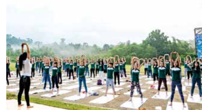
Lớp học Yoga trong chương trình Team Building tại Madagui