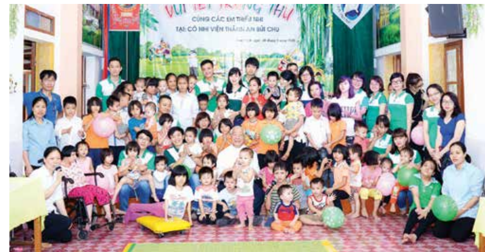
Vui Tết Trung thu cùng các em tại Cô nhi viện Thánh An Bùi Chu