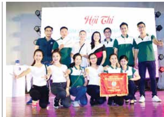
Niềm vui của Vietcombank Gia Lai