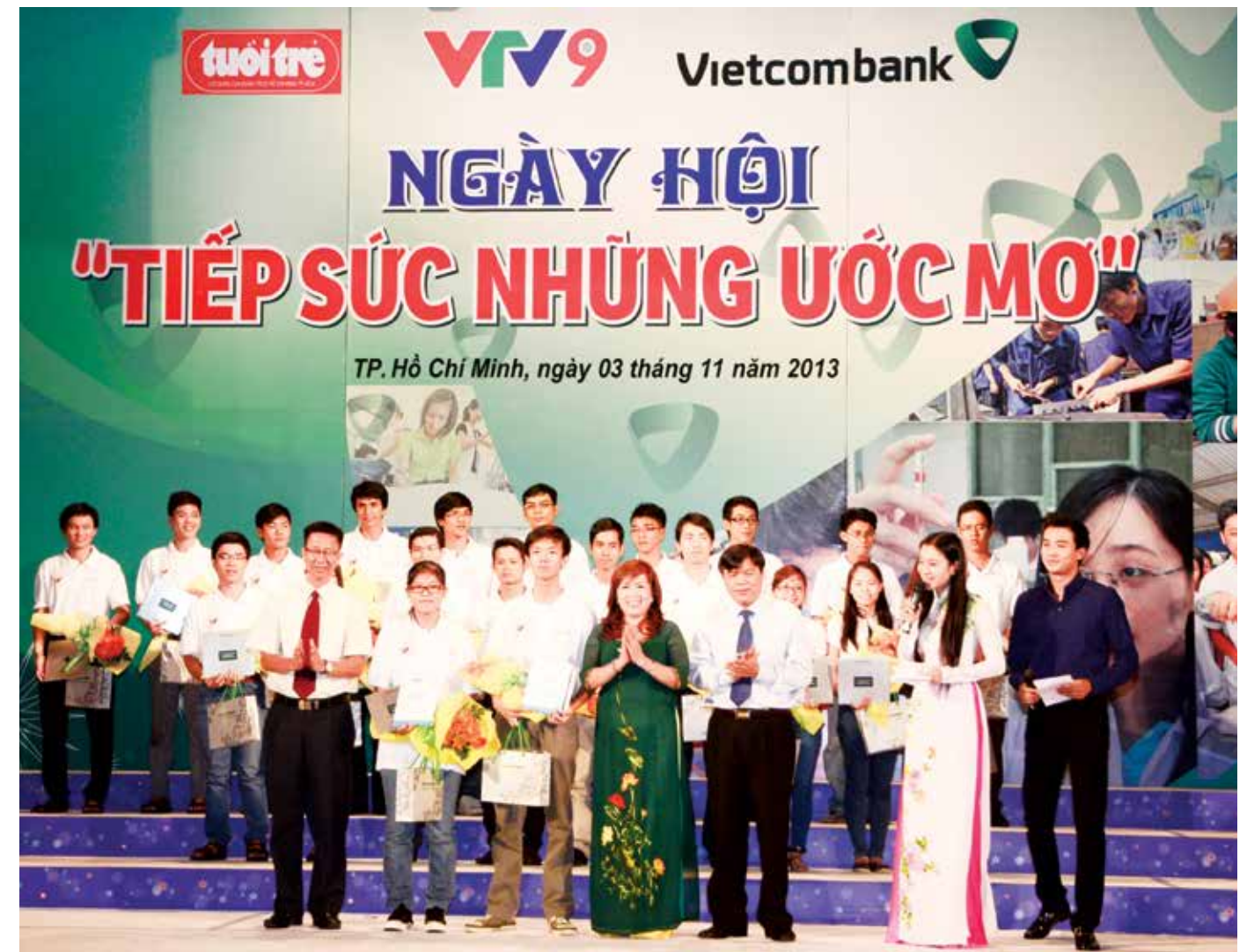
Vietcombank Hồ Chí Minh với chương trình “Tiếp sức những ước mơ”

Các anh chị em Vietcombank Hồ Chí Minh đã đi đến và ở lại với công tác an sinh xã hội như thế, với cả tấm lòng và sự thấu đáo của nguyên lý Cho - Nhận trong đời sống; điều tốt nào cho đi cũng sẽ quay lại với chính chúng ta. “Sự quay lại” đó chính là cảm giác hạnh phúc vì mình có ích cho nhiều người khác, chính là sự cống hiến một phần nhỏ nhoi của mình cho một xã hội tốt đẹp hơn. □