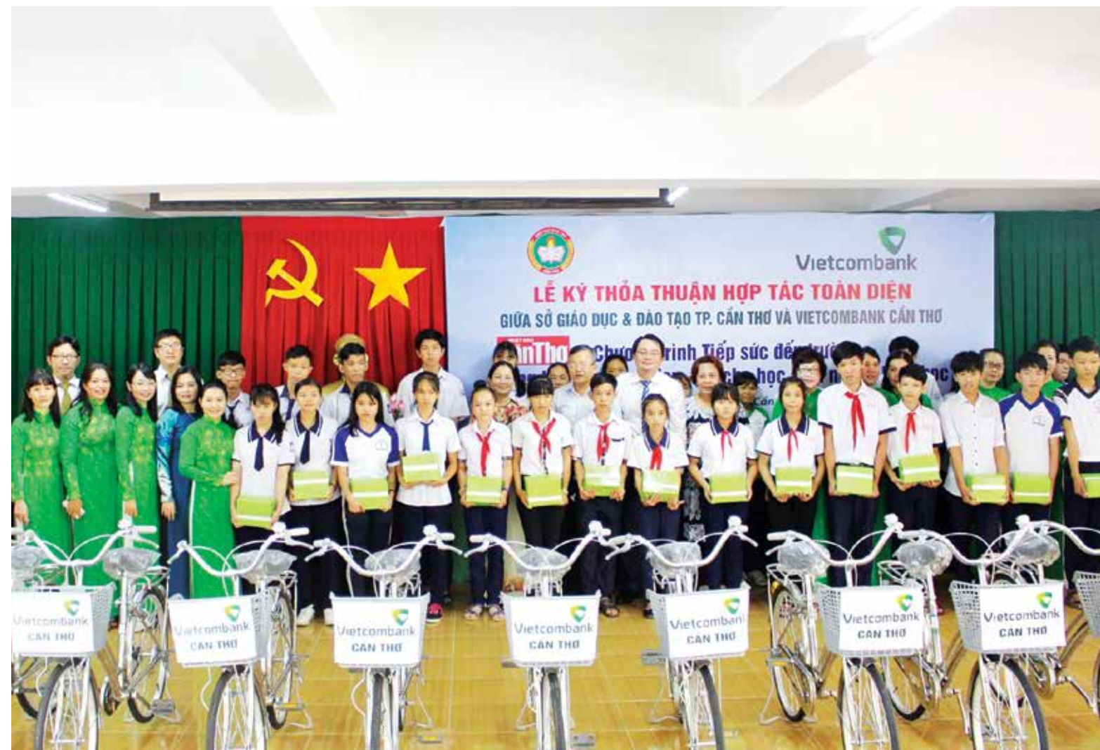
Lãnh đạo Quận Ninh Kiều, lãnh đạo Sở GD&ĐT TP. Cần Thơ và đại diện Vietcombank Cần Thơ trao học bổng và xe đạp cho các em học sinh nghèo hiếu học

Nhân dịp ký kết Thỏa thuận hợp tác toàn diện, Vietcombank Cần Thơ phối hợp với Sở GD&ĐT TP. Cần Thơ và báo Cần Thơ, thực hiện chương trình Tiếp sức đến trường đối với các em học sinh nghèo hiếu học trên địa bàn. Tại đây Vietcombank Cần Thơ đã trao tặng 20 suất học bổng và 30 xe đạp để hỗ trợ các em trong năm học mới. □