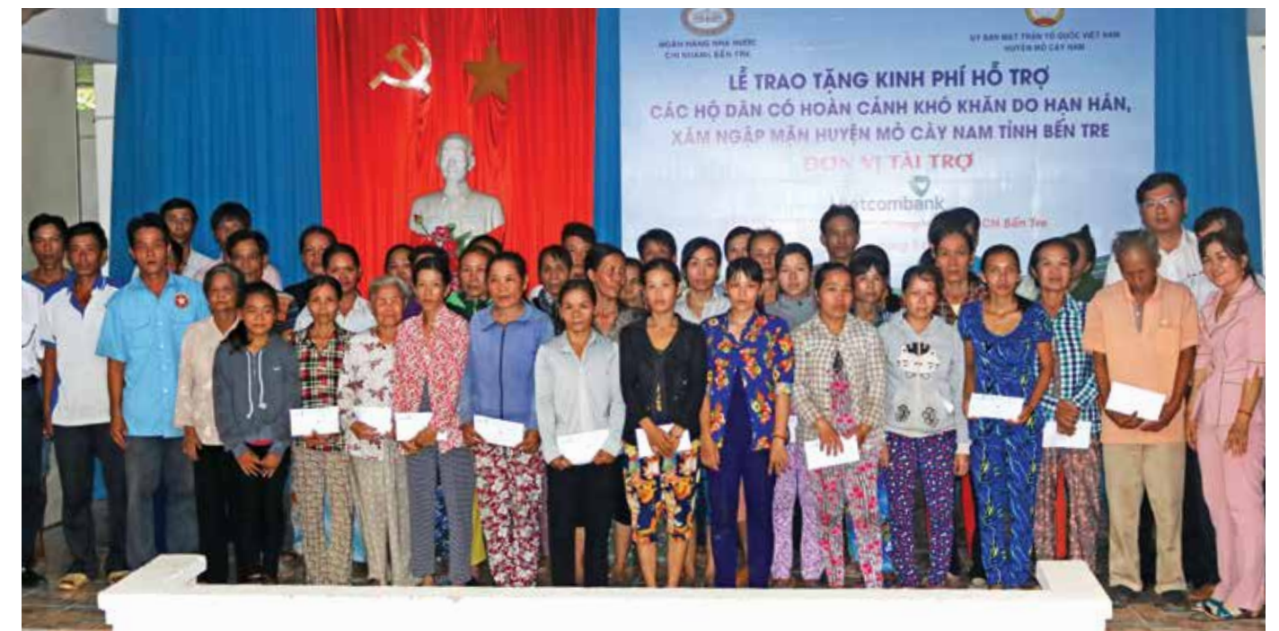
Hỗ trợ 50 hộ dân vùng hạn hán, ngập mặn