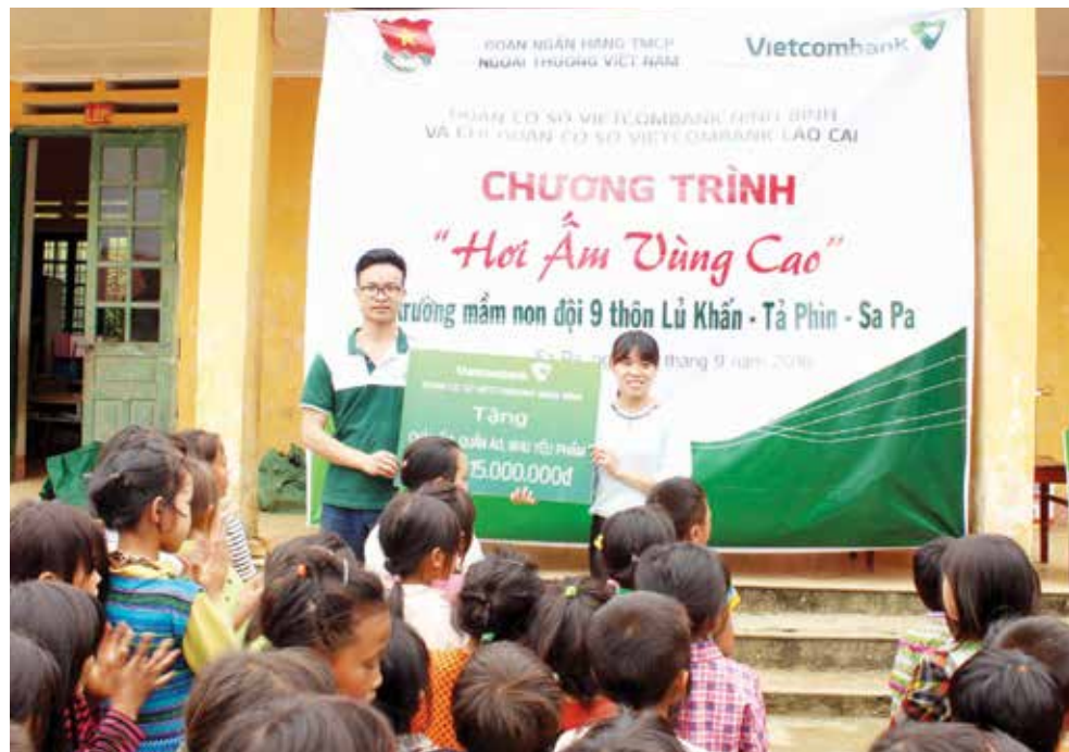
Đoàn CS Vietcombank Ninh Bình trao tặng 15 triệu đồng