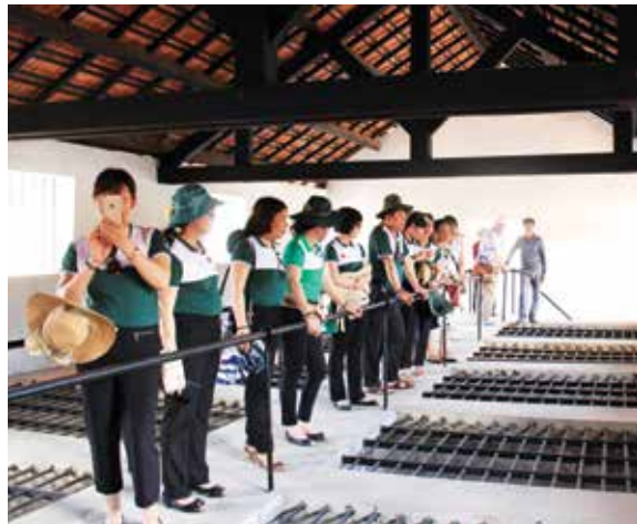
Đoàn thăm quan nghe hướng dẫn viên kể về các kiểu tra tấn trong hệ thống chuồng cạp kiểu Pháp tại Trung tâm cải huấn Trại Phú Tường.

Đoàn về nguồn đã đến dâng hương và đặt vòng hoa tưởng nhớ các anh hùng liệt sĩ tại Nghĩa trang Hàng Dương – nơi chôn cất hàng vạn chiến sĩ cách mạng và người yêu nước Việt Nam qua nhiều thế hệ bị tù đày; tham quan Trung tâm cải huấn Trại Phú Hải, Trại Phú Tường, với hệ thống chuồng cạp kiểu Pháp, kiểu Mỹ; và bảo tàng Côn đảo.