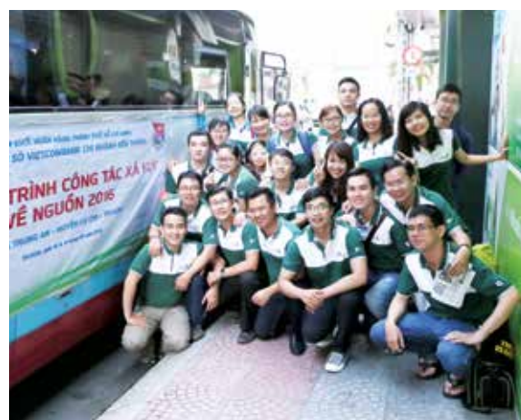
Khởi hành chuyến đi tại Chi nhánh Bến Thành

Vừa đến địa bàn xã Trung An, huyện Củ Chi, Đoàn đã đến viếng Khu tưởng niệm Trung Đội Gò Môn để dâng hương, dâng hoa tưởng nhớ các anh hùng đã hy sinh vì nền độc lập của Tổ quốc. Trong ánh mắt của