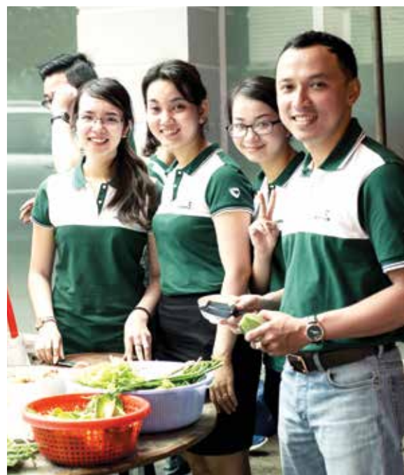
Hội thi tung búng

Với gần 60% lao động là nữ, các chị em đã đóng góp thành tích không nhỏ vào thành quả kinh doanh. Đến 30/9/2016, Vietcombank Nam Bình Dương đạt được một số thành quả sau: Huy động vốn từ nền kinh tế đạt 3.595,6 tỷ đồng, tăng 35% so với cuối năm 2015, đạt 117% kế hoạch quý III và 108% kế hoạch năm; Dự nợ cho vay đạt 6.532,7 tỷ đồng, tăng 16% so với cuối năm 2015, đạt 100% kế hoạch quý III và 92% kế hoạch năm; Lợi nhuận từ hoạt động kinh doanh trước trích lập dự phòng đạt 87,5 tỷ đồng.