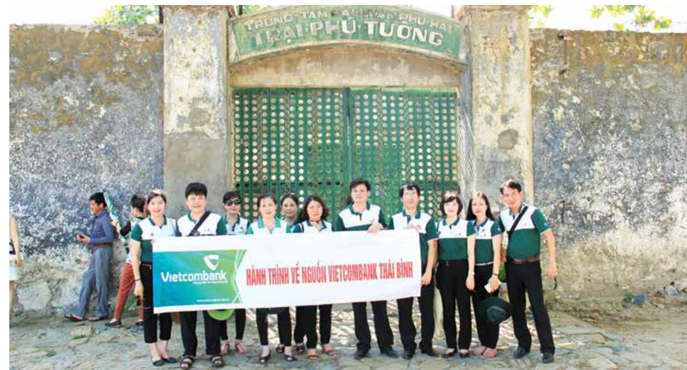
Vietcombank Thái Bình về nguồn tại Côn Đảo

Hoạt động ý nghĩa này không chỉ là cơ hội để các đảng viên và đoàn viên ưu tú thấu hiểu sâu sắc hơn về cuộc đấu tranh anh dũng của quân và dân ta trong cuộc kháng chiến chống giặc ngoại xâm, mà còn tuyên truyền giáo dục truyền thống cách mạng, khơi dậy tinh thần yêu nước, và tạo động lực cho mỗi thành viên hăng say lao động hơn nữa để góp sức mình trong sự nghiệp xây dựng và bảo vệ Tổ quốc ngày hôm nay. □