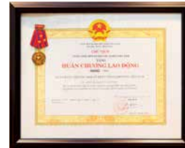
Huân chương Lao động hạng Nhất của Chủ tịch nước tặng Vietcombank Hồ Chí Minh