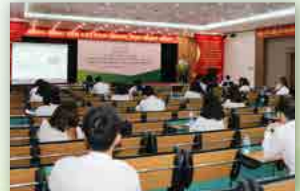
Quang cảnh Hội nghị.

Sáng ngày 17/7/2021, tại trụ sở chi nhánh, Vietcombank Hải Phòng đã tổ chức Hội nghị Sơ kết công tác Đảng và hoạt động kinh doanh 6 tháng đầu năm, triển khai nhiệm vụ 6 tháng cuối năm 2021.