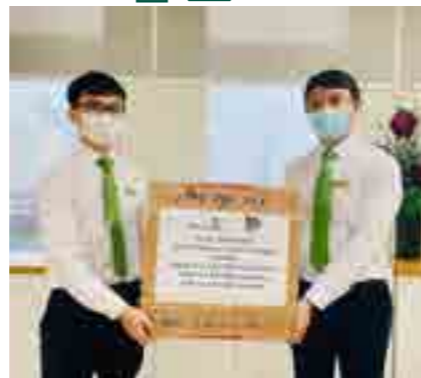
Đoàn viên Vietcombank TP. HCM đại diện các cơ sở Đoàn Vietcombank trên địa bàn tiếp nhận phần quà từ Đoàn Thanh niên Vietcombank Sở giao dịch.