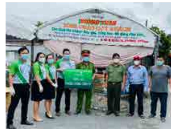
Đoàn Thanh niên Vietcombank Vĩnh Long trao tặng nhu yếu phẩm cho chốt kiểm soát.

Vietcombank Vĩnh Long vẫn đang tiếp tục các hoạt động để cùng chung tay chia sẻ khó khăn, tiếp thêm sức mạnh cho người dân cùng với đội ngũ y, bác sĩ trên địa bàn thêm quyết tâm đẩy lùi đại dịch COVID-19.