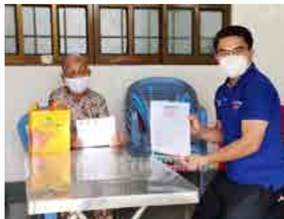
Đại diện Ban Tổ chức chương trình tặng quà cho Bà mẹ Việt Nam Anh hùng trên địa bàn TP. HCM.

Đảng ủy - Ban Giám đốc, Ban Chấp hành Công đoàn và Đoàn Thanh niên Vietcombank TP. HCM đã phát động toàn thể cán bộ, nhân viên Chi nhánh ủng hộ nhiệt tình các chương trình an sinh xã hội thiết thực nhằm đồng hành và chung tay cùng Thành phố đẩy lùi dịch COVID-19.