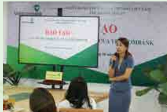
Giảng viên đang thực hành đào tạo theo chương trình của Ban Tổ chức.

Kết quả đợt thi nghiệp vụ, Ban Tổ chức cuộc thi đã tiến hành trao giải cho 4 tập thể và 8 cá nhân có thành tích xuất sắc nhất. Qua đợt thi, tinh thần nỗ lực phấn đấu trong học tập, công tác của mỗi cán bộ, nhân viên trong Chi nhánh được nâng lên rõ rệt, tạo tiền đề mạnh mẽ trong việc hoàn thành các chỉ tiêu, nhiệm vụ năm 2021 và những năm tiếp theo.