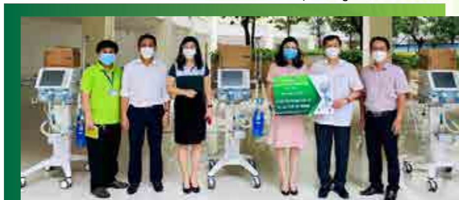
Lãnh đạo Vietcombank TP. HCM trao tặng 3 máy thở đa năng cao cấp cho Bệnh viện Chợ Rẫy.

Đoàn Thanh niên Chi nhánh với tinh thần xung kích, luôn hưởng ứng và hỗ trợ tích cực bằng sức trẻ nhiệt huyết của mình trong tất cả các hoạt động xã hội của Chi nhánh. Song song với các chương trình của Đảng ủy – Ban Giám đốc, BCH Công đoàn, Đoàn Thanh niên Chi nhánh đã tham gia chương trình “Chợ nghĩa tình” do Sở Công Thương, FPT và Thành Đoàn TP. HCM phối hợp tổ chức. Chương trình đã phục vụ hơn 2.700 hộ dân, với tổng giá trị hàng hóa ước tính hơn 800 triệu đồng.