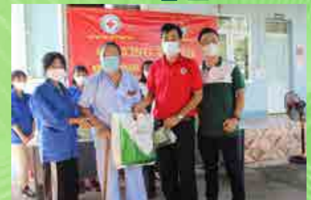
Đoàn viên Chi đoàn Vietcombank Móng Cái tặng quà gia đình chính sách.

Hưởng ứng các hoạt động “Đền ơn đáp nghĩa - Uống nước nhớ nguồn” nhân kỷ niệm 74 năm ngày Thương binh, Liệt sĩ (27/7/1947 - 27/7/2021), ngày 24/7/2021, Chi đoàn Vietcombank Móng Cái phối hợp với Thành Đoàn Móng Cái, Hội Chữ thập đỏ, Trung tâm Y tế TP. Móng Cái tổ chức khám sàng lọc, tư vấn, cấp phát thuốc miễn phí và tặng quà cho 53 trường hợp người cao tuổi, người có công với cách mạng trên địa bàn 2 xã Hải Đông và Hải Tiến, TP. Móng Cái, tỉnh Quảng Ninh.