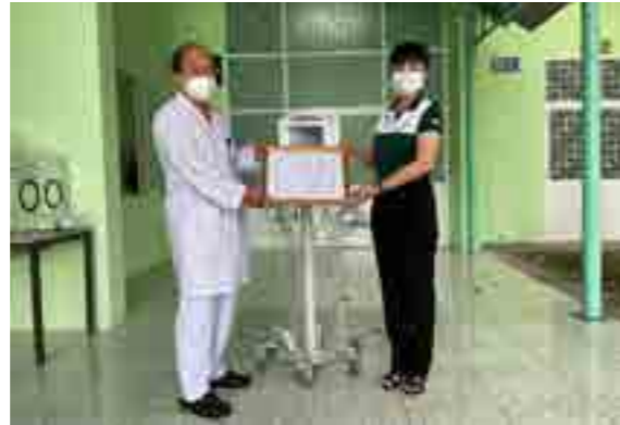
Đại diện Ban Giám đốc Bệnh viện trao Thư cảm ơn Vietcombank Nam Sài Gòn.