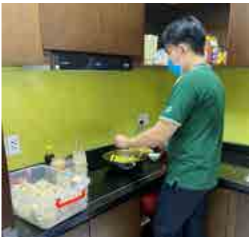
Chế biến bữa ăn “3 tại chỗ”.

kiểm soát phòng chống dịch nhằm bảo vệ sức khỏe cho toàn thể lao động. Ngoài ra, các bạn đoàn viên, thanh niên sau khi hoàn thành giờ làm việc chuyên môn đã chính tay nấu những bữa ăn thật đa dạng, ngon và bổ dưỡng cho toàn thể anh chị em cán bộ, nhân viên Chi nhánh.