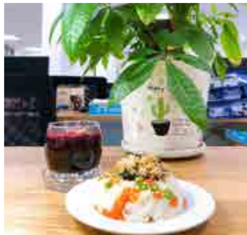
Bữa ăn “3 tại chỗ”.