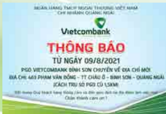
Thông báo về việc chuyển địa điểm làm việc Phòng giao dịch Bình Sơn.

Ngân hàng Vietcombank Quảng Ngãi trân trọng thông báo: Kể từ ngày 9/8/2021, Phòng Giao dịch Bình Sơn trực thuộc Vietcombank Quảng Ngãi chuyển về trụ sở mới: 463 Phạm Văn Đồng, thị trấn Châu Ổ, huyện Bình Sơn, tỉnh Quảng Ngãi.