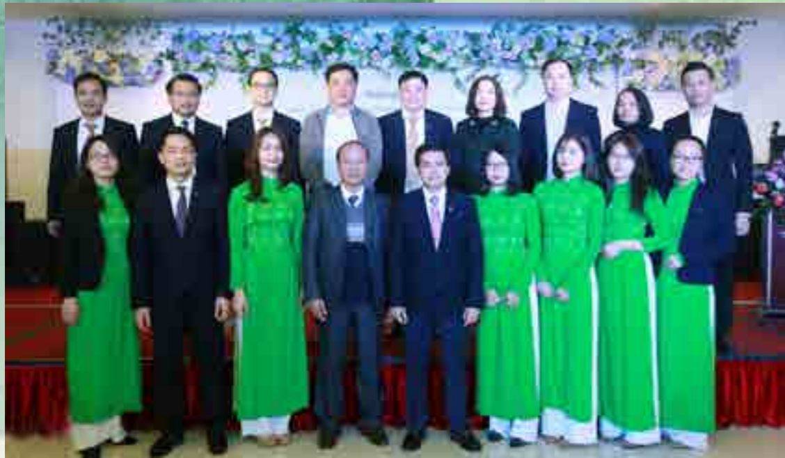
Ban Giám đốc, các trưởng phòng Vietcombank Phú Thọ chụp ảnh lưu niệm cùng các đại biểu Ngân hàng Nhà nước tỉnh Phú Thọ.