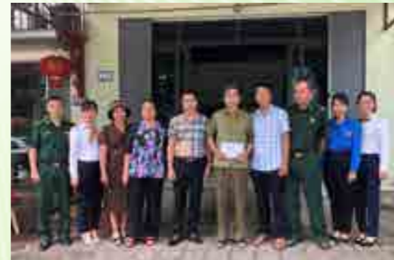
Vietcombank Lào Cai tặng quà thương bệnh binh, Bà mẹ Việt Nam Anh hùng, Anh hùng lực lượng vũ trang nhân dân, gia đình có công với Cách mạng trên địa bàn tỉnh.

Bên cạnh đó, ngày 27/7/2021, Vietcombank Lào Cai đã trực tiếp đến thăm hỏi, tặng quà và gửi thư tri ân của Giám đốc Chi nhánh đến 17 trường hợp là người thân của cán bộ Vietcombank Lào Cai là thương binh, liệt sĩ, bệnh binh, Anh hùng Lực lượng vũ trang nhân dân.