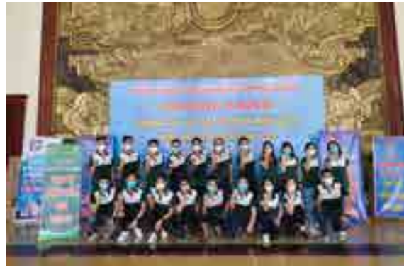
Các đoàn viên Vietcombank Bắc Giang tham gia chương trình ủng hộ thực phẩm, nhu yếu phẩm cho các tỉnh phía Nam ứng phó với dịch COVID-19.

Tại sự kiện, Vietcombank Bắc Giang đã ủng hộ 1 tấn lạc nhân, trị giá 40 triệu đồng, đóng góp một phần nhu yếu phẩm chi viện cho nhân dân miền Nam vượt qua đại dịch COVID-19. Đồng thời, Đoàn Thanh niên Vietcombank Bắc Giang là lực lượng tham gia chính hỗ trợ đóng gói, bốc xếp 10 tấn lạc cùng các nhu yếu phẩm khác do Đảng bộ Khối Doanh nghiệp tỉnh Bắc Giang tiếp nhận. Trong những ngày tới, các nhu yếu phẩm này cùng với hơn 170 tấn hàng do các Hội, Hiệp hội trong tỉnh Bắc Giang vận động sẽ được vận chuyển vào các tỉnh miền Nam hỗ trợ, góp phần nhanh chóng đẩy lùi dịch bệnh.