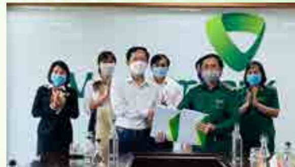
Lễ ký kết thỏa thuận tài trợ giữa Vietcombank Kon Tum và Tổng đội Thanh niên xung phong tỉnh Kon Tum.

Ngày 21/7/2021, Vietcombank Kon Tum và Tổng đội Thanh niên xung phong tỉnh Kon Tum đã tổ chức lễ ký kết thỏa thuận tài trợ xây dựng căn nhà tình nghĩa trị giá 50 triệu đồng cho cựu thanh niên xung phong thuộc hộ nghèo trên địa bàn tỉnh Kon Tum.