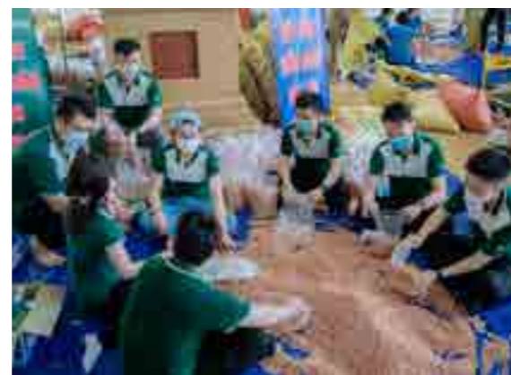
Các đoàn viên Vietcombank Bắc Giang tham gia đóng gói nhu yếu phẩm ủng hộ các tỉnh miền Nam.