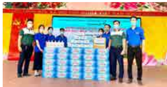
Bí thư và Phó Bí thư Đoàn Thanh niên Vietcombank Lạng Sơn trao tặng các phần quà hỗ trợ, tiếp sức cho kỳ thi.

Ngày 11/7/2021, Vietcombank Lạng Sơn đã phối hợp cùng trường THPT chuyên Chu Văn An, THPT Việt Bắc, THPT Cao Lộc, THPT Hoàng Văn Thụ tham gia tiếp sức kỳ thi tuyển sinh lớp 10 THPT tại 4 điểm trường trên.