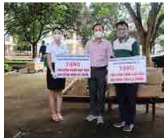
Đoàn Thanh niên Vietcombank Đắk Lắk tặng 1.000 kính chắn giọt bắn cho Bệnh viện dã chiến Đắk Lắk.

Chiều ngày 30/7/2021, cùng với các đơn vị trong Đoàn Khối các cơ quan và doanh nghiệp tỉnh Đắk Lắk, Đoàn Thanh niên Vietcombank Đắk Lắk đã đến thăm, động viên lực lượng bác sĩ, chiến sĩ, tình nguyện viên tại Bệnh viện dã chiến Đắk Lắk.