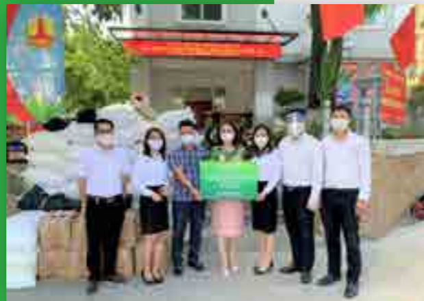
Vietcombank Ba Đình trao tặng quà ủng hộ các gia đình có hoàn cảnh khó khăn bị ảnh hưởng bởi dịch COVID-19 cho UBND phường Liễu Giai.

Hưởng ứng lời kêu gọi của UBND phường Liễu Giai, quận Ba Đình, TP. Hà Nội, chiều ngày 19/8/2021, Vietcombank Ba Đình đã ủng hộ 2 tấn gạo và 167 chai dầu ăn cho UBND phường, nhằm tiếp thêm nguồn lực hỗ trợ các hộ gia đình có hoàn cảnh khó khăn bị ảnh hưởng bởi dịch bệnh COVID-19. Tổng giá trị ủng hộ là 34,5 triệu đồng.