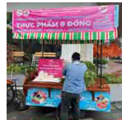
Vietcombank Cần Thơ đồng hành cùng chương trình “Thực phẩm 0 đồng”.

Với mục tiêu cung cấp lương thực, thực phẩm sạch cho người dân khó khăn trên địa bàn trong thời gian thành phố thực hiện giãn cách xã hội, chương trình “Thực phẩm 0 đồng” đã góp phần chia sẻ, giúp đỡ người dân trên địa bàn vượt qua khó khăn trước mắt, đồng hành cùng chính quyền địa phương chung tay phòng, chống dịch bệnh.