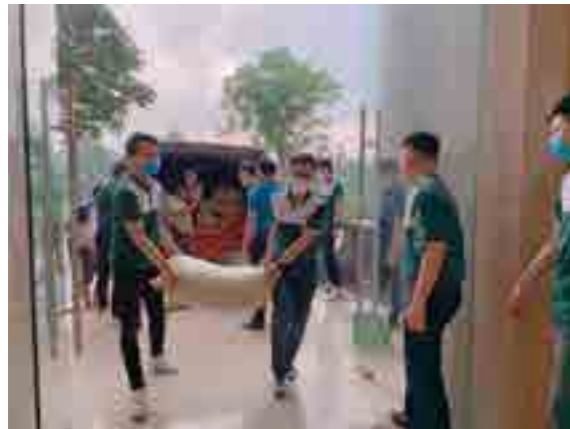
Vietcombank Bắc Giang tham gia ủng hộ các tỉnh phía Nam vượt qua đại dịch COVID-19.