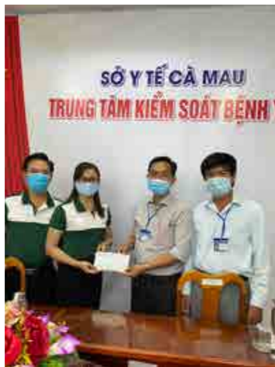
Bí thư Đoàn Vietcombank Cà Mau trao tặng quà ủng hộ CDC Cà Mau.

Có thể nói, đại dịch lần này đã và đang gây tổn thất rất lớn cho nền kinh tế, nhận thức được điều này, Vietcombank nói chung, Vietcombank Cà Mau nói riêng luôn đồng hành cùng doanh nghiệp, các hộ kinh doanh và các cá nhân vay vốn bằng cách hỗ trợ 0,5 - 1% lãi suất vay để giảm bớt phần nào áp lực, khó khăn trước đại dịch COVID-19. Bên cạnh đó, để hoàn thành tốt nhiệm vụ kép vừa kinh doanh, vừa chống dịch, Vietcombank Cà Mau đã tuân