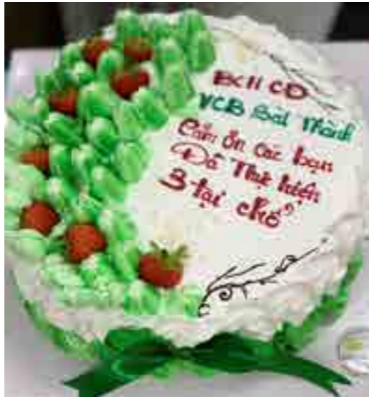
Lời cảm ơn bữa ăn “3 tại chỗ”.

Sau một tháng vận hành “3 tại chỗ”, Ban Giám đốc và BCH Công Đoàn Vietcombank Sài Thành luôn quan tâm, hỗ trợ cùng cán bộ, nhân viên thực hiện các hoạt động nghiệp vụ chuyên môn cũng như công tác