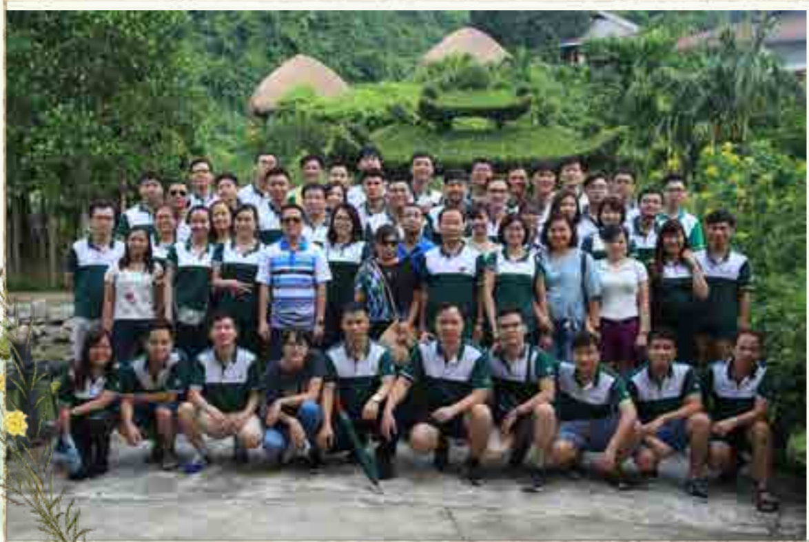
Tập thể Vietcombank Phú Thọ dã ngoại.

Với Ban Giám đốc trẻ, tài năng, cùng đội ngũ lãnh đạo trẻ trung, năng động đã đang và sẽ chèo lái con thuyền cùng "Người ấy" đưa anh em vượt bão táp vươn xa ngoài biển khơi, ngày càng khẳng định vị thế của mình trên địa bàn tỉnh nói riêng và trong hệ thống Vietcombank nói chung. Ngày nay, Vietcombank Phú Thọ đã có một diện mạo mới, một vị thế mới, và sắp tới có một trụ sở mới tọa lạc trên con đường trung tâm bậc nhất thành phố. Thật tự hào khi mình là một thành viên nhỏ bé trong đại gia đình ấy.