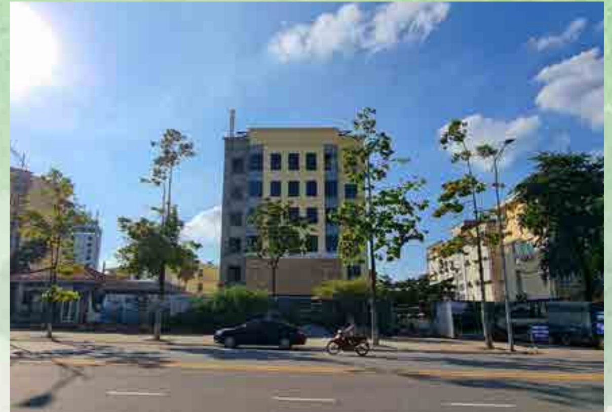
Sở Vietcombank Phú Thọ đang trong quá trình hoàn thiện.

Mạng lưới khách hàng của Vietcombank Phú Thọ được trải rộng khắp địa bàn với mọi thành phần kinh tế tham gia. Chi nhánh hiện có hơn 100.000 khách hàng cá nhân; trên 2.000 doanh nghiệp mở tài khoản và giao dịch. Xác định nguồn vốn huy động và dư nợ tín dụng luôn là