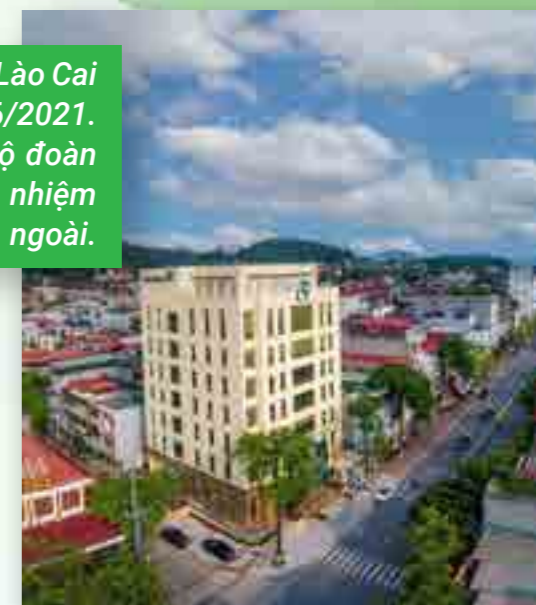
Trụ sở mới của Vietcombank Lào Cai tọa lạc tại số 052 đường Hoàng Liên, phường Cốc Lếu, TP. Lào Cai.

Vietcombank Lào Cai hiện có gần 60.000 khách hàng giao dịch, có thị phần tương đương các ngân hàng thương mại Nhà nước đi trước trên địa bàn, với 4 phòng giao dịch và 100 cán bộ giỏi giang, tận tụy. Ngày mở cửa đón vị khách đầu tiên đến Trụ sở mới của Vietcombank Lào Cai, toàn thể Ban Giám đốc và CBNV đều đến cơ quan sớm hơn để chuẩn bị. Lần đầu tiên được đứng trên đỉnh tòa nhà Vietcombank rất cao, thu vào tầm mắt cả thành phố vùng biên, chúng tôi thấy thật tự hào. Đối với cán bộ, nhân viên Vietcombank Lào Cai hôm nay, “ngôi nhà” này quả chứa đựng rất nhiều yêu thương và gắn bó!