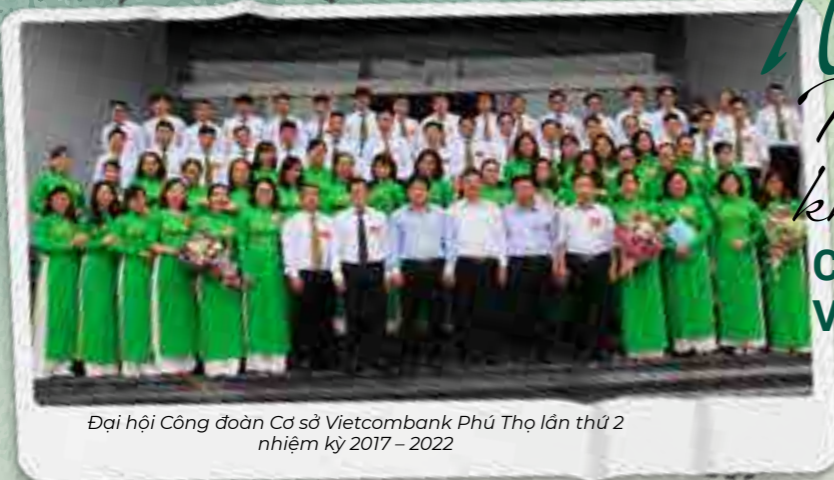
Đại hội Công đoàn Cơ sở Vietcombank Phú Thọ lần thứ 2 nhiệm kỳ 2017 – 2022