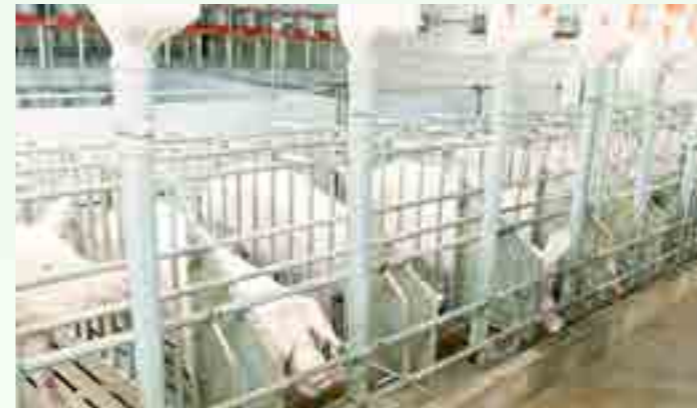
Hình ảnh minh họa trang trại nuôi heo.

Đồng hành cùng khách hàng trong hoạt động sản xuất kinh doanh, Vietcombank ra mắt sản phẩm cho vay đầu tư trang trại nuôi heo dành cho khách hàng doanh nghiệp SME, khách hàng cá nhân là chủ doanh nghiệp tư nhân.