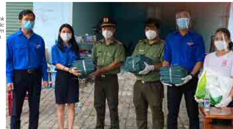
Đoàn Thanh niên Vietcombank Long An tặng áo đi mưa cho các cán bộ làm nhiệm vụ tại chốt kiểm soát Tân Bửu, Bến Lức, Long An.

Như vậy, tính đến thời điểm hiện tại, trong năm 2021, Vietcombank Long An đã ủng hộ 485,5 triệu đồng cho đến công tác phòng, chống dịch COVID-19, với mong muốn được chung tay, góp sức sớm đẩy lùi dịch bệnh.