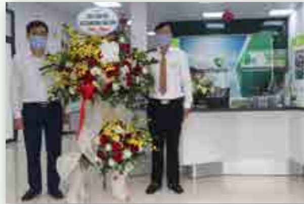
Địa điểm hoạt động mới của Phòng giao dịch Bồ Xuyên khang trang, hiện đại tại số 1 Trần Thái Tông, phường Bồ Xuyên, TP. Thái Bình, tỉnh Thái Bình.

Ngày 16/8/2021, Vietcombank Thái Bình đã khai trương hoạt động địa điểm mới: Phòng giao dịch Bồ Xuyên.