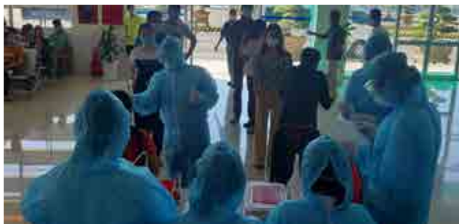
Các nhân viên CDC Cà Mau đang hỗ trợ người dân lấy mẫu xét nghiệm dịch tễ.

Hy vọng, với những nỗ lực của Vietcombank Cà Mau cùng tỉnh nhà tạo thành khối đoàn kết chiến thắng dịch bệnh.