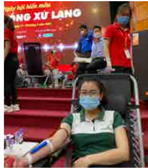
Đoàn viên, thanh niên Vietcombank Lạng Sơn tham gia Ngày hội hiến máu “Giọt hồng xứ Lạng”.

Ngày 17/7/2021, Vietcombank Lạng Sơn vinh dự tham gia ngày hội hiến máu nhân đạo “Giọt hồng xứ Lạng” do Ban Chỉ đạo vận động hiến máu tình nguyện tỉnh Lạng Sơn phối hợp với Ban Tổ chức “Hành trình đỏ” Trung ương năm 2021 tổ chức.