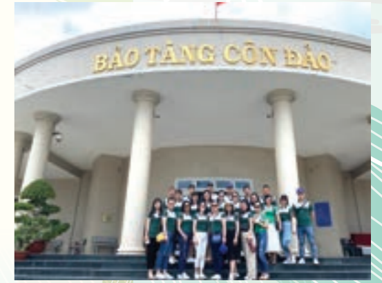
Đảng viên Chi bộ Vietcombank Quảng Ninh tham quan Bảo tàng Côn Đảo