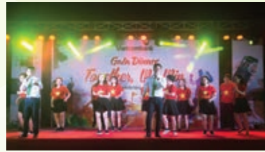
Một tiết mục văn nghệ tại Gala dinner

tiền gửi lớn; các đơn vị cung cấp điện, nước, trường học, bệnh viện và các đơn vị hành chính công. Về tín dụng, tích cực đẩy mạnh công tác cho vay bán lẻ, tiếp tục giảm dư nợ bán buôn có chất lượng kém. Về dịch vụ, tăng cường phát triển khách hàng cá nhân và tích cực chào bán các sản phẩm dịch vụ, đặc biệt là dịch vụ VCB Digibank; rà soát, phân công, sắp xếp lại lao động hợp lý và tổ chức các khóa đào tạo về kỹ năng bán hàng, nâng cao chất lượng phục vụ khách hàng.