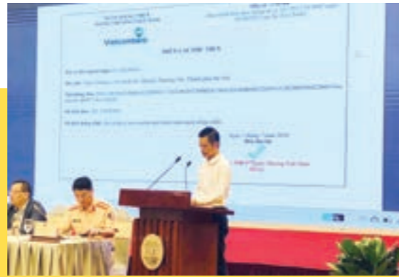
Đại diện Bảo hiểm xã hội Việt Nam giới thiệu dịch vụ thanh toán trực tuyến trên cổng DVCQG qua Vietcombank