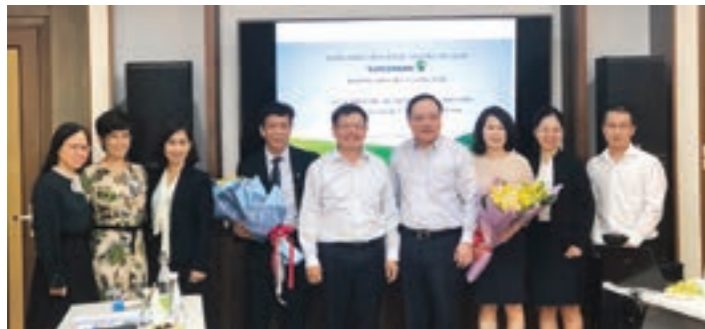
Hội đồng nghiệm thu và nhóm nghiên cứu đề tài