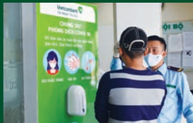
Nhân viên bảo vệ luôn thực hiện nghiêm việc đo thân nhiệt và yêu cầu khách hàng rửa tay sát khuẩn

Các hoạt động ý nghĩa này giúp khách hàng hiểu thêm về nét đẹp của văn hóa Vietcombank, góp phần tạo thêm sự gắn bó, đoàn kết, yêu thương giữa các thành viên trong từng tổ ấm nhỏ cũng như đại gia đình Vietcombank Phú Yên.