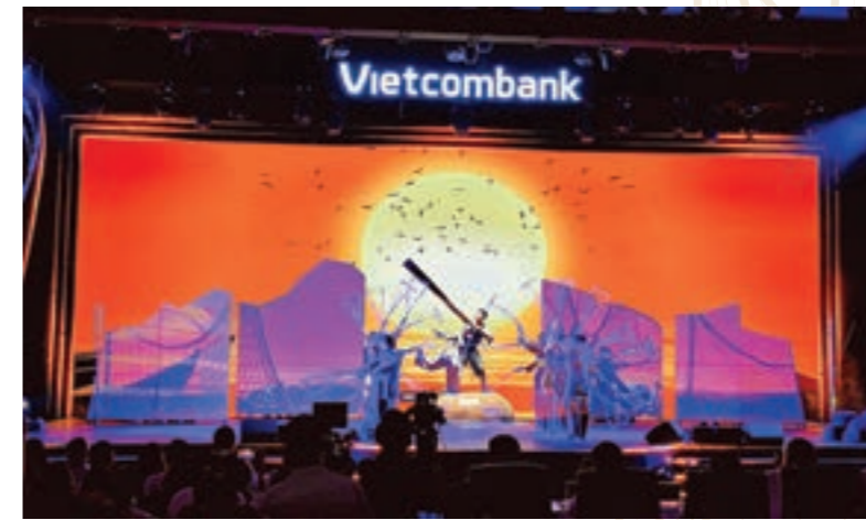
“Những cánh sen trên biển” được kể một cách sinh động bằng các điệu múa đương đại kết hợp với âm nhạc, ánh sáng, hình ảnh và hiệu ứng công nghệ

Ở phần thi thứ hai - Văn hóa Vietcombank dưới ánh sáng tư tưởng Hồ Chí Minh, đội thi trình diễn vở nhạc kịch “Mùa sen nở”, tác phẩm được chuyển thể từ