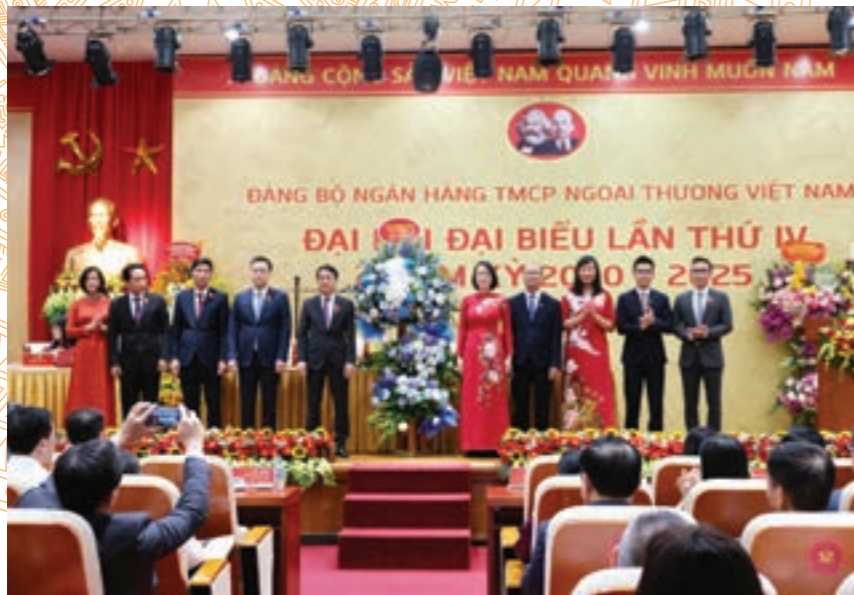
Đoàn Thanh niên Vietcombank tặng lẵng hoa chúc mừng Đại hội đại biểu Đảng bộ Vietcombank lần thứ IV, nhiệm kỳ 2020-2025