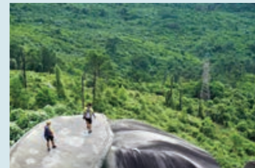
Phượt thủ xe đạp leo đèo Hải Vân nhất định phải check-in Hòn đá Cù Rùa

Hòn đá Cù Rùa mang vẻ đẹp thiên nhiên ảo diệu, nơi giao hòa giữa đất trời, rừng núi và biển cả mênh mông. Check-in ở đây vào những ngày sương mây trời lãng đãng dọc theo triền núi, ngồi trên mỏm đá hình đầu rùa nhìn ra biển (chủ quán gọi là hòn đá mũi thuyền), lữ khách sẽ cảm thấy mình như đang trôi bồng bênh, chênh choáng trước vẻ đẹp kỳ vĩ của cung đường đèo Hải Vân.