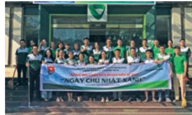
Ra quân Ngày Chủ nhật xanh 2020 – Trụ sở Vietcombank Thanh Hóa