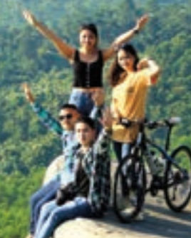
Hòn đá Cù Rùa cũng là điểm check-in của nhiều bạn trẻ