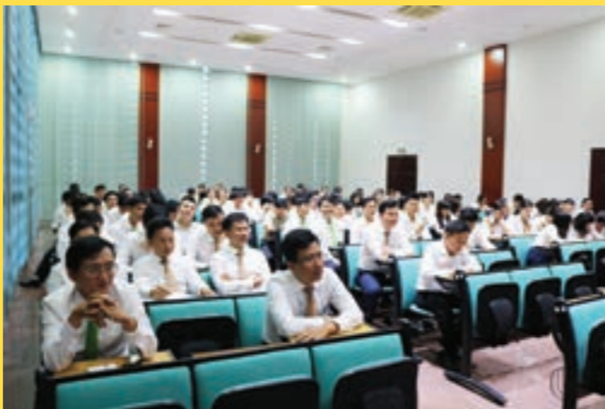
CBNV Vietcombank Long An tham dự Hội nghị sơ kết Công đoàn.

Công đoàn cơ sở cũng đã đề ra nhiệm vụ trọng tâm đối với hoạt động công đoàn trong nửa cuối nhiệm kỳ, mà mục tiêu cao nhất là chăm lo tốt đời sống công đoàn viên, người lao động.