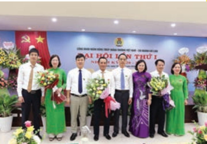
Các đ/c Lãnh đạo Liên đoàn Lao động tỉnh Hải Dương, Công đoàn ngành Ngân hàng trên địa bàn tỉnh Hải Dương, đ/c Bí thư Chi bộ - Giám đốc Vietcombank Chí Linh chúc mừng BCH Công đoàn cơ sở khóa I nhiệm kỳ 2020-2025