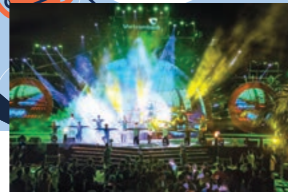
Tiết mục văn nghệ ấn tượng của Đoàn thanh niên Vietcombank Thăng Long kết lại đêm gala