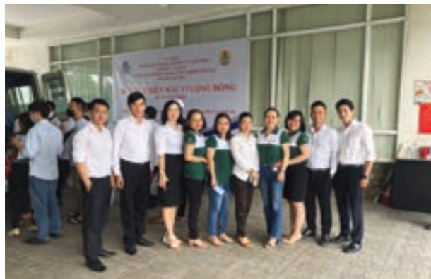
CBNV Vietcombank Bắc Sài Gòn chụp hình lưu niệm tại điểm hiến máu

Nhằm chung tay với cộng đồng chăm sóc sức khỏe cho người dân, đặc biệt là các hộ cận nghèo không có khả năng chi trả chi phí khám chữa bệnh, ngày 08/7/2020, Vietcombank Đồng Tháp đã phối hợp với Tỉnh hội Đồng Tháp trao tặng 300 thẻ BHYT cho hộ cận nghèo có hoàn cảnh khó khăn tại các địa bàn trong tỉnh để sử dụng khi khám chữa bệnh.