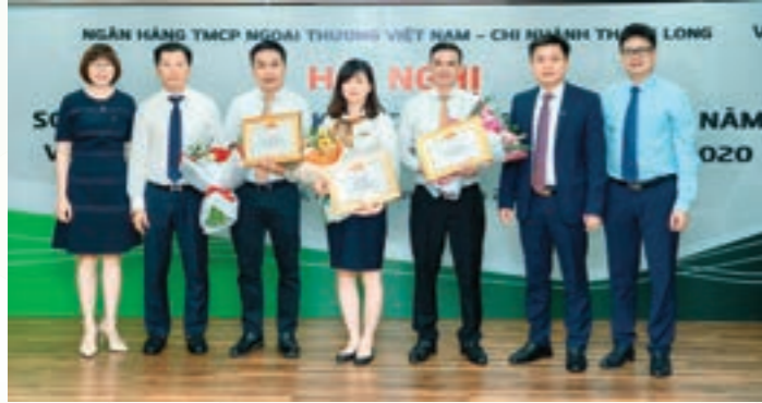
Ban Giám đốc CN trao Giấy khen cho các tập thể tiêu biểu hoàn thành xuất sắc nhiệm vụ