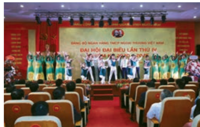
Tiết mục văn nghệ chào mừng Đại hội đại biểu Đảng bộ Vietcombank nhiệm kỳ 2020-2025