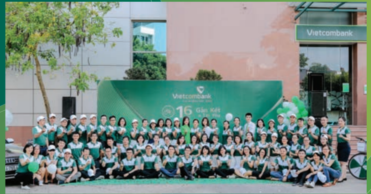
Vietcombank Bắc Ninh tổ chức chương trình "Hành trình 16 năm gắn kết, tin yêu"