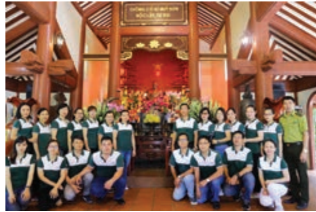
Đoàn chụp ảnh lưu niệm trong Đền thờ Bác Hồ tại đỉnh Vua - Ba Vì

TỪ NGÀY 12-13/07/2020, CHI BỘ VIETCOMBANK KỶ ĐỒNG ĐÃ TỔ CHỨC HÀNH TRÌNH VỀ NGUỒN CHO 22 CÁN BỘ, ĐẢNG VIÊN VÀ QUẢN CHỨNG ƯU TÚ TẠI ĐỀN THỜ KỶ ĐỒNG - NGUYỄN VĂN CẨM (BẮC GIANG) VÀ ĐỀN THỜ BÁC HỒ TẠI ĐỈNH VUA - BA VÌ (HÀ NỘI).