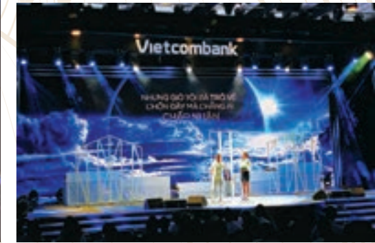
Nam và Thư - 2 nhân vật chính trong vở nhạc kịch “Mùa sen nở”