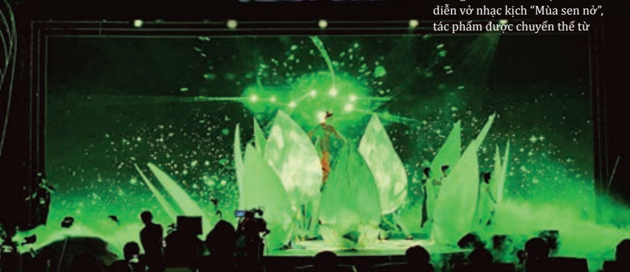
Những cánh sen trắng trên biển được ví như những chiếc thuyền Vietcombank chèo chống khát vọng của doanh nghiệp và người dân miền Trung “Chung niềm tin vững tương lai”