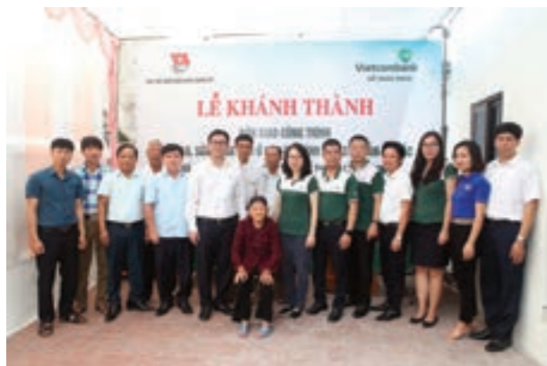
Đoàn công tác Vietcombank Sở giao dịch chụp ảnh lưu niệm cùng gia đình liệt sĩ và chính quyền địa phương