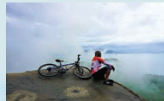
Hòn đá Cù Rùa vào một ngày sương mây lãng đãng