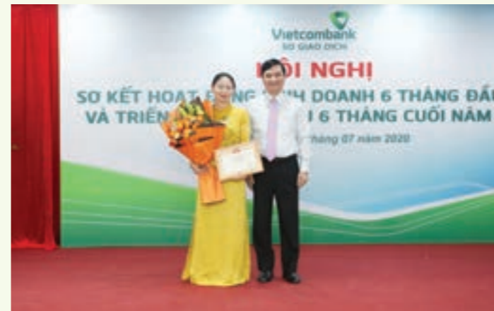
Ban Giám đốc Vietcombank Sở giao dịch khen thưởng và chúc mừng đại diện nhóm tác giả có thành tích tiêu biểu trong công tác nghiên cứu khoa học của CN

Hội nghị cũng đã nghe chia sẻ của 2 tập thể và 1 cá nhân vừa được khen thưởng tiêu biểu 6 tháng đầu năm 2020 về kinh nghiệm triển khai kế hoạch được giao, cách tạo động lực cho cán bộ cũng như xây dựng mối đoàn kết trong tập thể.