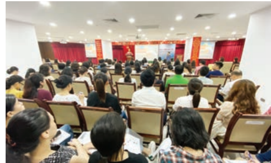
Toàn cảnh buổi đào tạo