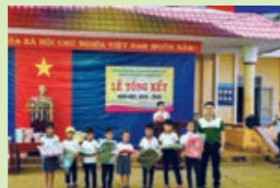
Đoàn thanh niên Vietcombank Đắk Lắk trao quà cho các em học sinh có thành tích xuất sắc

Với những hành động thiết thực dù nhỏ bé, Đoàn cơ sở Vietcombank Đắk Lắk hy vọng mang đến các em học sinh sự động viên ấm áp, tiếp sức tinh thần để các em tiếp tục học tốt, trở thành những người có ích cho xã hội.