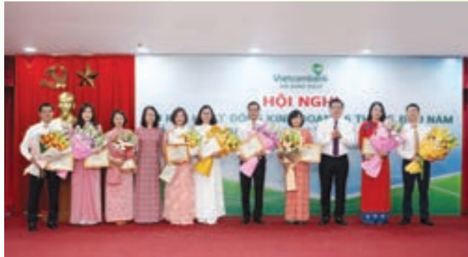
Ban Giám đốc Vietcombank Sở giao dịch khen thưởng và chúc mừng các tập thể có thành tích tiêu biểu 6 tháng đầu năm 2020