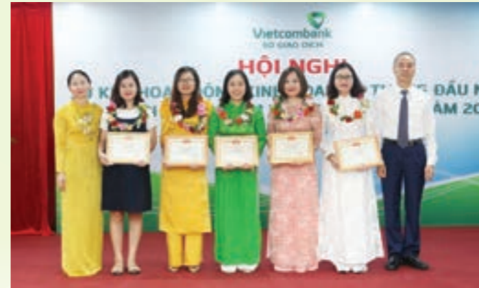
Ban Giám đốc Vietcombank Sở giao dịch khen thưởng và chúc mừng các cá nhân có thành tích tiêu biểu 6 tháng đầu năm 2020