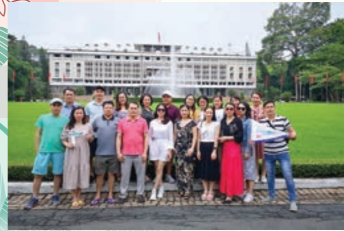
Đảng viên Chi bộ Vietcombank Quảng Ninh tham quan Dinh Độc Lập

Hành trình về nguồn của Chi bộ Vietcombank Kỳ Đồng mang lại nhiều cung bậc cảm xúc, để lại ấn tượng đặc biệt trong lòng mỗi cán bộ, đảng viên về tên gọi Kỳ Đồng - cũng là tên con đường được chọn để đặt trụ sở Chi nhánh; về cuộc đời, sự nghiệp cách mạng và tấm gương đạo đức sáng ngời của vị lãnh tụ kính yêu của dân tộc Việt Nam.