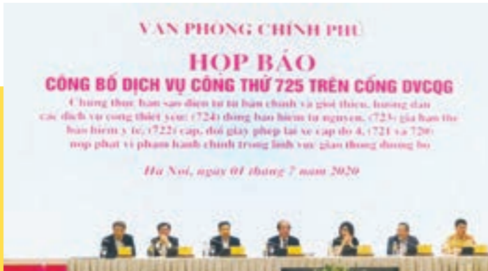
Họp báo công bố Dịch vụ công thứ 725 trên Cổng DVCQG