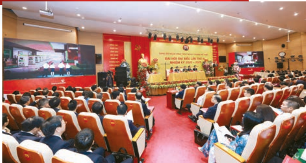
Quang cảnh Đại hội