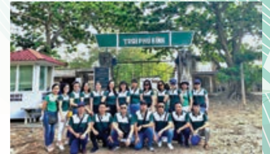
Đảng viên Chi bộ Vietcombank Quảng Ninh tham quan Nhà tù Phú Bình - Côn Đảo

THÁNG 6/2020, CHI BỘ VIETCOMBANK QUẢNG NINH ĐÃ TỔ CHỨC HOẠT ĐỘNG VỀ NGUỒN TẠI TP. HỒ CHÍ MINH VÀ HUYỆN ĐẢO CÔN ĐẢO, TỈNH BÀ RỊA - VŨNG TÀU CHO TẤT CẢ ĐẢNG VIÊN.