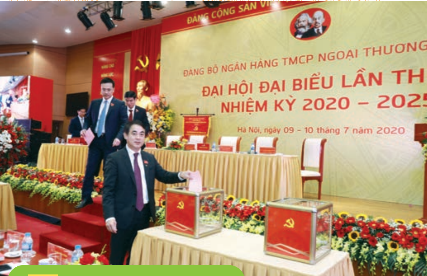
Các đại biểu tiến hành bỏ phiếu bầu BCH Đảng bộ Vietcombank nhiệm kỳ 2020-2025

"Đảng bộ Vietcombank đã thực hiện tốt vai trò là hạt nhân chính trị, lãnh đạo, triển khai toàn diện các mặt công tác, đạt được những kết quả quan trọng trong công tác xây dựng Đảng và thực hiện nhiệm vụ chính trị, góp phần tích cực vào thành công chung của Đảng bộ Khối DNTW và sự nghiệp phát triển kinh tế-xã hội của đất nước".