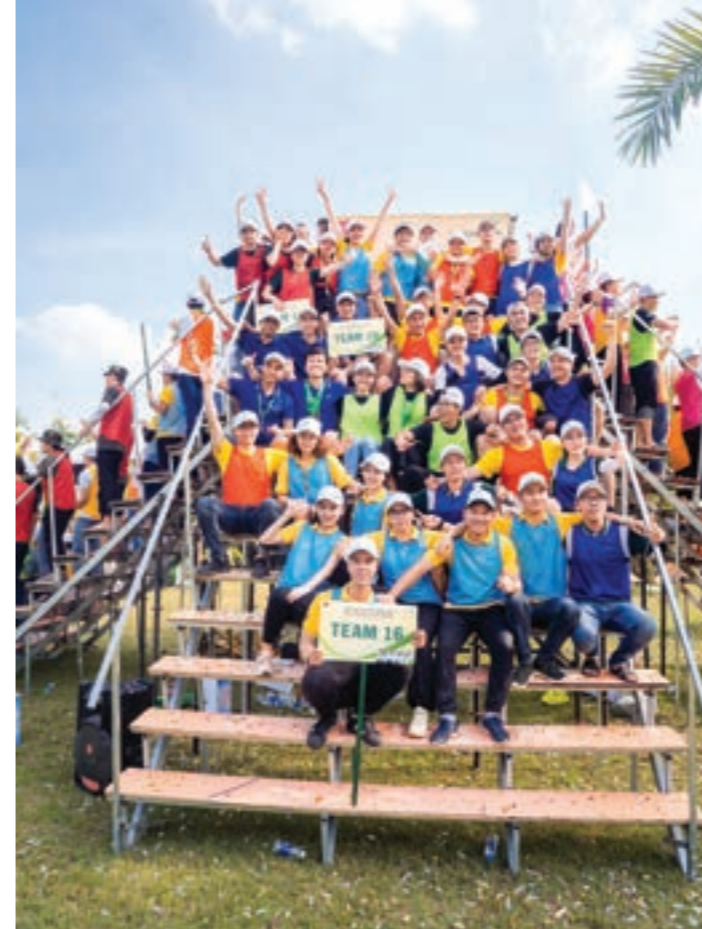
Vietcombank Thăng Long hết mình với các phần thi team building