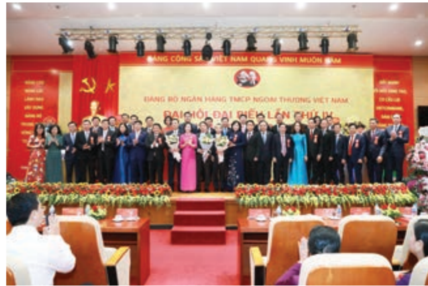
Các đại biểu chụp ảnh chúc mừng các đ/c trúng cử vào BCH Đảng bộ Vietcombank khóa IV, nhiệm kỳ 2020-2025