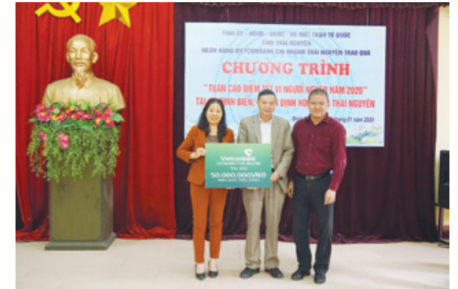
Đại diện UBND huyện Định Hóa nhận phần quà tài trợ của Vietcombank Thái Nguyên.