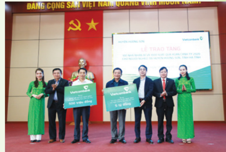
Chủ tịch HĐQT Vietcombank Nguyễn Xuân Thành (thứ 3 từ phải sang) trao biểu 5 tỷ đồng tài trợ 100 nhà nhân ái cho người nghèo huyện Hương Sơn, tỉnh Hà Tĩnh