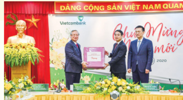
Đ/c Trần Quốc Vương - Ủy viên Bộ Chính trị, Thường trực Ban Bí thư Trung ương Đảng (ngoài cùng bên trái) tặng quà cho tập thể Ban Lãnh đạo và CBNV Vietcombank

Bên cạnh đó, Vietcombank đã thể hiện tốt vai trò, trách nhiệm của của mình đối với cộng đồng, trong 5 năm qua đã dành hơn 1.000 tỷ đồng cho các hoạt động ASXH, nhất là vùng sâu, vùng xa và những địa phương còn nhiều khó khăn, góp phần thực hiện chủ trương của Đảng, Nhà nước là “Cả nước chung tay vì người nghèo, không để ai bị bỏ lại phía sau”.