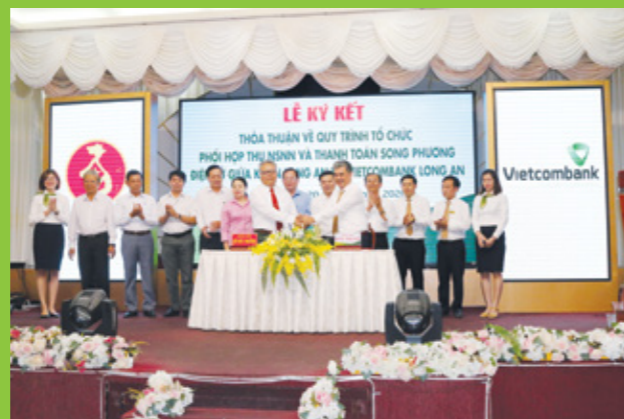
Đại diện KBNN và Vietcombank ký thỏa thuận hợp tác.

Cũng nhân dịp này, Vietcombank Long An tổ chức Hội nghị tri ân khách hàng với sự tham dự của hơn 150 khách hàng thân thiết. Hội nghị nhằm tri ân sự gắn bó và đóng góp của khách hàng đối với thành công của Vietcombank trong các năm qua, thắt chặt mối quan hệ trong thời gian tới, cùng đồng hành và phát triển.