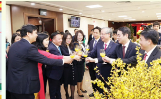
Đ/c Trần Quốc Vương - Ủy viên Bộ Chính trị, Thường trực Ban Bí thư Trung ương Đảng chúc mừng năm mới Ban Lãnh đạo và tập thể CBNV Vietcombank và cùng các đại biểu sử dụng nước hoa quả để cúng ly trong thời gian làm việc đầu năm mới Xuân Canh Tý 2020

Đ/c Trần Quốc Vương cũng đã đánh giá cao công tác xây dựng Đảng tại Đảng bộ Vietcombank, thể hiện rõ vai trò lãnh đạo của Đảng trong doanh nghiệp. Đặc biệt trong 3 năm liên tục trở lại đây, Đảng bộ Vietcombank được Đảng bộ Khối DNTW công nhận là Đảng bộ trong sạch, vững mạnh tiêu biểu.