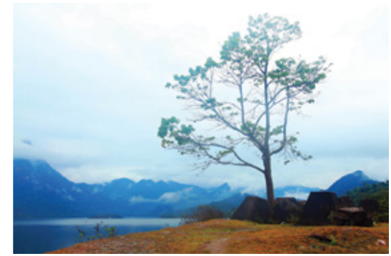
Lòng hồ thủy điện Na Hang

vào trời xanh. Vì không đủ 100 đỉnh núi như thần báo mộng, đất Thượng Lâm cũng không trở thành được đất đế đô. Nhưng kể từ khi ấy, con gái vùng này mang vẻ đẹp của loài chim phượng, da trắng, tóc dài, mang trong mình vẻ đẹp lạ lùng, đắm thắm.