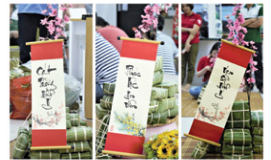
Bánh chưng xanh cùng câu đối đỏ