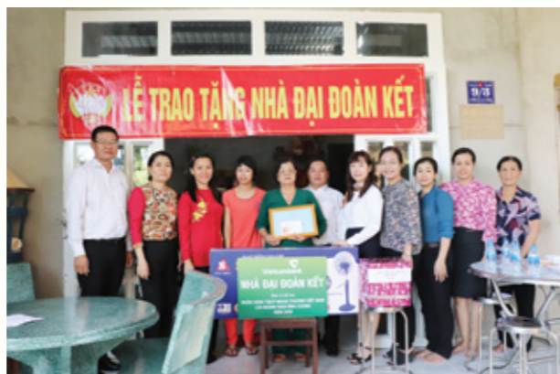
Đại diện BCH Công đoàn Vietcombank Nma Bình Dương trao tặng nhà đại đoàn kết tại phường Vĩnh Phú- Thị xã Thuận An- Bình Dương