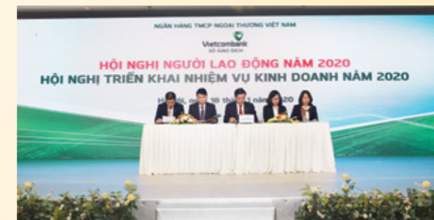
Đoàn Chủ tịch chủ trì Hội nghị

Tham dự Hội nghị có đại diện Ban Lãnh đạo Vietcombank, Ban Giám đốc Chi nhánh, đại diện tổ chức Công đoàn, lãnh đạo các phòng cùng hơn 540 đại biểu đại diện cho các tổ công đoàn tại Sở giao dịch.