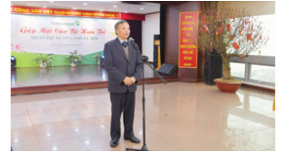
Ông Nguyễn Hòa Bình - nguyên Chủ tịch HĐQT Vietcombank chia sẻ tại buổi gặp mặt

Ông Nguyễn Xuân Thành khẳng định: "Đạt được những kết quả to lớn như vậy, điều đầu tiên có thể khẳng định đó là nhờ nền tảng rất vững chắc và truyền thống của hệ thống Vietcombank sau gần 60 năm xây dựng và trưởng thành. Đặc biệt, bên cạnh đó, hệ thống luôn nhận được tình cảm của các bác nguyên là lãnh đạo và cán bộ Vietcombank, những người luôn dành tình cảm theo dõi, chia sẻ, động viên