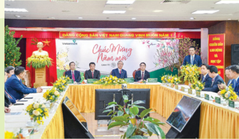
Các đ/c Lãnh đạo cấp cao của Đảng, Nhà nước, NHNN Việt Nam và Đảng ủy Khối DNTW tham dự, chúc Tết tại Vietcombank