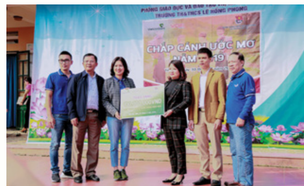
Đại diện lãnh đạo hai đơn vị trao quà cho nhà trường