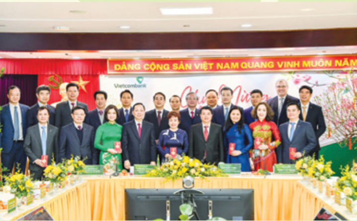
Đ/c Trần Quốc Vương - Ủy viên Bộ Chính trị, Thường trực Ban Bí thư Trung ương Đảng trao lì xì theo phong tục truyền thống và chụp hình lưu niệm cùng các đ/c lãnh đạo Đảng ủy Khối DNTW, NHNN Việt Nam và Ban Lãnh đạo Vietcombank