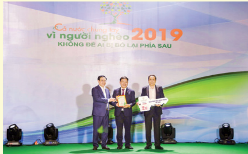
Đ/c Vương Đình Huệ - Ủy viên Bộ Chính trị, Phó Thủ tướng Chính phủ (ngoài cùng bên phải) trao chứng nhận cảm ơn Vietcombank với những đóng góp cho chương trình "Cả nước chung tay vì người nghèo 2019, không để ai bị bỏ lại phía sau".