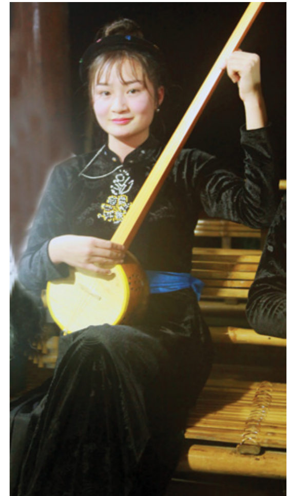
Thiếu nữ Thượng Lâm

Do ánh lửa hay hơi nồng men rượu khiến đôi má người em gái hây hây, mắt lúng liếng cứ hát mãi những lời ca mê đắm. Sương khuya đã thấm ướt mái gianh nhà sàn, nhỏ giọt như nước mắt người thiếu nữ. Giọt nước mắt thấm đắm