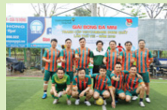
Đội bóng Vietcombank Dung Quất chụp hình cùng Ban Giám đốc

Sau 3 ngày thi đấu, đội bóng Mitsubishi Quảng Ngãi và Huyndai Quảng Ngãi đã giành quyền chơi trận chung