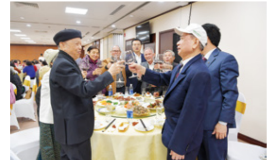
Ban Lãnh đạo Vietcombank gặp mặt và chúc sức khỏe các cán bộ hưu trí nhân dịp Xuân Canh Tý 2020

để lớp lớp cán bộ về sau kế tục truyền thống tốt đẹp của hệ thống Vietcombank".