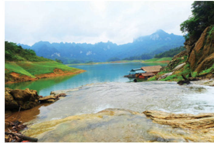
Suối Khuổi Nhi