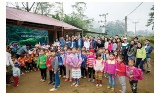
Đoàn chụp ảnh lưu niệm cùng các bé tại điểm trường Phiêng Đén

♥ Bài Đàm Nguyễn Anh