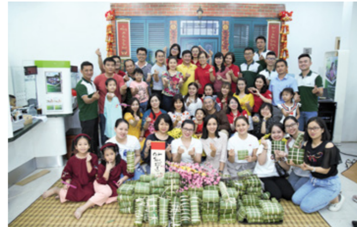
Thành quả sau 48 tiếng của tập thể Vietcombank Thủ Thiêm