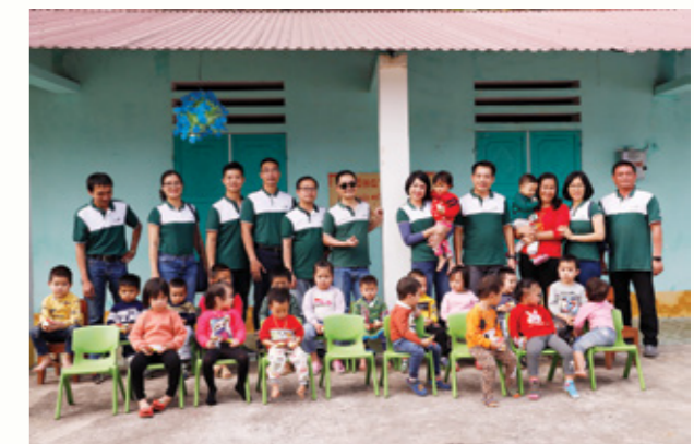
Đoàn Vietcombank Leasing chụp ảnh cùng các em học