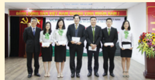
Khen thưởng các cán bộ khách hàng có thành tích xuất sắc trong công tác giải ngân