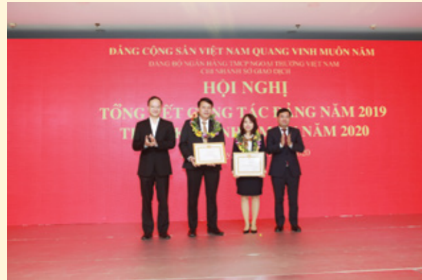
Lễ trao Quyết định khen thưởng của Đảng ủy Vietcombank

Tại Hội nghị, các đại biểu đã nghe Báo cáo kết quả công tác Đảng năm 2019 và nhiệm vụ trọng tâm năm 2020. Với những thành tích đạt được, Đảng bộ Sở giao dịch đã vinh dự được Đảng ủy Vietcombank tặng Giấy khen cho Đảng bộ đạt danh hiệu “Trong sạch vững mạnh tiêu biểu” năm 2019.