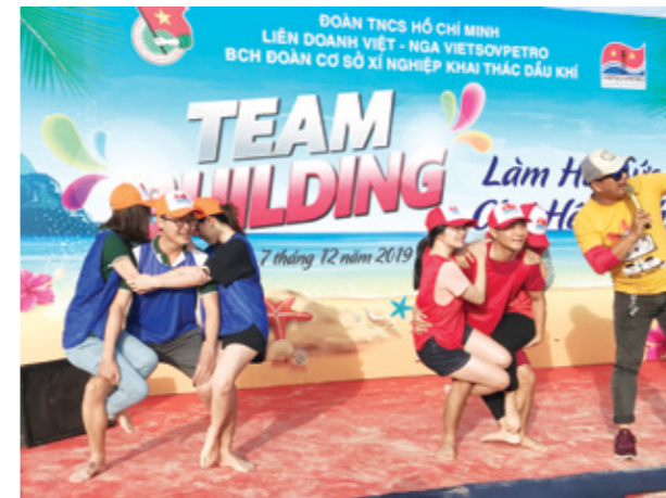
Đoàn viên Chi Đoàn cơ sở Vietcombank Vũng Tàu tích cực tham gia chương trình Hội trại

Nhận lời mời tham gia chương trình Hội trại lần thứ X năm 2019 của Đoàn cơ sở Xí Nghiệp Khai thác Dầu Khí, ngày 7 - 08/12/2019, tại khu du lịch Biển đá vàng Lagi, Chi Đoàn cơ sở Vietcombank Vũng Tàu đã nhiệt tình tham gia với sự góp mặt của 15 Đoàn viên.