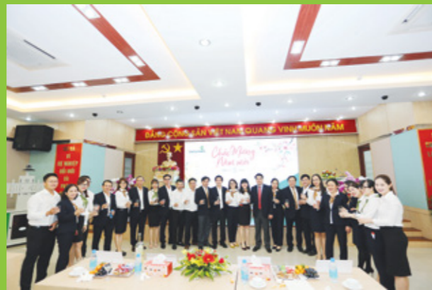
Ban Giám đốc Chi nhánh chụp hình lưu niệm với CBNV