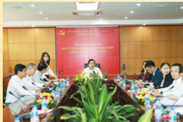
Toàn cảnh Hội nghị kiểm điểm