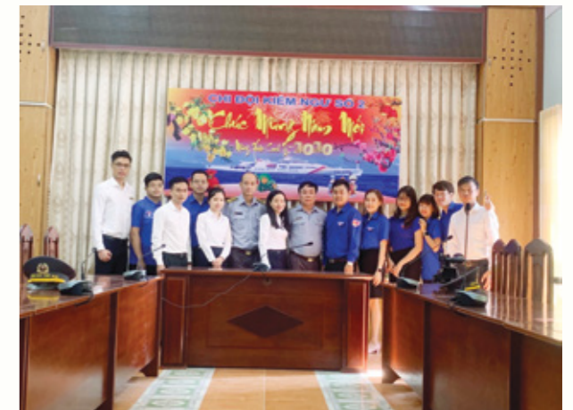
Đại diện hai Chi Đoàn chụp ảnh lưu niệm