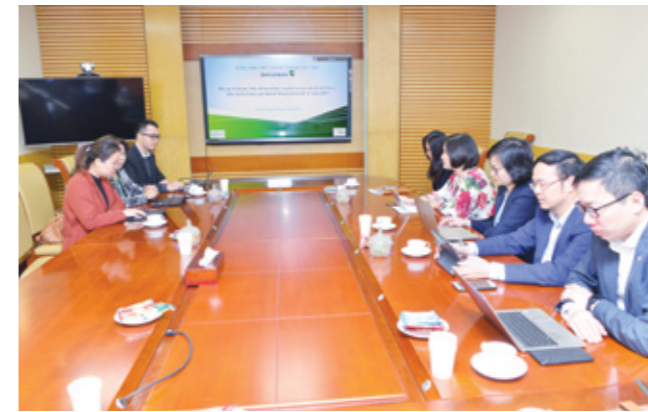
Quảng cảnh Lễ khởi động Dự án EES và ICS