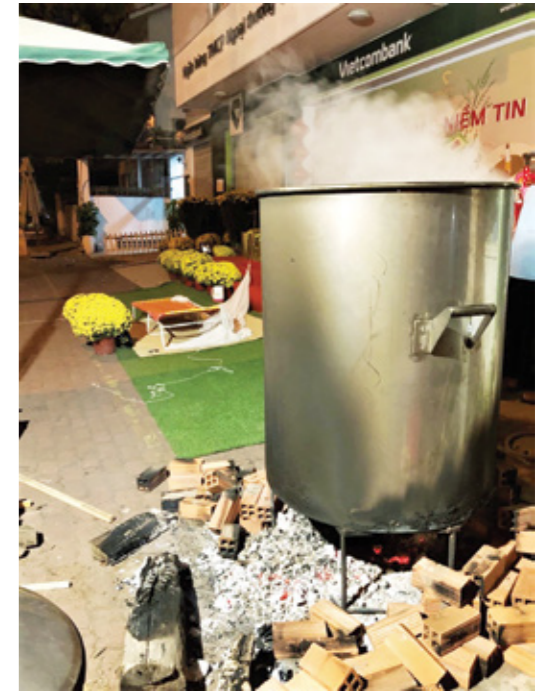
Tắt lửa nôi bánh chưng chuẩn bị lấy bánh chưng

văn minh lúa nước với lịch sử hàng ngàn năm trải dài trên đất Việt.