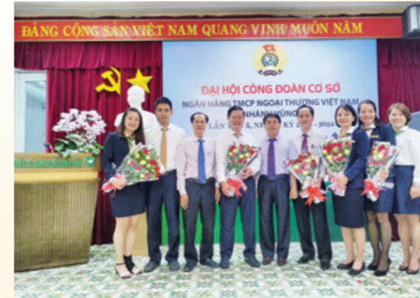
Các đại biểu chụp ảnh lưu niệm tại Đại hội

Ngày 14/12/2019, tại trụ sở chi nhánh, Vietcombank Vũng Tàu đã tổ chức thành công Đại hội Công đoàn cơ sở lần thứ V, nhiệm kỳ 2019 - 2024.