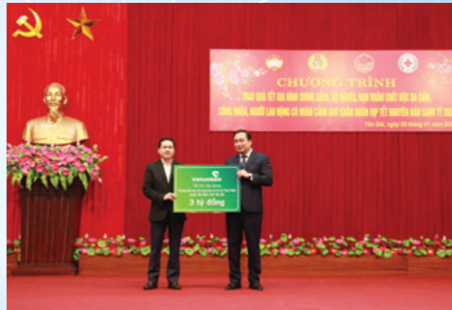
Đại diện Vietcombank trao biểu trưng tài trợ xây dựng công trình trường học