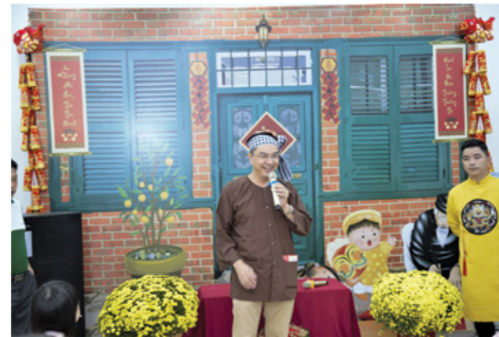
Bánh chưng xanh là một phần không thể thiếu trên mâm cỗ đón Tết của người Việt