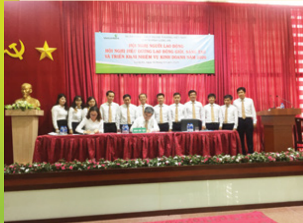
Giám đốc - Chủ tịch công đoàn ký giao ước thi đua

Tại Hội nghị, đại biểu đã nghe báo cáo tóm tắt về hoạt động kinh doanh của Chi nhánh từ năm 2010 - 2019 với các thành quả về huy động vốn, tín dụng, lợi nhuận, lương bình quân cán bộ. Từ đó, toàn thể Chi nhánh Long An cùng nhìn nhận lại chặng đường đã qua và đúc kết kinh nghiệm để tập trung thực hiện kế hoạch kinh doanh năm 2020.