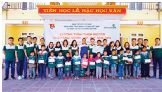
Đoàn thanh niên Vietcombank Sóc Sơn trao quà cho các em học sinh có hoàn cảnh khó khăn

Đoàn Thanh niên Vietcombank Sóc Sơn tổ chức chương trình thiện nguyện “Thắp sáng những ước mơ” tại Trường Tiểu học và THCS Mai Hịch (xã Mai Hịch, huyện Mai Châu, tỉnh Hòa Bình).