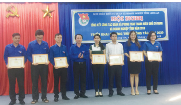
Bí thư ĐTN Vietcombank Long An vinh dự nhận giấy khen từ Đoàn khối