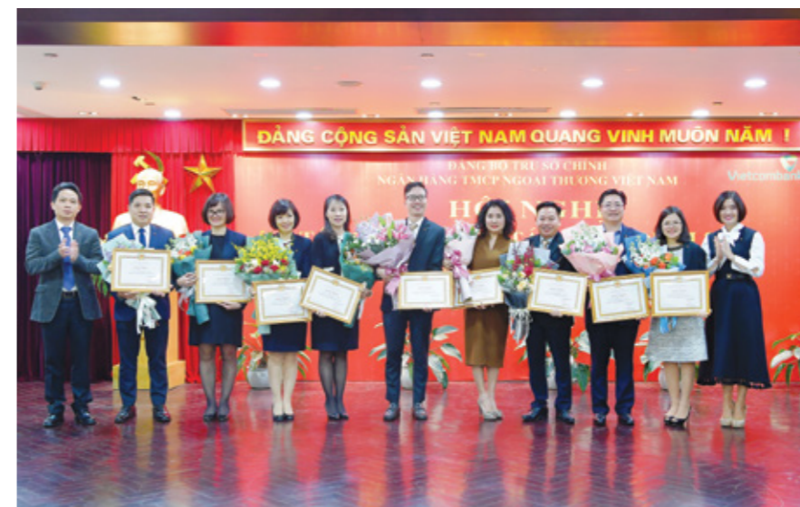
Đại diện các Chi bộ trực thuộc Đảng bộ TSC Vietcombank nhận Giấy khen của Đảng ủy Vietcombank