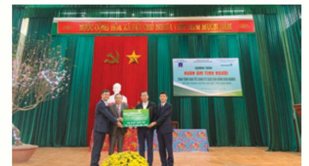
Đại diện Vietcombank Sở giao dịch và PVEP trao tặng biểu trưng “Xuân ấm tình người” cho đại diện UBND xã Tân Thành, huyện Kim Sơn, tỉnh Ninh Bình