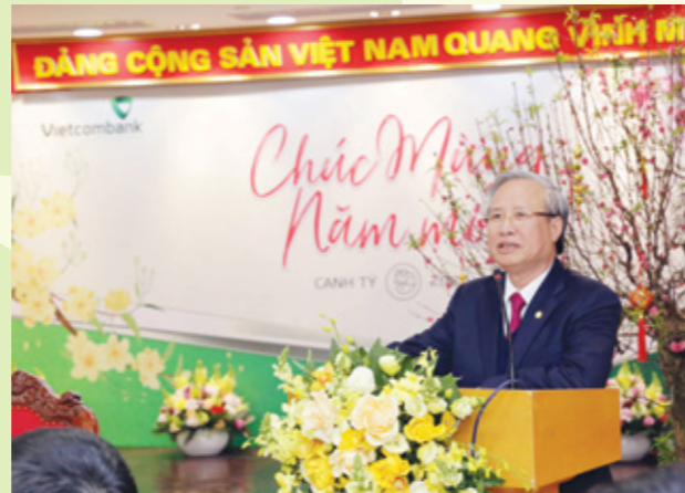
Đ/c Trần Quốc Vương - Ủy viên Bộ Chính trị, Thường trực Ban Bí thư Trung ương Đảng phát biểu chúc Tết Vietcombank