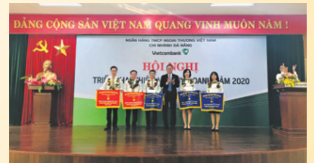
Các đơn vị hoàn thành xuất sắc nhiệm vụ kinh doanh năm 2019 nhận cờ thi đua