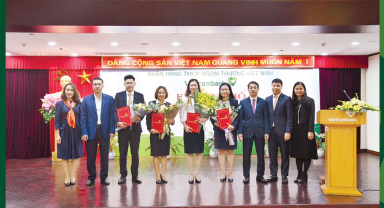
Ban Lãnh đạo Vietcombank chụp ảnh lưu niệm cùng các cán bộ được điều động và bổ nhiệm

Thứ 3, cần tạo ra một không khí sôi nổi của tuổi trẻ Vietcombank chào mừng Đại hội Đảng các cấp và Đại hội Đại biểu Đảng bộ Vietcombank nhiệm kỳ 2020 - 2025. Đoàn Thanh niên nhất quyết phải để lại dấu ấn của tuổi trẻ trong ngày hội lớn này bằng các hoạt động thiết thực”.