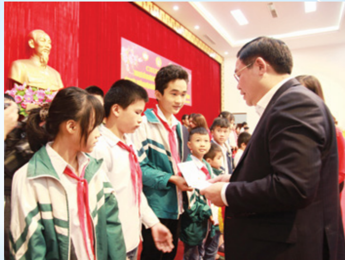
Phó Thủ tướng Vương Đình Huệ trao quà Tết cho các học sinh nghèo có hoàn cảnh khó khăn