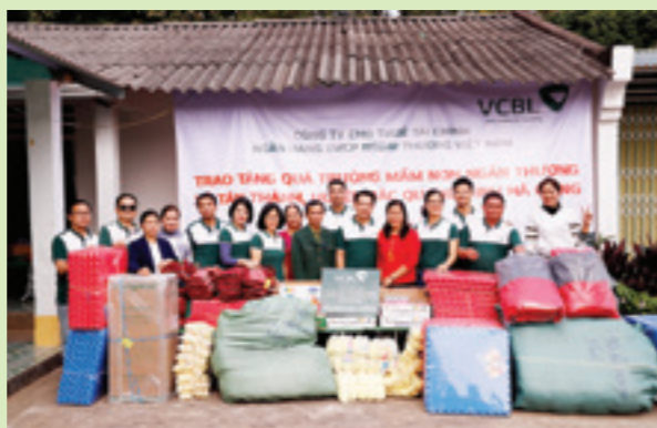
Đoàn Vietcombank Leasing chụp ảnh lưu niệm cùng Ban Giám hiệu trường và lãnh đạo địa phương