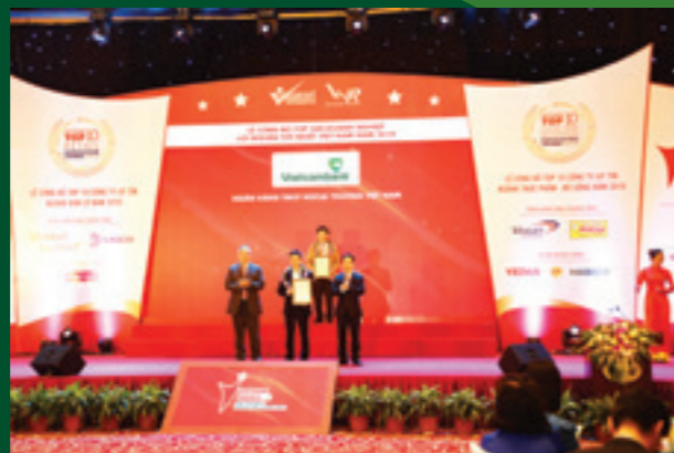
Đại diện Vietcombank nhận giải thưởng từ Ban tổ chức

Với việc nhận giải thưởng này, Vietcombank tiếp tục khẳng định vị thế dẫn đầu ngành Ngân hàng tại thị trường Việt Nam, hướng đến mục tiêu trở thành ngân hàng số 1 Việt Nam, một trong 100 ngân hàng hàng đầu khu vực, một trong 300 tập đoàn ngân hàng tài chính lớn nhất thế giới và được quản trị theo các thông lệ quốc tế tốt nhất vào năm 2020.