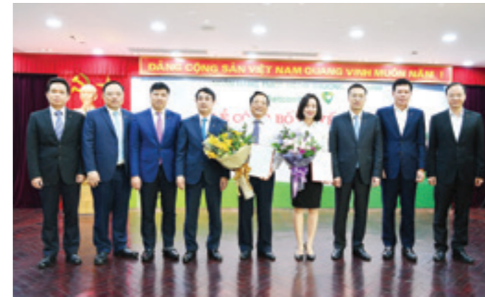
Lễ công bố quyết định thành lập Trường ĐT&PTNNL Vietcombank (tháng 3/2019)

Các chương trình đào tạo, hội thảo, khảo sát tại nước ngoài được tăng cường tập trung cho