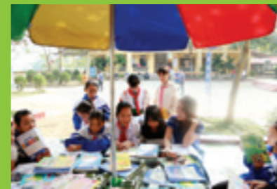
Các em học sinh hân hoan đọc sách ở thư viện ngoài trời do Vietcombank Hà Nội tài trợ