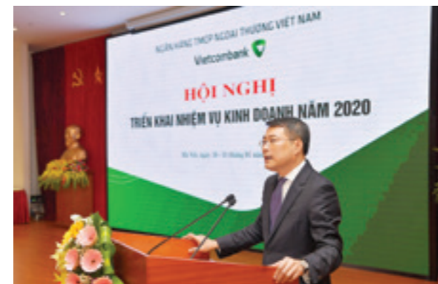
Đ/c Lê Minh Hưng - Ủy viên BCH Trung ương Đảng, Bí thư Ban cán sự Đảng, Thống đốc NHNN Việt Nam phát biểu chỉ đạo Hội nghị