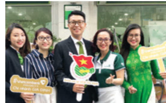
Đoàn cơ sở Vietcombank Gia Định tổ chức Roadshow quảng bá về thương hiệu Vietcombank Priority

Năm 2019, Đoàn Thanh niên Vietcombank đã xuất sắc hoàn thành vượt chỉ tiêu công trình thanh niên các cấp, trong đó rất nhiều công trình thuộc lĩnh vực kinh tế, góp phần tăng lợi nhuận trong toàn hệ thống Vietcombank. Tính đến hết tháng 12/2019, toàn Đoàn Vietcombank có 27 CTTN cấp Đoàn Khối DNTW (vượt kế hoạch 145%); 51 CTTN cấp Đoàn Vietcombank (vượt kế hoạch 82%); 183 CTTN cấp cơ sở (vượt kế hoạch 66%). Trong đó, nhiều CTTN tiêu biểu gắn với hoạt động kinh doanh tại chi nhánh thể hiện tính chủ động của ĐVTN trong việc bám sát định hướng 3 trụ cột "Bán lẻ, Dịch vụ và Đầu tư".