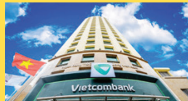
Trụ sở chính Vietcombank tại Thủ đô Hà Nội, Việt Nam

Tháng 2/2019, Tạp chí The Asian Banker công bố danh sách 500 ngân hàng mạnh nhất khu vực châu Á - Thái Bình Dương. Danh sách được lựa chọn dựa trên quy mô tài sản và một số tiêu chí khác để xếp hạng 500 ngân hàng hàng đầu (AB500Rank) và 500 ngân hàng mạnh nhất dựa trên niềm tin về khả năng sinh lời lâu dài từ kinh doanh cốt lõi của các ngân hàng (Strength Rank) hay các ngân hàng mạnh nhất khu vực.