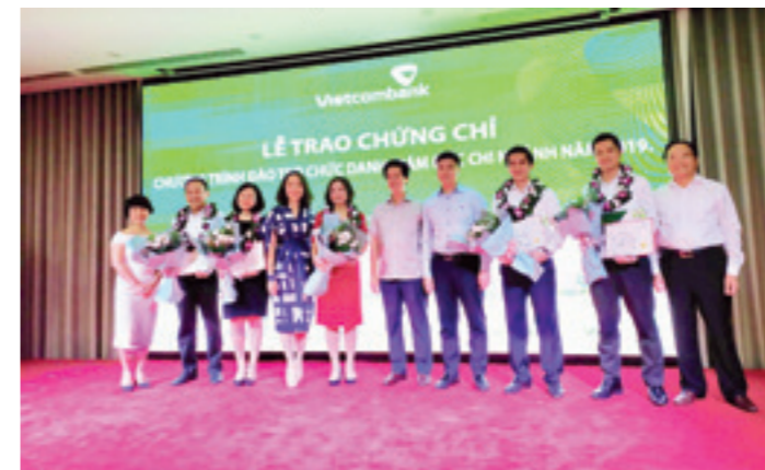
Ban Lãnh đạo chụp ảnh cùng các học viên tiêu biểu trong Lễ trao chứng chỉ chương trình đào tạo chức danh Giám đốc chi nhánh năm 2019

đối tượng cán bộ Lãnh đạo cấp cao và cán bộ tiềm năng/ đạt thành tích cao trong các kỳ thi nghiệp vụ, các chương trình đào tạo trọng điểm, đem lại nhiều giá trị thực tiễn, được đánh giá cao.