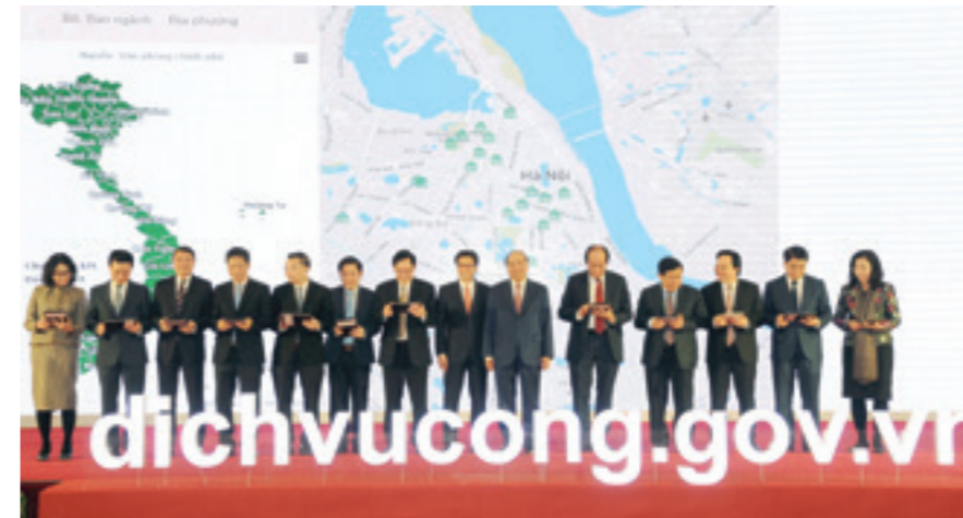
Thủ tướng Chính phủ Nguyễn Xuân Phúc cùng lãnh đạo Chính phủ, các Bộ, ngành, NHNN Việt Nam thực hiện nghi thức ký cam kết điện tử tại Lễ khai trương Cổng dịch vụ công quốc gia

Tháng 11/2019, tại Phú Quốc, trong khuôn khổ Hội nghị khách hàng thường niên năm 2019 của Tổ chức thẻ quốc tế Visa, Vietcombank được vinh danh tại 6 hạng mục giải thưởng quan trọng, bao gồm: Ngân hàng dẫn đầu về doanh số chi tiêu thẻ (Leadership in Payment Volume 2019); Ngân hàng dẫn đầu về doanh số chi tiêu thẻ ghi nợ (Leadership in Debit Payment Volume 2019); Ngân hàng dẫn đầu về doanh số thanh toán thẻ (Leadership in Merchants Sales Volume 2019); Ngân hàng dẫn đầu về doanh số chi tiêu thẻ ở nước ngoài (Leadership in Cross-Border Payment Volume 2019); Ngân hàng dẫn đầu về tỷ lệ kích hoạt thiết bị thanh toán thẻ không tiếp xúc (Leadership in Contactless active terminals penetration 2019); Ngân hàng đầu tiên ra mắt thiết kế thẻ theo công nghệ Visa QuickRead (First Bank to launch Visa QuickRead 2019).