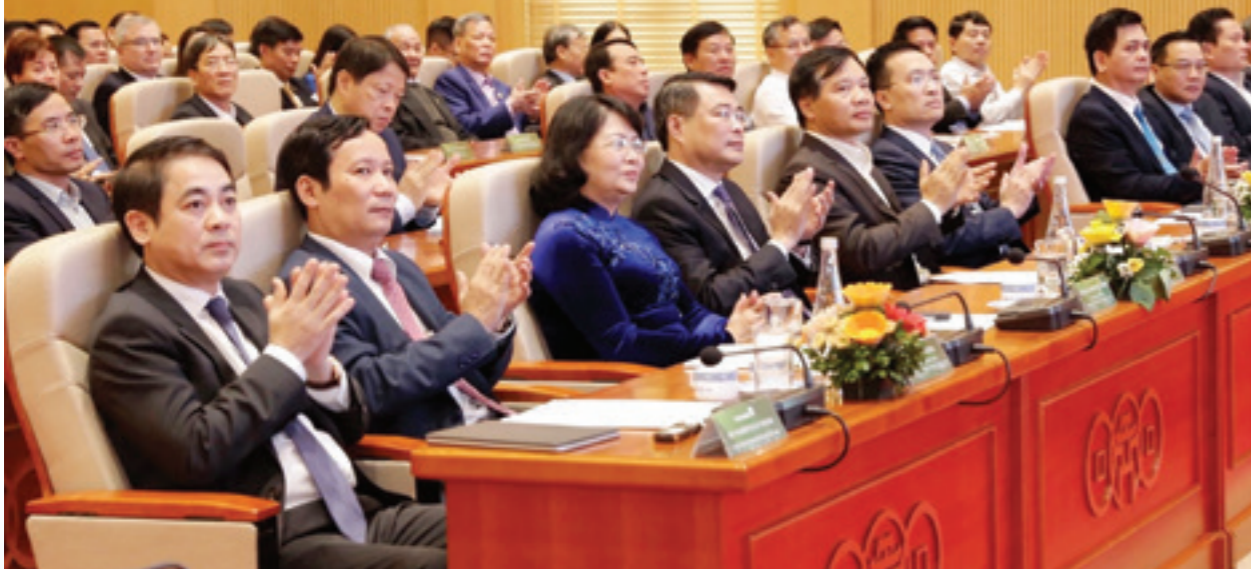
Các đại biểu tham dự Hội nghị triển khai nhiệm vụ kinh doanh năm 2020 của Vietcombank