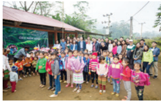
Đoàn chụp ảnh lưu niệm cùng các bé tại điểm trường Phiêng Đén