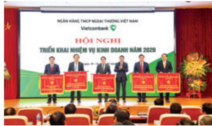
Thừa ủy quyền của Thủ tướng Chính phủ, đ/c Lê Minh Hùng - Thống đốc NHNN Việt Nam (đứng thứ 3, từ phải sang) trao Cờ thi đua của Chính phủ cho các tập thể Vietcombank

triệt đội ngũ người lao động trong thực hiện đúng quy định của pháp luật, nhằm phòng tránh những rủi ro, vi phạm trong lĩnh vực ngân hàng; tiếp tục là ngân hàng đi đầu trong triển khai tốt các giải pháp phát triển ngân hàng số, đảm bảo an ninh an toàn thanh toán; phối hợp với các đơn vị chức năng, chi nhánh NHNN và chi nhánh Vietcombank tại địa phương truyền thông đến công chúng các thông tin cập nhật kịp thời để củng cố lòng tin của người dân, công chúng vào hoạt động ngân hàng.