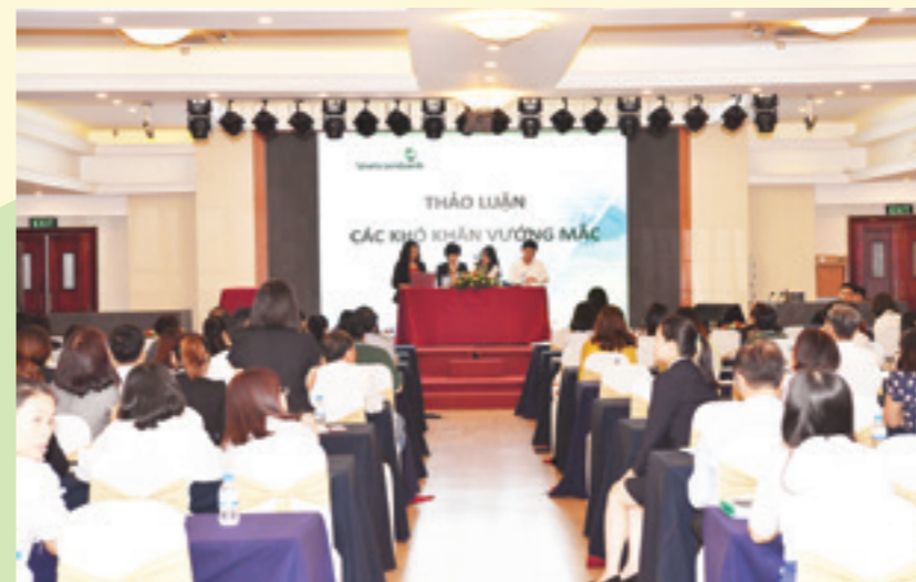
Tham luận và chia sẻ của đại diện chi nhánh tại Hội thảo và phân giải đáp thắc mắc từ các giảng viên của hội thảo

Các học viên dự Hội thảo cũng đã thảo luận sôi nổi, chia sẻ một số tình huống về những giao dịch tại CN có dấu hiệu rửa tiền cùng kinh nghiệm trong việc xử lý. Cuối chương trình, các học viên thực hiện bài kiểm tra với nội dung tổng hợp về những kiến thức đã được truyền đạt tại Hội thảo.