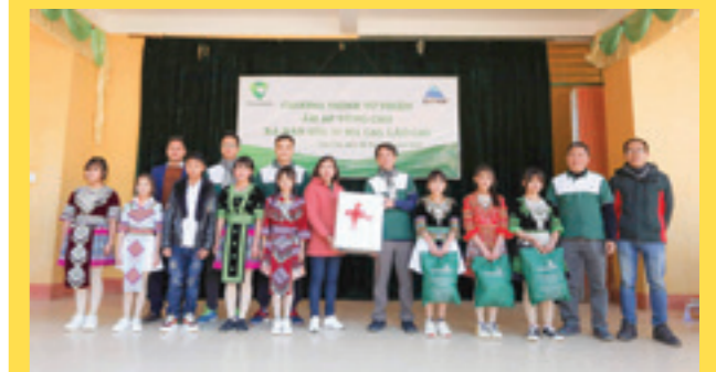
Đoàn thiện nguyện tặng quà cho học sinh tại Trường Phổ thông dân tộc nội trú và Tiểu học và THCS xã Nàn Sín