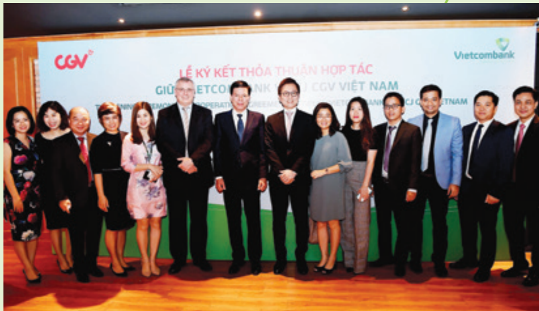
Lễ ký kết Thỏa thuận hợp tác kinh doanh giữa Vietcombank và CJ CGV