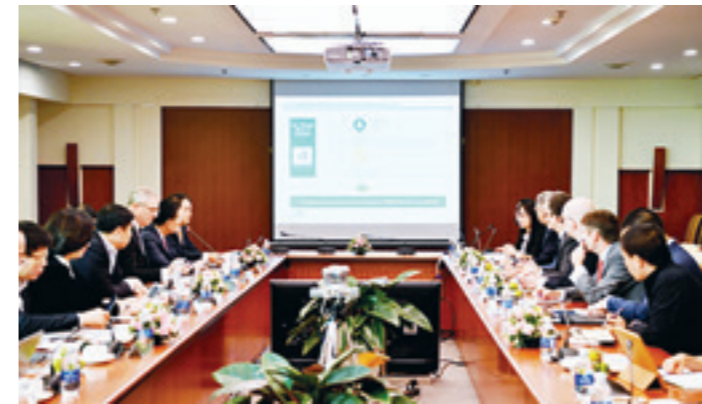
Lễ khởi động dự án "Chuyển đổi mô hình ngân hàng bán lẻ - RTOM" - Tháng 02/2019

niêm yết lớn nhất toàn cầu có đóng góp lớn vào sự phát triển của Việt Nam, hoạt động bán lẻ tiếp tục là một trong các trụ cột kinh doanh của Vietcombank. Trong những năm vừa qua, Vietcombank nói chung, hoạt động bán lẻ tại Vietcombank nói riêng đã tiếp tục phát triển và