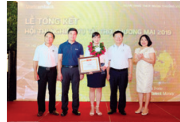
Ban Lãnh đạo chụp ảnh cùng thí sinh đoạt Giải Nhất tham gia cuộc thi tay nghề nghiệp vụ tài trợ thương mại năm 2019

Công tác khảo thí đạt chất lượng cao với hơn 20.000 lượt cán bộ được tham gia khảo thí, vượt 25% kế hoạch năm 2019. Công tác khảo thí đã