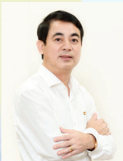
TS. Nghiêm Xuân Thành - Chủ tịch Hội đồng quản trị Vietcombank