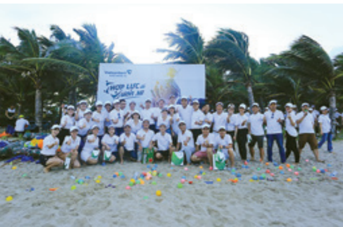
Chương trình Team building của Hội nghị tập huấn nghiệp vụ nhân sự Vietcombank năm 2019