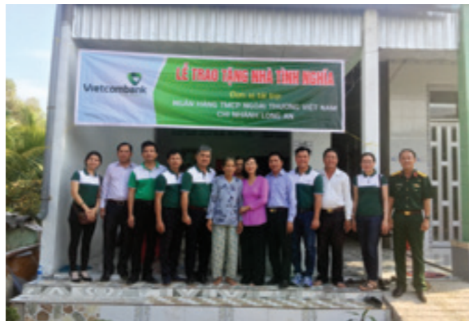
Đại diện Ban Giám đốc và Chính quyền địa phương trao tặng nhà tình nghĩa