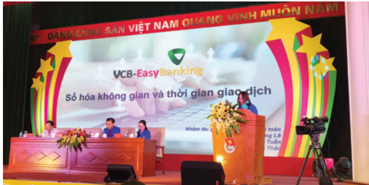
Đại diện nhóm tác giả đề tài "VCB-EasyBanking số hóa không gian và thời gian giao dịch" của Trung tâm thanh toán Trụ sở chính Vietcombank phát biểu tham luận tại Diễn đàn "Tuổi trẻ đổi mới, sáng tạo phát triển doanh nghiệp"