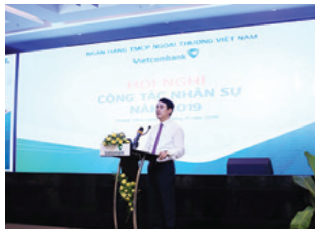
Chủ tịch HĐQT Vietcombank Nghiêm Xuân Thành phát biểu chỉ đạo Hội nghị