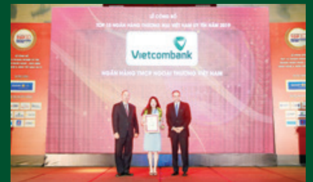
Đại diện Vietcombank (giữa) nhận giải thưởng đơn vị dẫn đầu Top 10 ngân hàng thương mại Việt Nam uy tín năm 2019

Tháng 7/2019, Tạp chí Forbes Việt Nam đã công bố danh sách 50 thương hiệu dẫn đầu. Theo danh sách, Vietcombank là ngân hàng duy nhất nằm trong top 10 thương hiệu dẫn đầu, giá trị thương hiệu đạt 246,5 triệu USD (tăng 68,6 triệu USD so với năm 2018), tiếp tục dẫn đầu các ngân hàng trên thị trường với khoảng cách 98,5 triệu USD so với ngân hàng đứng thứ 2 và 105,4 triệu USD so với ngân hàng thứ 3. Đây là năm thứ 3 liên tiếp Vietcombank giữ vị trí là thương hiệu ngân hàng có giá trị nhất trong danh sách bình chọn của Forbes Việt Nam.