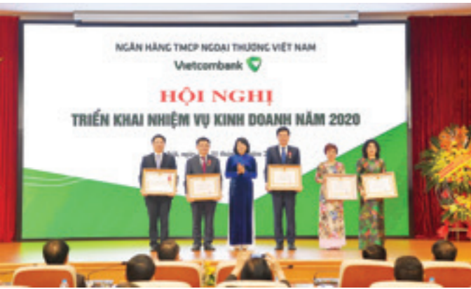
Đ/c Đặng Thị Ngọc Thịnh - Ủy viên BCH Trung ương Đảng, Phó Chủ tịch nước (thứ 3 từ trái sang) trao Huân chương Lao động hạng Nhất - Nhì - Ba cho các tập thể và cá nhân của Vietcombank