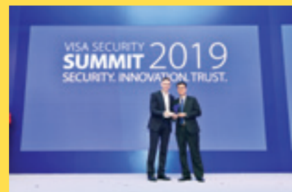
Đại diện Trung tâm thẻ Vietcombank nhận giải thưởng do Tổ chức thẻ quốc tế Visa trao tặng

Giải thưởng này là sự ghi nhận của Visa cho những nỗ lực trong việc quản lý và phòng chống rủi ro, gian lận giao dịch thẻ rất hiệu quả của Vietcombank nhiều năm qua nhằm nỗ lực mang đến cho khách hàng phương thức thanh toán văn minh, hiện đại và an toàn bảo mật cũng như những cam kết dài hạn của Vietcombank trong việc tạo lập hệ sinh thái thanh toán không dùng tiền mặt thân thiện, an toàn cho cộng đồng.