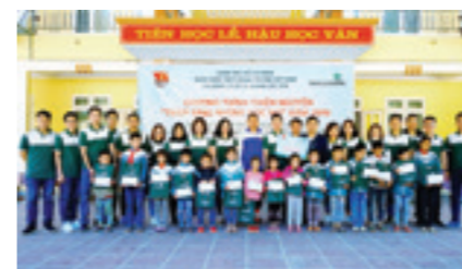
Đoàn thanh niên Vietcombank Sóc Sơn trao quà cho các em học sinh có hoàn cảnh khó khăn