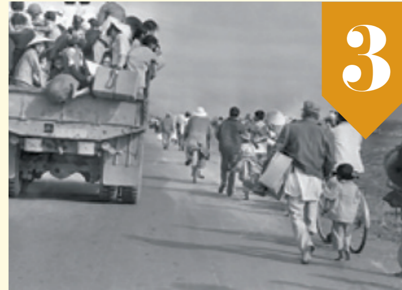
Lệnh sơ tán các khối cơ quan hành chính sự nghiệp ra khỏi thành phố Hà Nội được tiến hành gấp rút

những đội pháo cao xạ gác trực chiến trên nóc cầu suốt ngày đêm để có thể bắn trực diện vào máy bay địch nếu chúng liều mạng đâm xuống hòng thả bom cầu. Có những lần, để tránh đạn cao xạ của ta, chúng bay thấp sát mặt sông, nhưng khi vào gần, đạn của ta bắn xối xả từ nóc các nhịp cầu, rồi súng các loại của bộ đội Phòng không và dân quân tự vệ Thủ đô được bố trí ở những chỗ khuất hai bên đê Sông Hồng và trong nội thành Hà Nội đồng loạt bắn lên, rực đỏ cả một vùng trời, chúng hoảng sợ, lại bay góc đầu lên chạy thoát thân ra phía biển, rồi mất hút.