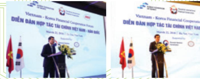
Thống đốc NHNN Việt Nam Lê Minh Hưng (ảnh trái) và Chủ tịch Ủy ban Dịch vụ Tài chính Hàn Quốc (ảnh phải) phát biểu

Ngay tại Diễn đàn cũng đã diễn ra Lễ ký kết Biên bản ghi nhớ hợp tác trong đổi mới tài chính giữa NHNN Việt Nam và Ủy ban dịch vụ tài chính Hàn Quốc.