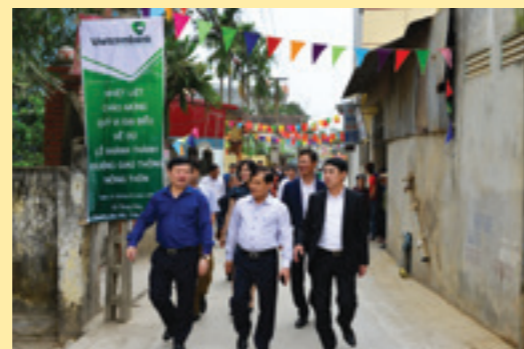
Các đại biểu đi tham quan con đường mới khánh thành

Trong 5 năm qua, Vietcombank đã dành hơn 1.000 tỷ đồng cho công tác ASXH trên toàn quốc. Vietcombank cũng hỗ trợ 15,5 tỷ đồng cho công tác ASXH và phong trào xây dựng nông thôn mới trên địa bàn tỉnh Hưng Yên. Các công trình đến nay đã hoàn thành khang trang, đảm bảo chất lượng, thể hiện tình cảm sâu đậm, sự quan tâm, hỗ trợ của Ban Lãnh đạo và toàn thể CBNV Vietcombank.