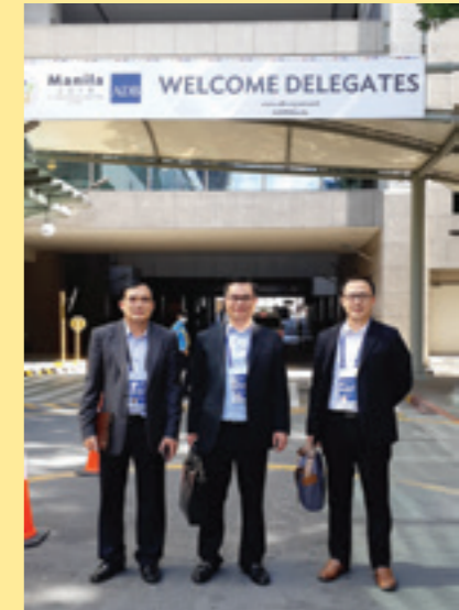
Đoàn đại biểu Vietcombank tham dự Hội nghị thường niên ADB lần thứ 51

Trong buổi lễ trao tặng quà được tổ chức tại thị trấn Trường Sa trên đảo Trường Sa vào chiều ngày 09/5/2018, đại diện Vietcombank đã trao tặng 54 thùng quà là nhu yếu phẩm tới cán bộ, chiến sỹ, nhân dân cùng các đơn vị đóng trên địa bàn thị trấn Trường Sa. Đặc biệt, nhân dịp này, Vietcombank đã trao tặng 03 chiếc xuồng CQ trị giá 10,5 tỷ đồng cho cán bộ, chiến sỹ hải quân.