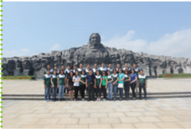
Đoàn Đảng bộ Vietcombank Chi nhánh Vũng Tàu tại Nghĩa trang Hàng Dương.

Hành trình về với Côn Đảo khép lại. Tạm biệt Côn Đảo, tạm biệt những người con ưu tú của dân tộc Việt Nam đã nằm lại mảnh đất này. Hằng ngày, lớp lớp người vẫn tới đây để tri ân, giác ngộ, để tinh thần yêu nước và chủ nghĩa nhân văn bất diệt vẫn cháy mãi trong mỗi người dân đất Việt.