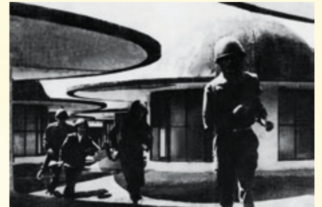
Tự vệ ngân hàng trên nóc Ngân hàng Nhà nước - nơi có các ụ súng phòng không 12 ly 7

Các hòm sắt, hòm gỗ, sổ sách, chứng từ, máy móc, phương tiện làm việc của các phòng, ban được ô tô chở đi trước. Kể cả việc bố trí nhà trẻ, bếp ăn tập thể cũng được các anh chị tiền trạm làm sẵn. Công việc chuyên môn của các bộ phận ở nơi sơ tán vẫn bảo đảm bình thường. Hằng ngày, có Văn thư - hành chính cơ quan lo vận chuyển chứng từ mới phát sinh từ Hà Nội xuống, rồi lại đem các chứng từ đã xử lý, hay cần giao cho khách hàng về Hà Nội. Ở đây chỉ có một điều khổ là buổi sáng rất đói. Vì không có điều kiện ăn sáng như ở Hà Nội, chợ thì ở xa, tem phiếu có hạn nên không thể nấu cơm buổi sáng để ăn. Nhưng cũng may là người dân ở đây rất tốt.