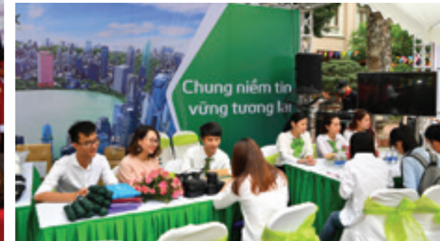
Đông đảo sinh viên HVNH tìm hiểu thông tin tại gian hàng Vietcombank