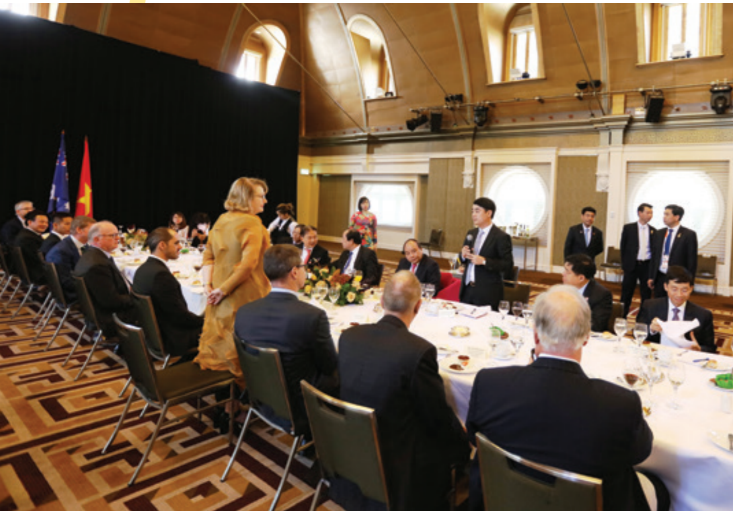
Chủ tịch HĐQT Vietcombank trao đổi với Giám đốc điều hành Khối Tín dụng và Khoản vay Cấu trúc của ANZ kiêm Chủ tịch Hội đồng thành viên ANZ Việt Nam về tăng cường hợp tác giữa hai ngân hàng để hỗ trợ cho hoạt động của các doanh nghiệp Việt Nam và Australia

Phát biểu tại buổi gặp mặt, Thủ tướng Chính phủ đã khẳng định Vietcombank là ngân hàng tốt nhất Việt Nam với hoạt động tăng trưởng bền vững, hiệu quả, có rất nhiều đóng góp cho hệ thống ngân hàng cũng như nền kinh tế Việt Nam. Thủ tướng đánh giá cao vai trò của Vietcombank trong việc góp phần kết nối, tạo