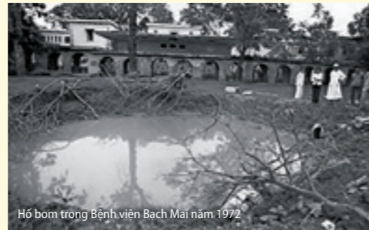
Hồ bom trong Bệnh viện Bạch Mai năm 1972