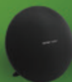
Dàn âm thanh bluetooth

Chương trình áp dụng từ 07/05/2018 – 31/07/2018 cho Khách hàng cá nhân tham gia mới nhóm sản phẩm bảo hiểm tích lũy