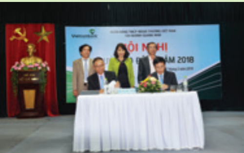
Đại diện người sử dụng lao động và Đại diện NLĐ ký kết giao ước thi đua năm 2018 dưới sự chứng kiến của Bí thư Đảng ủy khối, Lãnh đạo Chi nhánh NHNN, Lãnh đạo Liên đoàn lao động tỉnh Quảng Nam

N gày 17/3/2018, Vietcombank Quảng Nam đã tổ chức thành công Hội nghị NLĐ năm 2018.