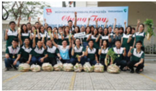
Đoàn cơ sở Vietcombank Thái Nguyên sẵn sàng ra quân giải cứu nông sản cùng bà con nông dân