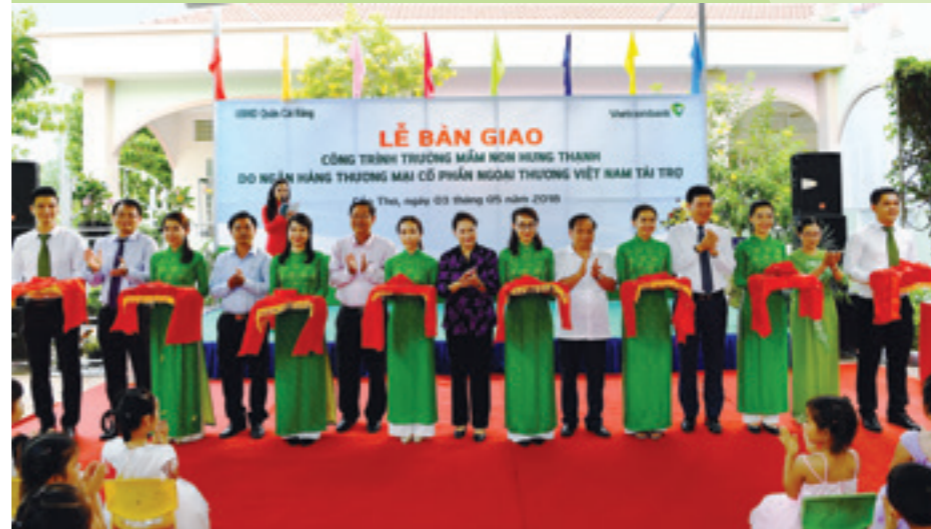
Các đại biểu cắt băng khai trương Trường Mầm non Hưng Thạnh