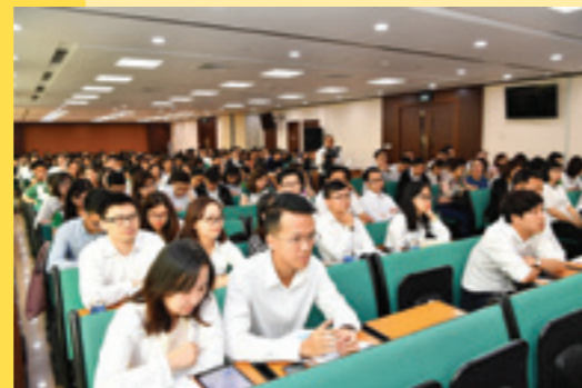
Toàn cảnh lớp học

Lớp học có ý nghĩa rất quan trọng trong việc bồi dưỡng hạt nhân ưu tú, bổ sung vào đội ngũ Đảng viên cho các chi bộ, đảng bộ nhằm tăng thêm sức chiến đấu và bảo đảm sự kế thừa, phát triển của Đảng.