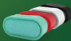
loa Bluetooth di động