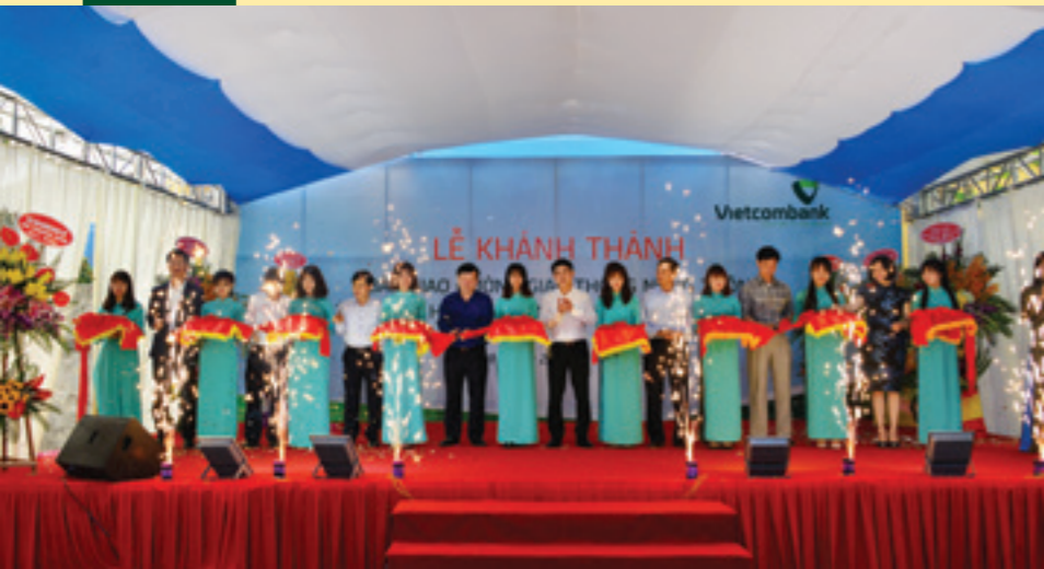
Các đại biểu cắt băng khánh thành đường nông thôn mới trị giá 3 tỷ đồng do Vietcombank tài trợ