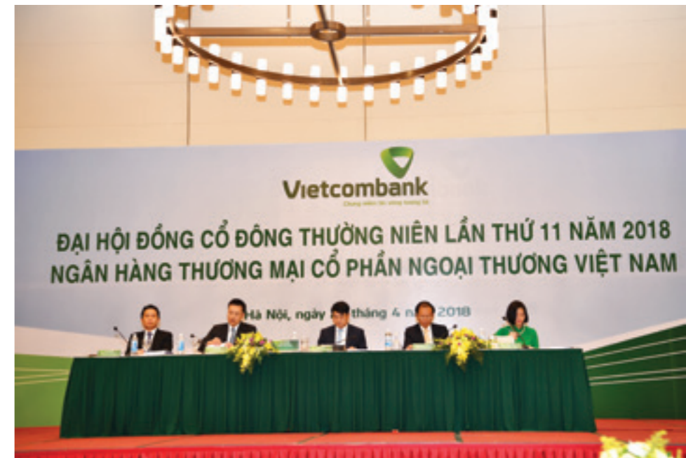
Đoàn Chủ tọa ĐHĐCĐ Vietcombank lần thứ 11 diễn ra tại Hà Nội ngày 27/4/2018

Bám sát định hướng điều hành của Chính phủ và NHNN, trong năm 2018, Vietcombank quyết tâm thực hiện các chỉ tiêu kế hoạch: tăng trưởng tổng tài sản ~14%, tăng trưởng dư nợ tín dụng ~15%, tăng trưởng huy động vốn ~15%, tổng lợi nhuận trước thuế đạt ~13.300 tỷ đồng, tỷ lệ chi trả cổ tức ~8%... Các định hướng lớn cho giai đoạn 2018 - 2023 cũng đã được HĐQT đề xuất với trọng tâm là hiện thực hóa các mục tiêu chiến lược đến năm 2020 làm nền tảng vững chắc cho những đột phá trong