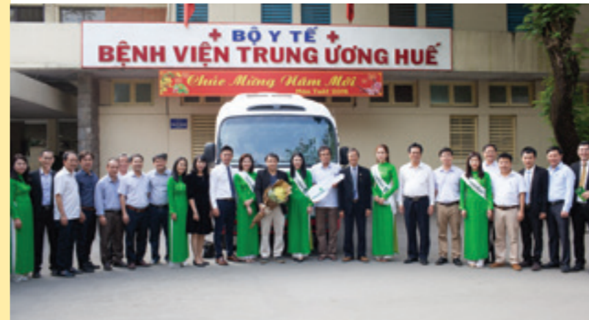
Lãnh đạo Vietcombank Huế và lãnh đạo Bệnh viện Trung ương Huế chụp hình lưu niệm tại buổi lễ bàn giao xe.