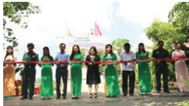
Các đại biểu cắt băng khánh thành cầu Tổ 7 và đường giao thông nông thôn ấp Tà Tây, xã Phi Thông, TP. Rạch Giá, tỉnh Kiên Giang