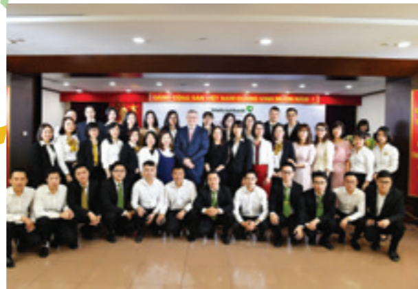
Các cán bộ bán hàng, các điểm bán xuất sắc quý IV/2017 và năm 2017