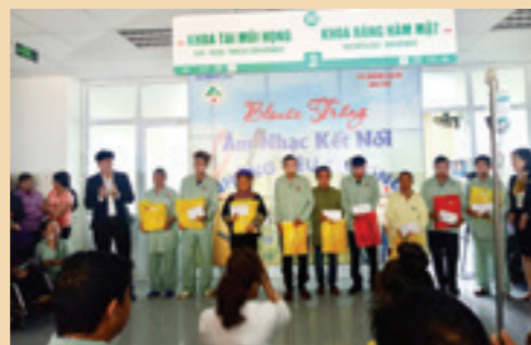
Vietcombank Lào Cai trao tặng 10 phần quà cho bệnh nhân nghèo tại bệnh viện Đa Khoa tỉnh Lào Cai