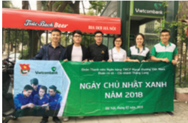
Đoàn viên tại các cơ sở Đoàn ra quân "Ngày Chủ Nhật xanh"

Ngày 25/03/2018, Đoàn Thanh niên Vietcombank đã chỉ đạo các cơ sở Đoàn trực thuộc đồng loạt tổ chức hoạt động "Ngày Chủ nhật xanh", một nội dung trong chuỗi các hoạt động của Đoàn hưởng ứng Tháng Thanh niên năm 2018 và lập thành tích chào mừng kỷ niệm 55 năm thành lập Vietcombank (1/4/1963 - 1/04/2018).