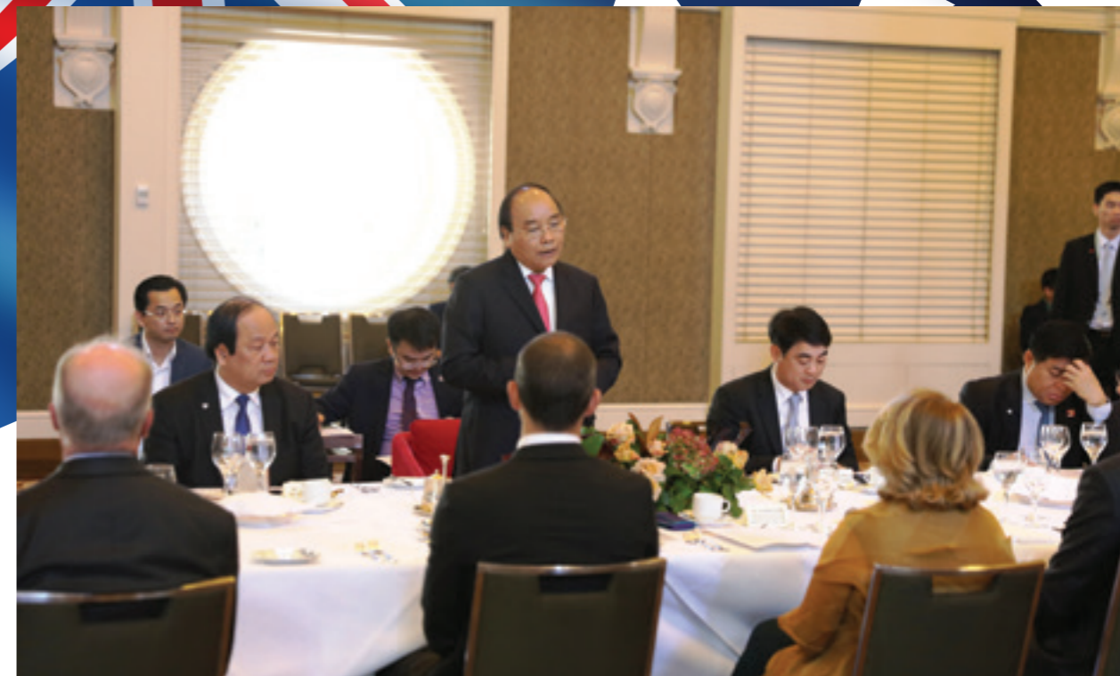
Thủ tướng Chính phủ phát biểu trong Buổi gặp mặt do Vietcombank tổ chức