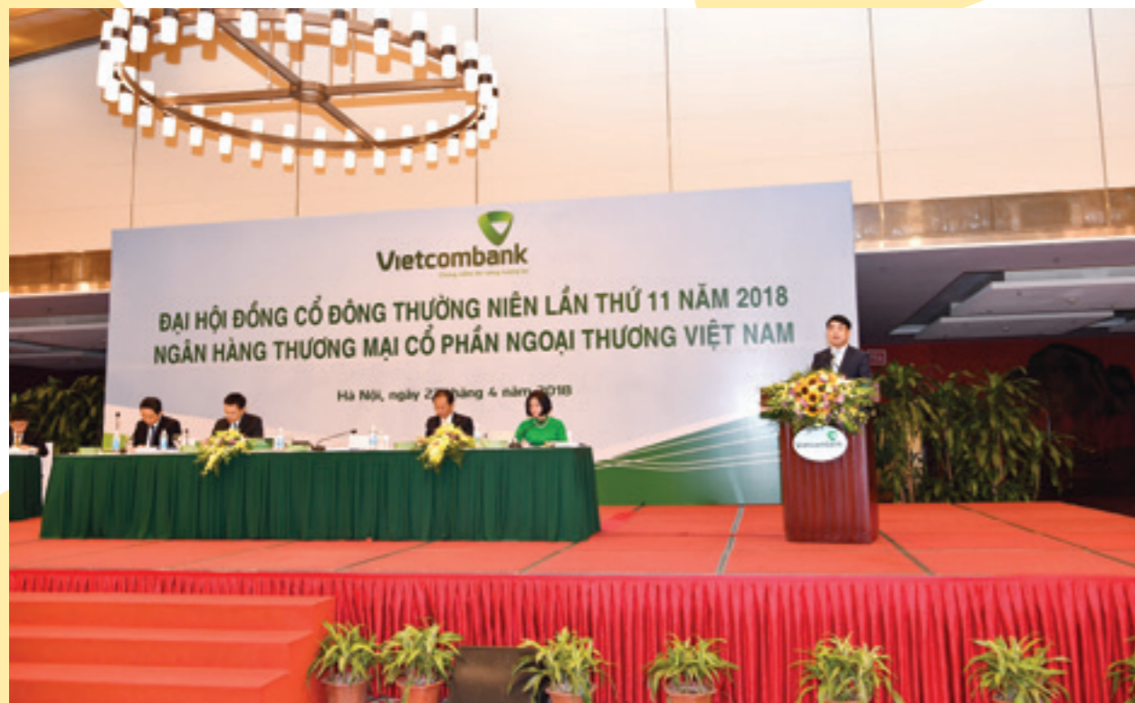
Ông Nghiêm Xuân Thành – Bí thư Đảng ủy, Chủ tịch HĐQT Vietcombank báo cáo trước ĐHĐCĐ Vietcombank lần thứ 11