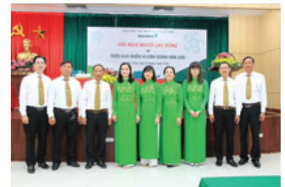
Ban Giám đốc Chi nhánh chụp ảnh lưu niệm cùng Lãnh đạo các Phòng ban