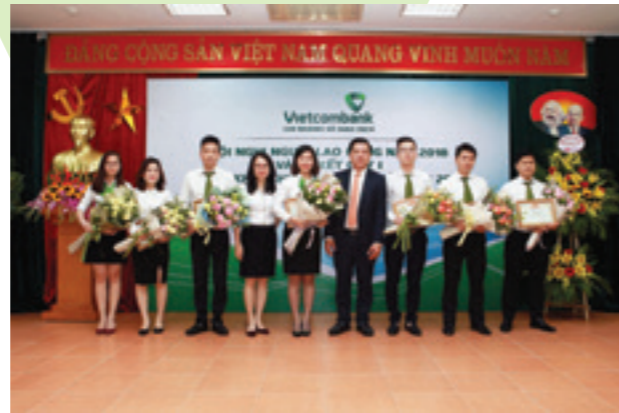
Lễ trao Quyết định khen thưởng