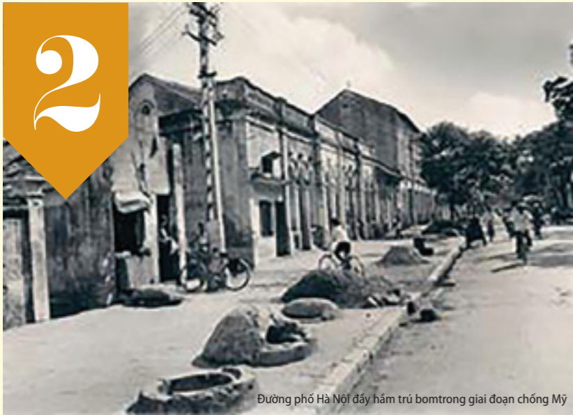
Đường phố Hà Nội đầy hầm trú bom trong giai đoạn chống Mỹ