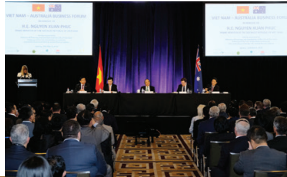
Diễn đàn doanh nghiệp Việt Nam - Úc được tổ chức tại Sydney - Australia ngày 16/03/2018

Trong khuôn khổ chương trình làm việc của Thủ tướng Chính phủ, ngày 17/03/2018, tại Sydney, Vietcombank đã tổ chức buổi gặp mặt giữa các doanh nghiệp Việt Nam và doanh nghiệp Australia với sự tham dự của Thủ tướng Nguyễn Xuân Phúc, các bộ trưởng và các lãnh đạo cấp cao. Tham gia buổi gặp mặt còn có các doanh nghiệp/hiệp hội hàng đầu tại Australia với tổng tài sản khoảng 800 tỷ USD thuộc các lĩnh vực khác nhau và các doanh nghiệp lớn của Việt Nam trong Đoàn tháp tùng Thủ tướng. Các doanh nghiệp Australia đều có chung mong muốn được hợp tác thương mại, đầu tư tại thị trường Việt Nam.