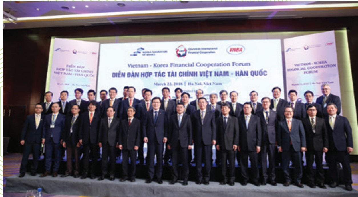
Các đại biểu chụp ảnh kỷ niệm