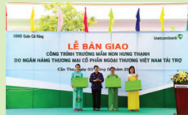
Ủy viên Bộ Chính trị, Chủ tịch Quốc hội Nguyễn Thị Kim Ngân (thứ 2 từ trái sang) trao tặng 3 bộ máy vi tính cho Trường mầm non Hưng Thạnh

TRONG KHUÔN KHỔ CHƯƠNG TRÌNH CÔNG TÁC TẠI TP. CẦN THƠ, CHIỀU NGÀY 3/5/2018, TẠI PHƯỜNG HƯNG THẠNH, QUẬN CÁI RĂNG, Đ/C NGUYỄN THỊ KIM NGÂN - ỦY VIÊN BỘ CHÍNH TRỊ, CHỦ TỊCH QUỐC HỘI ĐÃ DỰ LỄ BÀN GIAO CÔNG TRÌNH TRƯỜNG MẦM NON HƯNG THẠNH DO VIETCOMBANK TÀI TRỢ 5 TỶ ĐỒNG KINH PHÍ XÂY DỰNG.