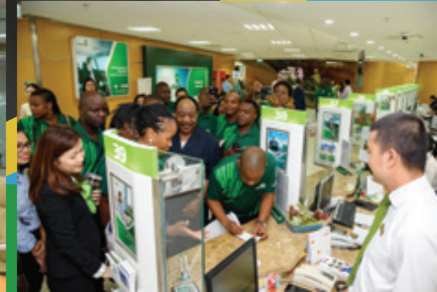
Đoàn đại biểu doanh nghiệp Tanzania tham quan trụ sở Vietcombank CN Tp.HCM