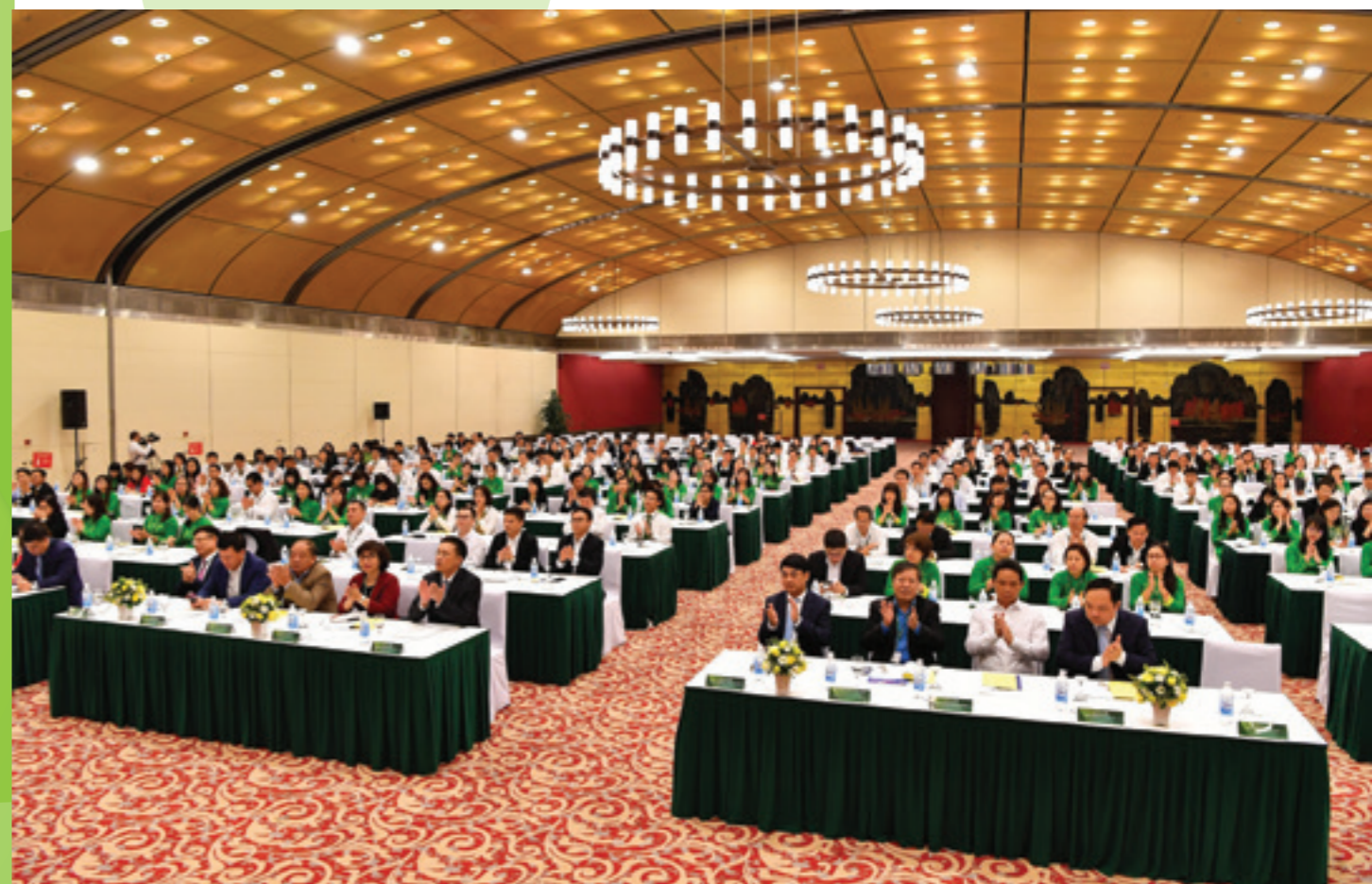
Toàn cảnh Hội nghị

VỚI KẾT QUẢ HOẠT ĐỘNG KINH DOANH VƯỢT TRỘI CỦA VIETCOMBANK THỜI GIAN QUA, ĐẶC BIỆT LÀ, NĂM 2017, CÁC ĐIỀU KIỆN DÀNH CHO NLĐ VIETCOMBANK NHƯ THU NHẬP, CHẾ ĐỘ ĐÃI NGỘ, ĐIỀU KIỆN LÀM VIỆC, MÔI TRƯỜNG LÀM VIỆC... ĐỀU ĐƯỢC THỰC HIỆN Ở MỨC TỐT NHẤT. VIETCOMBANK VINH DỰ ĐƯỢC BÌNH CHỌN TOP 4 NƠI LÀM VIỆC TỐT NHẤT VIỆT NAM TRONG NĂM 2017 VỪA QUA.