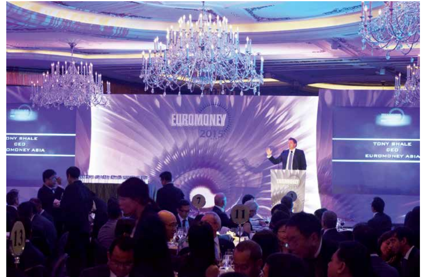
Toàn cảnh Lễ trao giải thưởng Awards for Excellence do Tạp chí Euromoney tổ chức tại Island Shangri La - Hong Kong ngày 16/07/2015

Giải thưởng Awards for Excellence do Tạp chí Euromoney bình chọn là một hệ thống giải thưởng danh giá bậc nhất thế giới trong ngành tài chính - ngân hàng, bao gồm 25 giải thưởng quốc tế và các giải thưởng Best Bank trao cho các ngân hàng dẫn đầu tại 100 quốc gia. Mục đích của các giải thưởng này nhằm vinh danh các tổ chức và cá nhân thể