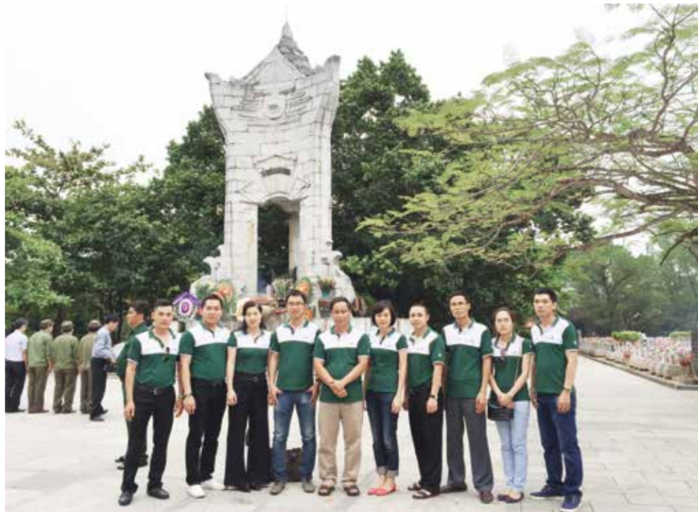
Chi bộ cơ sở Vietcombank Nam Hà Nội dâng hương tại Nghĩa trang Trường Sơn