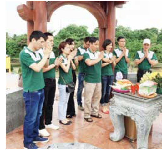
Chi bộ cơ sở Vietcombank Nam Hà Nội dâng hương tại Thành cổ Quảng Trị