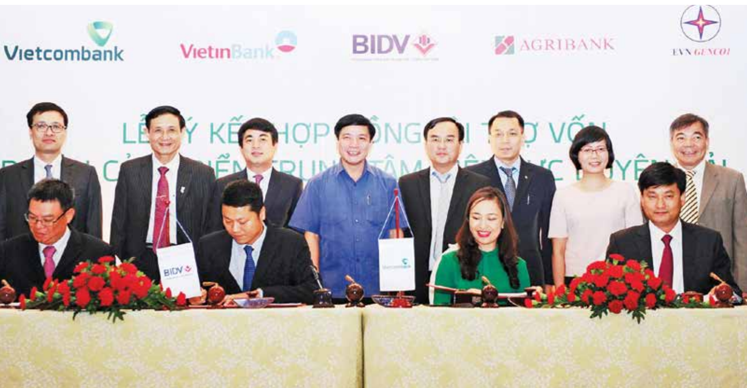
Lễ ký kết hợp đồng tín dụng tài trợ 5.500 tỷ đồng vốn đầu tư xây dựng Dự án Cảng biển Trung tâm Điện lực Duyên Hải giữa Vietcombank, Vietinbank, BIDV, Agribank và EVN GENCO1

Ngày 31/07/2015 tại Hà Nội, Ngân hàng TMCP Ngoại thương Việt Nam (Vietcombank) với vai trò là ngân hàng đầu mối đã cùng 3 ngân hàng là Vietinbank, BIDV và Agribank ký kết hợp đồng tín dụng tài trợ 5.500 tỷ đồng vốn đầu tư xây dựng Dự án Cảng biển Trung tâm Điện lực Duyên Hải của Tổng Công ty Phát điện 1 (EVN GENCO1) - đơn vị thành viên Tập đoàn Điện lực Việt Nam.