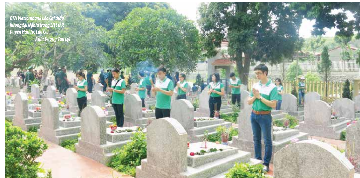
ĐTN Vietcombank Lào Cai thấp hương tại Nghĩa trang Liệt sĩ P. Duyên Hải, Tp. Lào Cai