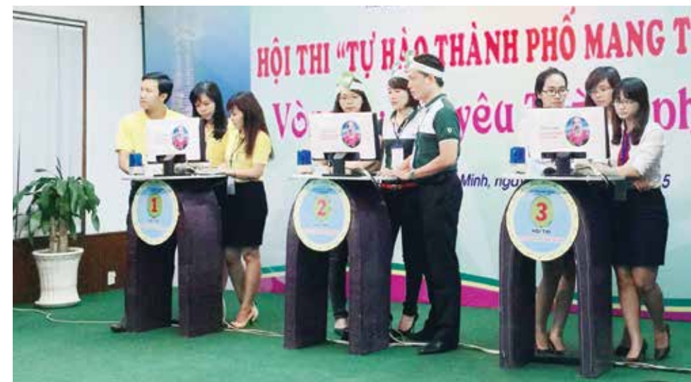
Vòng 2 "Tự hào thành phố tôi"