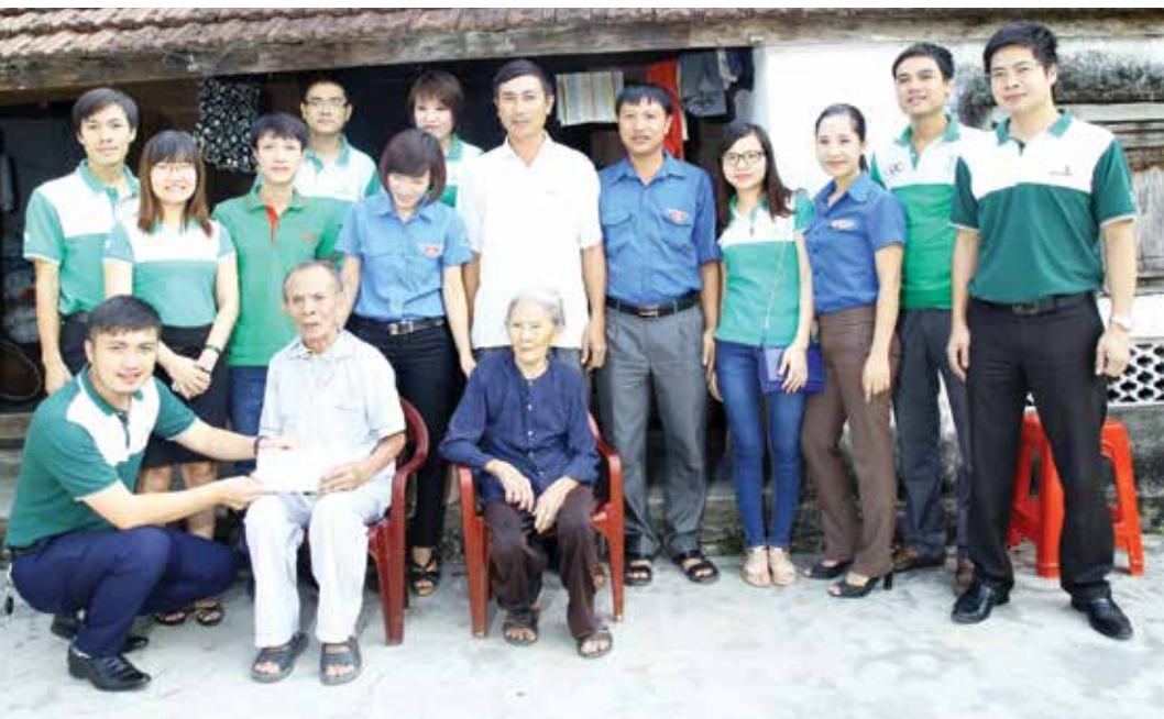
Đoàn cơ sở Vietcombank Hà Tĩnh trao quà cho đối tượng chính sách tại huyện Thạch Hà, tỉnh Hà Tĩnh

Doanh nghiệp tỉnh tổ chức chuyến thăm hỏi và trao tặng 68 suất quà cho các gia đình chính sách, thương bệnh binh, nạn nhân chất độc da cam trên địa bàn Thành phố Hà Tĩnh, huyện Can Lộc, huyện