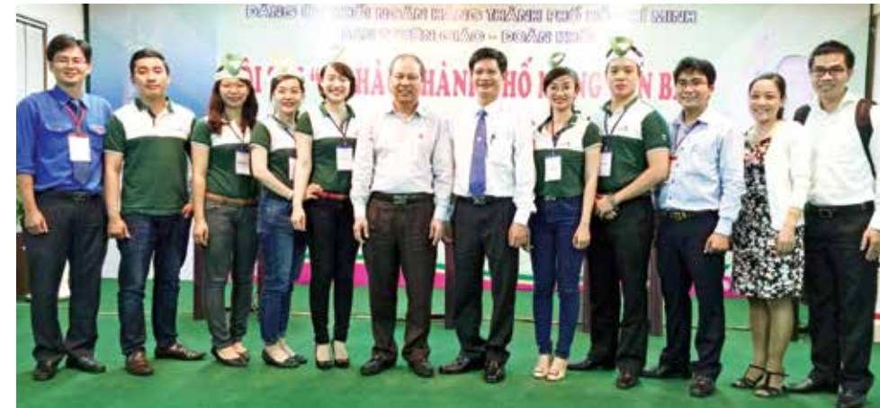
Tham gia thi vòng 2

Thành phố 40 năm xây dựng, phát triển và Tư tưởng, đạo đức Hồ Chí Minh; Vòng Chung kết "Giai điệu tự hào" - mỗi đơn vị phải thực hiện một chương trình văn nghệ theo chủ đề bốc thăm ngẫu nhiên. Hội thi là cơ hội để thu hút đông đảo lực lượng đoàn viên, thanh niên, người lao động trong ngành ngân hàng trên địa bàn TP. Hồ Chí Minh cùng ôn lại lịch sử vẻ vang của dân tộc, nâng cao nhận thức,