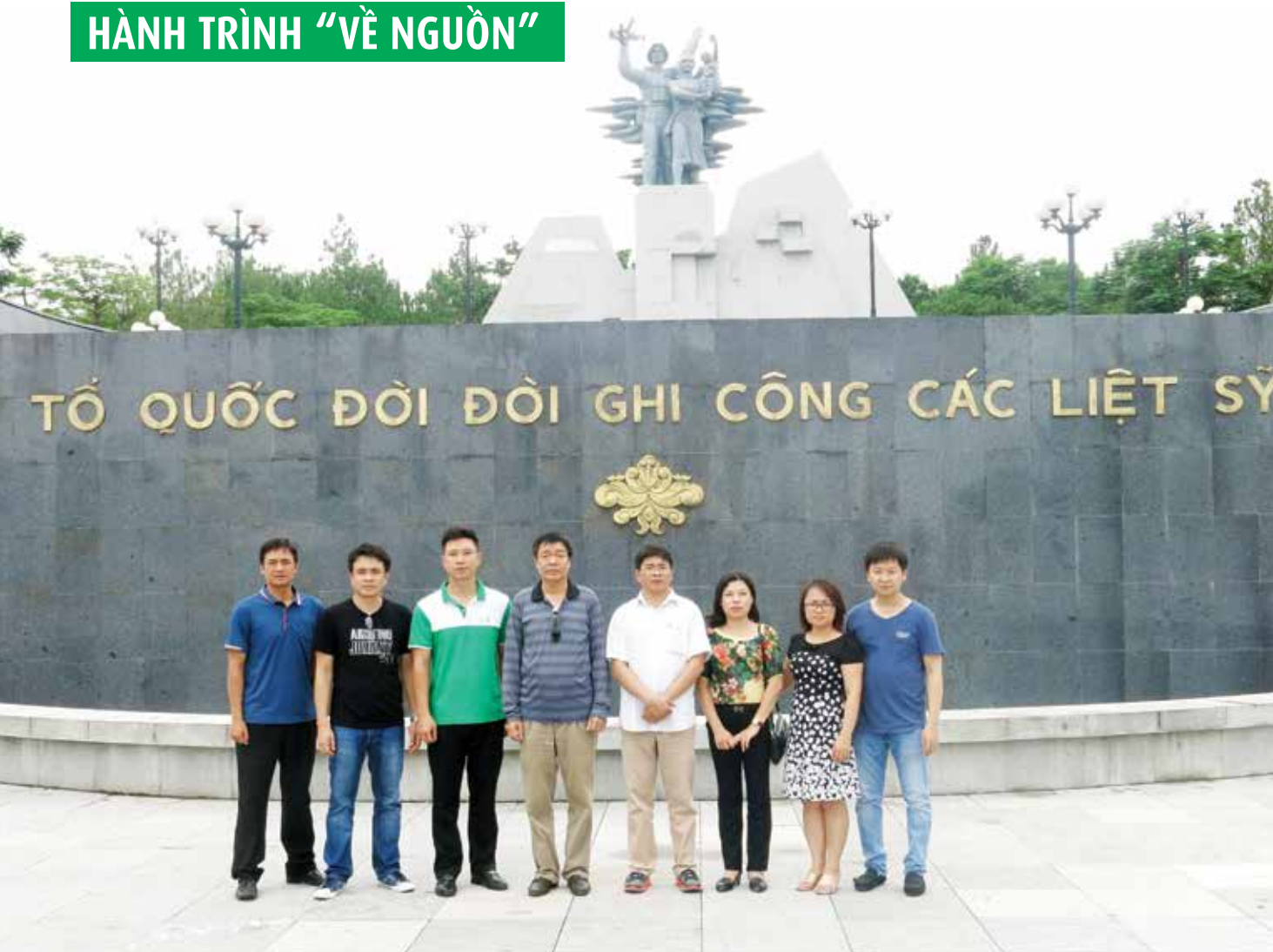
Vietcombank Đông Anh chụp ảnh lưu niệm tại Nghĩa trang Đường 9