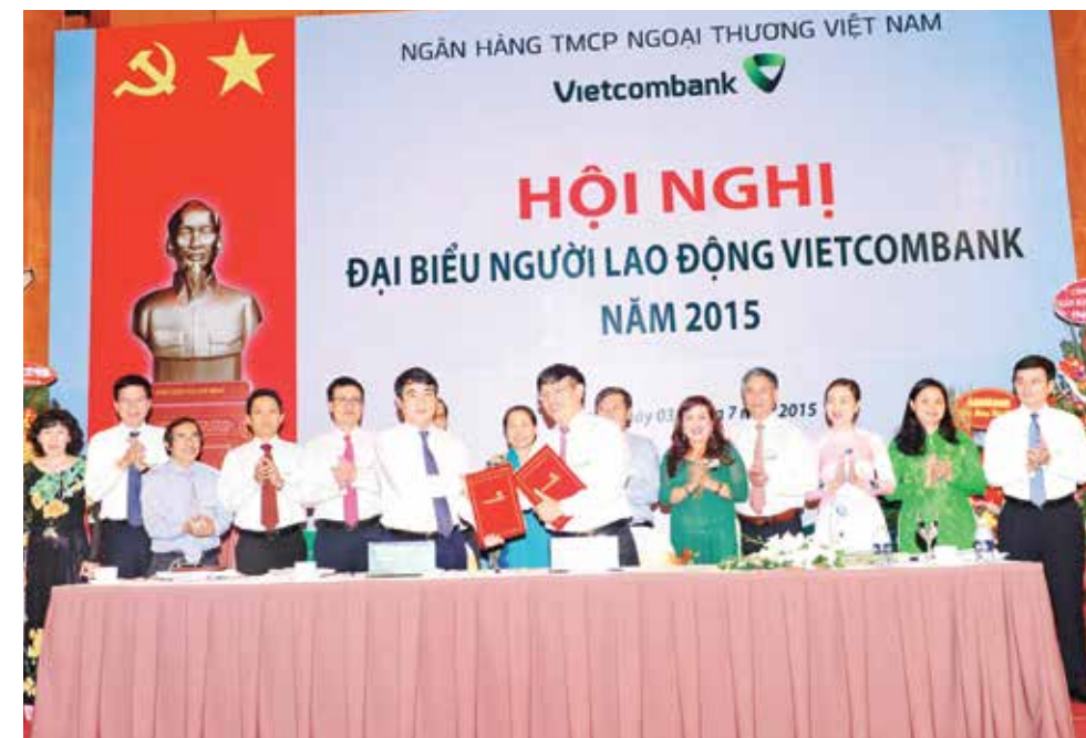
Lễ ký thỏa ước lao động tập thể Vietcombank năm 2015

đốc; các ông/bà là thành viên HĐQT, thành viên Ban điều hành, Trưởng ban kiểm soát, Kế toán trưởng, Giám đốc khối, cùng các đại biểu đại diện cho các chi nhánh Vietcombank trong hệ thống.