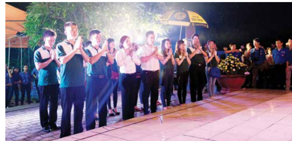
Thanh niên Vietcombank Chi nhánh Sóc Sơn dâng hương tưởng niệm tại nghĩa trang Liệt sỹ xã Minh Trí, huyện Sóc Sơn