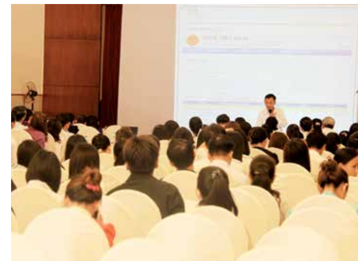
Đại diện Cục thuế tỉnh Đồng Nai hướng dẫn và giải đáp về nộp thuế điện tử

Tới tham dự buổi hội thảo có gần 300 cán bộ đại diện cho hơn 200 doanh nghiệp trên địa bàn. Tại buổi hội thảo, Cục thuế và Vietcombank Nhon Trạch đã phối hợp, hướng dẫn, hỗ trợ cũng như giải đáp đầy đủ các khó khăn vướng mắc của khách hàng nhờ đó Vietcombank Nhon Trạch được khách hàng đánh giá rất cao trong việc kết nối và hỗ trợ các doanh nghiệp. Sau 5 ngày hội thảo đã có gần 300 doanh nghiệp đăng ký thành công dịch vụ nộp thuế điện tử từ đó góp phần thực hiện thắng lợi thỏa thuận hợp tác của Vietcombank. □