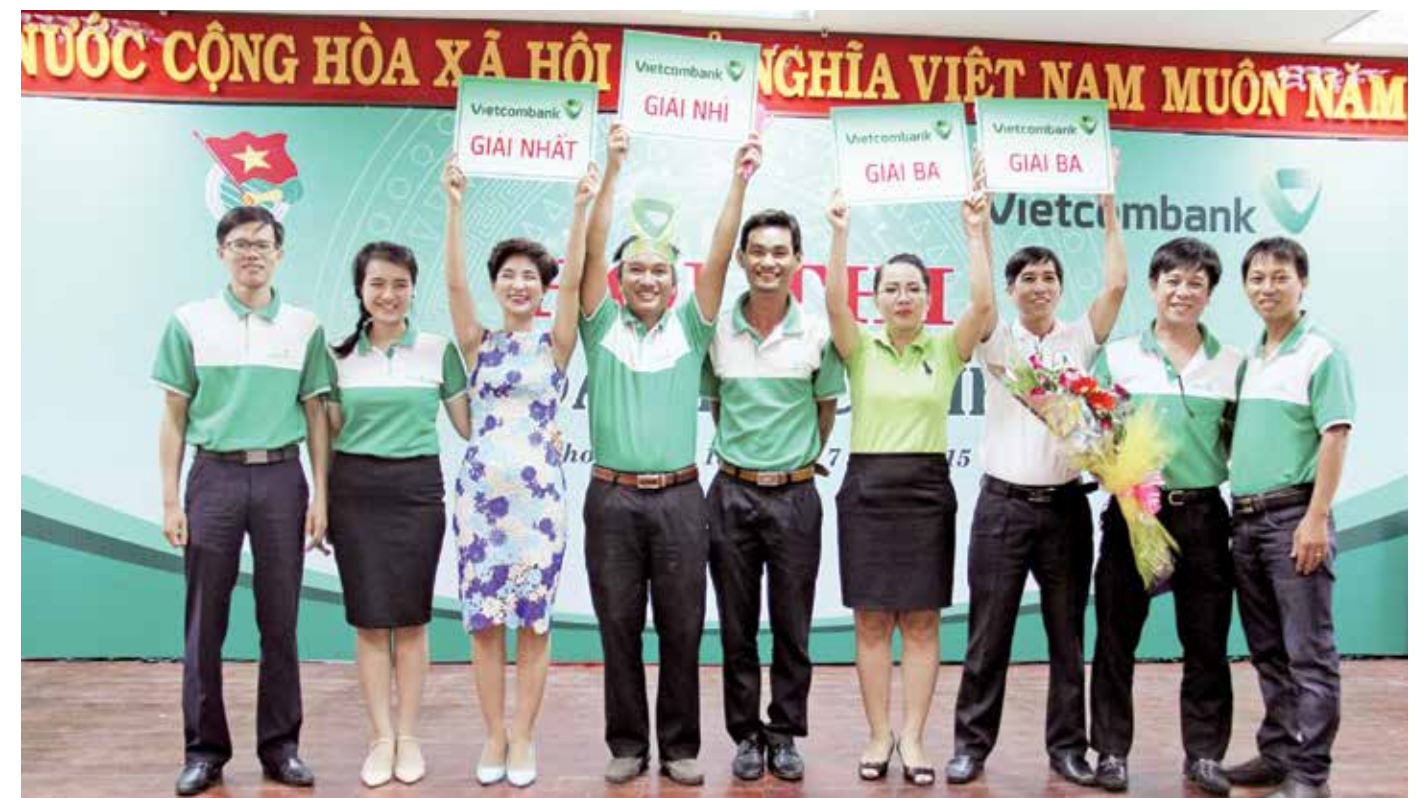
Lễ trao giải

Kết thúc Hội thi, với sự tự tin và sáng tạo, đội Bản Sắc đã giành giải Nhất, đội Nhất Tâm giành giải Nhì, đội Đồng Hành và Kết Nối được trao đồng giải Ba. Hội thi đã để lại ấn tượng tốt đẹp cho toàn thể cán bộ nhân viên Chi nhánh, là cơ hội để Đoàn viên thanh niên Vietcombank Quy Nhơn nâng cao tinh thần đoàn kết, phát huy vai trò tuyên truyền trong việc thực hiện tốt các chuẩn mực đạo đức trong cuốn sổ tay "Văn hóa Vietcombank" với 5 giá trị cốt lõi "Tin cậy - Chuẩn mực - Sẵn sàng đổi mới - Bền vững - Nhân văn". □