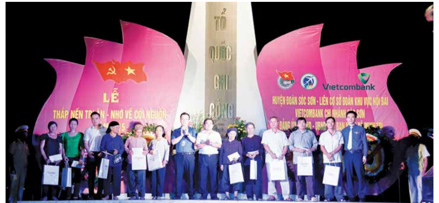
Lãnh đạo Vietcombank Sóc Sơn trao quà tri ân đến những người có công với cách mạng