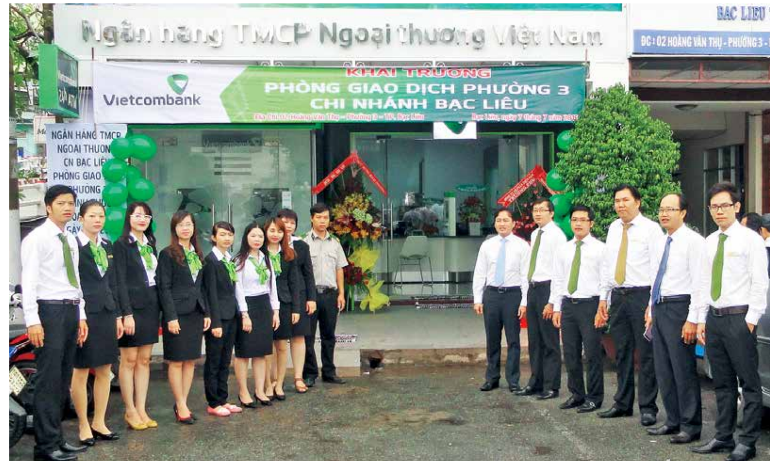
Phòng giao dịch Phường 3 - Vietcombank Bạc Liêu khai trương ngày 07/7/2015

-ĐT: 07813. 820888 - Fax: 07813. 850999 □