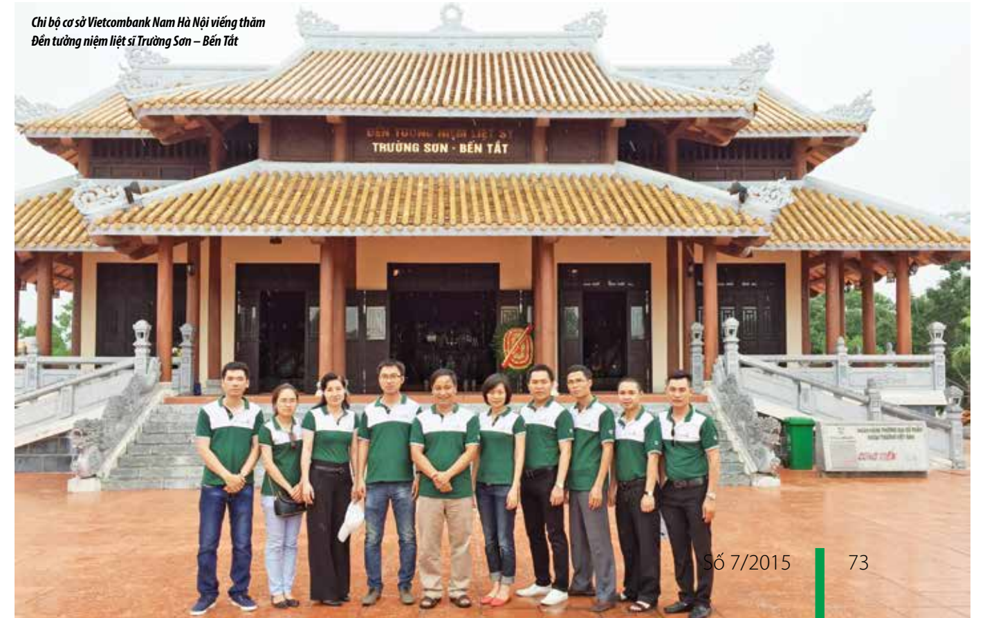
Chi bộ cơ sở Vietcombank Nam Hà Nội viếng thăm Đền tưởng niệm liệt sĩ Trường Sơn – Bến Tắt