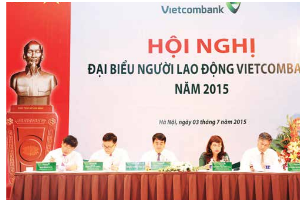
Đoàn chủ tịch điều hành hội nghị