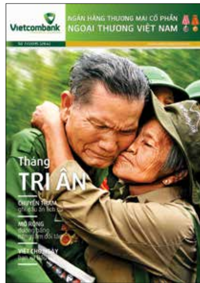
BẢN TIN CỦA NGÂN HÀNG TMCP NGOẠI THƯƠNG VIỆT NAM SỐ 7/2015 (264)