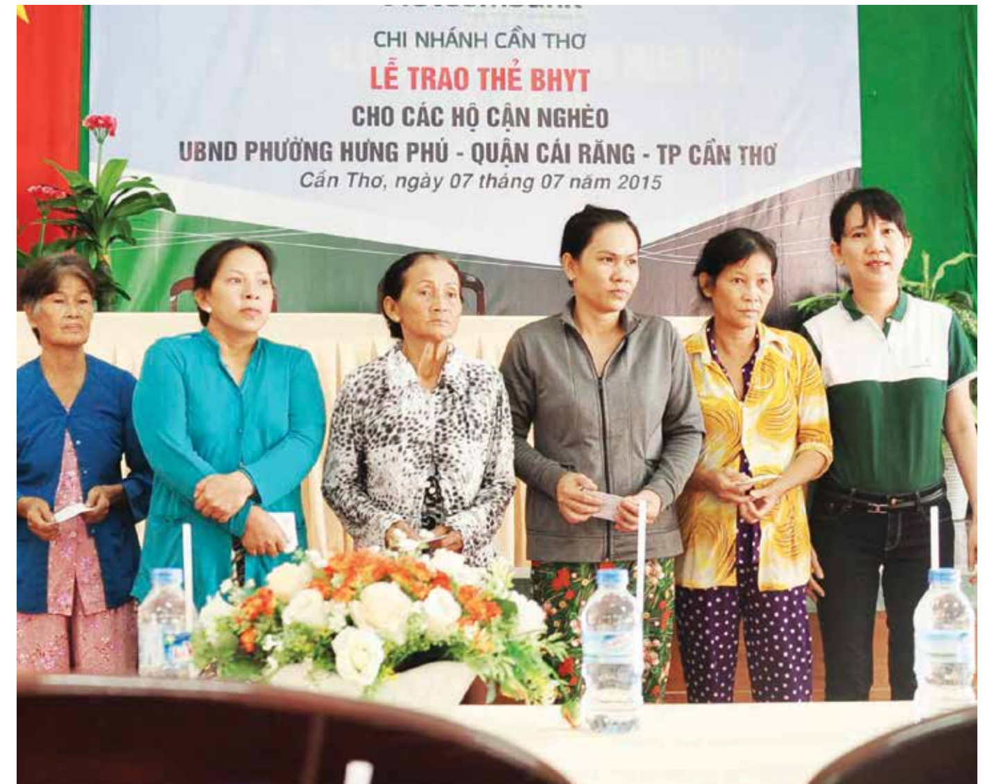
Vietcombank Cần Thơ trao tặng thẻ BHYT cho các hộ cận nghèo phường Hưng Phú, quận Cái Răng, TP. Cần Thơ