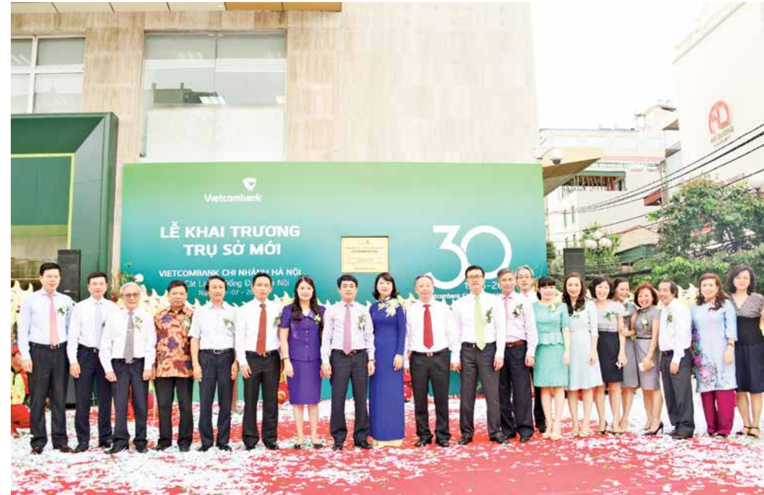
Ban lãnh đạo Vietcombank cùng Giám đốc chi nhánh Vietcombank Hà Nội và các đại biểu chụp hình lưu niệm tại buổi lễ kỷ niệm