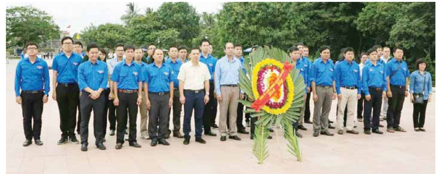
Đoàn dâng hương tại thành cổ Quảng Trị