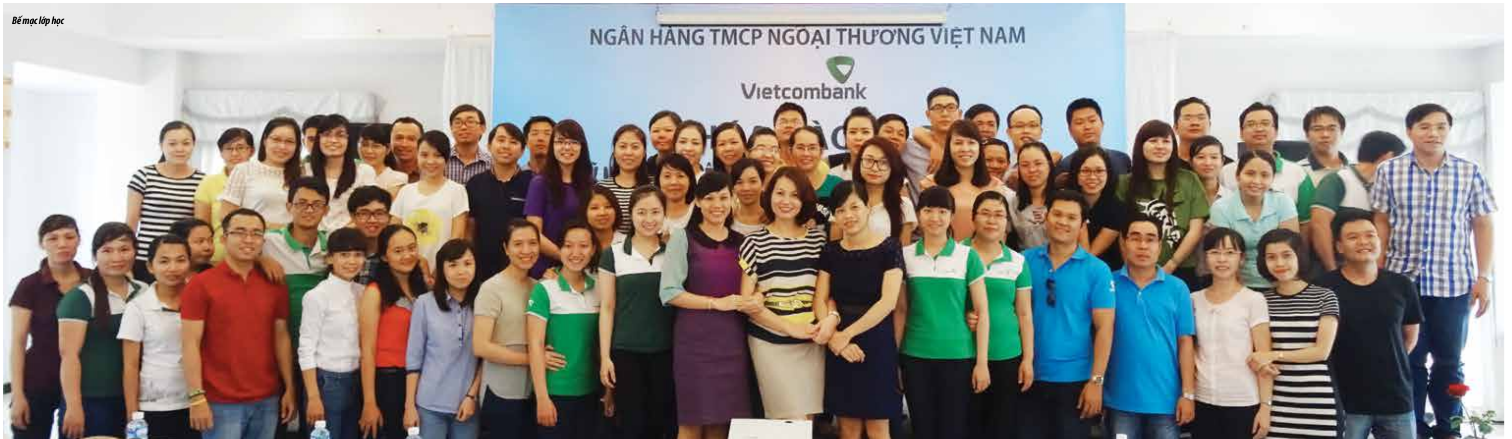
Bế mạc lớp học