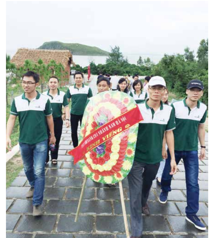
Chi bộ cơ sở Vietcombank Nam Hà Nội viếng mộ Đại tướng Võ Nguyên Giáp

Chi bộ cơ sở Vietcombank Nam Hà Nội thật sự có ý nghĩa đối với mỗi cán bộ, đảng viên tham gia hành trình khi đã khơi dậy và làm sáng lên truyền thống yêu nước, giá trị nhân văn và đức hy sinh của các thế hệ người Việt Nam qua các thời kỳ kháng chiến kiến quốc của dân tộc, góp phần làm phong phú thêm đời sống tinh thần và tạo động lực cho phong trào thi đua yêu nước, lao động sáng tạo của cán bộ, đảng viên thuộc Chi bộ cơ sở Vietcombank Nam Hà Nội.