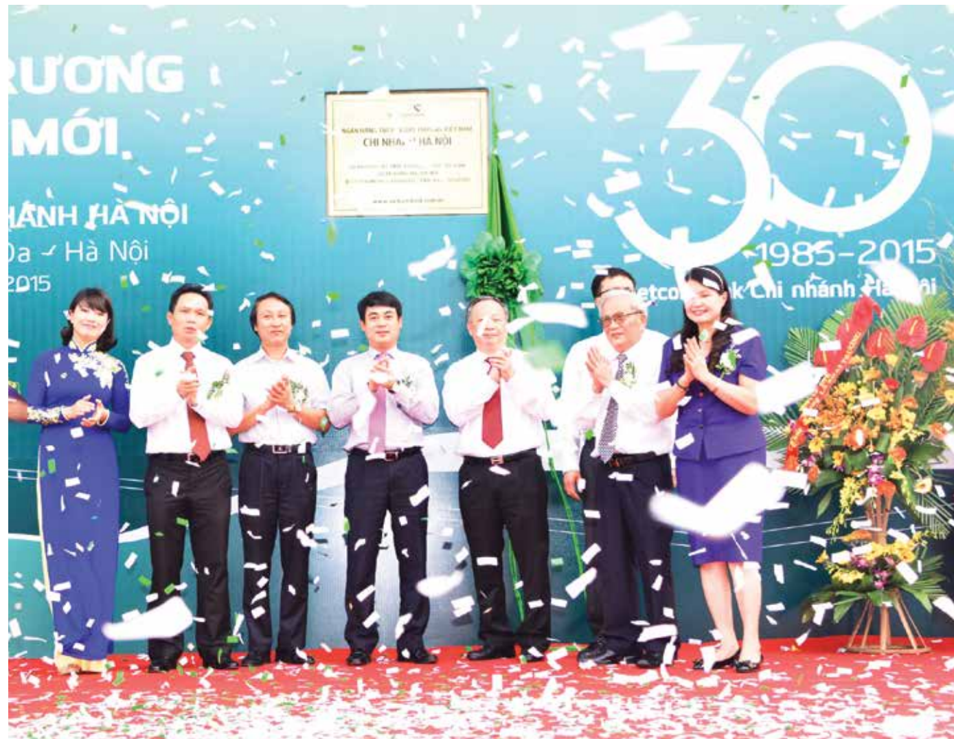
Lễ kỷ niệm 30 năm thành lập và khai trương trụ sở mới chi nhánh Vietcombank Hà Nội