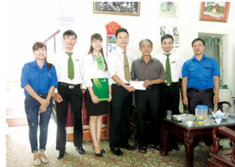
Đoàn cơ sở Vietcombank Đông Anh đến thăm thương binh nhân dịp 27/07