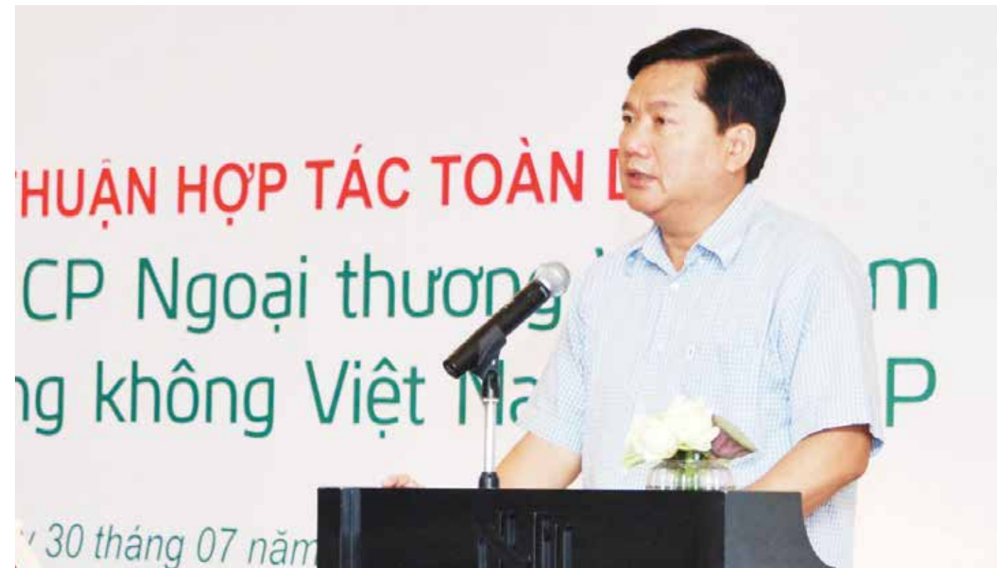
Ông Đinh La Thăng - Ủy viên BCH Trung ương Đảng - Bộ trưởng Bộ Giao thông Vận tải phát biểu tại buổi lễ

Việc ký kết Thỏa thuận Hợp tác toàn diện giữa Vietcombank - Ngân hàng tốt nhất Việt Nam và Vietnam Airlines - Hãng hàng không Quốc gia đã được ví như là việc mở rộng đường băng để nâng tầm đối tác.