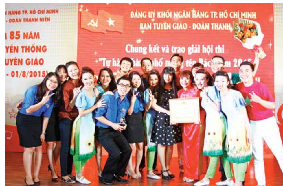
Niềm vui giành giải

trách nhiệm của thế hệ trẻ trong việc phát triển đơn vị, chung tay xây dựng Thành phố, xây dựng đất nước trong thời kỳ hội nhập và đổi mới.