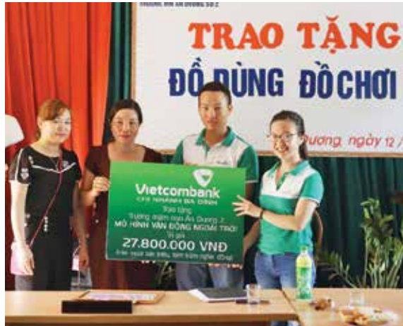
Đoàn TN Vietcombank Ba Đình trao tặng Mô hình vận động ngoài trời trị giá 27.800.000 đồng cho trường mầm non An Dương 2, xã An Dương, huyện Tân Yên, tỉnh Bắc Giang.

Với đặc thù nằm trên địa bàn nghèo nhất của huyện Tân Yên, trường Mầm non An Dương 2 là ngôi trường dành cho trẻ em của 9 xã với nhiều dân tộc có trình độ dân trí không đồng đều, cơ sở vật chất cũng như sự quan tâm cho giáo dục còn nghèo nàn, nhiều thiếu thốn. Theo đại diện