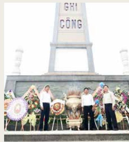
Hình ảnh dâng hương tại nghĩa trang liệt sĩ Hội An