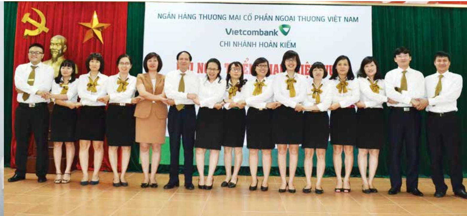
Tập thể lãnh đạo Vietcombank Hoàn Kiếm quyết tâm chung sức hoàn thành các mục tiêu kinh doanh trong 6 tháng cuối năm