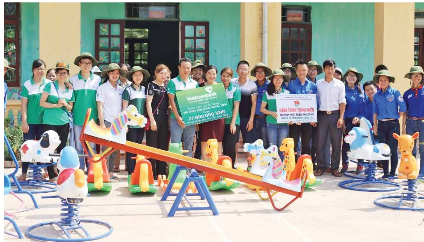
Đoàn TN Vietcombank Ba Đình trao tặng Mô hình vận động ngoài trời trị giá 27.800.000 đồng cho trường mầm non An Dương 2, xã An Dương, huyện Tân Yên, tỉnh Bắc Giang.