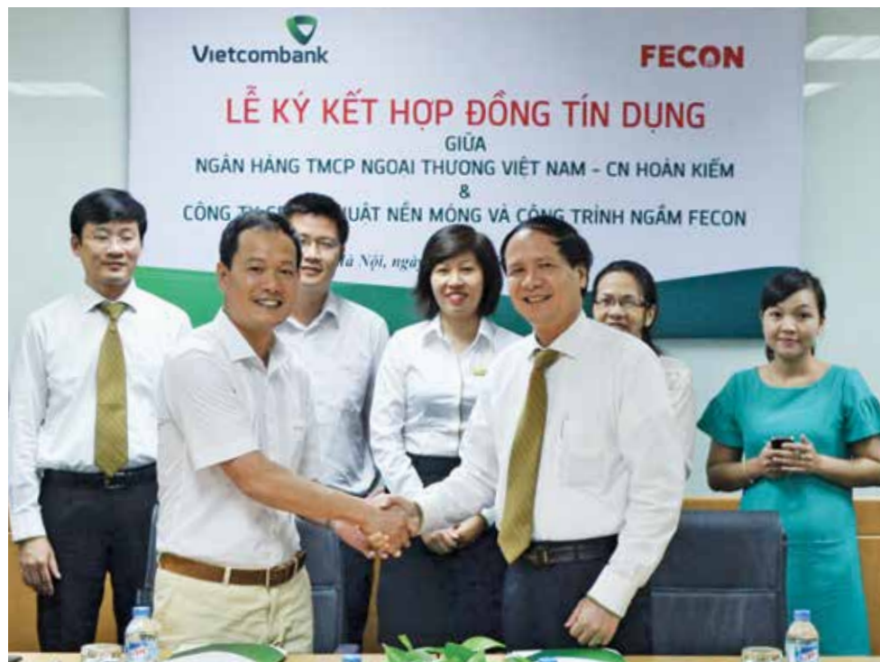
Lễ ký kết hợp đồng tín dụng giữa Công ty CP Fecon và Vietcombank Hoàn Kiếm