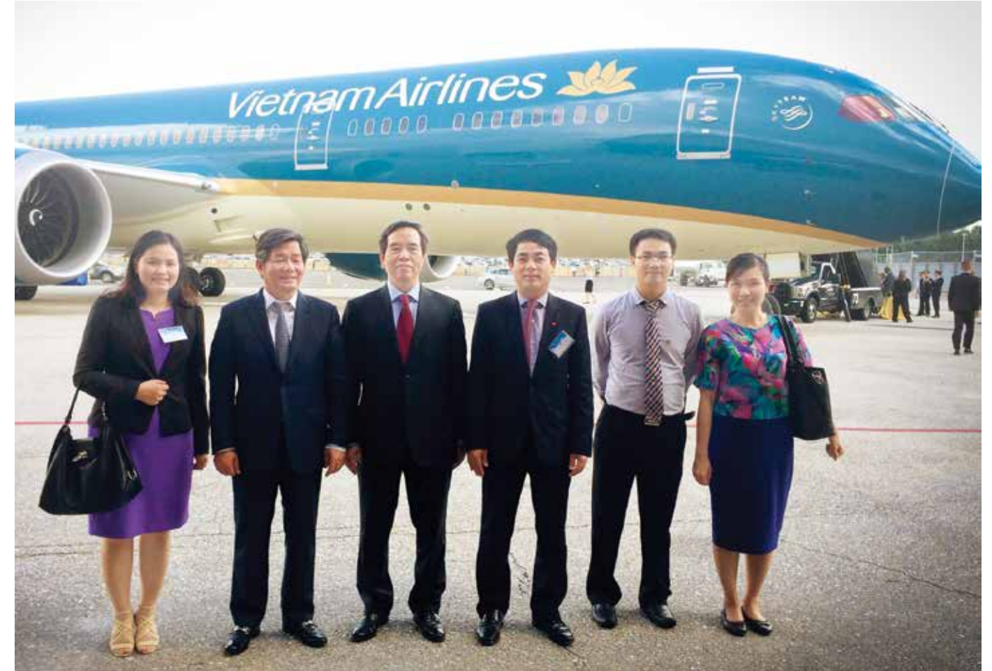
Đoàn công tác Vietcombank chụp ảnh lưu niệm cùng Thống đốc NHNN Nguyễn Văn Bình (thứ 3 từ trái sang), Bộ trưởng Bộ KH&ĐT Bùi Quang Vinh (thứ 2 từ trái sang) tại buổi lễ bàn giao máy bay Boeing 787-9 Dreamliner giữa Tập đoàn Boeing và Vietnam Airlines