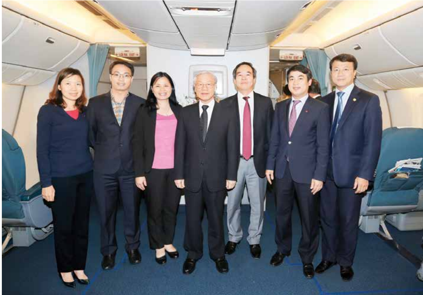
Đoàn công tác Vietcombank chụp ảnh lưu niệm cùng Tổng Bí thư Nguyễn Phú Trọng (thứ 4 từ phải sang) và Thống đốc NHNN Nguyễn Văn Bình (thứ 3 từ phải sang)