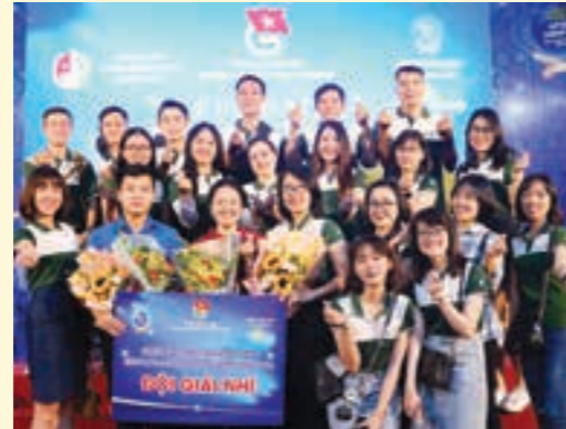
Đoàn Thanh niên Vietcombank vinh dự có 02 thí sinh tham dự và giành giải cao tại Chung kết cuộc thi Olympic tiếng Anh dành cho cán bộ trẻ năm 2020 do TW Đoàn tổ chức

Năm 2020, hòa chung không khí tuổi trẻ cả nước rộn ràng thi đua lập thành tích chào mừng Đại hội Đảng bộ các cấp hướng tới Đại hội Đảng toàn quốc lần thứ XIII, mặc dù các hoạt động gặp nhiều hạn chế do đại dịch COVID-19 gây ra, tuổi trẻ Vietcombank đã khắc phục khó khăn, xung kích thực hiện nhiều hoạt động và đạt được nhiều thành tích nổi bật, đóng góp vào thành tích chung của toàn hệ thống chào mừng thành công Đại hội Đảng bộ Vietcombank lần thứ IV, nhiệm kỳ 2020-2025.