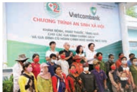
Đại diện Vietcombank và Bệnh viện Quận 2 cùng các mạnh thường quân trao quà cho người dân địa phương