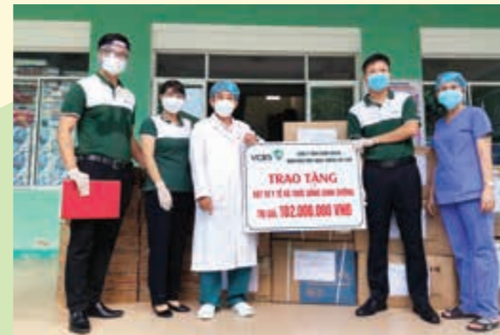
Tặng vật tư y tế và thức uống dinh dưỡng cho các y bác sỹ bệnh viện tuyến đầu phòng chống dịch COVID-19

Phát biểu chỉ đạo tại Đêm tổng kết Hội trại, đ/c Nghiêm Xuân Thành - Ủy viên BTW Đảng ủy Khối DNTW, Bí thư Đảng ủy, Chủ tịch HĐQT Vietcombank nhấn mạnh: Những thành quả nổi bật, tích cực của Vietcombank trong 05 năm gần đây có phần đóng góp to lớn của lớp cán bộ trẻ... Ban Lãnh đạo kỳ vọng và giao nhiệm vụ cho lớp cán bộ trẻ Vietcombank sẽ là lực lượng nòng cốt, trọng yếu và quan trọng nhất để cùng với hệ thống hiện thực hóa các mục tiêu chiến lược từ nay đến 2025 mà Ban Lãnh đạo đã đề ra. Ngọn lửa nhiệt huyết đã được thắp lên hôm nay sẽ phải được lan tỏa và cháy mãi trong tim