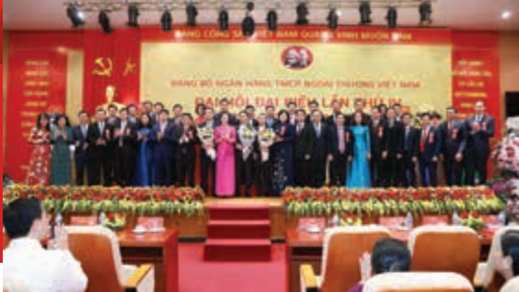
Lãnh đạo Ban Tổ chức Trung ương, Đảng ủy Khối DNTW, NHNN chúc mừng Ban chấp hành Đảng bộ Vietcombank khóa IV, nhiệm kỳ 2020-2025

phong cách Hồ Chí Minh vào thực tiễn Văn hóa Vietcombank, thu hút hơn 2.300 cán bộ, đảng viên tham gia vòng thi trực tuyến và gần 300 cán bộ đảng viên đại diện cho 7 khu vực và Trụ sở chính tham gia vòng thi chung khảo tổ chức vào ngày 27/06/2020; "Hội trại Đoàn Thanh niên toàn hệ thống" với chủ đề "Thanh niên Vietcombank sắt son niềm tin với Đảng" đã thu hút hơn 700 đoàn viên thanh niên trên toàn hệ thống tham gia vào ngày 28/06/2020.