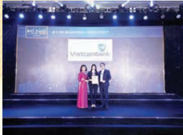
Đại diện Vietcombank nhận chứng nhận từ Ban Tổ chức

Tháng 10/2020, Công ty Anphabe - đơn vị tư vấn tiên phong về giải pháp thương hiệu nhà tuyển dụng và môi trường làm việc hạnh phúc tại Việt Nam cùng Intage - công ty nghiên cứu thị trường hàng đầu Nhật Bản công bố kết quả khảo sát “100 nơi làm việc tốt nhất Việt Nam năm 2020”.