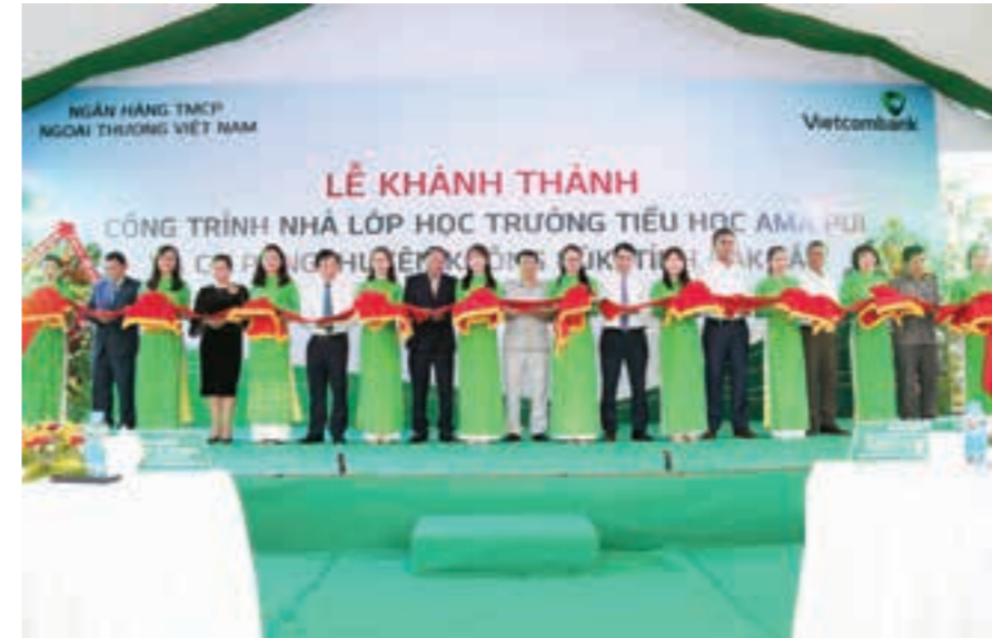
Các đại biểu thực hiện nghi thức cắt băng khánh thành tại buổi lễ