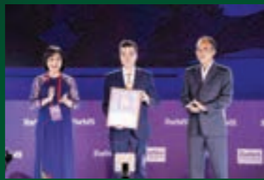
Đại diện Vietcombank nhận vinh danh từ Ban tổ chức