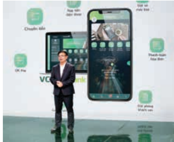
Vietcombank chính thức ra mắt dịch vụ ngân hàng số VCB Digibank hoàn toàn mới, được xây dựng trên nền tảng hợp nhất các giao dịch riêng rẽ trên internet banking và mobile banking

Năm 2020, Vietcombank đã chính thức ra mắt dịch vụ ngân hàng số VCB Digibank hoàn toàn mới, thanh toán đa kênh tích hợp được xây dựng trên việc hợp nhất các nền tảng giao dịch riêng rẽ trên internet banking và mobile banking, cung cấp trải nghiệm liền mạch, thống nhất cho khách hàng trên các phương tiện điện tử và thiết bị di động. Vietcombank cũng là ngân hàng tiên phong cung cấp giải pháp thanh toán trực tuyến cho các dịch vụ trên Cổng dịch vụ công Quốc gia.