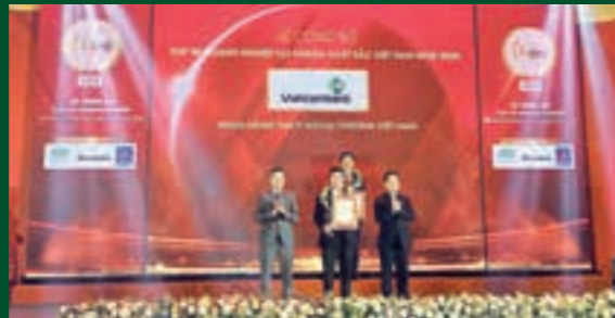
Đại diện Vietcombank nhận giải thưởng từ Ban tổ chức

Năm 2020 là năm thứ tư liên tiếp công bố bảng xếp hạng PROFIT500, đồng thời là năm đầu tiên công bố danh sách Top 50 Doanh nghiệp lợi nhuận xuất sắc Việt Nam (Vietnam Best Profitable). Vietcombank vinh dự được bình chọn với vị trí dẫn đầu các ngân hàng Việt Nam trong Top 50 Doanh nghiệp lợi nhuận xuất sắc nhất Việt Nam.