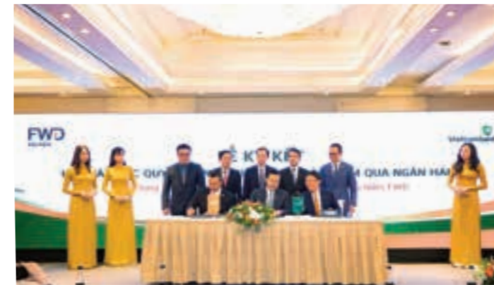
Vietcombank và Tập đoàn Bảo hiểm FWD ký kết Biên bản hợp tác độc quyền phân phối bảo hiểm thời hạn 15 năm

Sự lớn mạnh của Bancassurance đã đặt các ngân hàng và công ty bảo hiểm ngày càng gần nhau hơn. Trong những năm gần đây, thị trường liên tục chứng kiến nhiều thương vụ hợp tác độc quyền phân phối giữa ngân hàng và công ty bảo hiểm.