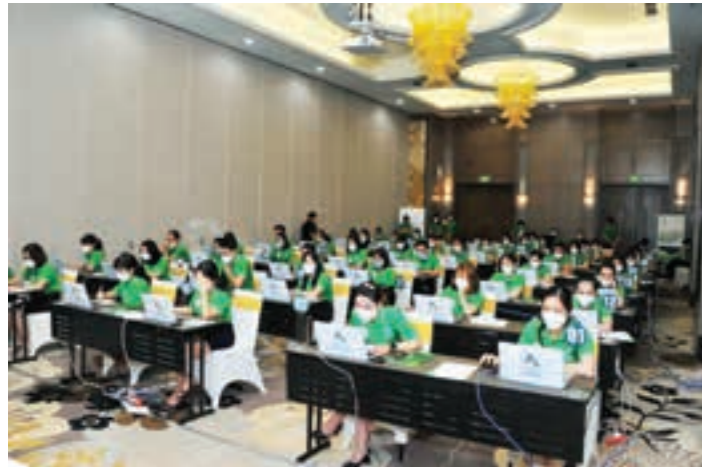
Toàn cảnh phần thi Trắc nghiệm