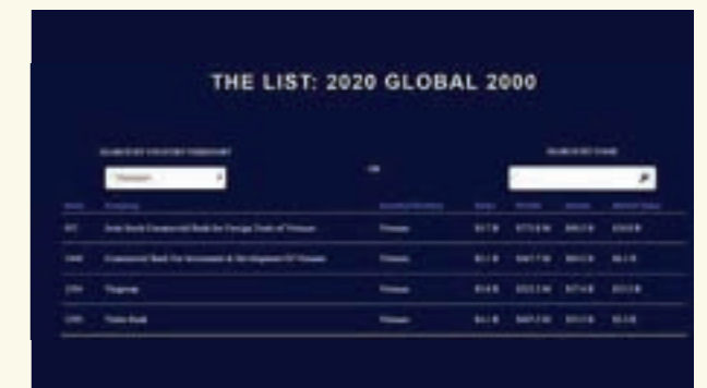
Đại diện duy nhất tại Việt Nam có mặt trong Top 1.000 doanh nghiệp

Vietcombank hiện là ngân hàng đầu tại Việt Nam có tổng tài sản 50 tỷ USD và giá trị vốn hóa cao nhất trong các TCTD niêm yết trên thị trường chứng khoán Việt Nam. Hiện Vietcombank có trên 18.000 nhân viên với mạng lưới hoạt