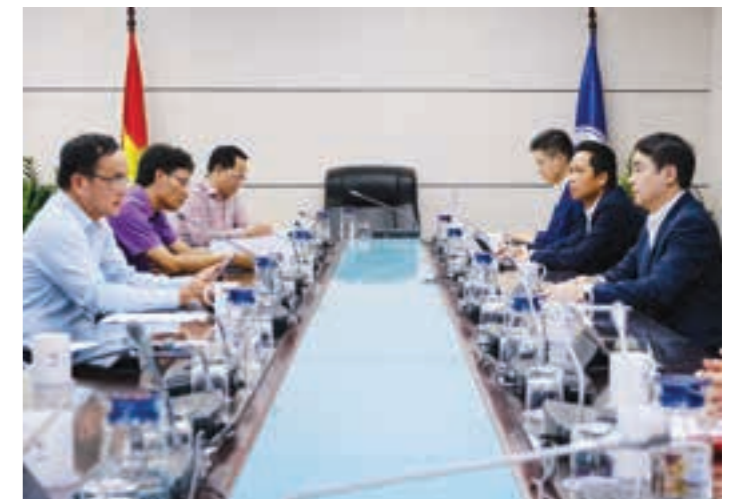
Buổi làm việc giữa Ban Lãnh đạo Vietcombank và Ban Lãnh đạo Tập đoàn Điện lực Việt Nam

Trong năm 2020, Vietcombank đã thực hiện 5 đợt giảm lãi suất cho vay gồm 4 đợt hỗ trợ doanh nghiệp và người dân bị ảnh hưởng do đại dịch COVID-19 và 1 đợt hỗ trợ doanh nghiệp và người dân tại 10 tỉnh miền Trung bị ảnh hưởng bão lũ để chia sẻ khó khăn với khách hàng với tổng số tiền lãi hỗ trợ lên đến 3.700 tỷ đồng.