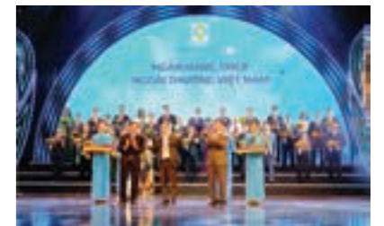
Vietcombank 7 lần liên tiếp được vinh danh Thương hiệu Quốc gia – Chương trình duy nhất của Chính phủ giao Bộ Công Thương chủ trì thực hiện nhằm quảng bá thương hiệu, hình ảnh quốc gia thông qua các thương hiệu sản phẩm, dịch vụ