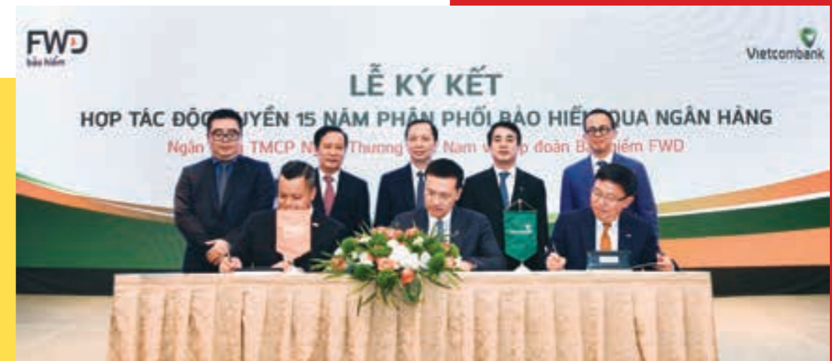
Tháng 11/2019, Vietcombank và Tập đoàn Bảo hiểm FWD chính thức ký kết thỏa thuận hợp tác độc quyền phân phối bảo hiểm thời hạn 15 năm