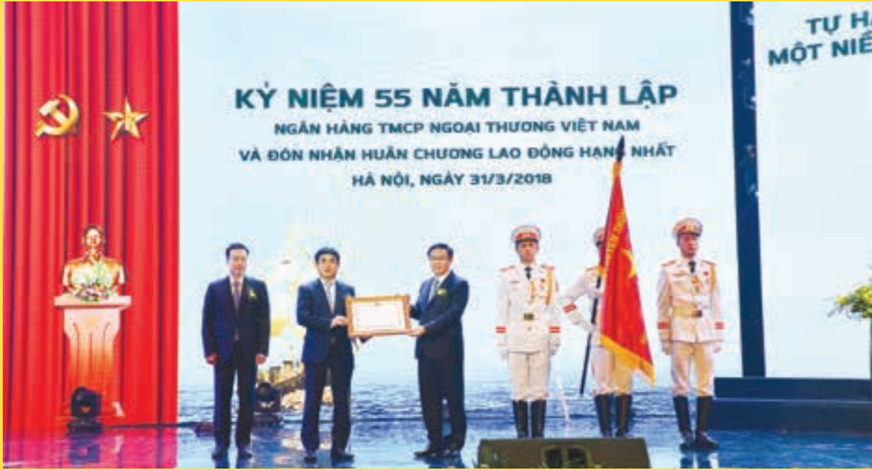
Vietcombank vinh dự đón nhận Huân chương Lao động hạng Nhất nhân dịp kỷ niệm 55 năm ngày thành lập