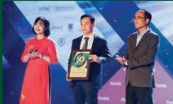
Vietcombank tăng mạnh thứ hạng so với năm 2018 và lọt Top 1.000 tại Bảng xếp hạng "The World's Largest Public Companies 2020" của Forbes. (Nguồn: Forbes)

Tạp chí Forbes Việt Nam đánh giá: Năm 2020, Vietcombank xếp hạng thứ 937, thứ hạng cao nhất từ trước tới nay, trong danh sách Global 2.000 (2.000 công ty lớn nhất thế giới) - danh sách xếp hạng dựa trên doanh thu, lợi nhuận, vốn hóa và tài sản. Việt Nam có 4 doanh nghiệp nằm trong danh sách với 3 ngân hàng trong đó Vietcombank ở vị trí dẫn đầu.