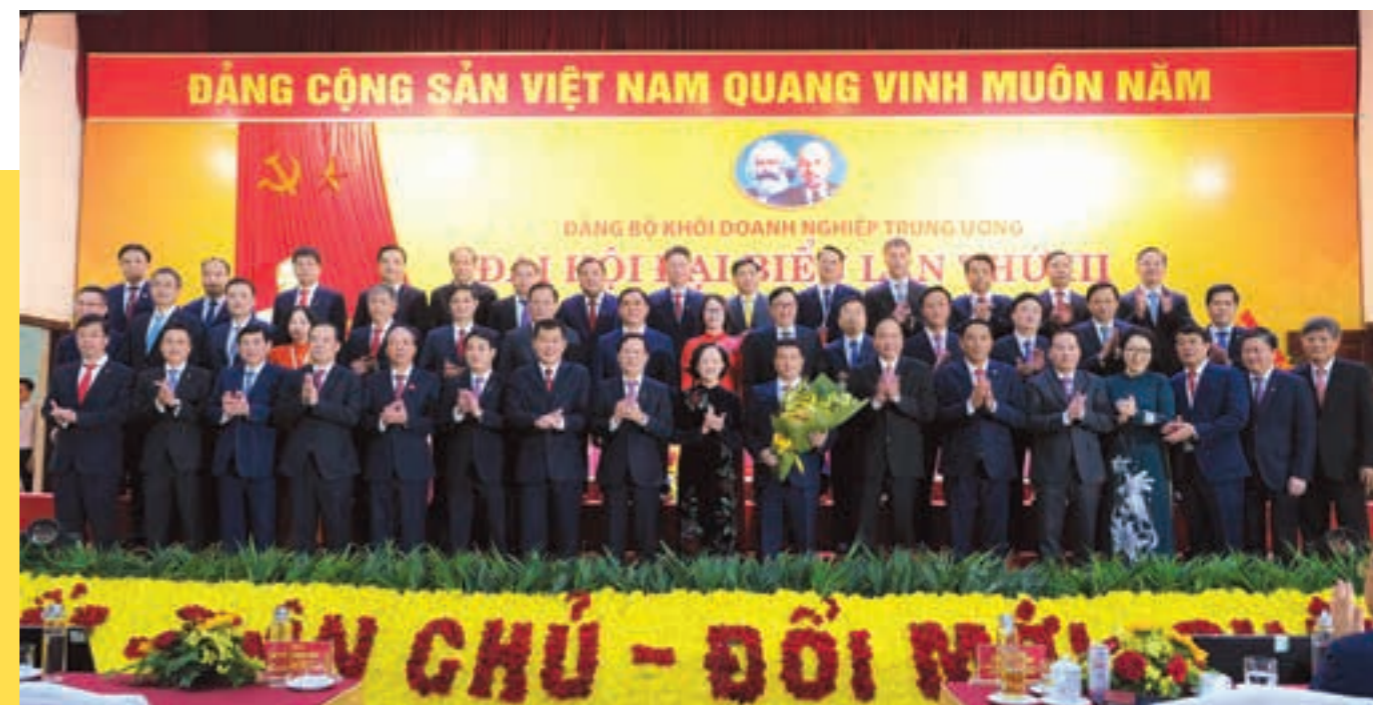
Đ/c Trương Thị Mai - Ủy viên Bộ Chính trị, Bí thư Trung ương Đảng, Trưởng Ban Dân vận Trung ương (hàng đầu, thứ 9 từ trái sang) chúc mừng Ban chấp hành Đảng bộ Khối DNTW nhiệm kỳ 2020-2025

Những thành quả đạt được của Đảng bộ Vietcombank trong nhiệm kỳ 2015-2020 cũng như thành công của Đại hội đại biểu Đảng bộ Vietcombank nhiệm kỳ 2020-2025 là kết tinh của những định hướng chiến lược đồng bộ, nhất quán, sự nỗ lực, bản lĩnh, trí tuệ và đoàn kết đồng lòng của các cấp lãnh đạo đến toàn thể đảng viên và CBNV toàn hệ thống; là sự đồng hành, hợp tác của hàng triệu Quý khách hàng, hàng vạn Quý cổ đông tin tưởng, gắn bó với Vietcombank.