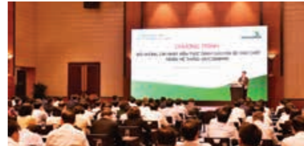
Lần đầu tiên Vietcombank tổ chức lớp bồi dưỡng, cập nhật kiến thức dành cho cán bộ chủ chốt trong hệ thống

Năm 2020, Vietcombank lần đầu tiên triển khai tổ chức chương trình “Bồi dưỡng, cập nhật kiến thức dành cho cán bộ chủ chốt trong hệ thống Vietcombank” với quy mô hơn 200 học viên là cán bộ chủ chốt, bao gồm các thành viên Ban Lãnh đạo,