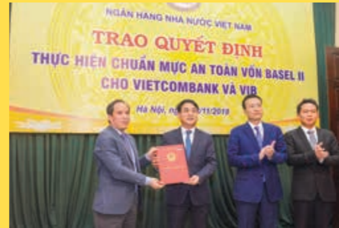
Vietcombank là ngân hàng đầu tiên tại Việt Nam đáp ứng các chuẩn mực an toàn theo Basel II

Ngày 28/11/2018, Vietcombank đã chính thức được Thống đốc NHNN Việt Nam phê duyệt, là ngân hàng đầu tiên tại Việt Nam đáp ứng các chuẩn mực an toàn theo Basel II, được áp dụng Thông tư 41 sớm 01 năm so với yêu cầu.