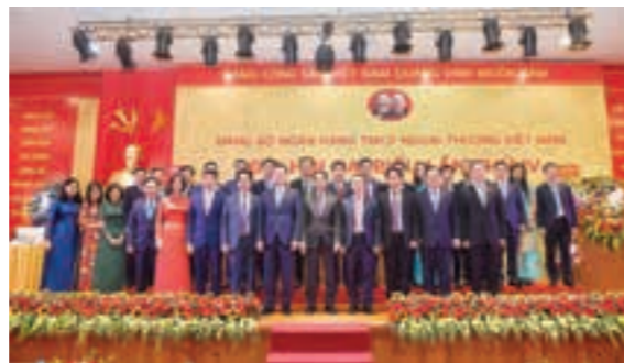
Ban chấp hành Đảng bộ Vietcombank nhiệm kỳ 2020-2025

Tại Đại hội Đảng bộ Khối DNTW lần thứ III, nhiệm kỳ 2020-2025, Chủ tịch HĐQT Vietcombank đã tái đắc cử Ban Thường vụ Đảng ủy Khối nhiệm kỳ 2020-2025 và được bầu vào Đoàn đại biểu tham dự Đại hội đại biểu toàn quốc lần thứ XIII của Đảng với số phiếu tín nhiệm cao. Vietcombank cũng là đơn vị duy nhất trong Đảng bộ Khối có Chủ tịch HĐQT và Tổng Giám đốc trúng cử Ban chấp hành Đảng bộ Khối nhiệm kỳ 2020-2025.