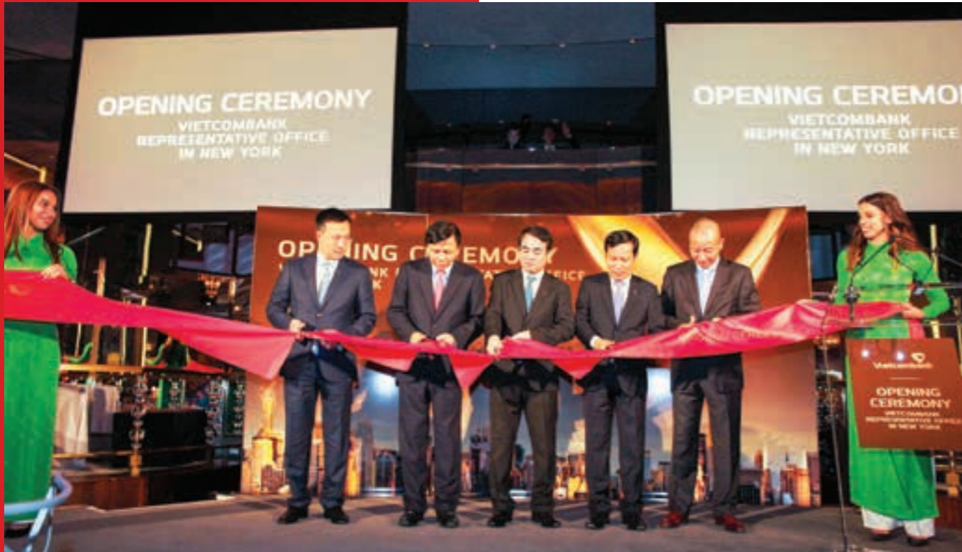
Vietcombank là ngân hàng Việt Nam đầu tiên vượt qua được những điều kiện khắt khe để hiện diện tại thị trường Mỹ

Vietcombank trở thành ngân hàng Việt Nam đầu tiên vượt qua được những điều kiện khắt khe để hiện diện tại thị trường Mỹ với việc khai trương hoạt động Văn phòng đại diện tại New York theo sự phê chuẩn của Cục Dự trữ Liên bang Mỹ.