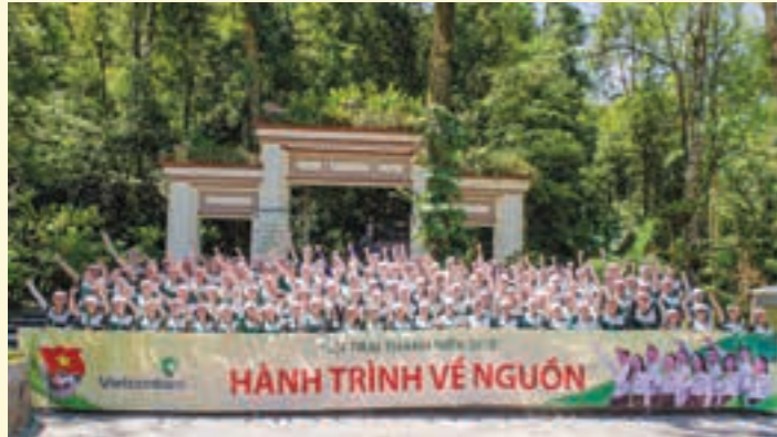
Ban Lãnh đạo và đồng đạo ĐVTN tham dự Hành trình về nguồn