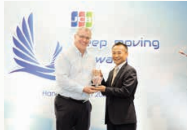
Đại diện Vietcombank nhận giải từ Ban Tổ chức

Năm 2019, Vietcombank ra mắt thẻ tín dụng quốc tế Visa Signature dành cho Khách hàng ưu tiên Vietcombank Priority, giúp tăng cường sự kết nối với các khách hàng cao cấp. The Asian Banker đánh giá cao thẻ Vietcombank Visa Signature ở kết quả ấn tượng trong cả mảng phát hành và sử dụng thẻ.