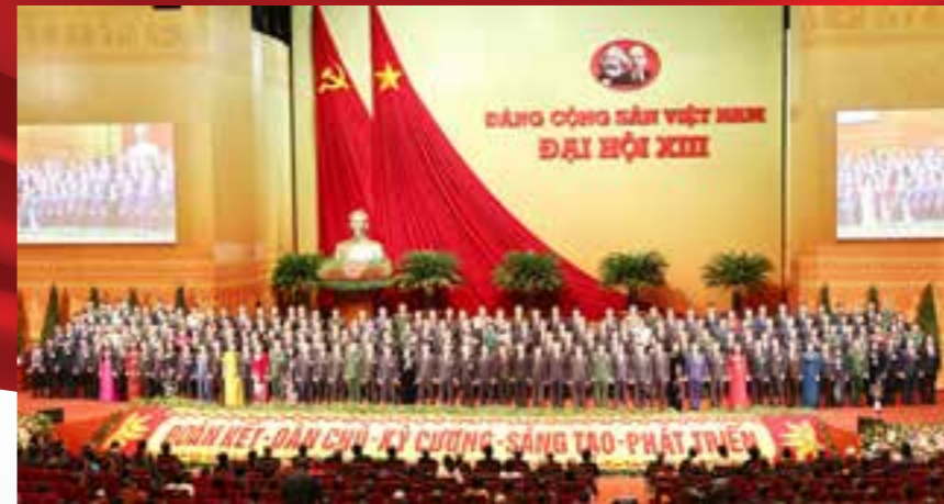
Ban Chấp hành Trung ương ra mắt Đại hội XIII Đảng Cộng sản Việt Nam

Từ cuối năm 2012, Vietcombank đã là ngân hàng đầu tiên trên thị trường cung cấp dịch vụ Mobile banking phiên bản ứng dụng (App) với thương hiệu VCB-Mobile B@nking - được ví như một ngân hàng thu nhỏ trên điện thoại. Đến nay, VCB-Mobile B@nking tiếp tục là ứng dụng ngân hàng di động được yêu thích, tin dùng hàng đầu tại Việt Nam.