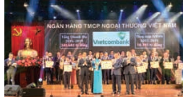
Với hiệu quả kinh doanh vượt trội, Vietcombank tiếp tục duy trì vị thế là doanh nghiệp có quy mô nộp ngân sách Nhà nước lớn nhất

Vượt qua nhiều khó khăn, thách thức, hoạt động kinh doanh của Vietcombank vẫn đảm bảo an toàn, hiệu quả và trở thành điểm sáng trong toàn ngành ngân hàng. Ngoài tăng trưởng tín dụng tốt song vẫn bảo đảm được chất lượng tín dụng, tỷ lệ nợ xấu thấp thì các mặt hoạt động khác vẫn duy trì được đà tăng trưởng: