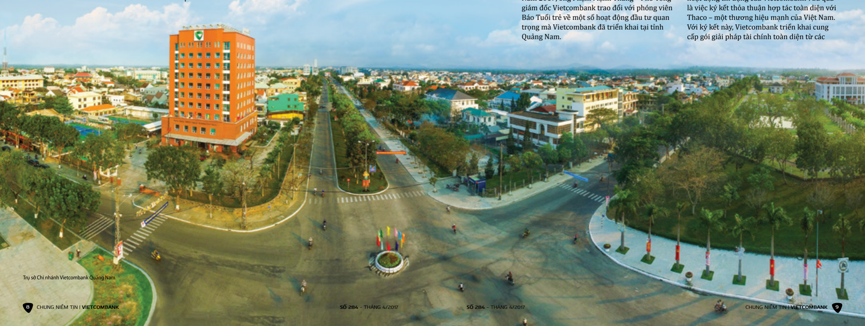
Trụ sở Chi nhánh Vietcombank Quảng Nam

Trong đó, một sự kiện quan trọng trong hoạt động tín dụng của Vietcombank vừa qua là việc ký kết thỏa thuận hợp tác toàn diện với Thaco – một thương hiệu mạnh của Việt Nam. Với ký kết này, Vietcombank triển khai cung cấp gói giải pháp tài chính toàn diện từ các