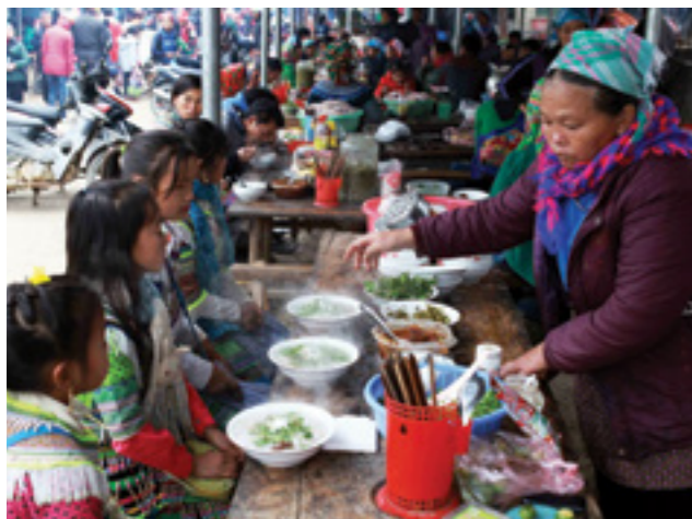
Thưởng thức món phở của đồng bào Mông tại chợ Si Ma Cai

CHỢ PHIÊN SI MA CAI Ở TRUNG TÂM HUYỆN SI MA CAI, TỈNH LÀO CAI ĐƯỢC HỢP VÀO CHỦ NHẬT HÀNG TUẦN. NGƯỜI MÔNG Ở SI MA CAI VẪN CÒN GIỮ NÉT HỒN HẬU, CHÂN CHẤT CỦA NGƯỜI VÙNG NÚI. CHỢ PHIÊN VÌ THẾ CŨNG CHƯA BỊ "THƯƠNG MẠI HÓA" NHƯ Ở THỊ TRẤN DU LỊCH SAPA.