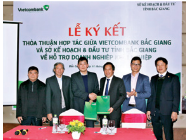
Đại diện Sở Kế hoạch và Đầu tư tỉnh Bắc Giang và Đại diện Vietcombank Bắc Giang (thứ 3 từ phải sang) ký kết thỏa thuận hợp tác hỗ trợ doanh nghiệp khởi nghiệp

ngiệp. Theo đó, các doanh nghiệp khởi nghiệp có thể vay vốn ngắn hạn tại Vietcombank với lãi suất chỉ từ 7%/năm, vay vốn trung dài hạn với lãi suất chỉ từ 8%/năm. Thủ tục vay vốn, giải ngân nhanh chóng, thuận tiện.