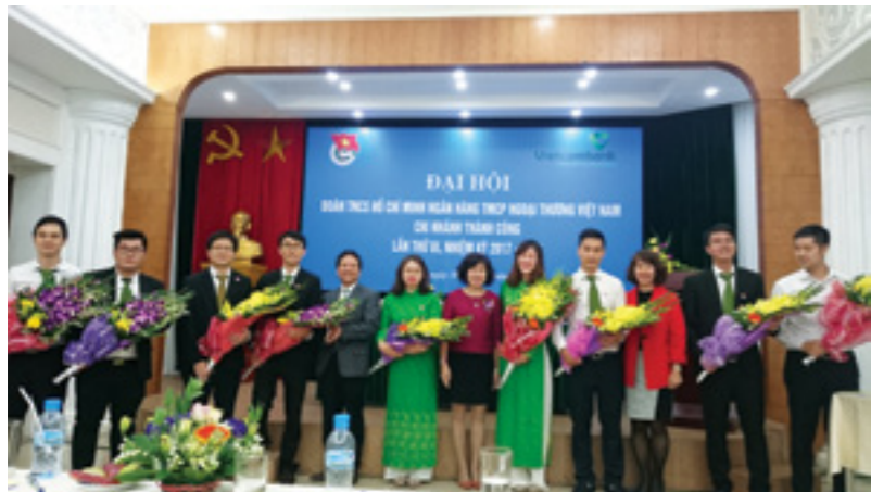
Ban Giám đốc Vietcombank Thành Công tặng hoa chúc mừng các đ/c trúng cử Ban Chấp hành Đoàn cơ sở Vietcombank Thành Công khóa III nhiệm kỳ 2017-2019