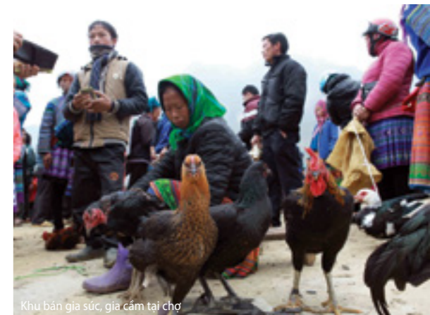
Khu bán gia súc, gia cầm tại chợ