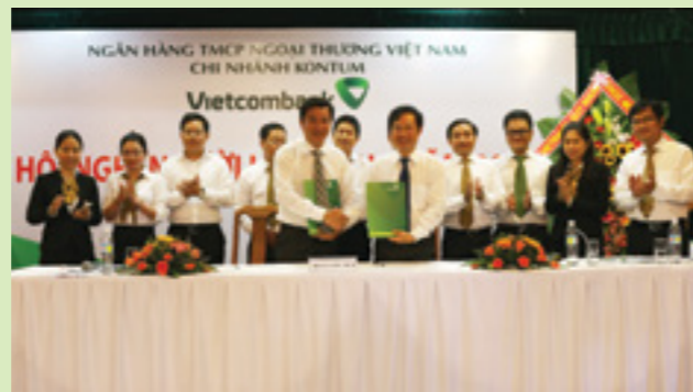
Đại diện Người lao động và Người sử dụng lao động ký kết Thỏa ước lao động tập thể năm 2017