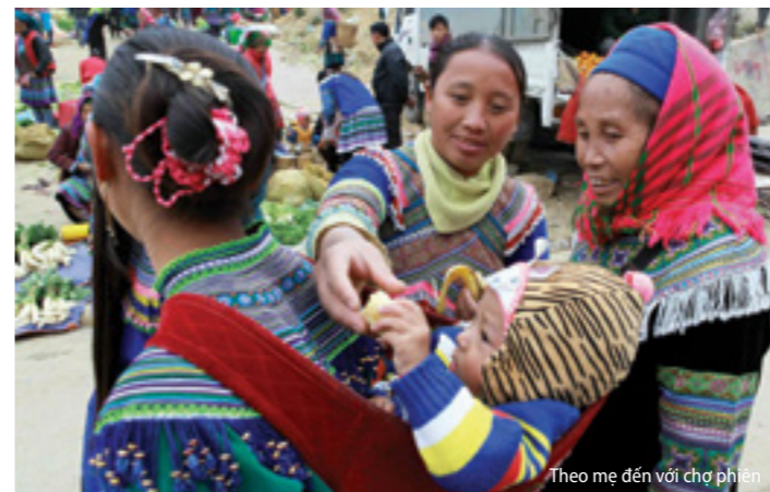
Theo mẹ đến với chợ phiên