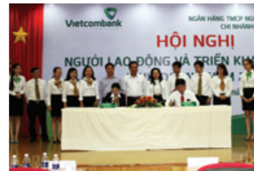
Lễ ký thỏa ước lao động tập thể của Vietcombank Kiên Giang