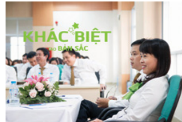
Sự quan tâm hứng khởi của người lao động đối với các giải pháp, ý kiến nhằm hoàn thành kế hoạch kinh doanh 2017.