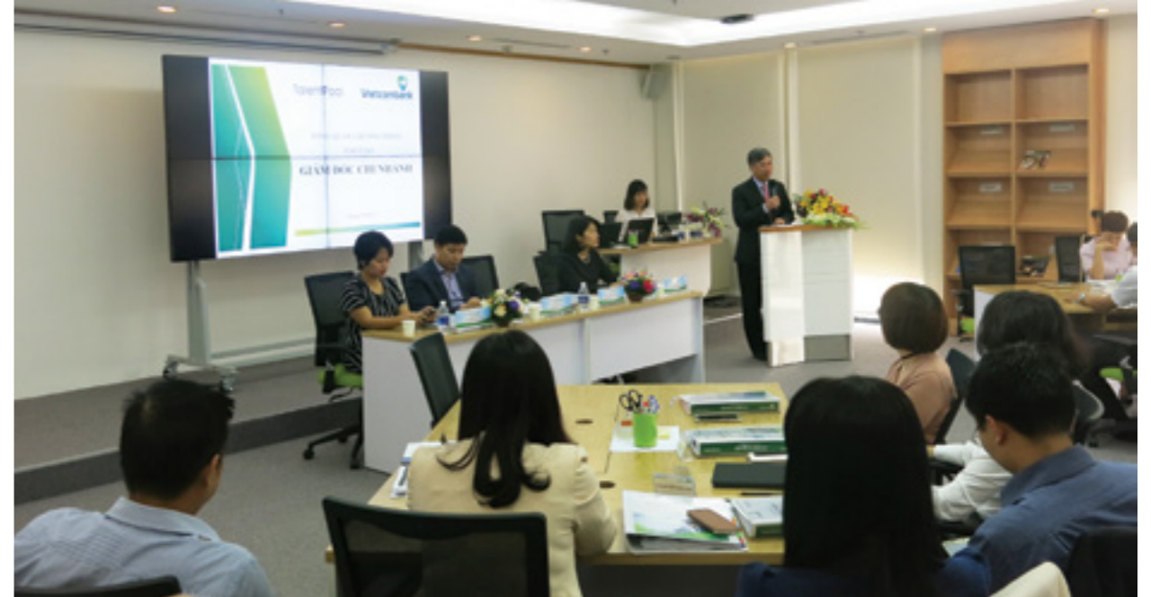
Toàn cảnh Lễ khai giảng