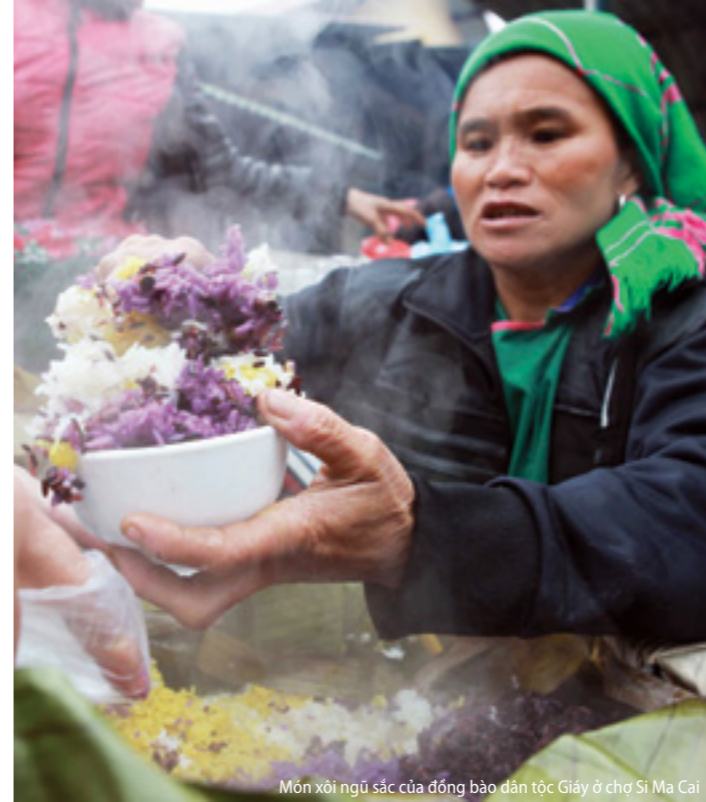
Món xôi ngũ sắc của đồng bào dân tộc Giáy ở chợ Si Ma Cai