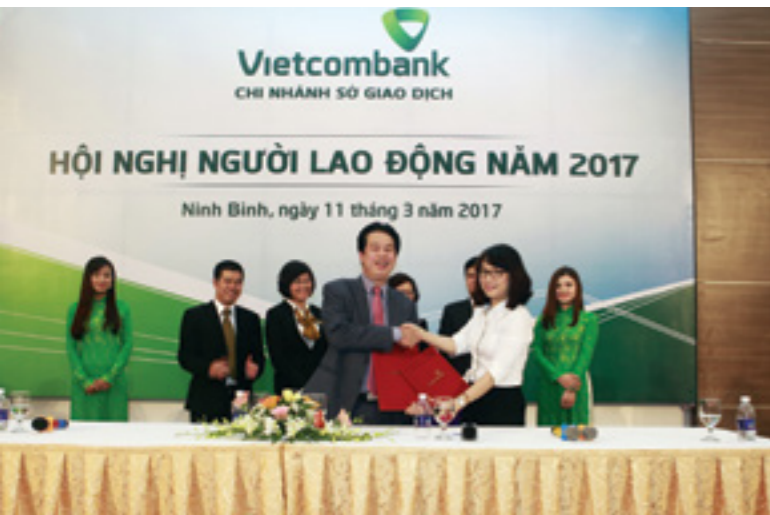
Lễ ký Giao ước thực hiện chỉ tiêu kế hoạch năm 2017

biệt, bài tham luận của phòng Khách hàng thể nhân với nội dung "Cho vay MNDA - Một trong những định hướng kinh doanh đem lại Tăng Trưởng Tốt, Hiệu Quả Cao cho tín dụng thể nhân" đã để lại ấn tượng nổi bật tại Hội nghị với nội dung sâu sắc, nhiều cảm xúc.