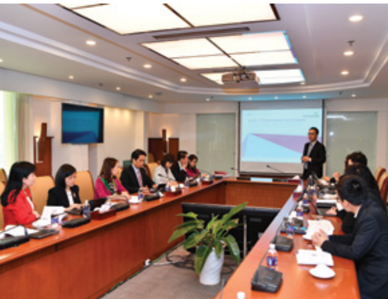
Quang cảnh buổi Lễ

Lễ khởi động sáng kiến về nâng cao quản trị, tổ chức và giám sát rủi ro thuộc chương trình Basel II: