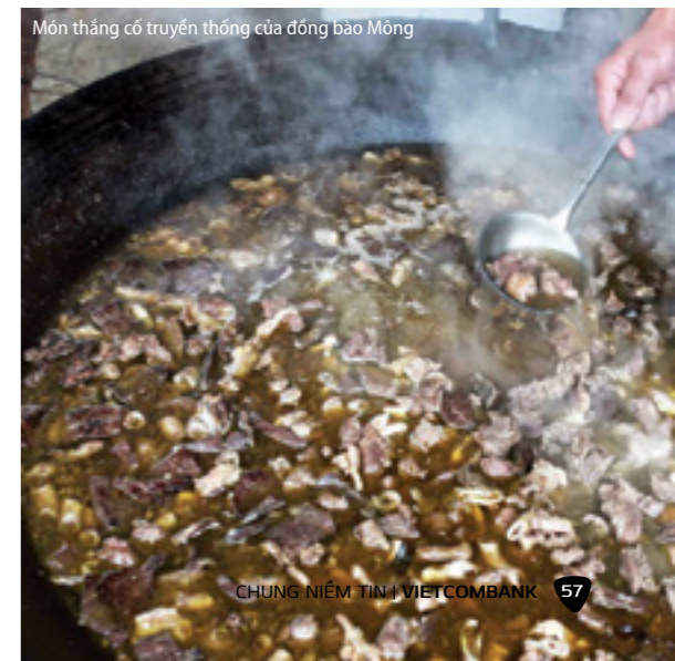
Món thắng cố truyền thống của đồng bào Mông