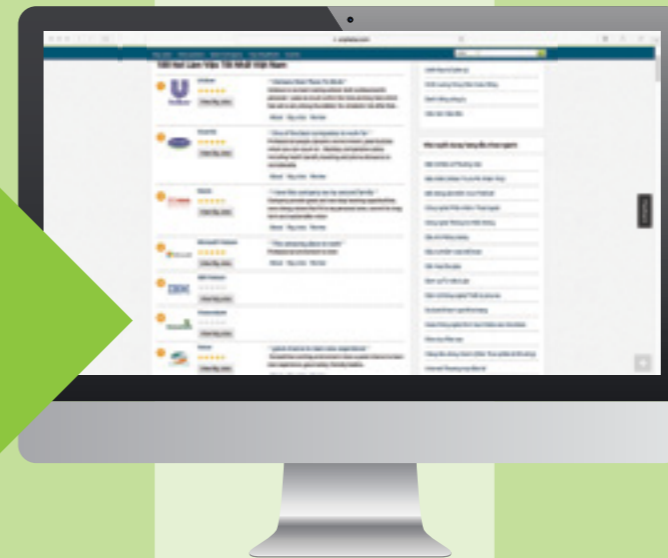
Danh sách bình chọn 100 nơi làm việc tốt nhất Việt Nam 2016 do Anphabe và Nielsen công bố ngày 22/03/2017.

NĂM 2016, VIETCOMBANK ĐÃ TĂNG MẠNH THÊM 5 BẬC SO VỚI NĂM 2015, TRỞ THÀNH NGÂN HÀNG DUY NHẤT CÓ MẶT TRONG TOP 10 VÀ TIẾP TỤC DẪN ĐẦU DANH SÁCH TRONG KHỐI NGÂN HÀNG (BAO GỒM CẢ NGÂN HÀNG NỘI LẤN NGÂN HÀNG NGOẠI).