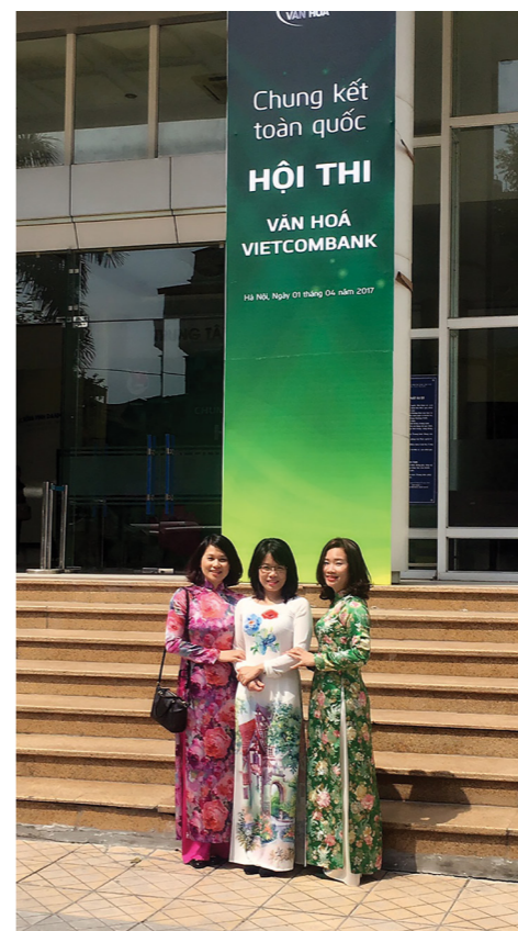
Các nữ Giám khảo Chung kết Hội thi Văn hóa Vietcombank

Hội thi do Đoàn Thanh niên khởi xướng đã bước đến vòng Chung kết toàn quốc sau 5 năm triển khai thực hiện. 6 đội thi xuất sắc nhất đại diện các khu vực đã được chọn và tiếp tục tranh tài. Những tất bật lo lắng, tâm huyết, tình cảm nhớ nhung, tiếc nuối của chúng tôi dành cho một hành trình sắp tạm chia tay sẽ dồn cả vào đêm Chung kết. Chắc chắn, sẽ là một đêm Chung kết đậm sắc màu Văn hóa, Cảm xúc của Vietcombank.