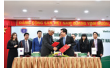
Đại diện Vietcombank Tây Hồ và đại diện Bệnh viện Hữu Nghị ký kết thỏa thuận hợp tác