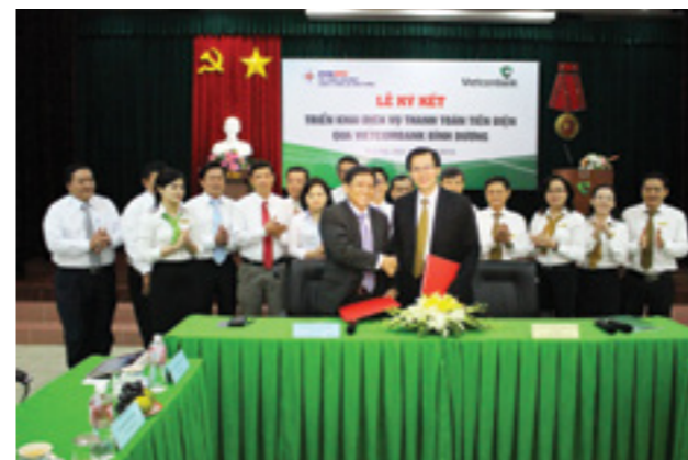
Vietcombank Bình Dương ký kết hợp tác triển khai dịch vụ thanh toán tiền điện với Điện lực tỉnh Bình Dương.

Năm 2017, trong bối cảnh nền kinh tế vẫn còn nhiều khó khăn, thách thức cùng sự cạnh tranh khá gay gắt giữa các Tổ chức tín dụng trên địa bàn, mặc dù con đường phía trước còn nhiều chông gai nhưng với nền tảng hiện có, Vietcombank Bình Dương vẫn luôn tự tin sải bước và sẽ nỗ lực cao nhất để đạt được kết quả tốt nhất như kỳ vọng của Ban Lãnh đạo Vietcombank.