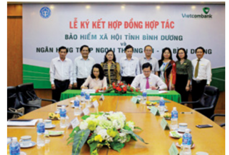
Vietcombank Bình Dương ký kết hợp đồng hợp tác với Bảo hiểm xã hội tỉnh Bình Dương.

Hiện nay, Vietcombank đang có nhiều chương trình ưu đãi về lãi suất, phí, cơ chế tỷ giá cạnh tranh, linh hoạt... là công cụ hữu hiệu để hỗ trợ cho Chi nhánh trong công tác phát triển khách hàng. Tuy nhiên, đây mới chỉ là điều kiện “CẦN”. Còn điều kiện “ĐỦ” chính là chất lượng và thái độ phục vụ khách hàng của mỗi cán bộ nhân viên Vietcombank. Thực tế đã minh chứng, có rất nhiều khách hàng đến với Chi nhánh không chỉ đơn thuần vì giá cả cạnh tranh mà trên hết là sự thấu hiểu, sự quan tâm chăm sóc và cảm nhận được tình cảm trân quý mà cán bộ nhân viên Chi nhánh Bình Dương mang lại.