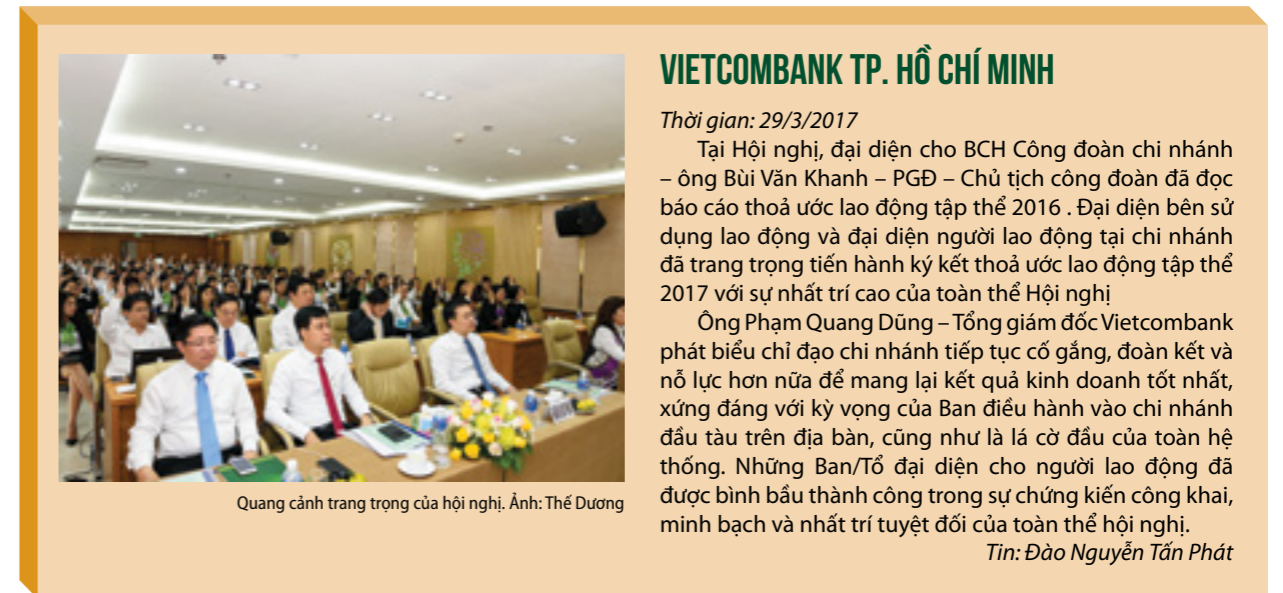
Quang cảnh trang trọng của hội nghị.