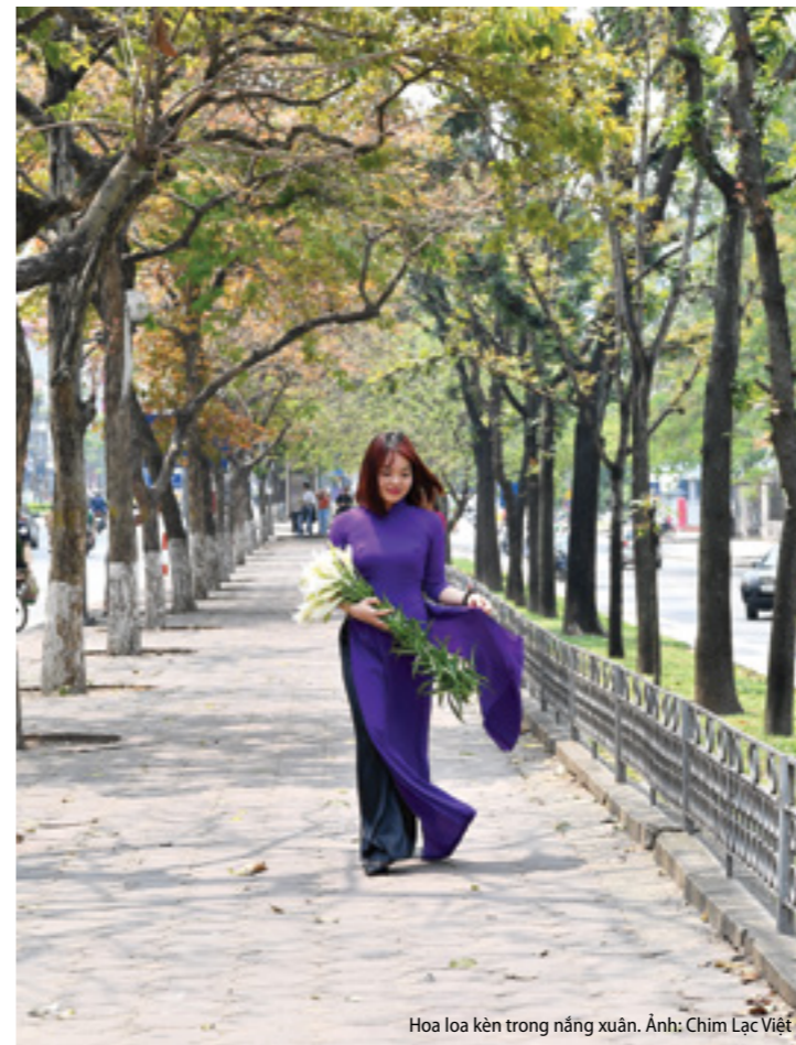
Hoa loa kèn trong nắng xuân.

Hoa loa kèn cuốn hút từ những gánh hàng hoa thông thả trên phố mà chả cần mời chào nhiều, bởi ai cũng tranh thủ chơi hoa trong quãng thời gian ngắn ngủi chừng mấy chục ngày. Bận rộn gì mà lỡ mất mùa loa kèn thì tiếc lắm. Hoa loa kèn thân cao, có những lá xanh nhỏ dài, hoa theo chùm chìa ra các hướng, Lúc chưa nở thì chụm cánh, khi nở bung ra không khác thì cái loa kèn và mùi hương thơm ngát. Hẳn rồi, hoa loa kèn mà!