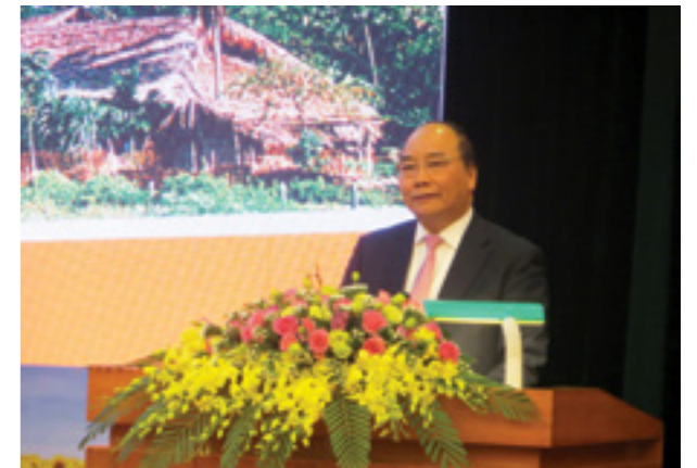
Thủ tướng Nguyễn Xuân Phúc phát biểu chỉ đạo Hội nghị

Tại Hội nghị, tỉnh Tuyên Quang đã trao quyết định chủ trương đầu tư cho 6 nhà đầu tư với tổng số vốn đăng ký là 3.691 tỷ đồng. Cùng với đó, tỉnh cũng ký cam kết thỏa thuận đầu tư với một số doanh nghiệp khác với trị giá hơn 18.289 tỷ đồng.