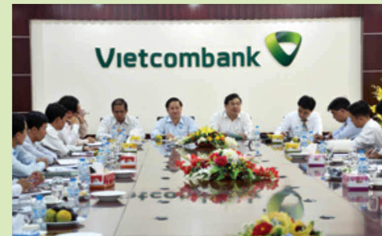
Quang cảnh buổi làm việc