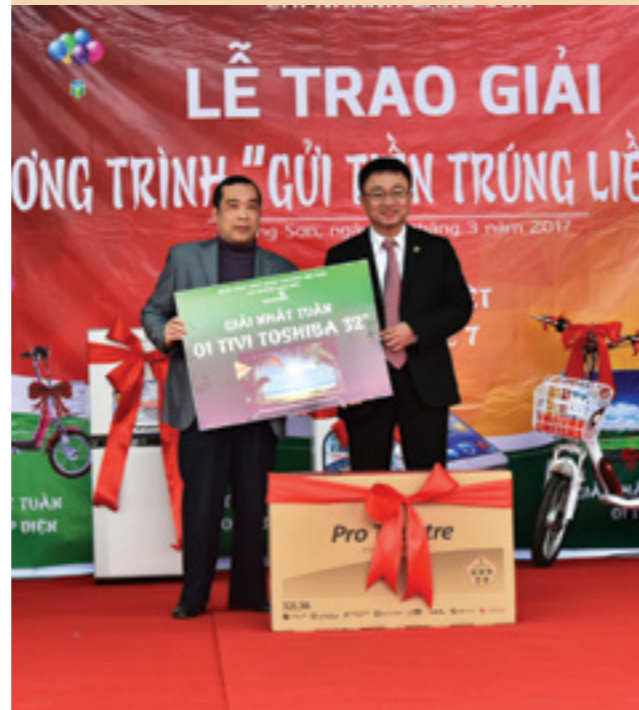
Giám đốc Vietcombank Lạng Sơn (bên phải) trao giải cho khách hàng trúng thưởng

Phòng giao dịch Pacific Place – Chi nhánh Vietcombank Ba Đình Địa chỉ: Tòa nhà Pacific, 83B Lý Thường Kiệt, Hà Nội ĐT: 04.39369040; Fax: 04.39369041