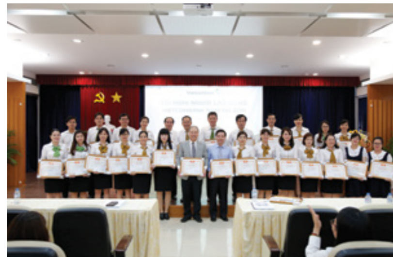
Ban Giám đốc chụp hình cùng các cán bộ đạt thành tích cao trong phong trào thi đua năm 2017

Cuối cùng, lễ ký "Giao ước thực hiện chỉ tiêu kế hoạch được giao năm 2017" đã trang trọng