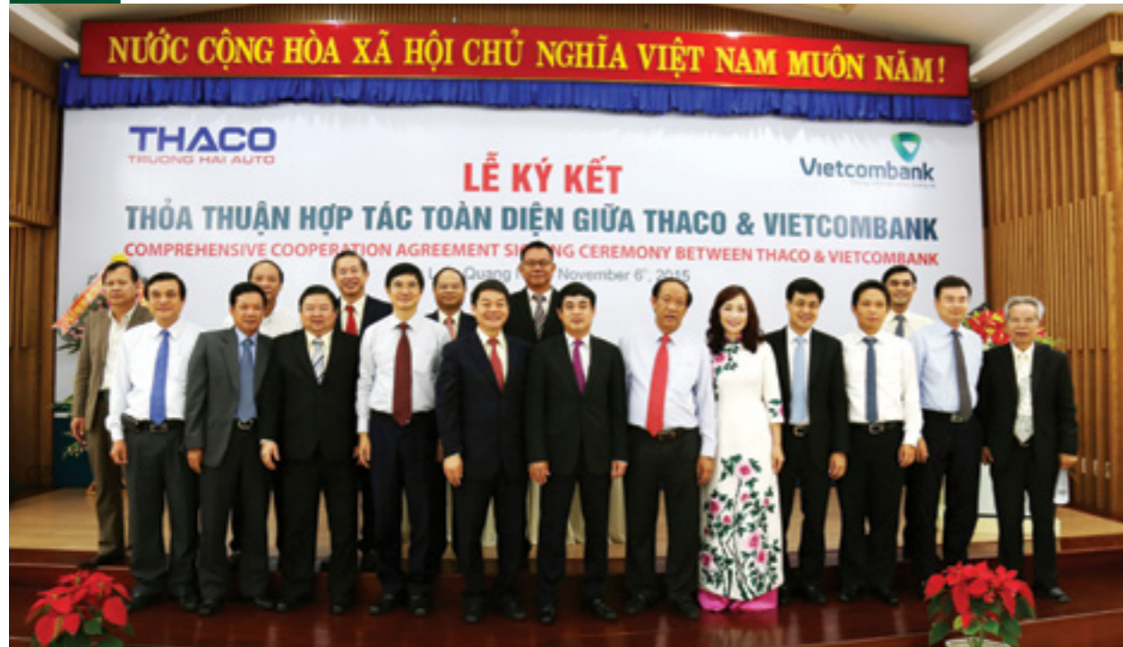
Vietcombank ký kết thỏa thuận hợp tác toàn diện với Thaco

dịch vụ ngân hàng bán buôn cho đến các dịch vụ cho vay tài chính cá nhân để thực hiện mua ô tô, thanh toán lương, thế... với nhiều ưu đãi vượt trội. Giá trị gói cấp tín dụng là 10.000 tỷ đồng nhằm bổ sung vốn để thực hiện các dự án, phương án kinh doanh cho Thaco và các công ty con.