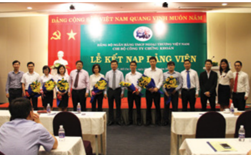
Đại diện lãnh đạo Vietcombank và VCBS chụp ảnh lưu niệm cùng những đồng chí chuyển Đảng chính thức và kết nạp mới tại buổi lễ

Thực hiện kế hoạch phát triển đảng viên của Chi bộ, ngày 25/2/2017 tại TP. Hồ Chí Minh, Chi bộ cơ sở Công ty TNHH Chứng khoán Ngân hàng Vietcombank (VCBS) phối hợp với Ban tổ chức Hội nghị Người lao động Công ty đã long trọng tổ chức Lễ công nhận đảng viên chính thức và Lễ kết nạp đảng viên mới.