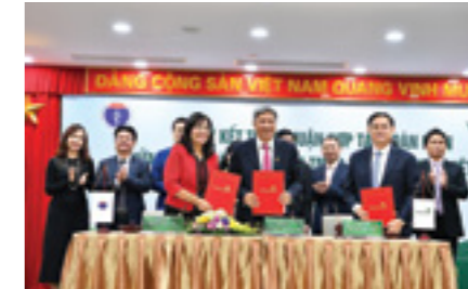
Đại diện Vietcombank Sài Thành, Vietcombank TP Hồ Chí Minh và đại diện Bệnh viện Chợ Rẫy ký kết thỏa thuận hợp tác

Phát biểu tại lễ ký kết, ông Nghiêm Xuân Thành - Chủ tịch HĐQT Vietcombank cho biết: Trong những năm vừa qua, Vietcombank đã dành trên 1.000 tỷ đồng đầu tư vào các cơ sở y tế trên cả nước, đặc biệt là vào các trang thiết bị hiện đại để phục vụ nhân dân. Cũng theo Chủ tịch Nghiêm Xuân Thành, các chi nhánh trong hệ thống Vietcombank đã chủ động tiếp cận hệ thống các bệnh viện để đầu tư vào việc xây dựng cơ sở y tế, trang thiết bị.