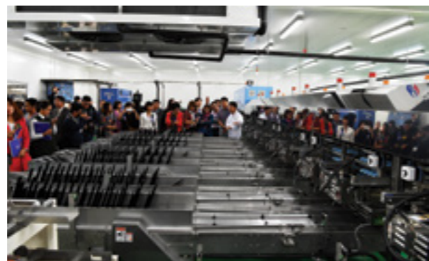
Các đại biểu tham quan dây chuyền Nhà máy sản xuất trứng gà sạch ĐTK Phú Thọ