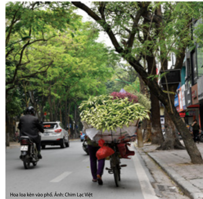
Hoa loa kèn vào phố.

Khi những chiếc xe đạp chở hoa loa kèn vào phố cũng là lúc những hàng sấu của Hà Nội trút lá và rải cả những bông hoa li ti màu vàng trắng.