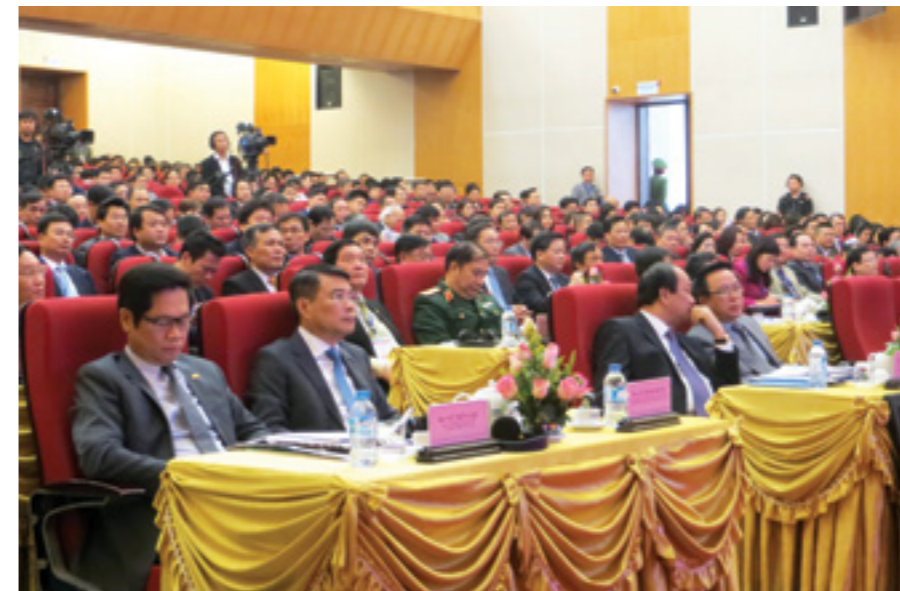
Hội nghị thu hút sự quan tâm của các nhà đầu tư

gốc. Vietcombank luôn nỗ lực để đem lại những giá trị thiết thực, lâu dài trong các lĩnh vực phát triển, chăm sóc cộng đồng nhằm góp phần nâng cao chất lượng đời sống dân nghèo. Đó cũng chính là thông điệp và cũng là cam kết "Chung niềm tin vững tương lai" mà Vietcombank muốn gửi gắm tới cộng đồng với hy vọng có thể đóng góp một phần sức lực của mình vào sự phát triển kinh tế, xã hội và an sinh xã hội tại địa bàn tỉnh Tuyên Quang nói riêng và cả nước nói chung.