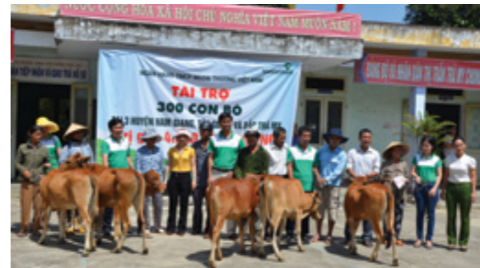
Vietcombank Quảng Nam tặng bò giống cho hộ nghèo các huyện Tây Giang, Nam Giang và Bắc Trà My (thuộc tỉnh Quảng Nam)

tỉnh Quảng Nam sẽ thu hút thêm nhiều dự án lớn, thúc đẩy sự phát triển ngành công nghiệp và dịch vụ phụ trợ, đáp ứng nhu cầu phát triển Kinh tế - Xã hội tỉnh Quảng Nam trong tương lai.