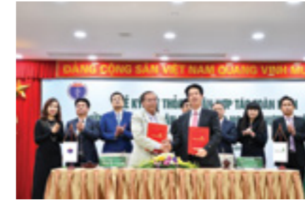
Đại diện Vietcombank Sở giao dịch và đại diện Bệnh viện Thanh Nhân ký kết thỏa thuận hợp tác