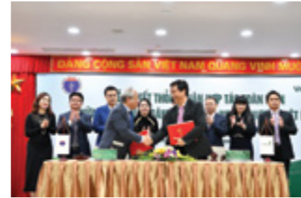
Đại diện Vietcombank Nam Hà Nội và đại diện Bệnh viện Nhi TW ký kết thỏa thuận hợp tác

Với tổng giá trị cho vay 30.000 tỷ VNĐ đến hết năm 2019, chương trình tín dụng phát triển ngành Y tế của Vietcombank được thực hiện để cung ứng vốn trung dài hạn. Với thời hạn vay lên tới 20 năm, chương trình áp dụng mức lãi suất ưu đãi cho các bệnh viện và cơ sở khám chữa bệnh. Gói tín dụng này ưu tiên các dự án: đầu tư trang thiết bị y tế hiện đại, nhập khẩu các máy móc/thiết bị y tế tiên tiến phục vụ khám chữa bệnh chuyên khoa/cao cấp nhằm nâng cao chất lượng khám chữa bệnh, đáp ứng nhu cầu chăm sóc sức khỏe của người dân và đầu tư mới, cải tạo mở rộng cũng như hiện đại hóa cơ sở khám chữa bệnh với mục tiêu giảm tải cho các bệnh viện có công suất sử dụng giường bệnh quá cao tại tuyến Trung ương và các bệnh viện tuyến dưới.