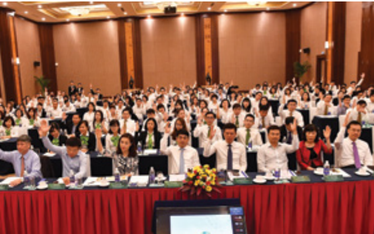
Hội nghị NLĐ Vietcombank TSC năm 2017 quyết tâm thực hiện tốt các nhiệm vụ đề ra

N gày 18/3/2017, tại thành phố Nha Trang, tỉnh Khánh Hòa, Trụ sở chính (TSC) Vietcombank đã tổ chức Hội nghị đại biểu Người lao động (NLĐ) năm 2017.