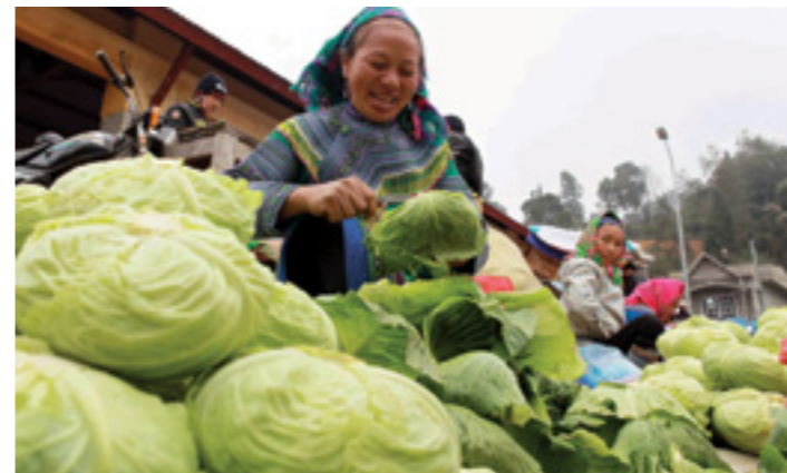
Khu bán rau xanh tại chợ Si Ma Cai