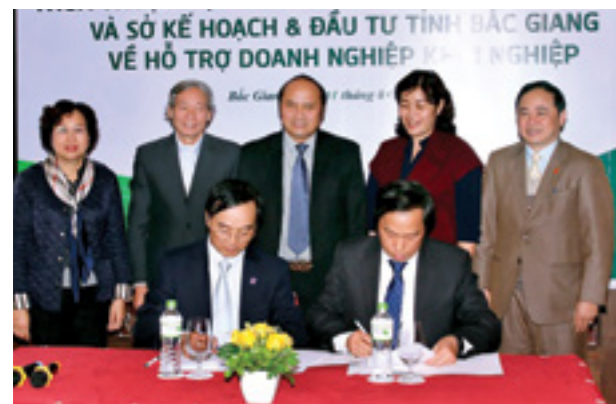
Giám đốc Vietcombank Bắc Giang (hàng đầu bên phải) ký kết các khung thỏa thuận hợp tác với Công ty TNHH Hòa Phú Invest

Mặt khác, Sở KH&ĐT giới thiệu các khách hàng mới thành lập, khách hàng có dự án đầu tư mới cho Vietcombank Bắc Giang, là cầu nối giúp cho doanh nghiệp và ngân hàng có thể hợp tác với nhau. Đặc biệt, điểm nổi bật trong thỏa thuận này là Vietcombank Bắc Giang mang đến gói vay vốn lãi suất ưu đãi với quy mô 1.000 tỷ đồng dành riêng cho các doanh nghiệp khởi